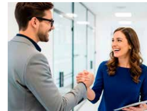
Hay una brecha de género de casi 30 puntos porcentuales en la participación laboral.

Esto representa una oportunidad para atender la alta demanda de talento tecnológico, al mismo tiempo que se impulsa la inclusión laboral de mujeres en empleos más competitivos.