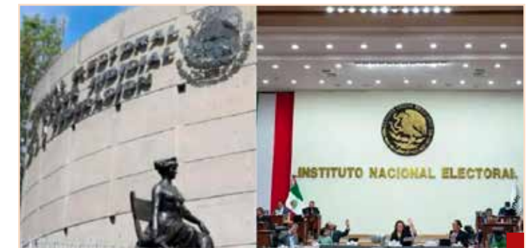
Crear el INE y el TEPJF no es poquita cosa.