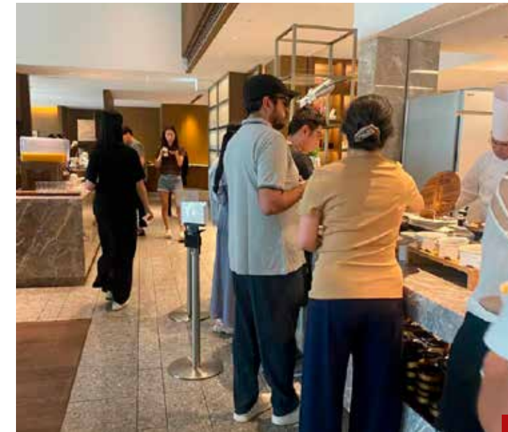
Andrés Manuel López Beltrán enfrentó fuertes críticas por sus gastos en el extranjero y viajes de lujo cuando desempeñaba la Secretaría de Organización en Morena.