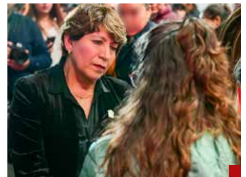
La maestra Delfina Gómez Álvarez, con alta calificación por casas encuestadoras, es reprobada por la población mexiquense.

Todavía tiene tiempo para un mejor desempeño, pues los mexiquenses que la favorecieron con su voto para terminar con el PRI aún están a la espera del cambio que prometió, pero eso implica sacudirse a esos colaboradores suyos, buenos para la política, pero pésimos para gobernar. Estaremos pendientes.