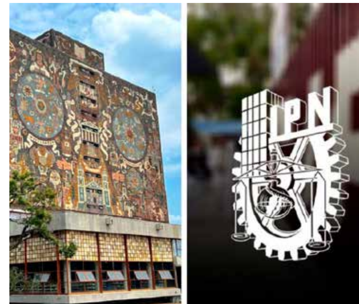
UNAM e IPN, institutos universales de gran calidad académica.

Si tiene tiempo revise este apretado resumen y se va a encontrar con que las instituciones creadas en México funcionaron y fueron de gran beneficio para nosotros los del gallardo peladaje y junto con eso, busque alguna de las grandes obras construidas, a ver si encuentra alguna inútil, que no sirva, que haya tenido enormes sobrecostos o se haya impedido su auditoría, no hay, ni una.