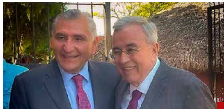
Adán Augusto López Hernández y Rubén Rocha Moya, los "hermanos" en serios aprietos por sus presuntas ligas con el crimen organizado.