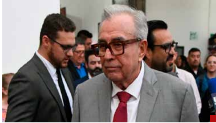
Rechazan las exigencias de EU sobre la detención de Rubén Rocha Moya.

Algunos de los personajes investigados por Estados Unidos no sólo son