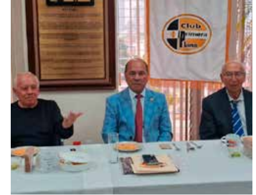
Con el arribo de la IA el futuro ya nos alcanzó: Club Primera Plana.

Para estimarlo, el IMCO proyectó tres escenarios para 2030 con distintas tasas de crecimiento en la incorporación de mujeres en este ámbito, manteniendo constante la tasa de