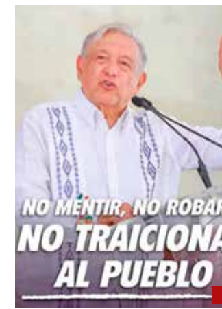
Los del partido guinda mandan al carajo el origen del movimiento: "No mentir, no robar y no traicionar".

El Estado de México se caracteriza por su