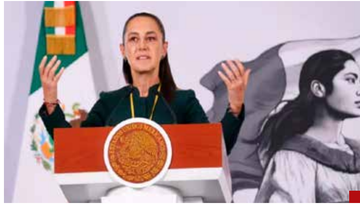
El cuestionamiento es un grito de batalla contra Morena, expresa la Primera Presidenta.

Sobre esto, Sheinbaum Pardo dice que los investigadores estadounidenses no han presentado pruebas que justifiquen su detención y que la exigencia implica una injerencia en los asuntos de México.