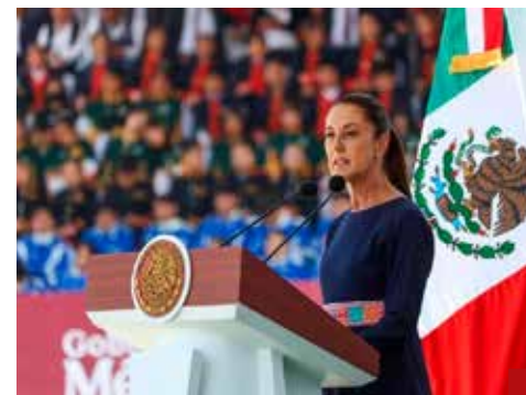
Claudia Sheinbaum Pardo enarbola la bandera de la soberanía nacional para que no se abran las investigaciones contra morenistas.

La administración de la maestra Delfina Gómez Álvarez, gobernadora del Estado de México, Delfina Gómez, genera opiniones encontradas entre la población.