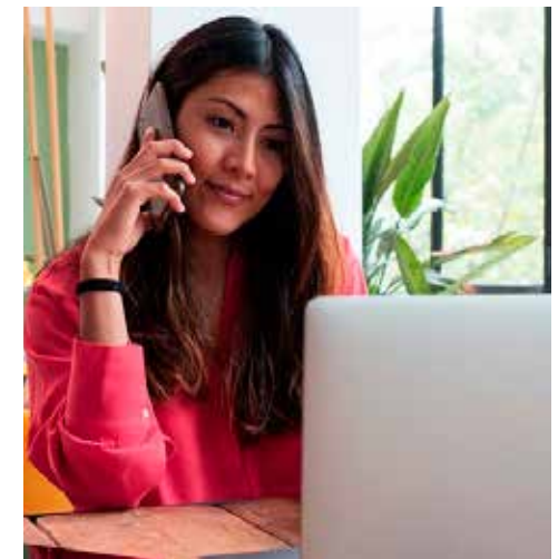
Las Tecnologías de la Información y la Comunicación impulsa la inclusión laboral de mujeres en empleos más competitivos.

crecimiento anual de los hombres (ver anexo metodológico):