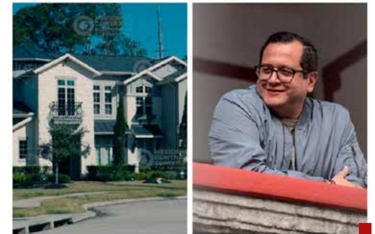
José Ramón López Beltrán estuvo en el ojo del huracán con el escándalo conocido como la "Casa Gris".