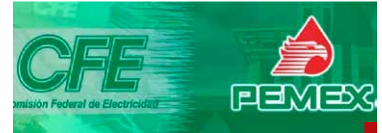
CFE y Pemex, creados en 1937 y 1938.

Presidenta, usted elija, la espera la historia: ¿gobernante o encubridora?