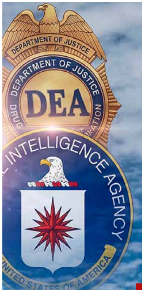
DEA y CIA filtran información para presionar.

miembros de su partido, sino también aliados cercanos de su predecesor y benefactor político, el expresidente Andrés Manuel López Obrador.