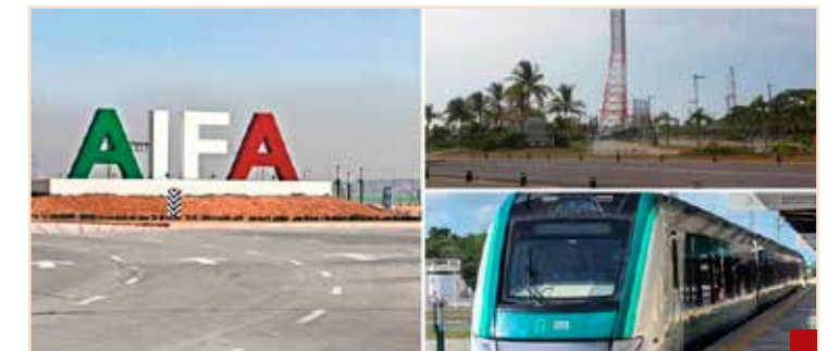
Tren Maya, Refinería Olmeca y el AIFA salieron en 1 billón 178 mil millones de pesos... y de los tres no se hace uno solo.