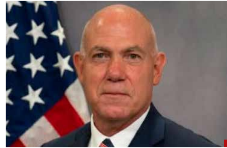
Aumenta la probabilidad de que autoridades estadounidenses estén preparando casos importantes: Derek Maltz, exadministrador interino de la DEA.

Adicionalmente se reseña en la publicación que “dos objetivos en las investigaciones por corrupción de Estados Unidos son los gobernadores de Morena de los estados de Sonora y Tamaulipas, Alfonso Durazo y Américo Villarreal Anaya, según cinco personas al tanto de las investigaciones que no estaban autorizadas a hablar de manera pública.