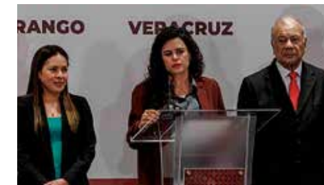
En 2025 ya se veía el debilitamiento de Morena al perder en Veracruz y Durango.