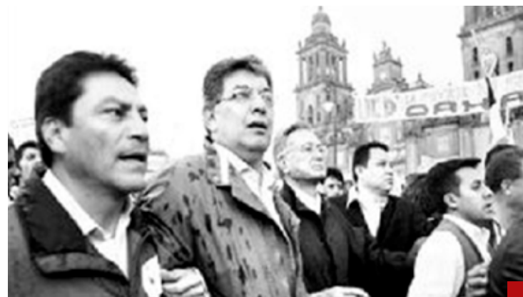
Manuel Bartlett y José Murat patrocinaban, encabezaban y manejaban a la CNTE.

del expresidente Andrés Manuel López Obrador, con lo que se devolvieron a la CNTE sus privilegios y permisos para continuar extorsionando y chantajeando, dejando sin clases a miles de niños y perjudicando la vida de millones de habitantes de ciudades como CDMX, Oaxaca, Tuxtla Gutiérrez, Morelia, Morelos y otras entidades del país, bloqueando vías de comunicación, así como aeropuertos y vías de ferrocarril.