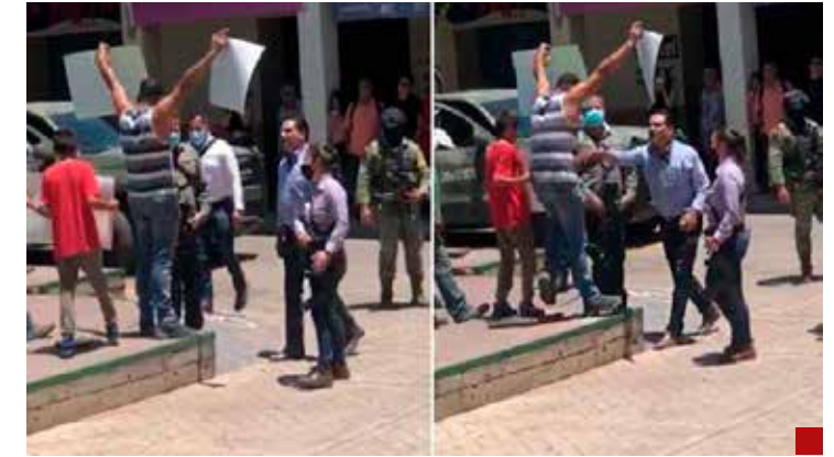
Silvano Aureoles padeció las movilizaciones radicales de la Coordinadora Nacional.

Por el bien de México, "La Patria es primero".