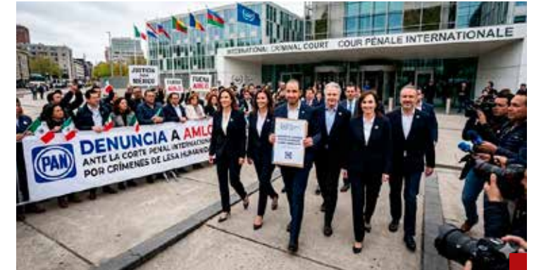
El PAN denuncia a AMLO por crímenes de lesa humanidad.

Ya sabremos quién se llevó la foto y la cobertura de prensa a nivel internacional. Y se puede anticipar que la silla vacía de la doñita durante la ceremonia de inauguración va a llamar la atención. Había de ir la señora, total, una serenata de insultos cualquiera recibe... pero tiene su simbolismo la silla vacía.