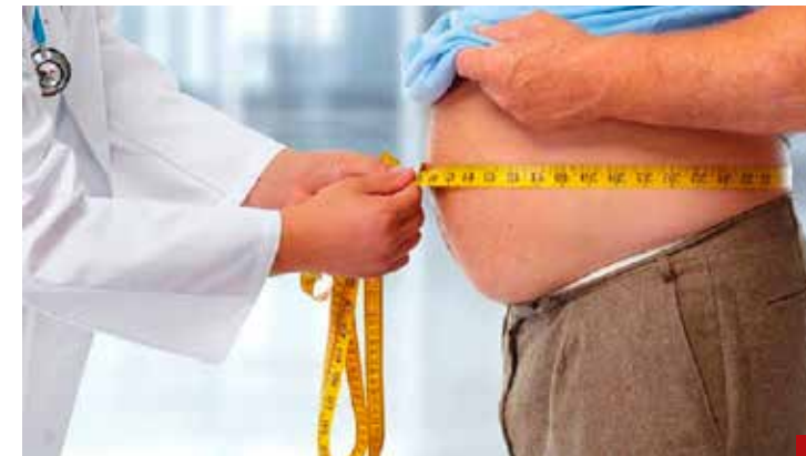
Más del 75% de los adultos padece obesidad.