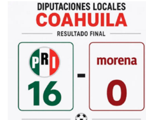
Carro completo del PRI en Coahuila... como en los viejos tiempos.