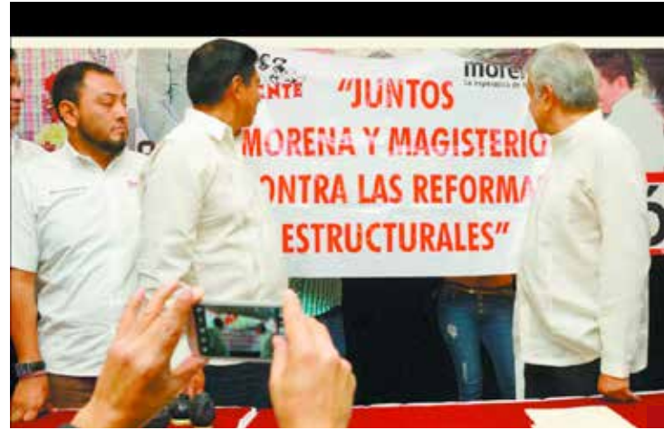
¿Qué pasó con el pacto?