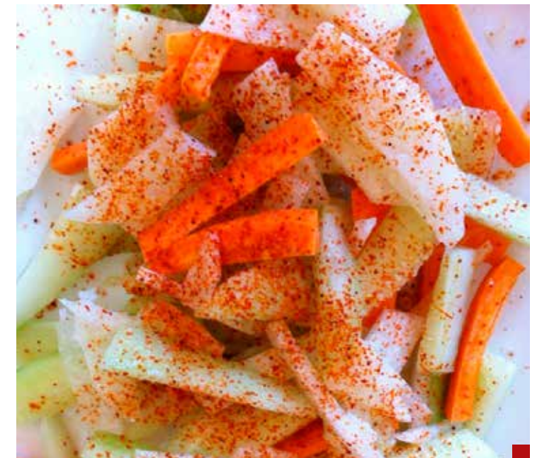
La tradicional botana mexicana de pepino, jícama o zanahoria, una alternativa saludable, ¡piénsalo!