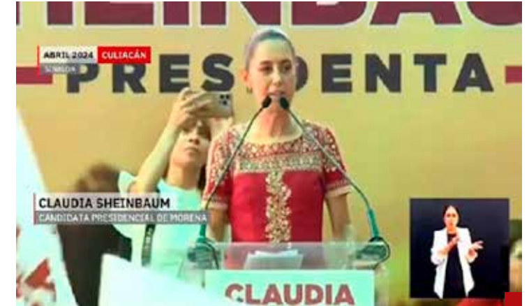
Prometer no empobrece...

***Académico y consultor, egresado del IPN.