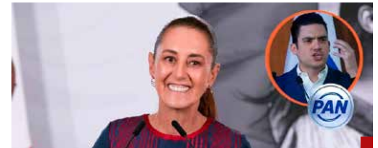
La Primera Presidenta se burla del PAN.