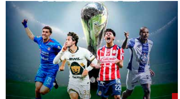
Ver un juego de ligilla provoca hábitos sedentarios.

Sígueme en X: @TXTUALes Y como @villasana108 en Tik Tok. En Instagram: @villasana10