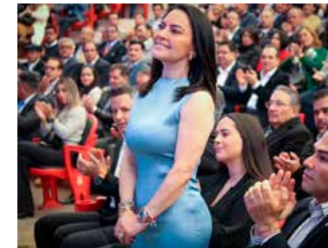
Sin deberla ni temerla salió afectada en sus aspiraciones de ser alcaldesa de Metepec.