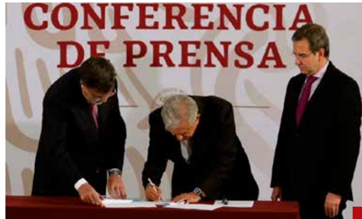
Costoso derogar la reforma educativa de 2013.