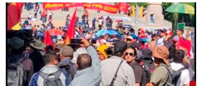
Las amenazas: CNTE, madres buscadoras, transportistas...

Para unos golpiza, para otros goliza, para muchos una “madrina”.