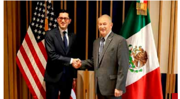
Lo que hizo el gobierno de los EUA al citar a nuestro canciller en su embajada es un golpe de autoridad.