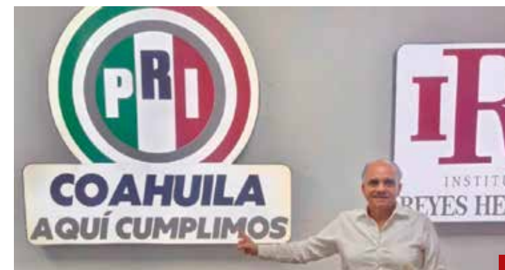
Los partidos ganadores no deben echar las campanas a vuelo.

Los expertos señalan que este tipo de tecnologías puede contribuir a fortalecer las prácticas de antisepsia en los 570 bancos de sangre que operan en el país, con el objetivo de preservar un mayor número de unidades aptas para transfusión y reforzar la seguridad de pacientes y donadores.