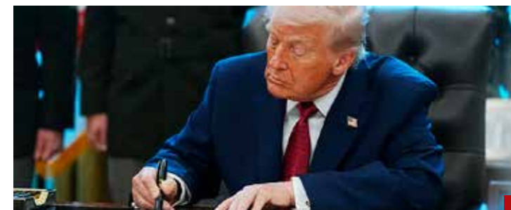
El combate al fentanilo incluye operaciones terrestres: Trump a México.

medidas legales por presuntos desórdenes, mientras que plataformas de oposición nacional externaron su intención de promover acciones de inconstitucionalidad contra dicha ley.