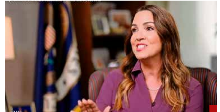
Ya lo dijo Sara Carter, directora de la Oficina de Política Nacional de Control de Drogas del gobierno estadounidense: "México está cooperando chulito".

Respetando nuestra soberanía pueden deshacernos, muertos de risa.