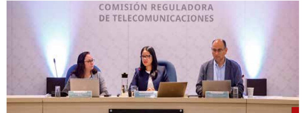
La Comisión Reguladora de Telecomunicaciones reitera que no contempla una ampliación formal del plazo.

También señala la CRT que el gobierno federal no administra bases de datos centralizadas ni realiza el registro directamente;