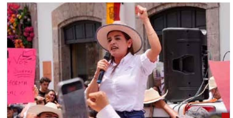
Un trágico evento no es suficiente para ganar el sufragio ciudadano.