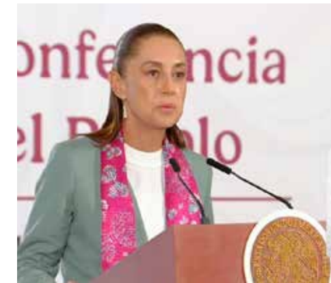
Claudia Sheinbaum también felicita y agradece al equipo del Gabinete de Seguridad por la caída de 46% en los homicidios.