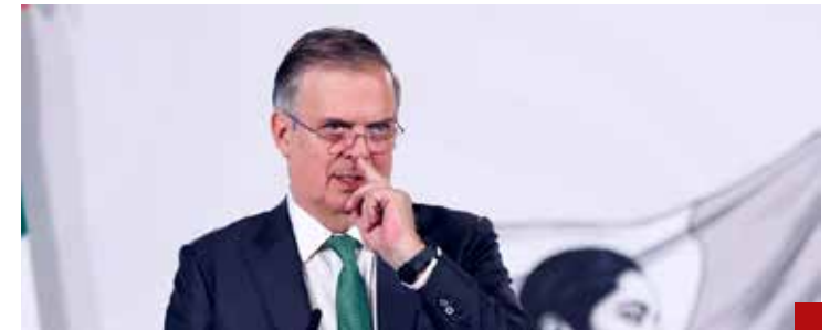
Marcelo Ebrard está enfrascado en lo de la revisión del T-MEC.