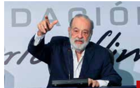
El empresario Carlos Slim solicita revisar la fecha límite.

La CRT descarta que el gobierno maneje los datos de usuarios registrados. El organismo enfatizó que el trámite de registro