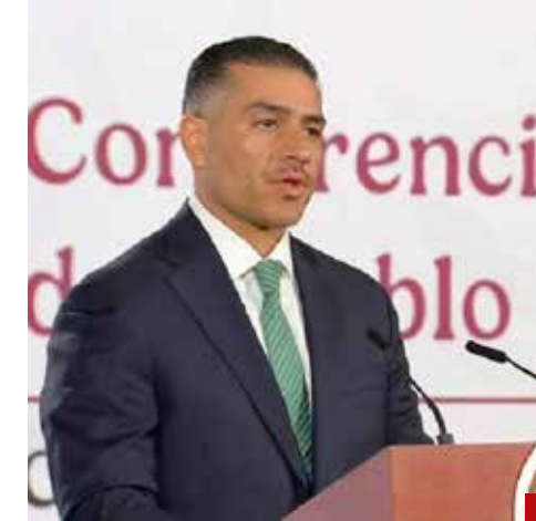
El trabajo de Omar García Harfuch da resultados: Reducción en todos los delitos de alto impacto desde octubre de 2024.