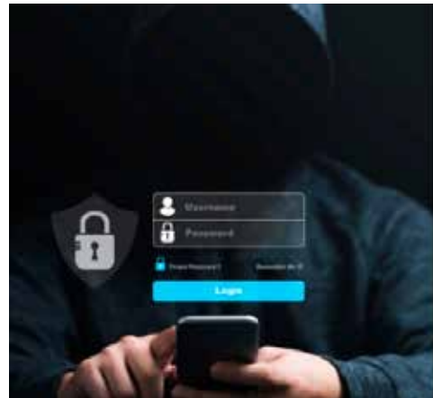
Digán lo que digan, seguirá la delincuencia en celulares.