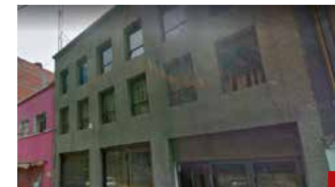
Todo listo para el Decimoséptimo Consejo Nacional Ordinario.

para no “agotar ni cansar” a sus empleadas consentidas, quienes tienen sus oficinas en Santa Fe, echaron a andar el Home Office, de manera que una semana se presentan a laborar y otra despachan desde la comodidad de sus casas.