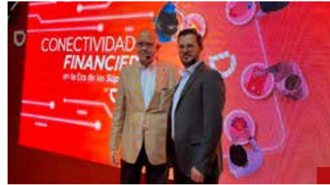
Siete de 10 personas aún no realizan el trámite: The Competitive Intelligence Unit.