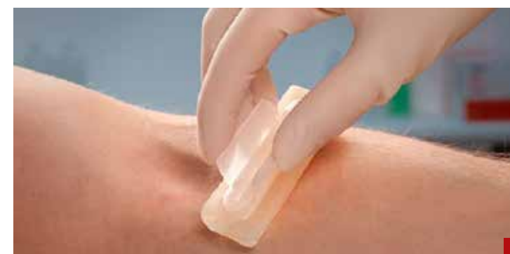
Un estudio mexicano aporta evidencia para fortalecer la seguridad de la sangre destinada a la transfusión.