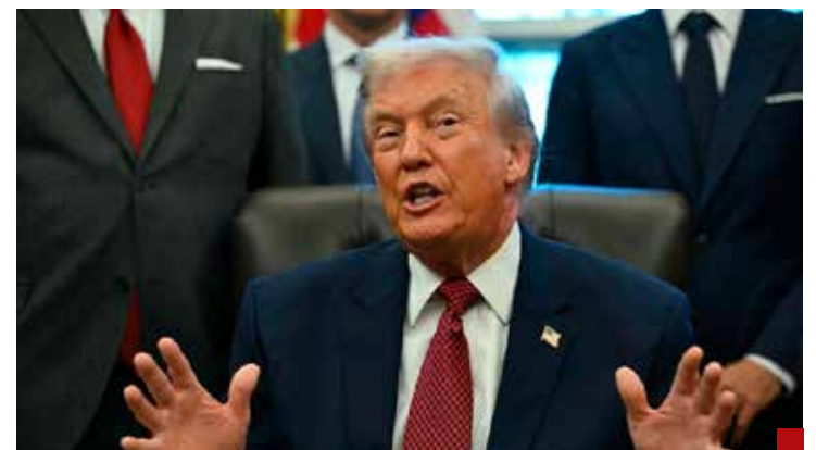
Donald Trump no se va a dar un balazo en el pie, pero sí nos va a sacar el tuétano en las negociaciones.