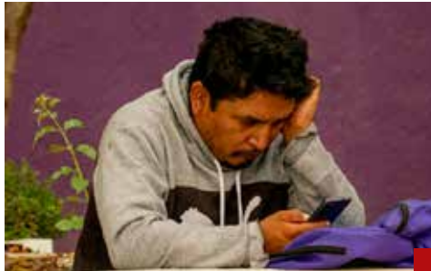
Los usuarios manifiestan desconfianza.