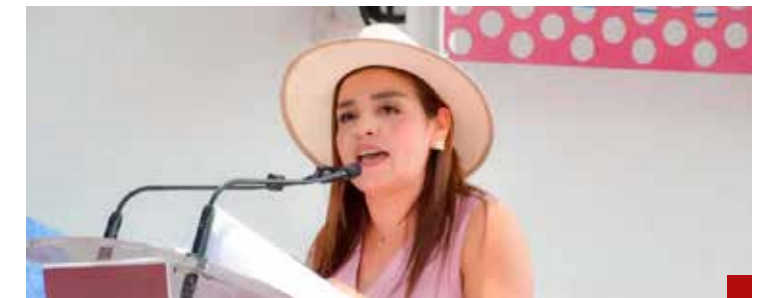
La actual lideresa del movimiento está en pie de lucha.

Sin duda debe tener datos (de los que luego se piden en las Mañaneras del Pueblo) porque no hace mucho se desempeñó como delegado de Infonavit y delegado de la Secretaría de Gobernación. De que sabe, sabe. Eso no debe dudarse.