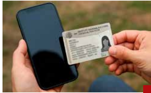
Casi 100 millones todavía no se registran.