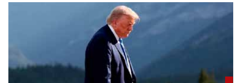
Alerta internacional por su postura.