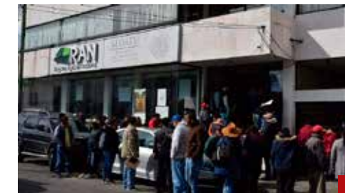
Abundan los gestores o “coyotes” en el Registro Agrario Nacional de Toluca, Edomex.