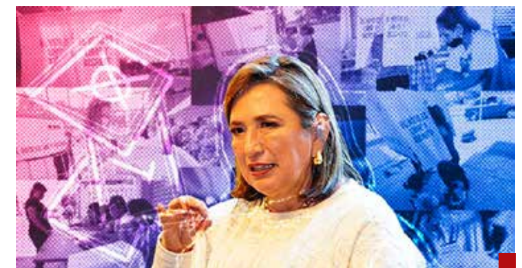
La dejaron morir sola.