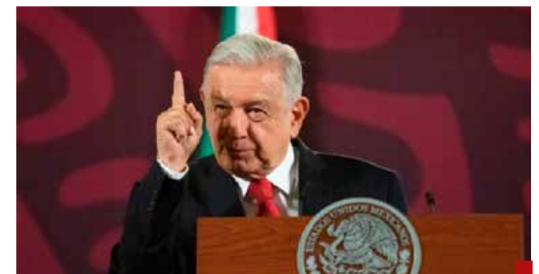
AMLO mostró desprecio contra la democracia.

Con el paso del tiempo siguen vigentes las sabias palabras de Muñoz Ledo: “¡Ching... a su madre, qué manera de legislar!”.