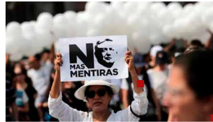
El disfrute de engañar: “Nadie ni nada por encima de la ley”... pero el pueblo no es tonto.

De doce buenas noticias, 10 son mentiras. Por cierto, el padre de la mentira, el gran engañador (revise el evangelio de San Juan en 8:4-45), es el diablo y estos andan muy a gusto con Satanás, lo que explica lo a gusto que están en malas compañías.