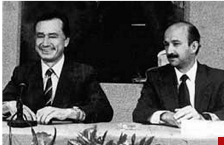
Manuel Bartlett Díaz, como secretario de Gobernación desató una persecución criminal contra sus antagonistas.