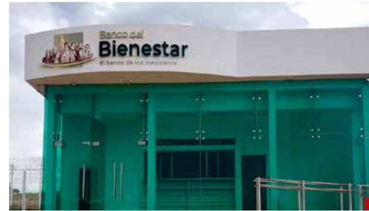
Rateros resultaron ser funcionarios del Banco del Bienestar.

Por eso quienes fustigan al pasado, deben tener presente que: Palabra o piedra suelta, no tiene vuelta.