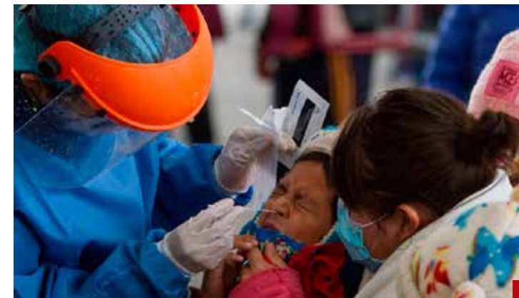
Aunque se repitió muchas veces, la pandemia del covid-19 nunca estuvo “domada”.