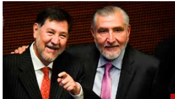
La lista es más larga que la Cuaresma.

Cuando en las proclamas de tribunas legislativas y ceremonias oficiales, los oradores se refieren los tiempos en que zánganos y arribistas gozaron de la impunidad.