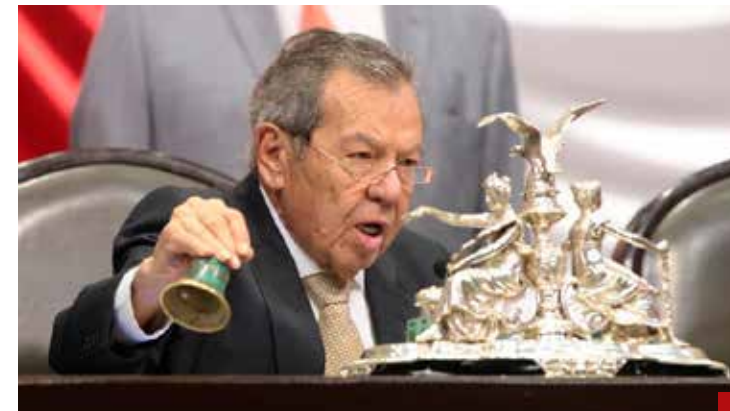
Su frase cobra vigencia hoy en día.

democracia, diplomacia, educación, salud, ciencia, transparencia, justa impartición de la justicia y el combate real a la impunidad y corrupción.