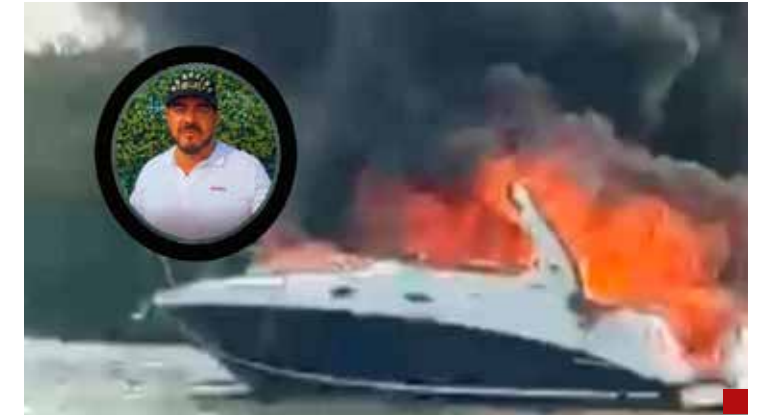
Zenyazen Escobar García, diputado federal veracruzano que generó un escándalo mayúsculo.

Con sus antecedentes, seguramente llegará a dividir y no a mantener unida a la fracción parlamentaria.