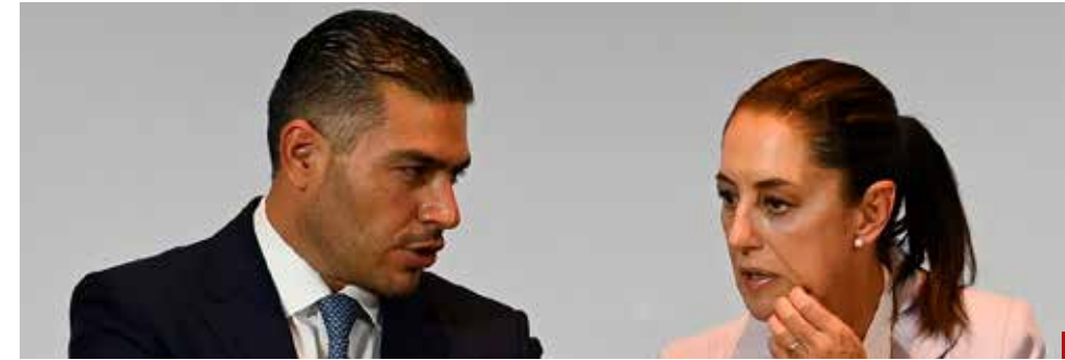
Goza de todas las confianzas de la Primera Presidenta.

Trabajó en la extinta Policía Federal y pos-