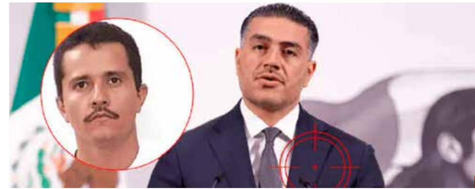
La caída de Nemesio Oseguera Cervantes fortaleció la percepción de eficacia en su gestión.