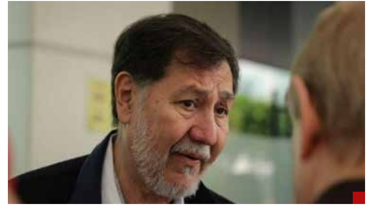
El miedo no anda en burro.