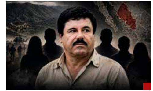
Joaquín Guzmán ya quiere cantar.