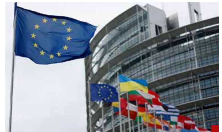
La función principal de la Unión Europea es promover la paz, los valores democráticos y el bienestar socioeconómico entre sus ciudadanos.