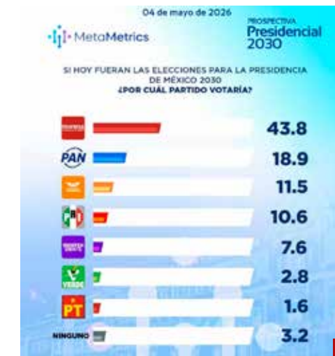
Por partidos, Morena lidera en preferencia ciudadana para el 2030.