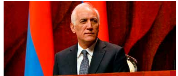
Armenia, en su intento de cambiar drásticamente el rumbo del desarrollo del país, ignoran la grave situación económica de la república.