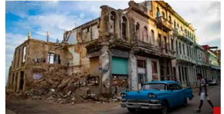
En Cuba los problemas son numerosos, pero la isla sobrevive, esforzándose por mantener su identidad.

Sígueme en X: @TXTUALes Y como @villasana108 en Tik Tok. En Instagram: @villasana10