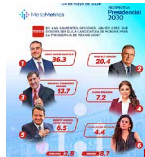
El mejor posicionado para la Presidencia de la República.