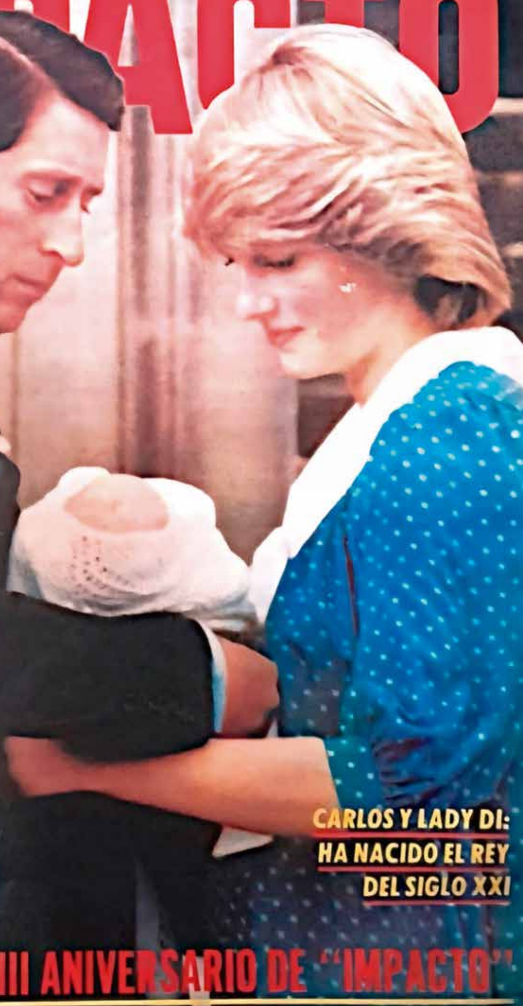
CARLOS Y LADY DI: HA NACIDO EL REY DEL SIGLO XXI

• LIC. DE LA MADRID: MEXICO NO QUIERE SER LLEVADO A LA INFAMIA COMUNISTA