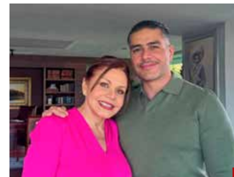
Hijo de la primera actriz María Sorté.