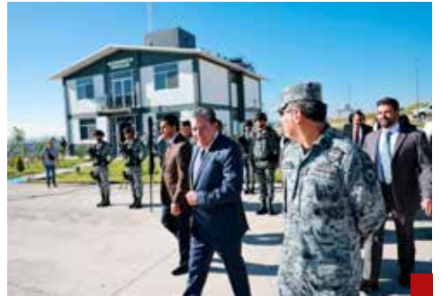
Tremendo terror se vive en Zacatecas, gobernado por David Monreal. Ni cómo ayudarlo.