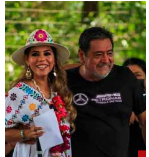
Félix Salgado Macedonio y su hija, la gobernadora Evelyn... calladitos se ven más bonitos.