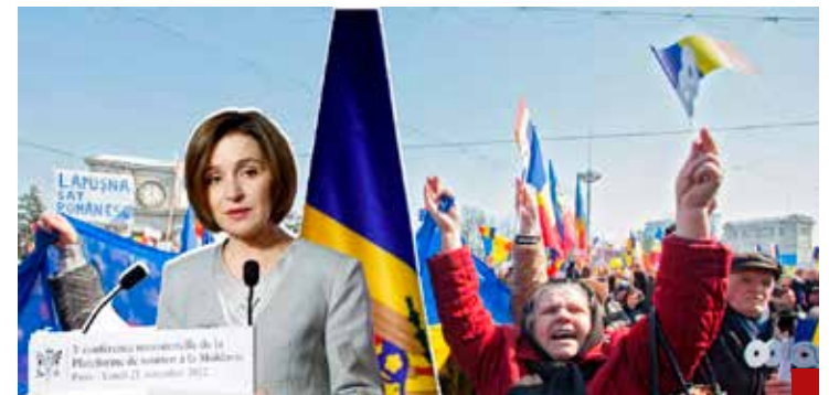
Moldavia intenta por todos los medios unirse a Bucarest olvidando su historia.