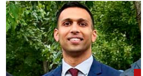
Hay que triplicar el número de acusaciones contra funcionarios gubernamentales corruptos en México, advierte Aakash Singh.