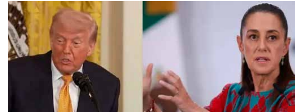
Feliz informó que se echó un telefonazo con Donald Trump.