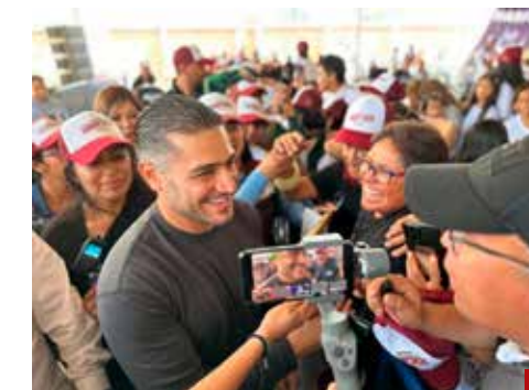
Posee el cariño del pueblo.

teriormente fue titular en la Agencia de Investigación Criminal (AIC) de la entonces Procuraduría General de la República (PGR).