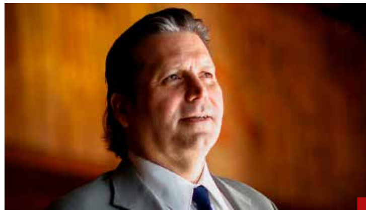
Ignoraron las acusaciones del priista Mario Zamora.

En la acusación de Estados Unidos, se señala que Gerardo Mérida recibía al menos 100 mil dólares mensuales por protección y alertamiento de redadas que se iban a realizar contra laboratorios de drogas.