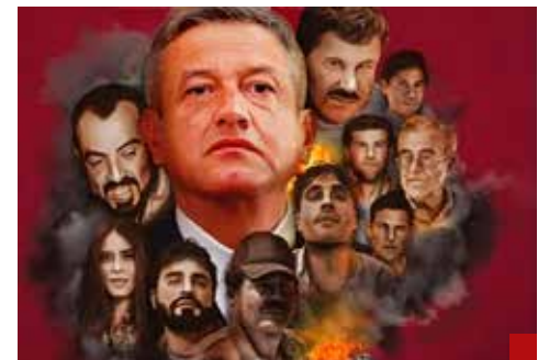
La “herencia maldita”.

las autoridades encargadas de la seguridad nacional. ¿O acaso es que el miedo no anda en burro (Noroña)?