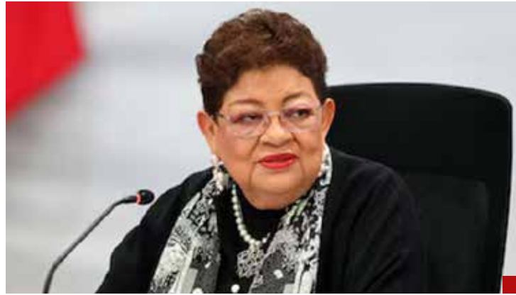
Indefensa ante el discurso de que no hay pruebas.