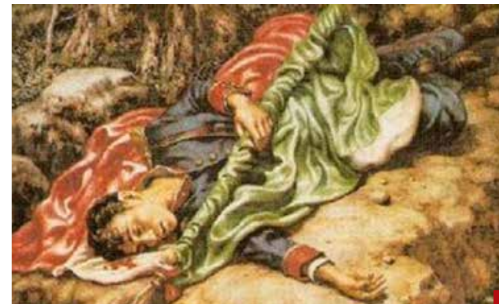
Usan a los Niños Héroe como escudo de la soberanía.