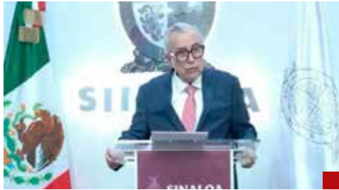
Si está limpio como dice, que vaya ante una Corte norteamericana y acredite su inocencia.