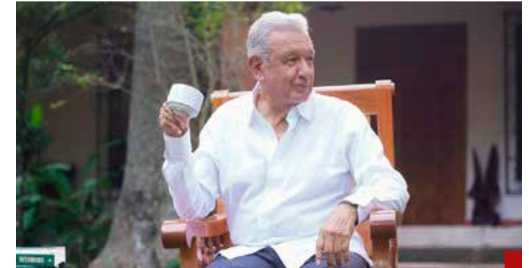
Órdenes desde Palenque.