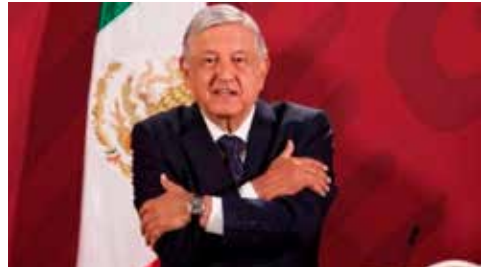
Vuelve a ser noticia el trasfondo de su frase "Abrazos no Balazos".