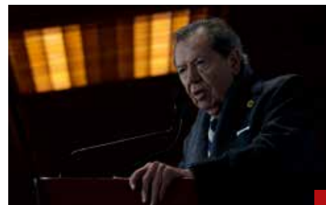
Porfirio Muñoz Ledo puso el dedo en la llaga al expresar que México era un narcoestado.