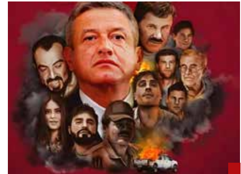
Dejó una "herencia maldita".