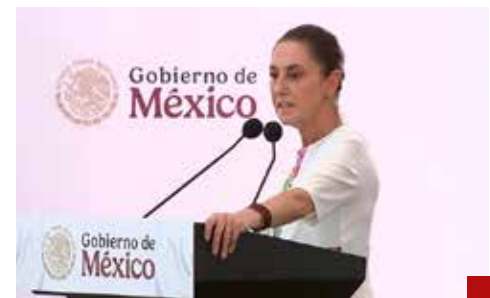
A tomar la mejor decisión por el bien de México.