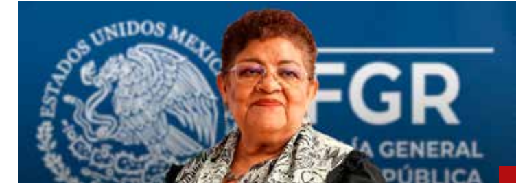
La fiscal Ernestina Godoy Ramos hace lo que le dictan desde Palacio Nacional.