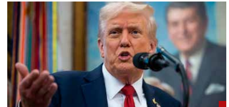
Fueron muchas las advertencias de Donald Trump.