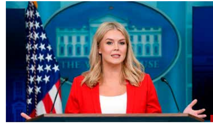
Crecimiento del narcotráfico alarma a la Casa Blanca.

No la hacen los gringos como madres de la caridad, sino por la defensa de sus intereses más allá de las fronteras y por ello sí son capaces de una intervención militar. Se los advirtieron.