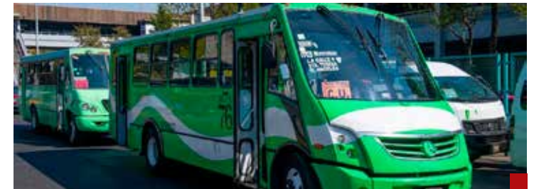
En transporte público los usuarios pasan alrededor de 90 minutos a 2.5 horas diarias en promedio.