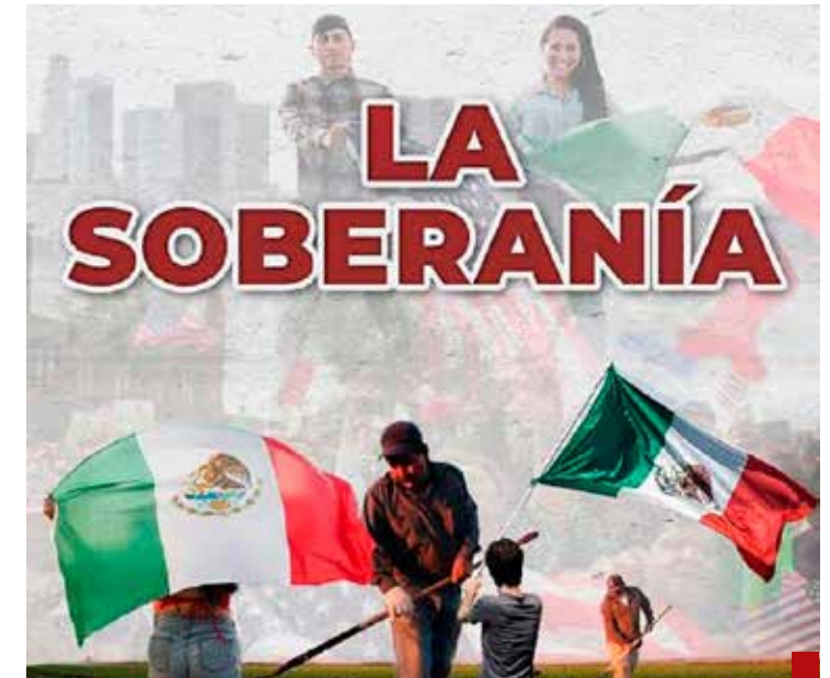
El proyecto político de la autodenominada 4T tiene un manejo a conveniencia del concepto de soberanía.