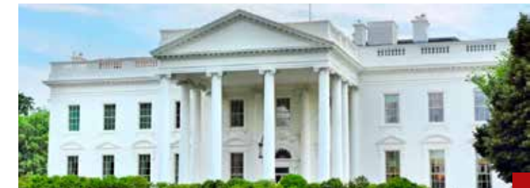
La Casa Blanca exige a México mejores resultados en el combate a los cárteles del narcotráfico.