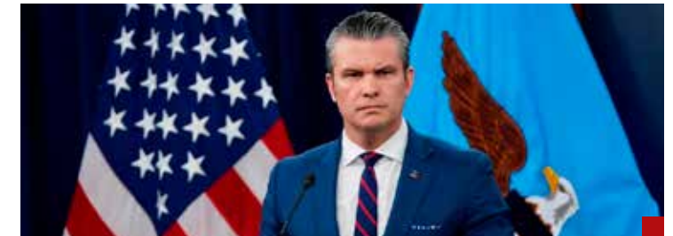
Desde hace cuatro años, el Pentágono advirtió que más de la tercera parte del país estaba gobernado por el narcotráfico.