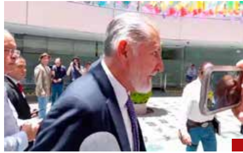
Adán Augusto López Hernández ni pío dice.

Ahora está claro que la exigencia del gobierno norteamericano para que Rubén Rocha Moya, gobernador sinaloense, sea detenido y entregado para ser sometido a un juicio en Estados Unidos, no es un juego.