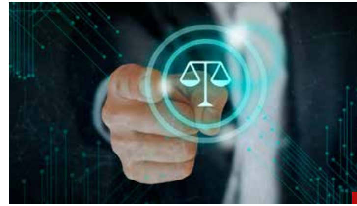
No hay certeza jurídica a las inversiones extranjeras.