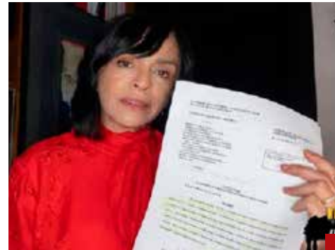
La periodista Anabel Hernández reveló la "lista negra" de políticos de Morena que estarían en fila para ser imputados por EU.

Capacidad tiene la Presidenta Sheinbaum y debe tomar la mejor decisión para bien del país, pues "la patria es primero".