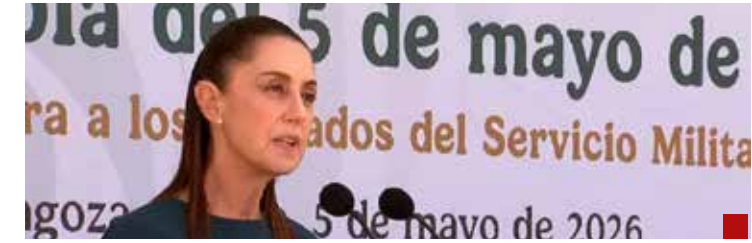
En su defensa, la Mandataria recurre al sentimiento nacionalista.