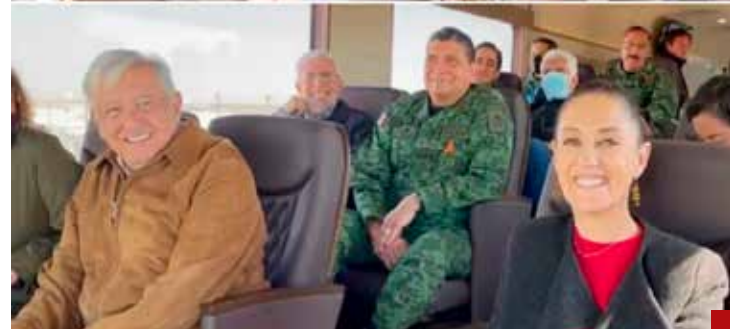
¿Cómo inaugurar algo ya inaugurado?

que sirven como el escenario base o deseado para el sexenio.