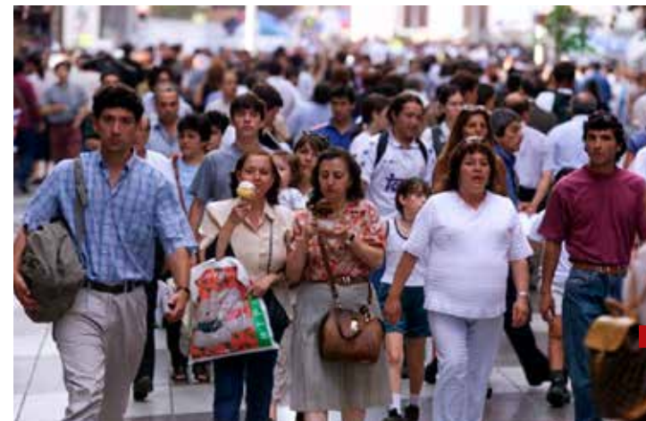
Buscan desaparecer a la clase media, ya que quieren mantener la pobreza como destino manifiesto.