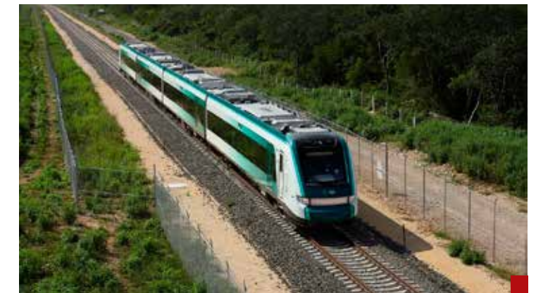
En Tren Maya han sido transportadas casi 23 mil personas, un 41 por ciento más que en 2025.