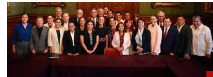
En 2027 los 24 gobernadores morenistas no se van a dejar mangonear tan fácilmente.