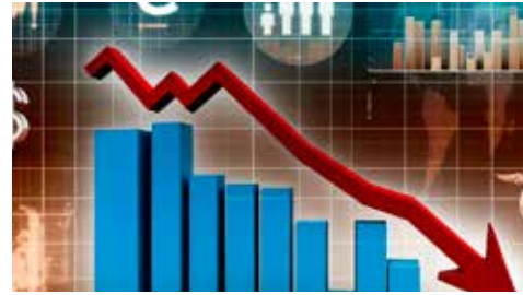
El menor crecimiento económico en 40 años.

A partir de ello, habrá que hacer la "Construcción de Narrativas": Se fundamenta en los "100 Compromisos" y las "Catorce Repúblicas",