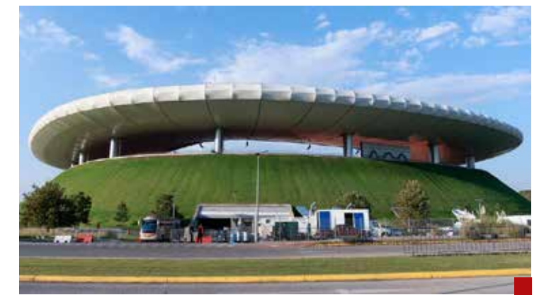
Guadalajara, sede del Mundial de Fútbol 2026, la localidad con mayor percepción de inseguridad pública.