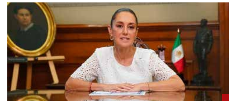
La Primera Presidenta lo tiene todo, por lo que no puede perder.