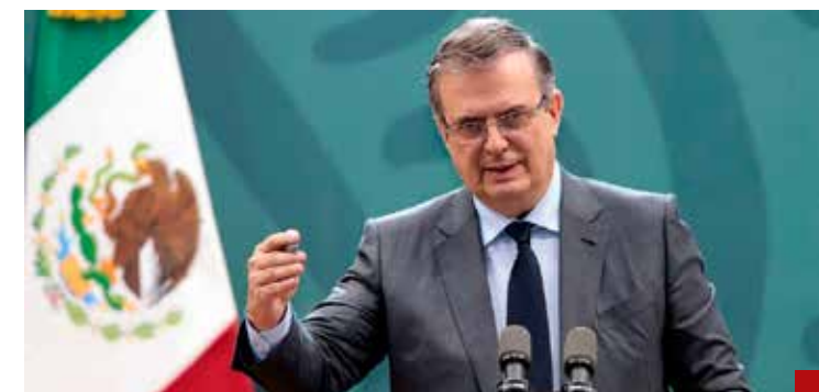
Marcelo Ebrard, un "gallo fuerte" para el 2030.