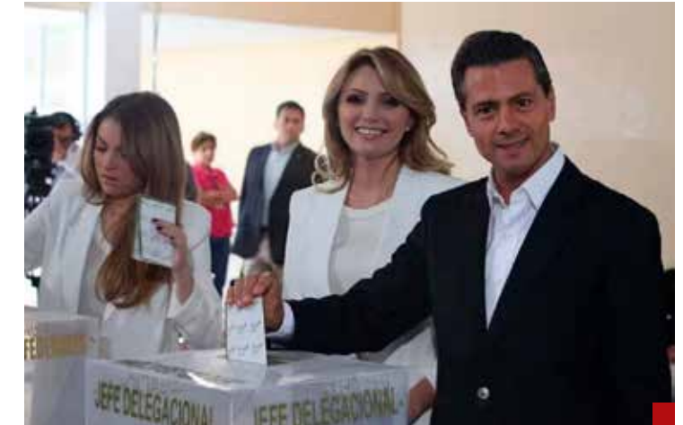
Antes de la 4T había un sistema político más democrático.