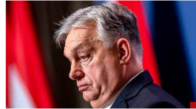
El autócrata húngaro Viktor Orbán era invencible... y lo vencieron.

¡Ay!, doña Sheinbaum, no sabe cómo duele un lanzamiento y peor, por ser la primera mujer Presidenta y la primera perdedora.