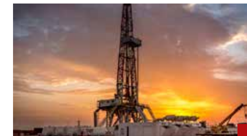
Se le dio un giro a la política energética.