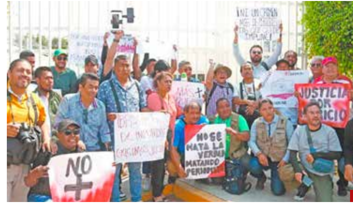
Se reducen las libertades ciudadanas.

La cooptación del árbitro electoral tampoco es una buena señal de ejercicio democrático y es un retroceso en la vida social del país, ya que regresamos a las elecciones de Estado, donde el gobierno controla los procesos electorales para garantizar el triunfo de los candidatos oficiales y contener a la oposición.