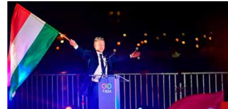
El candidato ganador, Péter Magyar, salió del partido del poder en Hungría.