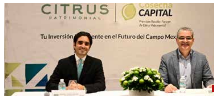
Siembra limones, cosecha dólares, innovadora fórmula de inversión Cosecha Capital.