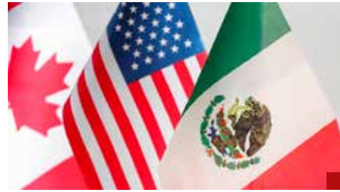
El T-MEC en riesgo, por la incertidumbre y falta de certeza jurídica.