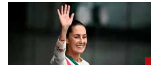
Con el reto de llevar a México al mejor escenario posible.