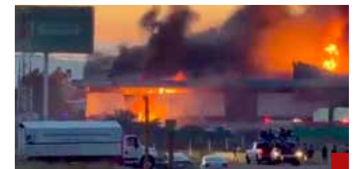
Sospechosismo porque en el incendio se borraron los archivos del caso Segalmex.