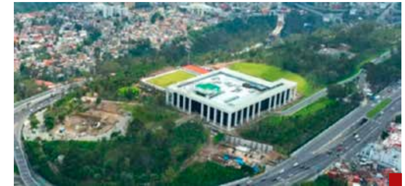
Las nuevas instalaciones se construyeron con dinero de todos los mexicanos.