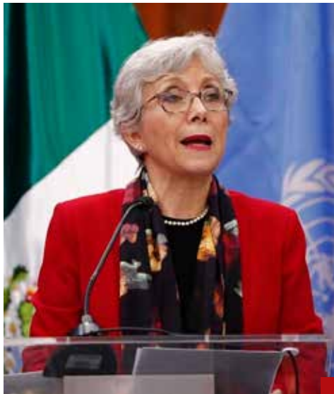
El Comité de las Naciones Unidas contra la Desaparición Forzada pide medidas para apoyar a México.