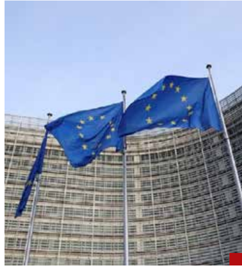
En 2022, el Parlamento Europeo condenó el asesinato, las amenazas y el acoso a periodistas, así como a defensores del medio ambiente y comunidades indígenas.