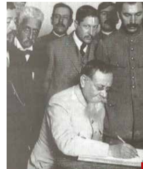
La Constitución Política de los Estados Unidos Mexicanos de 1917 acumula cerca de 300 decretos de reforma constitucional.