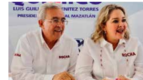
La hija de Rubén Rocha Moya manda al carajo la Honestidad Valiente.