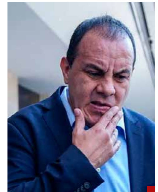
Cuauhtémoc Blanco, el rey de la impunidad.