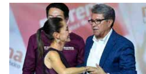
La Primera Presidenta le corrige la plana a Ricardo Monreal.