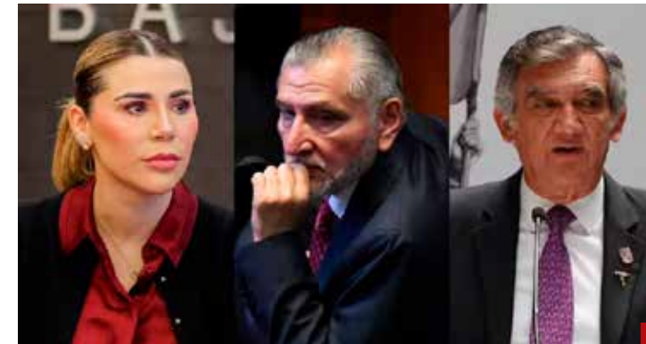
No asumen el costo político de su mal desempeño con la única finalidad de mantenerse en el poder.

Conflict Location & Event Data Project), que en tiempo real monitorea la violencia en todo el mundo; y somos una de las naciones con más violencia política, sólo el año pasado hubo 1,070 crímenes de estos; la ACLED concluye que "el gobierno mexicano tiene el poder, pero no el control de todo el territorio". Y siendo el país más peligroso del mundo, que la doña de Palacio siga con sus gráficas y las porras de sus empleados.