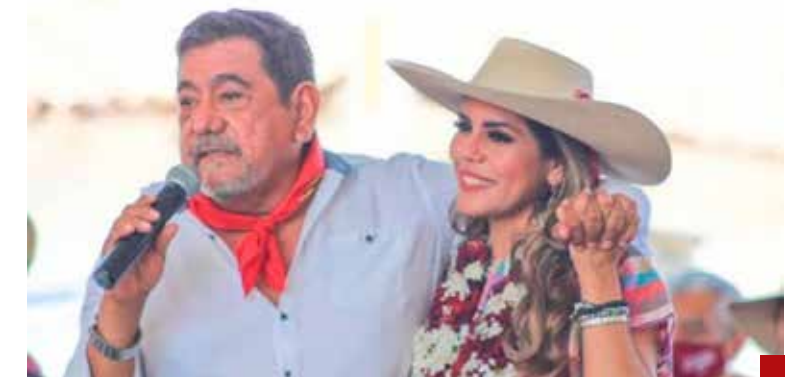
Si estamos contra el nepotismo, pues entonces ningún familiar en el poder, señala Félix Salgado Macedonio.