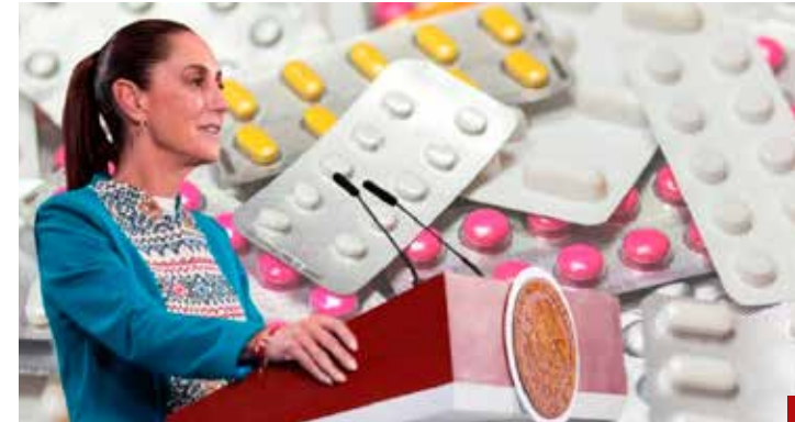
Quitaron de la lista medicamentos que "no eran necesarios".

¿Vamos bien?... ¿En qué vamos bien?... somos el país más peligroso del mundo, sin contar los que están en guerra, dice la ACLED (Armed