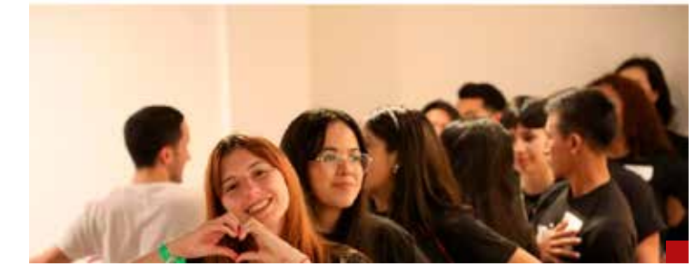
Otro indicador del problema se dio, en octubre de 2025, con el informe "La salud mental de la Generación Z en México" de UNICEF.

La Generación Z mexicana es optimista y resiliente, pero enfrenta altos niveles de ansiedad y estigma. Este estudio revela cómo perciben su bienestar y qué apoyo institucional necesitan.