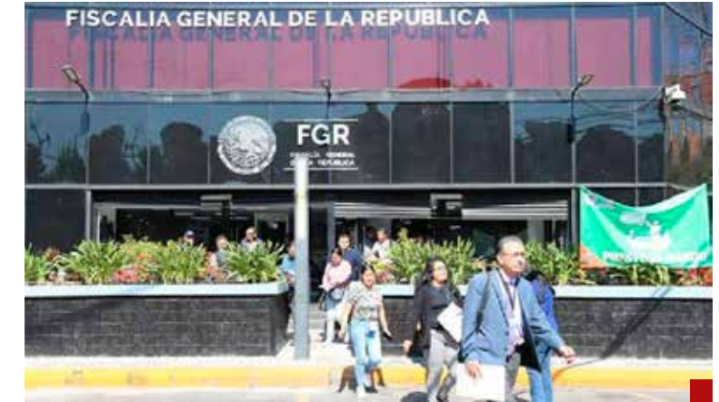
Se les olvida que es pueblo la clase trabajadora de la FGR. Pura demagogia.

Está claro que la verdadera oposición de Morena está dentro de ese partido, la lucha por el poder pronto se traducirá en más confrontaciones, al tiempo.