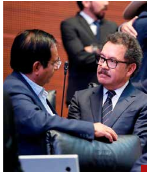
La 4T descalifica el trabajo del comité de la ONU, al calificarlo de "sesgado", "tendencioso" y poco riguroso.

producido ataques generalizados o sistemáticos contra la población civil en diferentes partes del país.