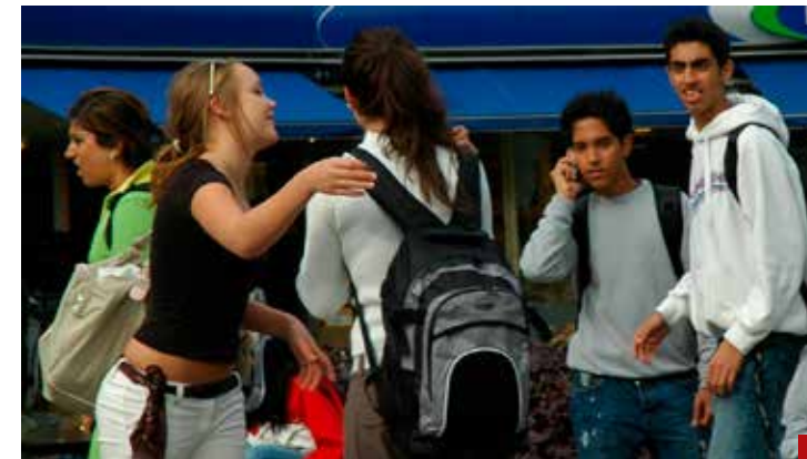
El 10% de los adolescentes de 12 a 17 años presentó malestar psicológico en los últimos 12 meses.

El anuncio del gobierno federal de una estrategia nacional de salud mental para estudiantes, tras el caso de Michoacán, fue considerado positivo por el especialista, aunque subraya que estas acciones deben