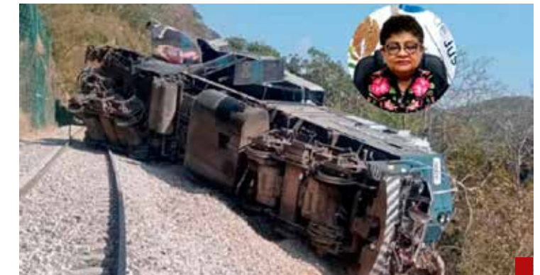
Nadie del ferrocarril ni de la Marina son responsables de la tragedia del Tren Interoceánico.

Los cuatrotroteros, doña Claudia a la cabeza, se abanicán con todo: controlan la propaganda (la "narrativa", le dicen). Ya se van a enterar: lo que sabe este López, seguramente lo sabe el Tío Sam, no es mucho suponer. Y después de apretarlos en la revisión del T-MEC, van por ellos y les van a sacar el tuétano.