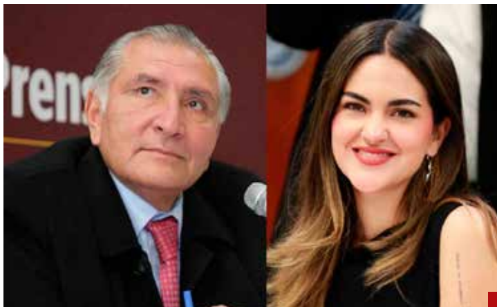
Andrea Chávez será la candidata y gobernadora de Chihuahua, expresa Adán Augusto López.

Morena lo siguen candidateando para tareas políticas superiores, de muy alto nivel.