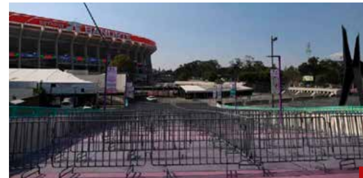
La 4T trabaja todo al cuarto para las doce.

También estaremos ausentes en la percepción internacional. El gobierno nada aportó a la proyección de la imagen nacional. Entró tarde a la realización de obras o promoción del país.