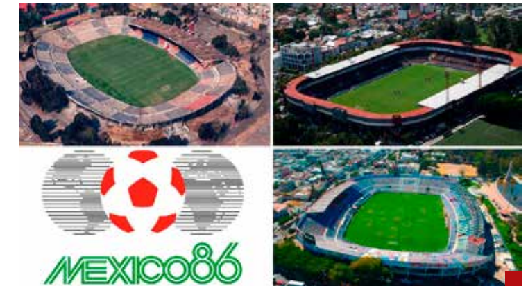
En 1986 el gobierno cumplió, en tiempo y forma, con las obras de infraestructura.