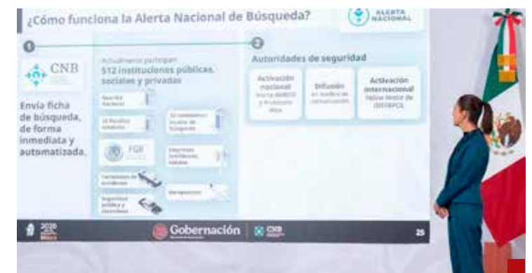
La Primera Presidenta ya anunció que ahora sí se harán bien las cuentas.