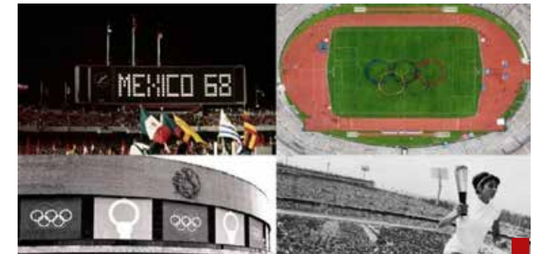
En 1968 se crearon instalaciones deportivas.

No le servirá ni como distractor, a pesar de las pantallas en el Zócalo y en diversos lugares.