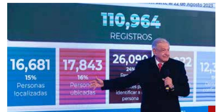
Con AMLO se batían todos los records de desapariciones.

Sin dramatizar, está a la vista que este gobierno puede alardear del “humanismo mexicano”, solamente porque tiene la conciencia cauterizada.