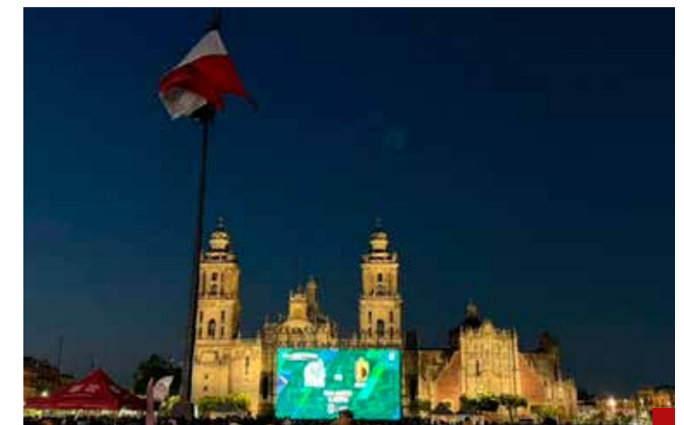
No le servirá como distractor.