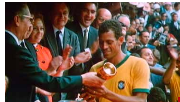
En 1970 se disputaría la última Copa Jules Rimet.

Lo poco y mal que ha hecho es al cuarto para las doce. Nada que presumir, ni siquiera el nombre del estadio. Por eso la FIFA se llevará los beneficios del futbol como deporte y negocio.