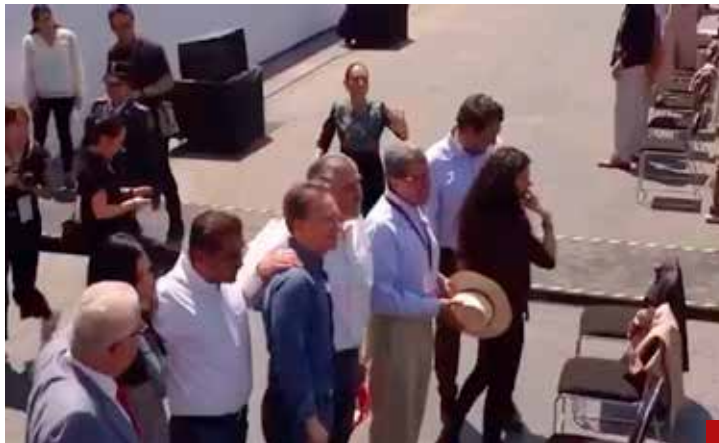
La descortesía que no se olvida.