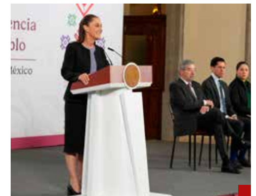
Fue una conversación amable y cordial, expresa la Primera Mandataria en primera instancia.

Está claro que las declaraciones de Trump contrastan con la postura del gobierno mexicano, que insiste en el diálogo y la cooperación humanitaria como vía para evitar un mayor deterioro social en el país caribeño. Pero surge la pregunta del millón: ¿Quién miente: Sheinbaum o Trump? ¡Hagan sus apuestas, señores!