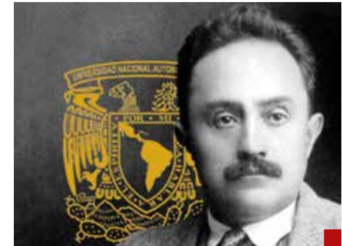
A José Vasconcelos se le debe la autonomía universitaria.