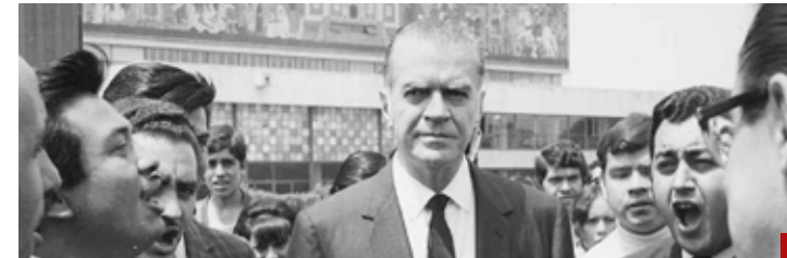
El rector Javier Barros Sierra aguantó el embate del presidencialismo y la represión estudiantil de 1968.