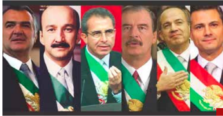
En lo económico, nos mantienen a flote las políticas neoliberales.

¿Dónde quedó la transformación en lo educativo, cultural y científico?