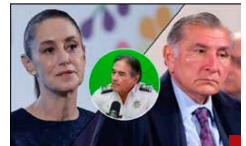
Aún hay tiempo para que inicie el deslinde, no tiene por qué pagar culpas ajenas.