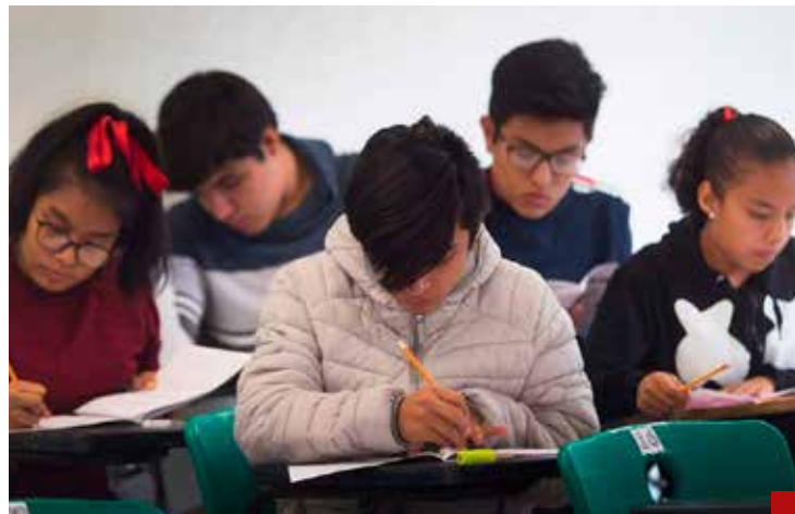
Estamos reprobados en la prueba internacional PISA.

En este sentido, la habilidad del expresidente López Obrador para simular es asombrosa.