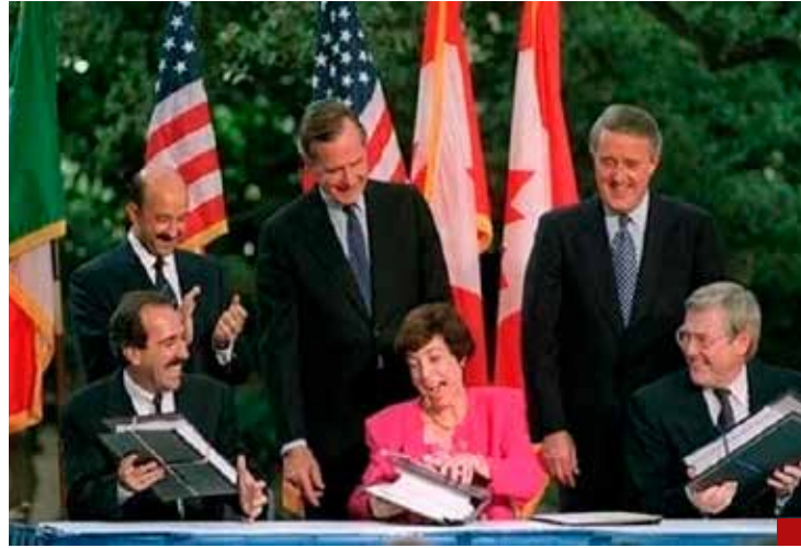
El T-MEC, la prueba más palpable del neoliberalismo.

¿De verdad hemos tenido alguna transformación para que vivan mejor los mexicanos?