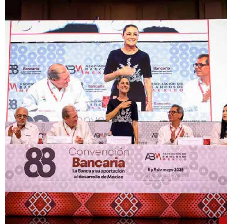
Algunas acciones son alentadoras, como la reciente reunión que tuvo la Primera Presidenta con integrantes de la Asociación de Bancos de México.

saber si estamos frente a una verdadera lideresa y jefa de Estado, capaz de realizar las más grandes hazañas para llevar a buen puerto a su pueblo.