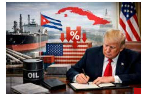
Nadie se lo esperaba: viene la orden ejecutiva de Trump contra países que envíen petróleo a la isla.