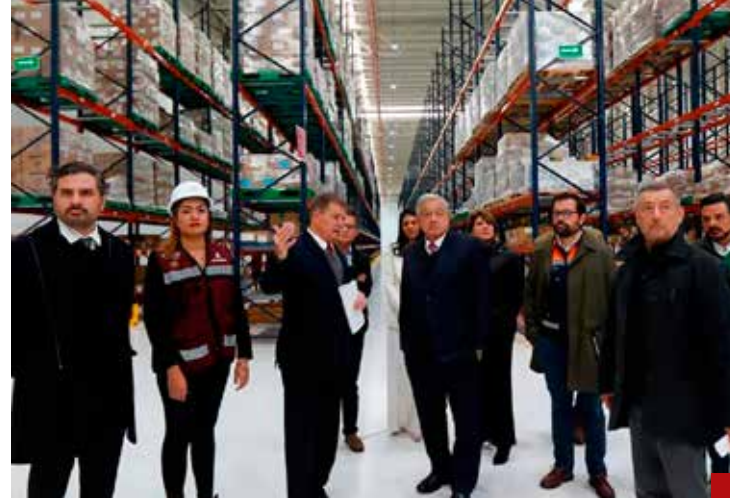
La habilidad del expresidente López Obrador para simular fue asombrosa.

El exmandatario Andrés Manuel logró dominar un concepto esencial en la teoría del “cambio social” que es la “comunicación”, lo que le permitió ofrecer la percepción, en lo colectivo, que vivimos un cambio, una “transformación”.