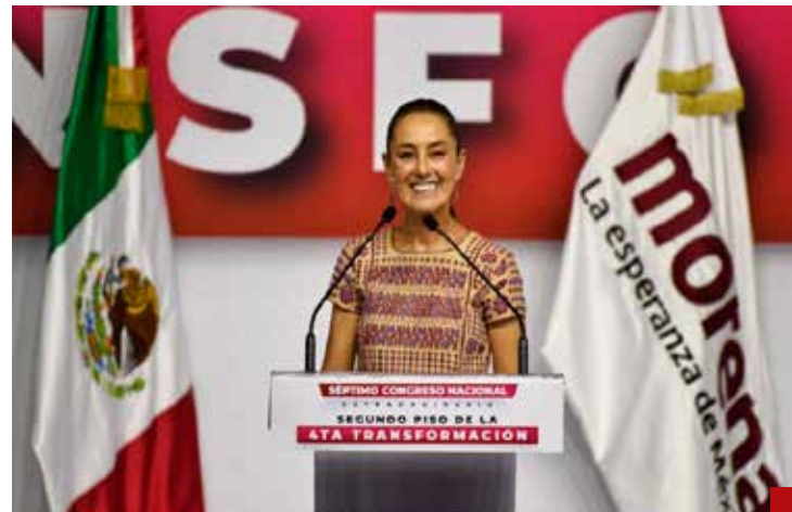
¿En dónde está la transformación?

Basta de simulación, eso concluyó en 2024. Estamos a tiempo para