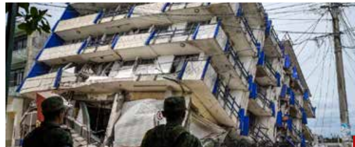
Los temblores son inevitables e impredecibles, pero con buenas construcciones se disminuyen los riesgos.

de su madre muerta en un derrumbe ocurrido en la Plaza Garibaldi.