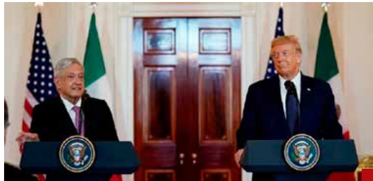
Mande al carajo a los halcones: AMLO al mandatario de EU.