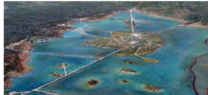
El suelo de la capital es débil, porque está construida sobre el Lago de Texcoco.