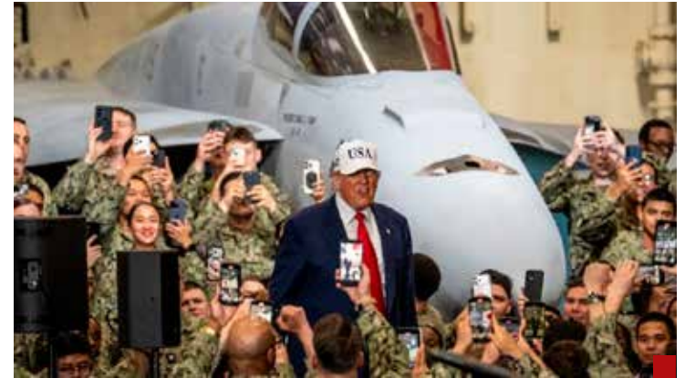
La política de Trump prevé un aumento significativo y continuo del poder militar en el hemisferio occidental.

En este momento el gobierno que encabeza Donald Trump levanta la bandera de la Doctrina Monroe, que pretendía “reordenar” países con intereses estadounidenses.