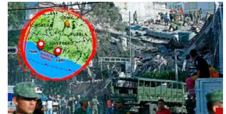
Brecha de Guerrero es una bomba de tiempo, puede generar un terremoto igual o superior al de 1985.