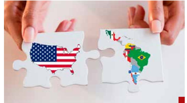
Aunque suene contradictorio, Estados Unidos pretende fortalecer las relaciones con los gobiernos latinoamericanos.