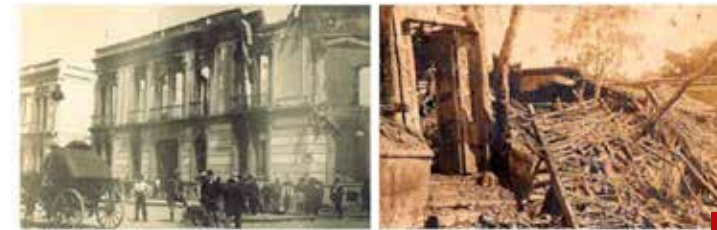
El último sismo de la Brecha de Guerrero fue en la madrugada del 7 de junio de 1911.

El experto ha recolectado muy diversos testimonios. Desde los de rescatistas del grupo Topos, que sacó a varios sobrevivientes debajo de la tierra, hasta el de protagonistas de milagros como el niño extraído del vientre