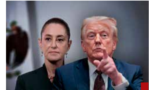
“Ella está muy asustada de los cárteles”, expresa Trump sobre la Primera Presidenta.

Por lo visto, y en la práctica, a Horacio Duarte se le da la imposición de candidatos, es lo suyo pues.