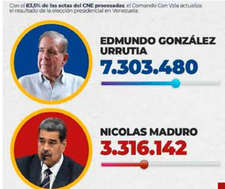
El resultado de las elecciones presidenciales del 28 de julio de 2024 fue la gota que derramó el vaso.

Habrà que esperar el desenlace de toda esta analogía México-Vene-