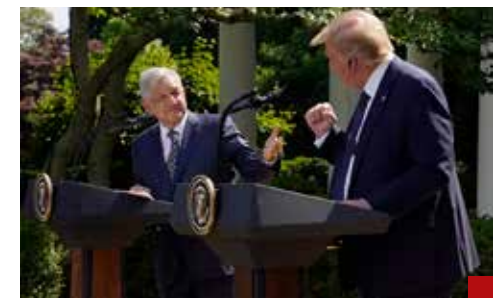
Mande al carajo a los halcones, consejo de AMLO al mandatario estadounidense.