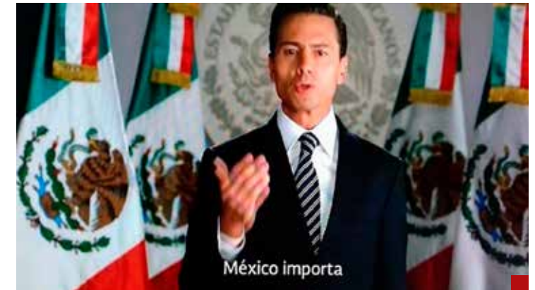
Hasta 2018 había unidad nacional.