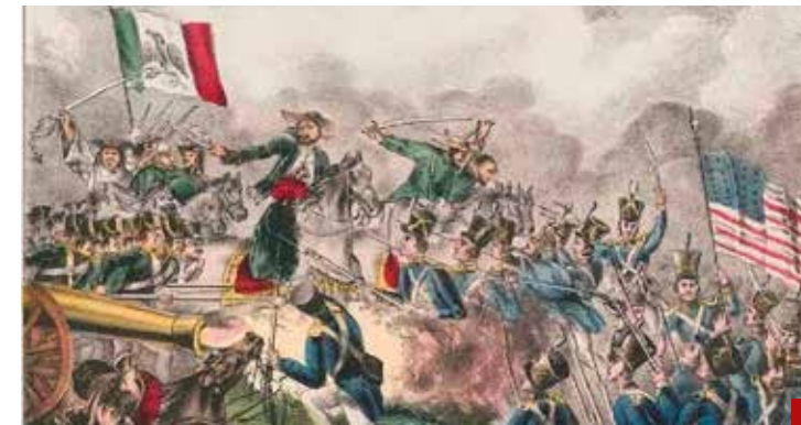
El 8 de mayo de 1846, los EUA nos invadieron y cinco días después nos declararon la guerra.

Señora, su lealtad es equivocada, sus miedos, infundados. Tiene poder sobrado. Es por México, éntrele.