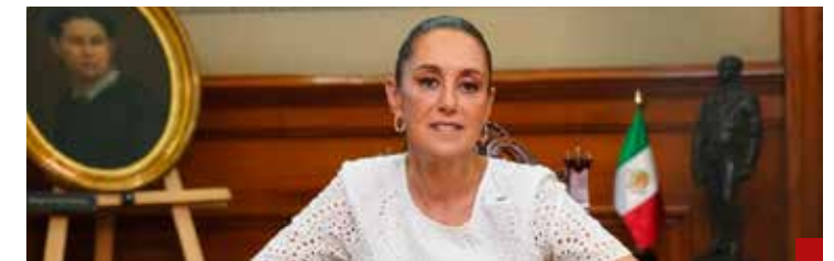
Tiene poder sobrado la Primera Presidenta. Hay que entrarle por México.