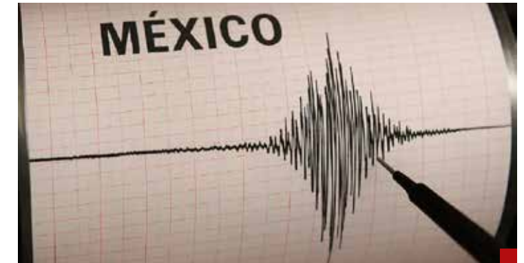
En 2023 se registraron 90 temblores diarios.

La llegada del gran terremoto se espera sea de la Brecha de Guerrero... y es como la muerte: sabemos que vendrá tarde o temprano, pero no sabemos cuándo.