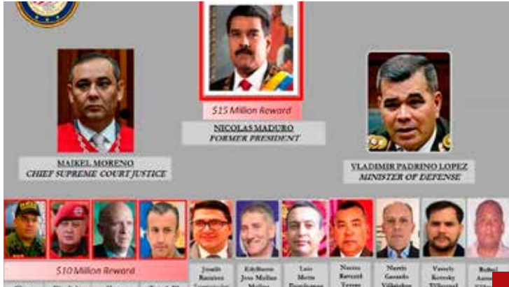
Está involucrado en actividades relacionadas con el narcotráfico.

En 1994 invadió Haití para facilitar la transición a la democracia y la vuelta de Jean-Bertrand Aristide, el primer presidente de la isla elegido en unas elecciones democráticas en 1990.