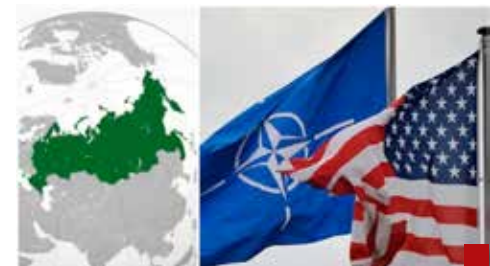
El Tío Sam provoca el desmoronamiento del Occidente colectivo.