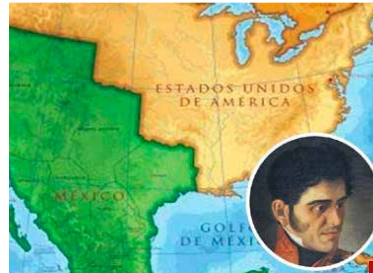
Nosotros mismos hemos provocado esta vergonzosa tragedia a través de nuestras interminables luchas internas: Santa Anna.