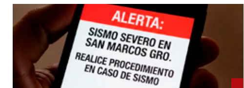
Hay que estar alertas con la Alerta Sísmica.