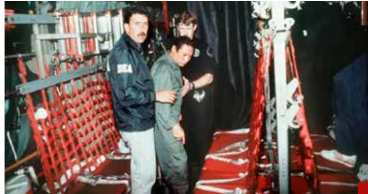
En 1989, con George Bush, entraron en Panamá para capturar a Manuel Antonio Noriega, acusado de tráfico de drogas.

Con 82% de las actas publicadas por la oposición, en números globales