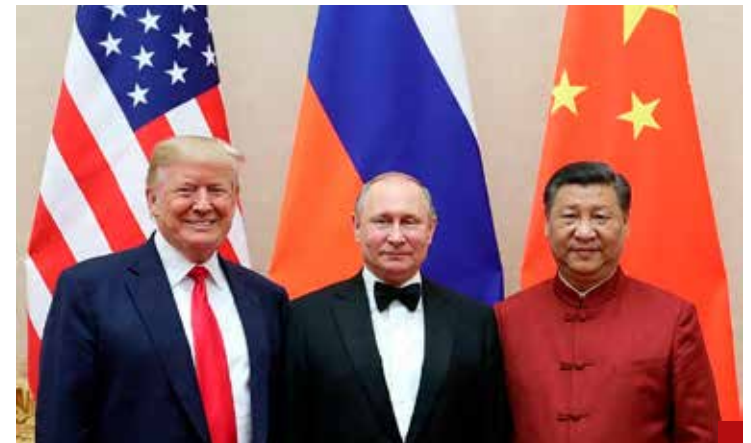
Estados Unidos impedirá que Rusia y China desplieguen fuerzas o posean activos estratégicos, como puertos, redes eléctricas y tierras raras.