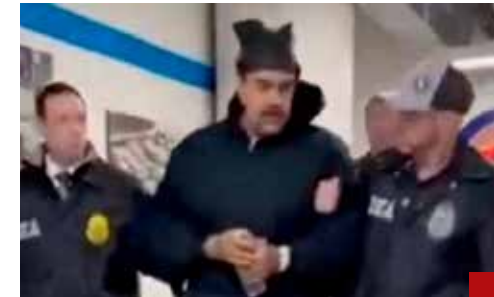
Estados Unidos no se anda con miramientos.