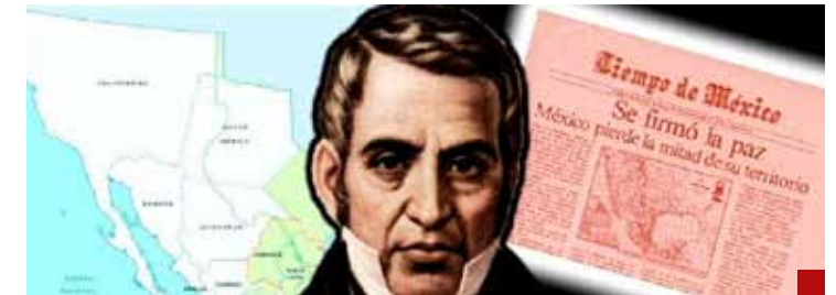
Manuel de la Peña y Peña formalizó la venta el 2 de febrero de 1848.