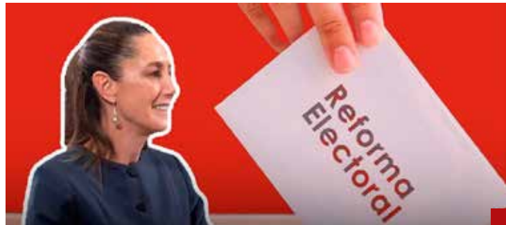
La prueba de fuego para Sheinbaum es si da la puntilla a la democracia mexicana con la polémica e innecesaria Reforma Electoral.