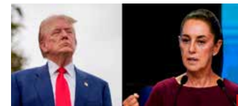
La Primera Presidenta le da un coscorrón a Trump.