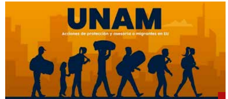
UNAM, Acción Migrante, brinda numerosos apoyos legales y psicológicos.