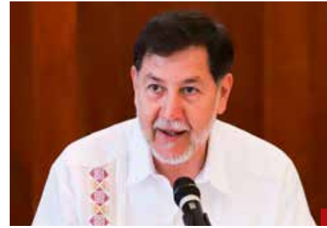
Gerardo Fernández Noroña, populista de izquierda.

Las condiciones ideológicas de China son muy diferentes de lo que fue el comunismo de la URSS. El país atravesó enormes cambios. Mao instaló políticas marxistas, pero a diferencia del comunismo soviético, centrado en la clase obrera, la revolución maoísta se basó en los campesinos e inició su proceso de industrialización.