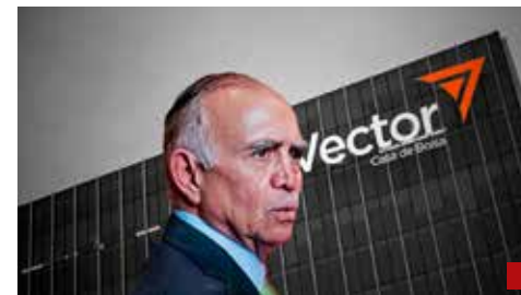
Le revocaron la autorización para seguir operando.

Además, denunciaron que los trabajadores del Capítulo 1000, quienes están bajo condiciones más estables, “cotizan con el mínimo ante el Seguro Social, restando responsabilidad patronal al canal”.