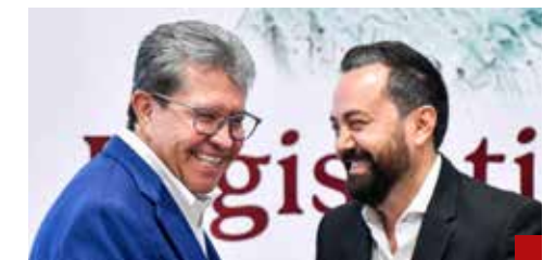
Tiene cercanía con Ricardo Monreal.