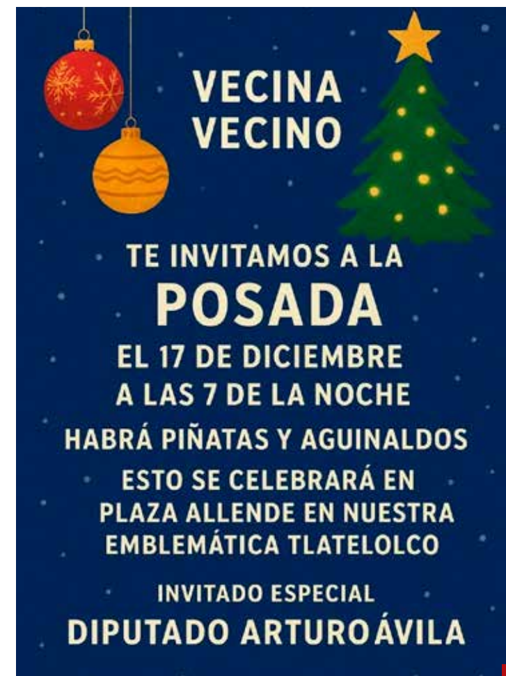
Una invitación con bombo y platillo.