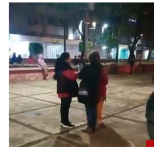
Plantados los vecinos de Tlatelolco.