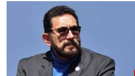
Ulises Lara López, el segundo cargo en importancia de la FGR.