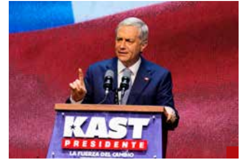
El gobierno chileno de Kast estará más cercano a los intereses de Estados Unidos.

Setenta y seis años después de su fundación, la China actual parece casi opuesta a la nación que concibieron los fundadores del PCCh.