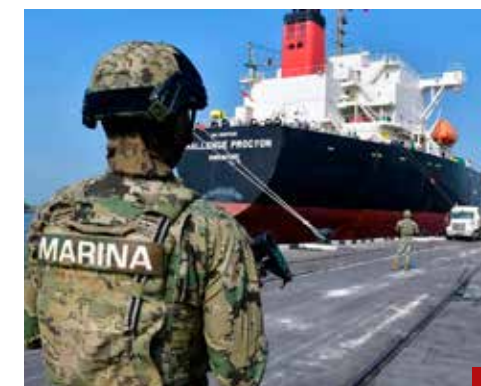
El huachicol fiscal es sólo una parte.