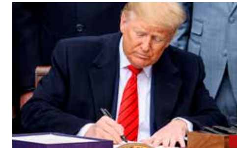
La posibilidad de retirada, un instrumento concreto de coacción política.