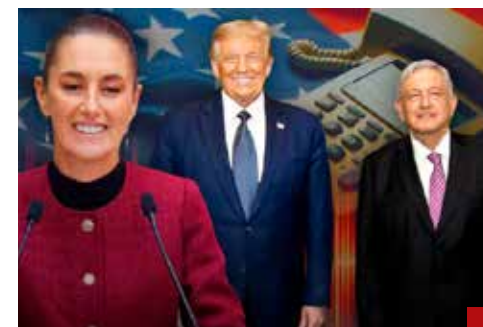
La disyuntiva de la Primera Presidenta.