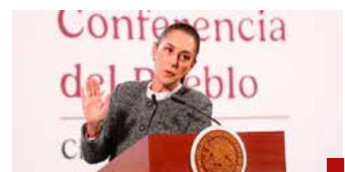
La Primera Presidenta ha enfatizado que NO a la reelección.