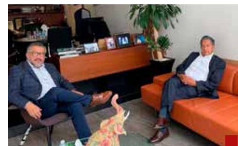
Duelo de titanes.