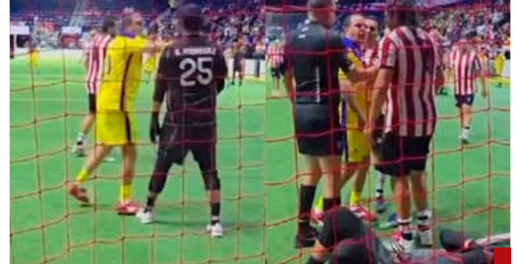
Si eso hace públicamente, ¿qué será en privado?

Piedad y compasión es lo que piden los habitantes de esa entidad. La indulgencia debiera ser obtenida por el mandatario al recibir la noticia de que un sobrino suyo está detenido en Estados Unidos por tráfico de drogas, confeso por cierto. Y, sin duda, agradecer la benevolencia de que su hijo delegado del Bienestar en Coahuila haya sido bendecido con la indulgencia de no estar sujeto a una investigación por el manejo de los recursos. A eso se le llama clemencia... Algo deben tener los alimentos para fortalecer a individuos bañados en suerte y tolerancia. Vea usted, estimado lector, Cuauhtémoc Blanco cínicamente pregona: Coma frutas y verduras. Especialista en insultos, golpes y ofensas hizo gala de la prepotencia que es una vestimenta formal. Durante un