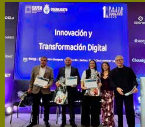
Reconocimiento a la Plataforma Tlalnepantla.

territorial inteligente. En conclusión, la Plataforma Tlalnepantla ha logrado verticalidad, haciendo que la información fluya sin obstáculos desde el nivel operativo hasta la dirección", comentó.