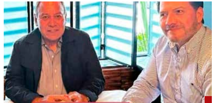
Buscan incrustarse en un nuevo partido político.

Cuando la ambición no tiene medida, es difícil encontrar un remedio.