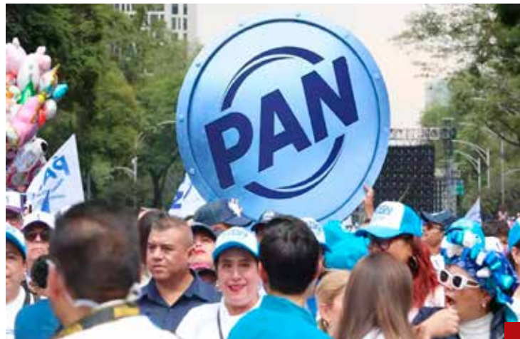
Se abren las candidaturas del PAN a toda la ciudadanía.