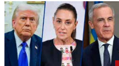
Trump intenta convertir el tratado en un instrumento de subordinación explícita.