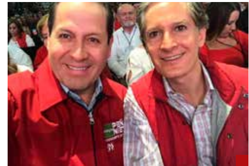
Perdonados por el manto guinda.