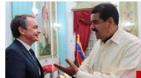
José Luis Rodríguez Zapatero y Nicolás Maduro, en la mira del Tío Sam.

Esperamos que la Primera Mandataria, con su inteligencia y habilidad política, pueda salir adelante del enorme reto que enfrenta contra estos dos “Tigres”. Por el bien de México, que así sea.