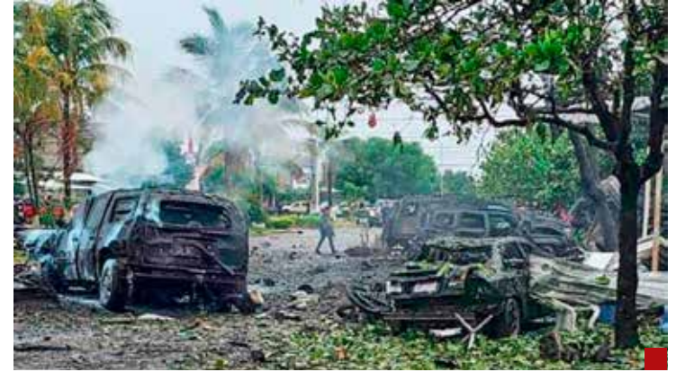
Hay “focos rojos” encendidos en varios estados y municipios.

La titular de la Fiscalía General de la República (FGR), Ernestina Godoy Ramos, señala que la Estrategia Nacional de Seguridad requiere de la coordinación permanente con las Fiscalías de todos los estados.