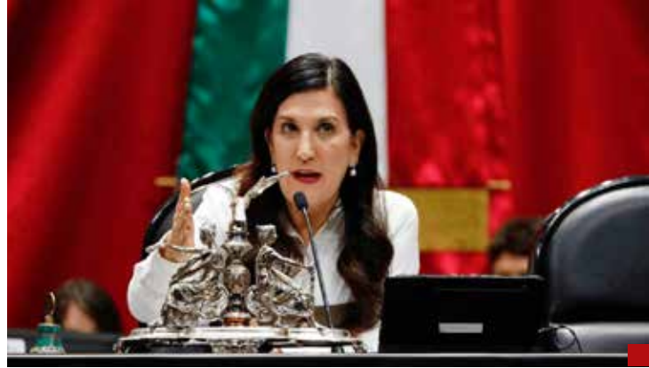
Kenia López Rabadán, candidata presidencial.

las Asambleas Municipales y ratificados por Asambleas Estatales.