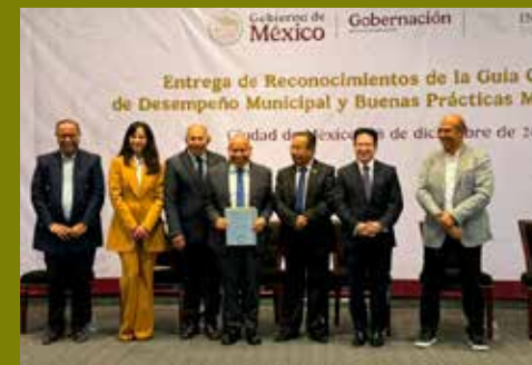
Distinción por cumplir con la "Guía Consultiva de Desempeño Municipal 2025-2027".

Estos premios tienen el objetivo de reconocer y estimular la instrumentación de políticas públicas, planes, programas y acciones gubernamentales diseñados por las administraciones públicas municipales del Estado de México, encaminadas a fortalecer sus capacidades institucionales e impactar de manera positiva en el nivel de vida de los habitantes de sus respectivos municipios.