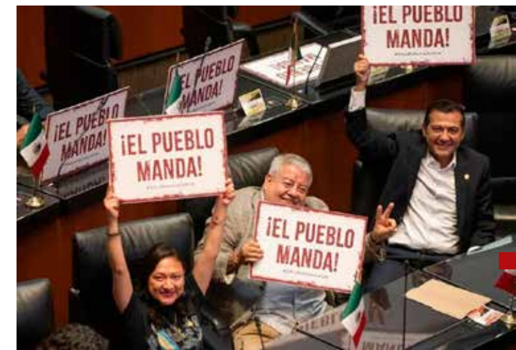
¿Realmente el pueblo gobierna?