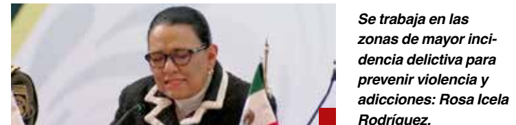
Se trabaja en las zonas de mayor incidencia delictiva para prevenir violencia y adicciones: Rosa Icela Rodríguez.