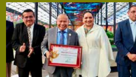
Premio al Mérito Ambiental.

"Respecto a los beneficios concretos que hemos obtenido, podemos destacar impactos transformadores como la eficiencia operativa y ahorro de tiempo, toma de decisiones basada en datos; transparencia y seguridad reforzadas; mejora en los servicios públicos; y gestión