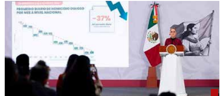
La Primera Presidenta afirma que se han reducido en 37% los homicidios dolosos.