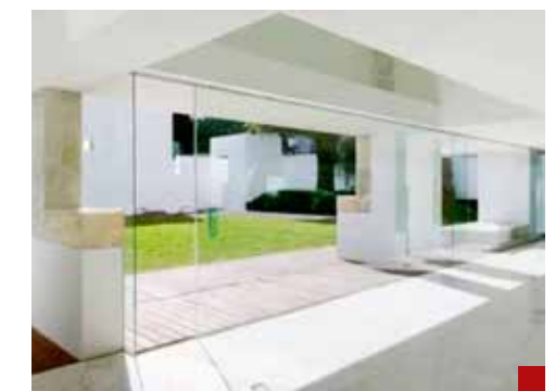
Es de risa la Casa Blanca comparado con los escándalos de corrupción de la 4T.