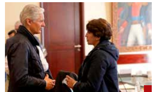
La gobernadora incumple con su promesa de llevarlo ante la justicia.