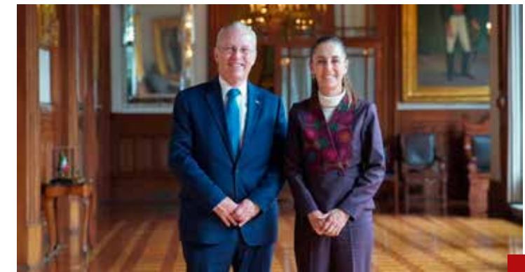
Relación institucional con la iniciativa privada.

Dice la Presidenta que no pueden regresar a “ese pasado”, sin ver cuánto daño hacen en este presente.