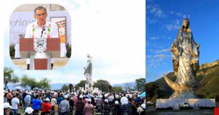
Un hecho sorprendente de Américo Villarreal.

Senadores mantiene 21 escaños, lo que lo posiciona como una de las principales fuerzas opositoras dentro del Congreso de la Unión.