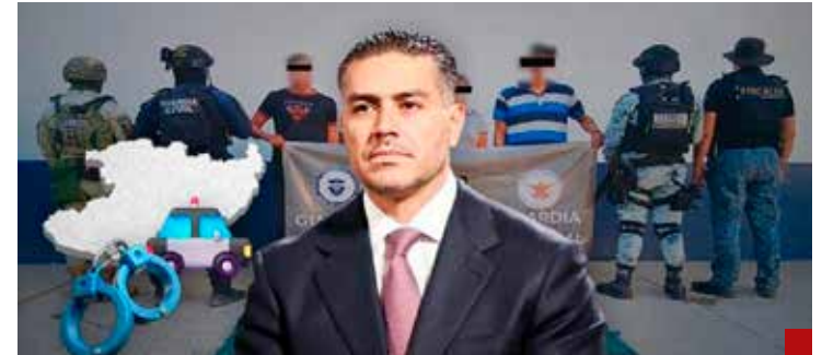
Omar García Harfuch reporta la detención de más de 38 mil 700 personas por delitos de alto impacto en los primeros 14 meses de gobierno.