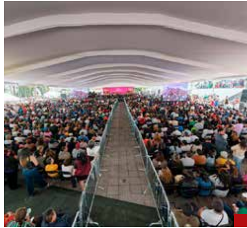
Al evento asistió el pueblo para ser testigo de las Huellas de la Transformación en Naucalpan.