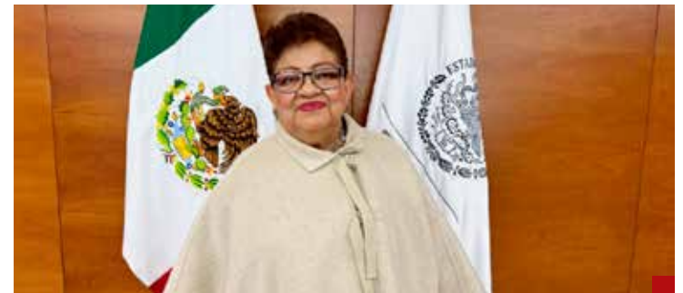
Por una Fiscalía que defienda los intereses de mexicanos.