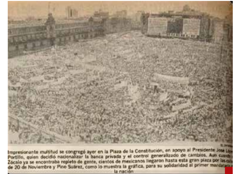
La catastrófica nacionalización de la banca fue forzosamente apoyada por la burocracia.

dad operativa en áreas críticas como urgencias, terapia intensiva y quirófanos.