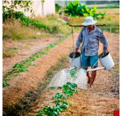
En 2020, el sector agropecuario tuvo 76% del total de agua concesionada para riego de cultivos y ganadería.