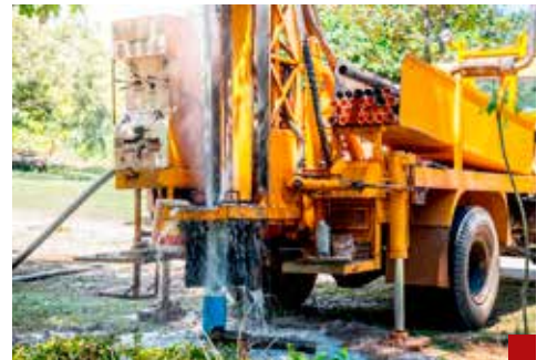
Los acuíferos en México se encuentran en riesgo de sobreexplotación.