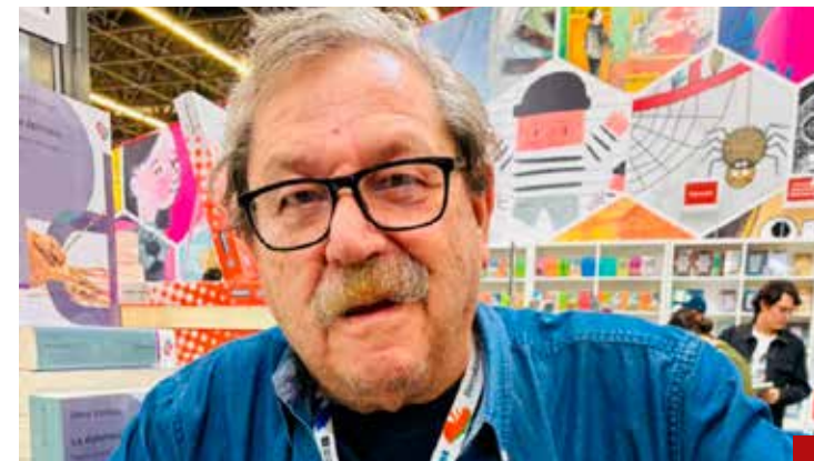
Paco Ignacio Taibo II festina la reaparición del exinquilino de Palacio Nacional.