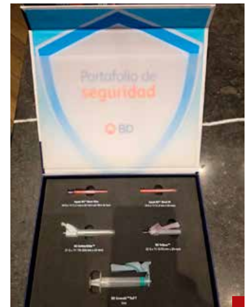
La introducción de dispositivos de agujas de seguridad se asocia con una reducción del 70% en el número de lesiones por pinchazos con aguja.