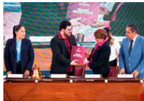
El presidente municipal entregó a la mandataria mexiquense el primer informe de resultados.

Reitera que en este primer año de la administración 2025-2027, se impulsó un Plan de Obra Pública con una inversión histórica e inédita de más de mil millones de pesos, la Estrategia de Seguridad con Todo encabezada por una Guardia Municipal de proximidad; un Plan Hídrico en marcha impulsando una reingeniería del agua y diversas acciones, operativos para recuperar espacios y programas que dejaron más de 50 Huellas de la Transformación en todas las comunidades.