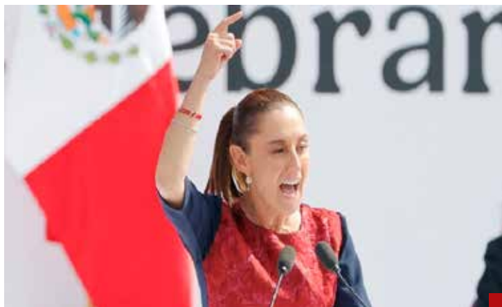
Desoyen la instrucción presidencial.

Por lo visto, y ante los hechos, funcionarios de la 4T mandan al carajo la instrucción presidencial.