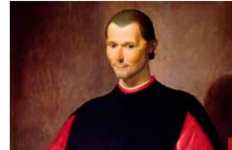
Para Maquiavelo, el poder es una fuerza que se ejerce y no se comparte.

AMLO convirtió los programas sociales -que ya existían- en moneda de cambio