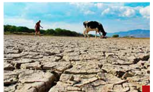
México es un país vulnerable a sequías.