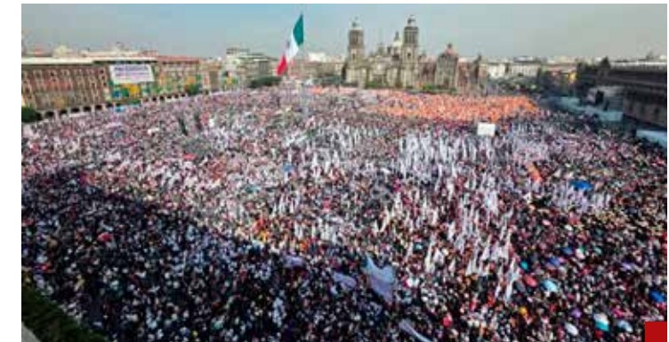
La 4T también busca legitimarse ante sus huestes mediante el acarreo de alquilerados adeptos.