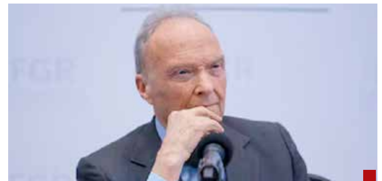
Se va Gertz Manero sin transparencia, con múltiples dudas, severos cuestionamientos y sin haber rendido cuentas de su gestión.