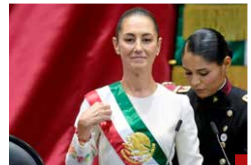
Es de orgullo tener la Primera Presidenta.

Queremos una lideresa como Angela Merkel, quien llevó a Alemania a ser la primera potencia económica de la Unión Europea. No queremos una Crisistina Kirchner, quien hundió a su país. Queremos a México ubicado en la moderna grandeza, como una de las diez mejores economías del mundo. La auténtica transformación debe comenzar ya. Queremos ver un solo rostro en la Presidencia. Que nos gobierne Claudia y NO ClaudicAndrés.