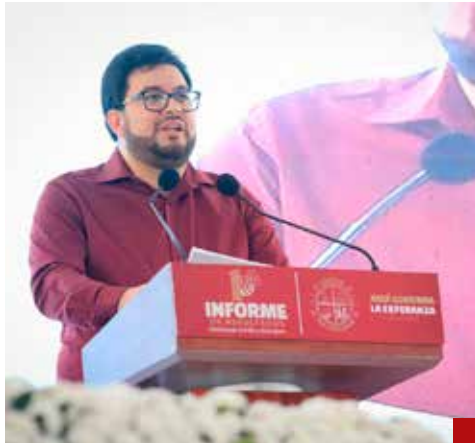
Con el Plan Hídrico se garantiza el derecho humano al agua en todas las comunidades.

de 7 millones 518 mil pesos, retirando más de mil toneladas de azolve y rehabilitando infraestructura afectada por fallas sanitarias y socavones, en beneficio de cerca de 70 mil habitantes. Lo que, subrayó permitió evitar inundaciones y afectaciones, a pesar de ser uno de los años más lluviosos de la historia, conforme a los registros de Conagua desde 1961.