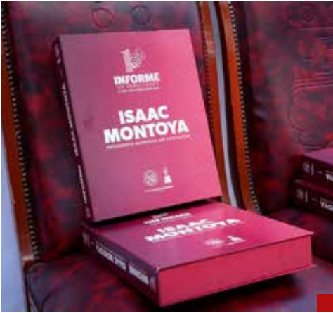
Es un primer informe de resultados del presidente municipal de Naucalpan.