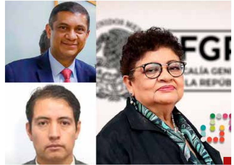
Más cambios importantes en la FGR.

En suma: Ernestina Godoy va por una Fiscalía que defienda los intereses del país, a las víctimas y sancione a los infractores de la ley.