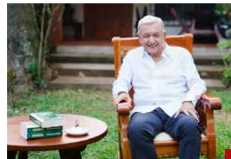
Se siente el único salvador del país.

La titular del Poder Ejecutivo -en sus intervenciones públicas- repite en cada oportunidad los “grandes logros” de AMLO. El sábado 6 de diciembre de 2025, durante la celebración de “Siete años de transformación”, destacó lo mismo que AMLO presumió en su video recientemente