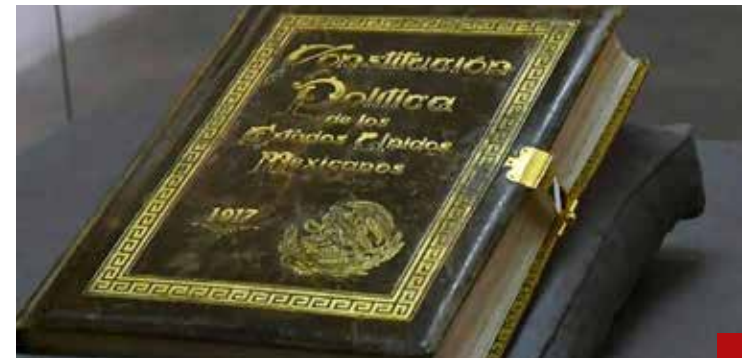
Respeto absoluto a la ley por la Constitución Política de los Estados Unidos Mexicanos.