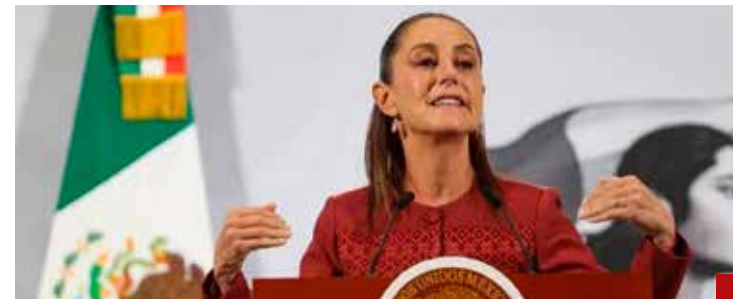
La Primera Presidenta descalifica al exmandatario.

Obvio que la quema de incienso está más que justificada, noticia sería que emitieran juicios críticos sobre el desastre que se deriva en el sector salud, el incremento del huachicol fiscal, las fortunas económicas estratosféricas gastadas en las megaobras, las muertes generadas por la errática política aplicada durante el Covid-19, el fraude en