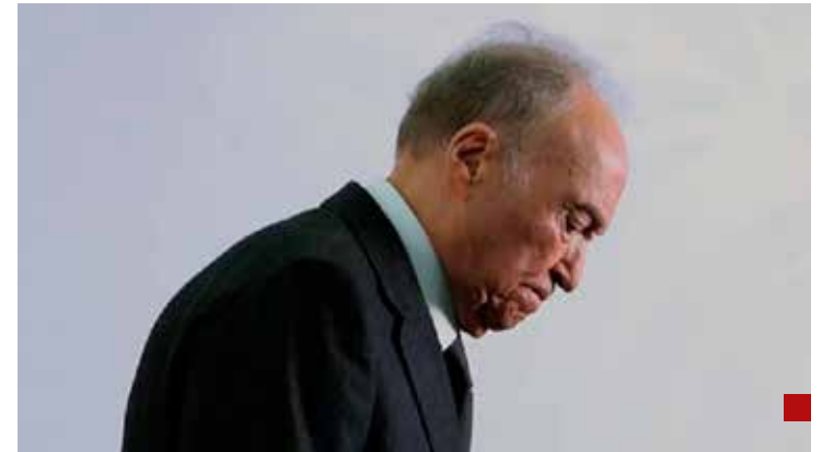
Le cerraron el paso sin margen de maniobra.