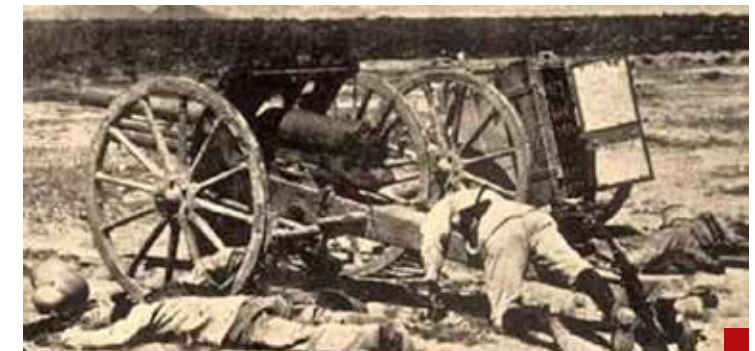
La Revolución Mexicana y su millón de muertos.