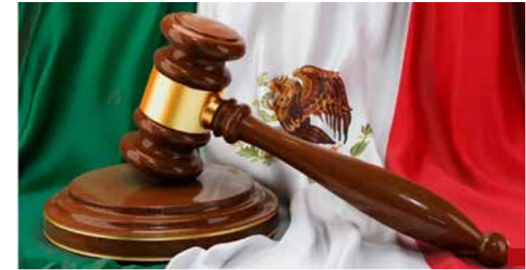
Reforma Judicial no da garantías a inversionistas nacionales y extranjeros.