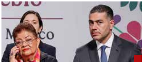
Omar García Harfuch, fortalecido con personas de su total confianza en la Fiscalía General de la República.