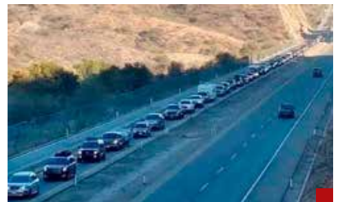
A proteger a los connacionales que vienen a nuestro país por las fiestas de fin de año.