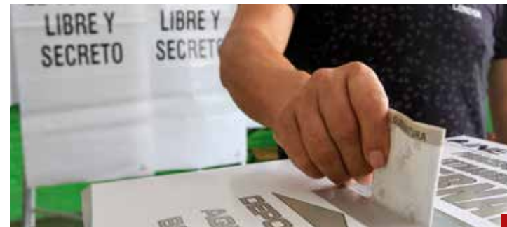
Procesos electorales, dominados por los criminales.