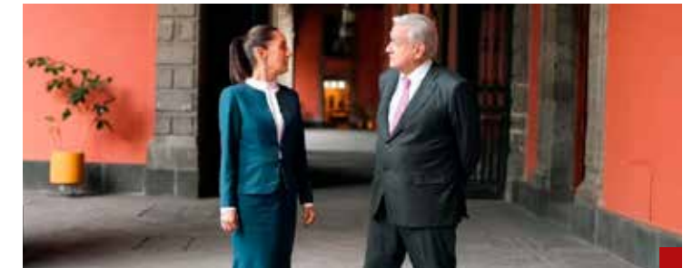
No hay distanciamiento de AMLO con la Primera Presidenta.