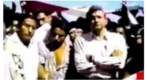
Un ejemplo claro es AMLO, quien de la invasión de pozos petroleros pasó a los plantones, recorridos y levantamientos hasta encumbrarse políticamente.

No es problema menor, porque esos connacionales significan un soporte para la economía mexicana con el envío de remesas que altamente significativas. El Gobierno de la República está a tiempo de tomar medidas para evitar la explotación de quienes arriban a México con el deseo de disfrutar la celebración de la época tradicional. Un reto que debe enfrentarse para protegerlos y, además, evitar abusos.