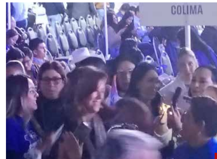
Margarita Zavala llamó la atención durante la Asamblea Nacional del PAN.