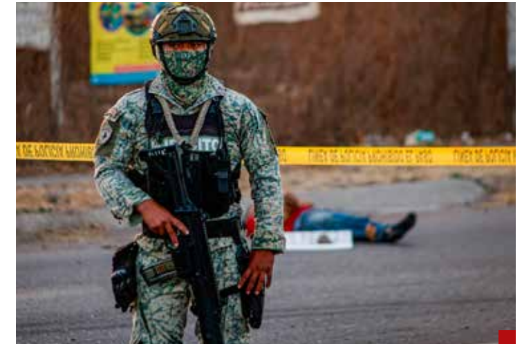
El Estado claudica en su función de dar seguridad y garantizar el respeto a la vida y al patrimonio de los ciudadanos.