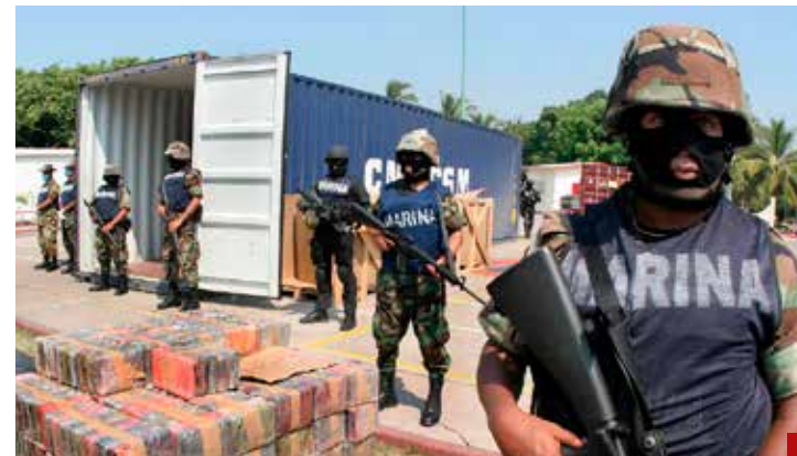
El crimen organizado abarca la trata de personas, tráfico de armas y el lavado de dinero.