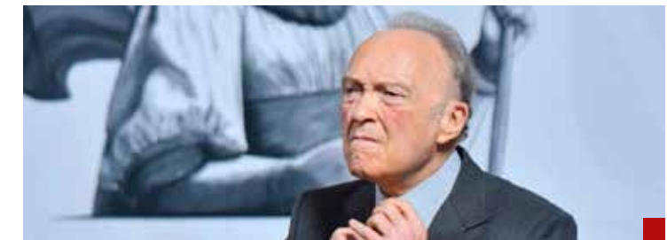
Donald Trump, la explicación al despido de Gertz Manero.

de la República, ratificación de que todo sigue igual, ni poderes, ni órganos autónomos, ni zarandajas: aquí se hace lo que manda presidencia. Mascarada sin disimulos.