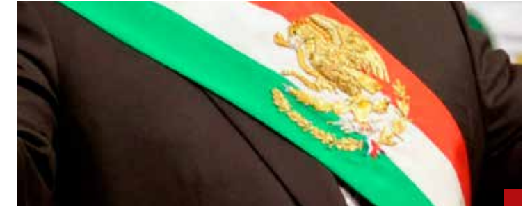
El verdadero soberano es el Presidente de la República.

Bueno, pensará usted, ¿y toda esta parranda a honras de qué?... ¡ah!, es por la salida de Alejandro Gertz Manero de la Fiscalía General