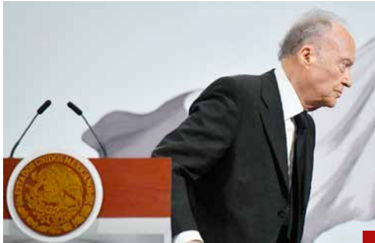
Hubo maniobra para obligarlo a renunciar.

nombró a Ernestina Godoy en el puesto de la FGR, que legalmente corresponde cubrir en interinato la titularidad de la Fiscalía.