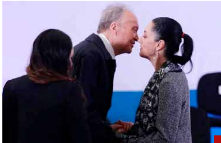
¿Golpe de timón?