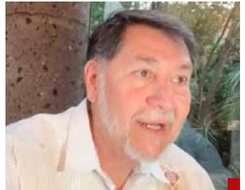
Nadie puede frenar a Gerardo Fernández Noroña.