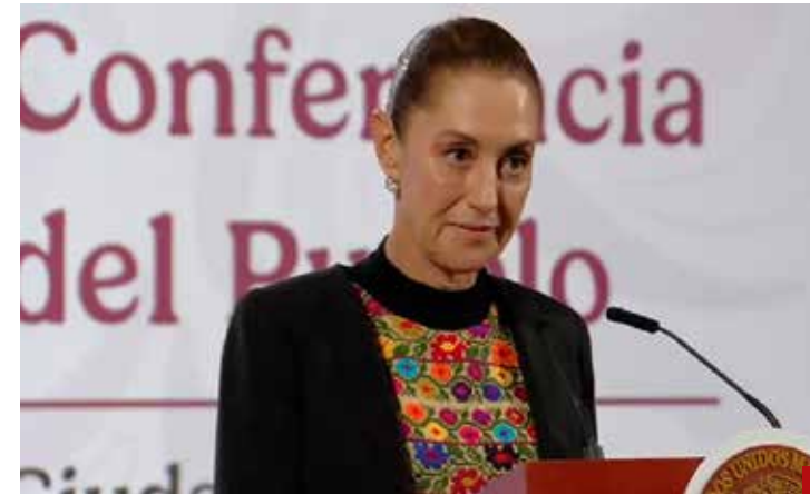
Feliz por la reaparición pública del expresidente AMLO.

Lo que siempre hemos dicho: Vargas del Villar es un hombre de retos y tiene la mira puesta en el 2027 y en el 2029... y el PAN ya está en acción a nivel nacional.