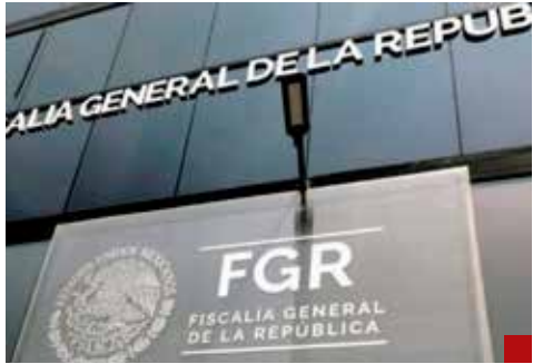
Inicia una nueva etapa en la FGR.