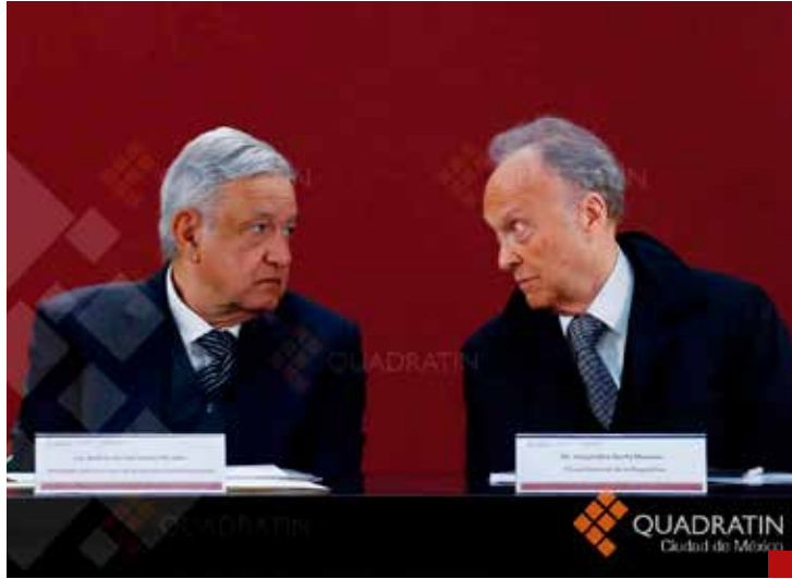
La orden vendría de Palenque, Chiapas.