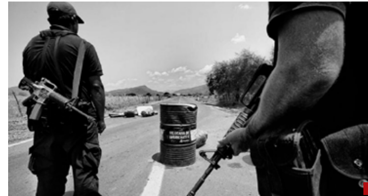
La delincuencia organizada amenaza e intimida.

Por supervivencia, el Estado debe recuperar la gobernabilidad.