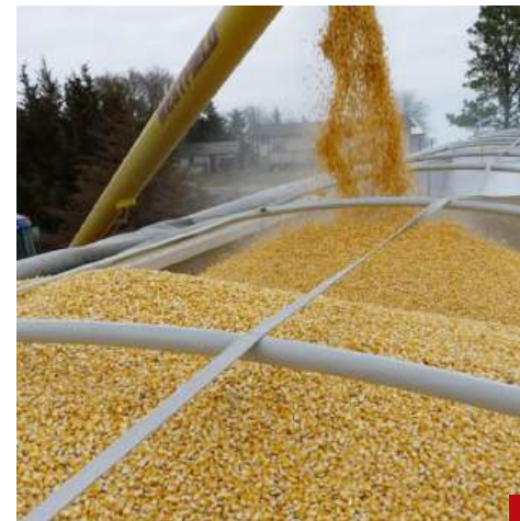
El año pasado el 56% de lo que se consumió fue importado.