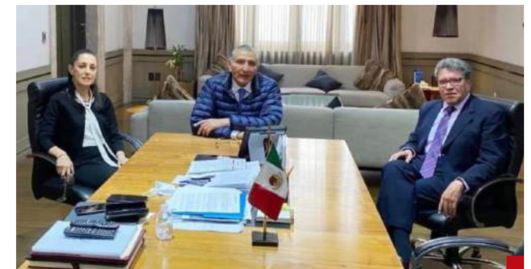
Tuvo que intervenir para poner orden.