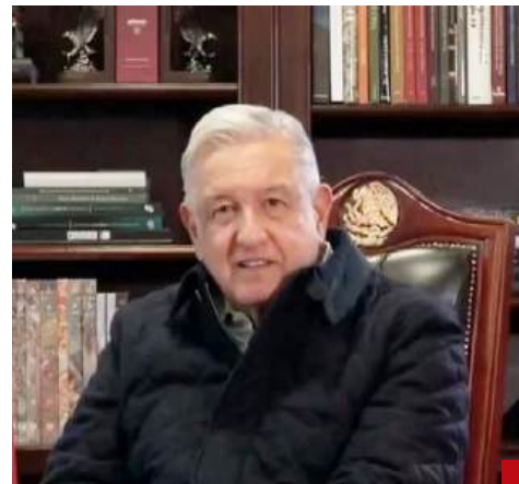
AMLO emitió el decreto publicado el 13 de febrero de 2023 sobre la prohibición del maíz transgénico.

Por supuesto, lo deseable es que los gobernantes tengan moral... bueno, que cuando menos no sean inmorales, amorales y similares.