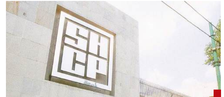
Habrà un mayor control del gobierno con la intervención de la Secretaría de Hacienda y Crédito Público.

Esperemos que el proceso de consulta parlamentaria que llevará a cabo la Cámara de Diputados, en enero de 2025, sea auténtico y que con la participación de sindicatos, empresarios, académicos y especialistas se diluciden todos los aspectos que deban considerarse para la reforma que requiere el Infonavit y anhelan millones de trabajadores.