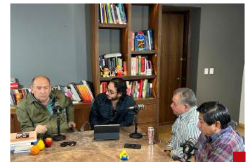
Advierten de posibles impactos en la salud.

El abogado Miguel Sulub coincidió que el Medio Ambiente fue uno de los grandes perdedores en el presupuesto 2025, con una reducción de casi 28 mil millones de pesos, respecto al 2024.