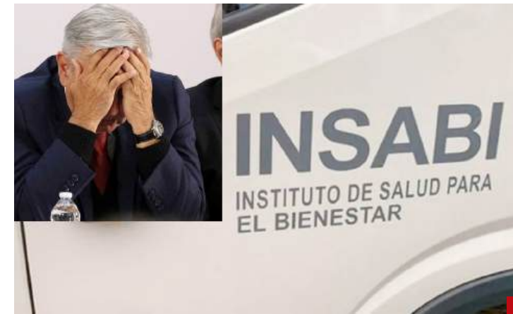
Ponen de pretexto la corrupción para esta reforma... ¿y qué dicen del Insabi?