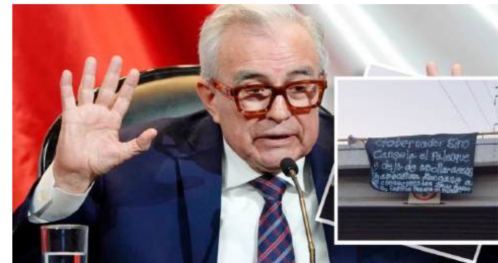
Rubén Rocha Moya, señalado de proteger a narcotraficantes.

Próximamente la Ciudad de México contará con un nuevo fiscal o una