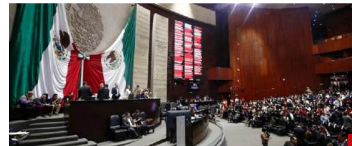
Esperemos que el proceso de consulta parlamentaria que llevará a cabo la Cámara de Diputados, en enero de 2025, sea auténtico.

esto como resultado de deficiencias en el seguimiento a pagos y aplicación de penalizaciones.