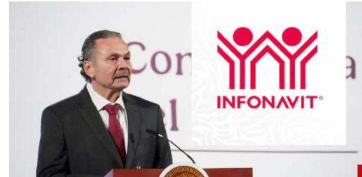
Octavio Romero Oropeza presenta una reforma de gran calado.

Otro caso que ha salido a la luz es el de las viviendas inexistentes del programa Línea III del Infonavit. Se autorizaron 22 proyectos para este programa entre 2017 y 2018, pero nunca se concluyeron y presentan adeudos vencidos con el Infonavit que suman 575 millones de pesos, además de 18 desarrolladores con adeudos por 768 millones de pesos,