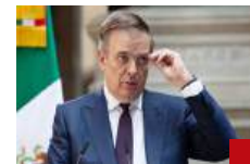
Se va a respetar lo resuelto: Ebrard.