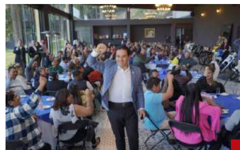
Firme la cercanía con la ciudadanía.

Con estas acciones se gana el respeto y la admiración de la gente, una labor que le garantiza para lograr sus metas profesionales. Honor a quien honor merece.