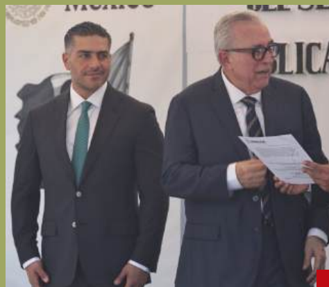
Esfuerzo conjunto para lograr la paz en Sinaloa.

"En la coordinación permanente que sostenemos con las instituciones del gobierno federal, hoy me reuní con el secretario Omar García Harfuch, coordinador de la Estrategia Nacional de Seguridad Pública".