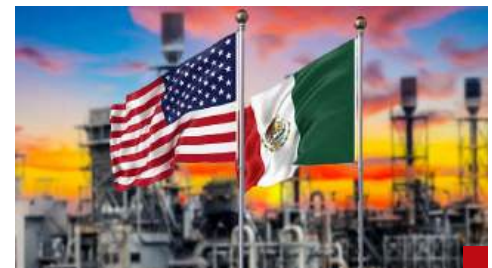
Falta la controversia sobre el sector energético, otro panel que perderemos. Le están regalando balones a Trump.