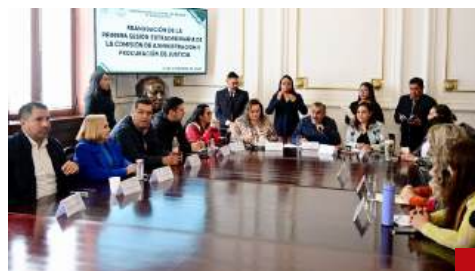
Comisión aprobó dictamen para designación de la persona titular de la FGJ-CDMX.