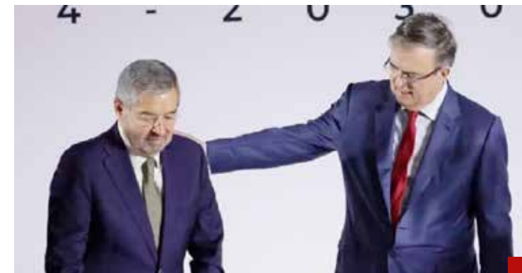
Marcelo Ebrard y Juan Ramón de la Fuente, una dupla de excelencia para la renegociación del T-MEC.