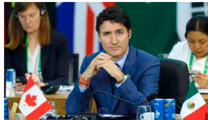
México, excluido del T-MEC, sugerencia de Trudeau.

declaraciones de Justin Trudeau tienen motivaciones electorales.