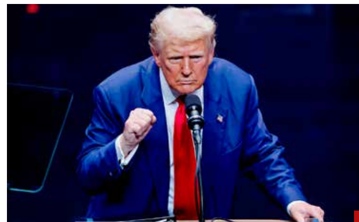
Aranceles, el chantaje de Donald.

La Presidenta Claudia Sheinbaum Pardo sabe perfectamente que las