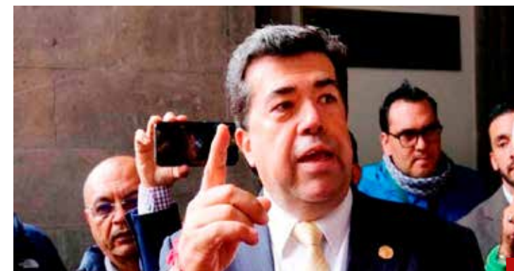
Trabaja por cielo, mar y tierra.