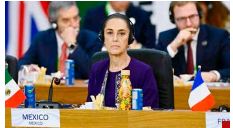
La política internacional mexicana retoma el rumbo