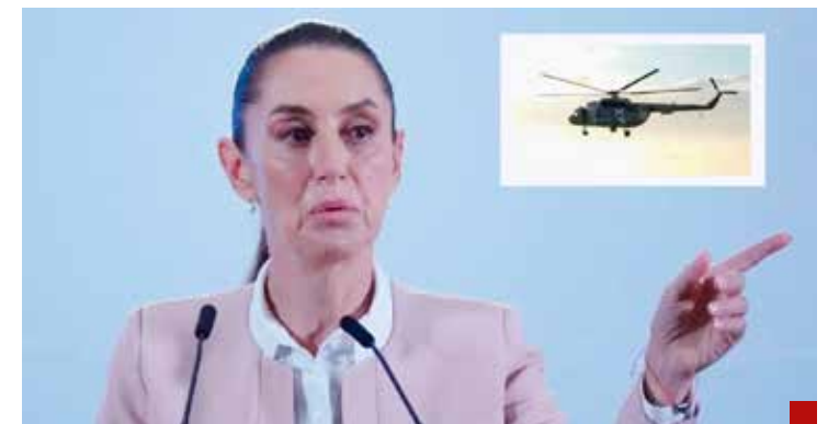
Pone orden hasta con los de la propia casa.

Yáñez se alineó y acató el castigo de su amigo, el entonces presidente electo Andrés Manuel López Obrador.