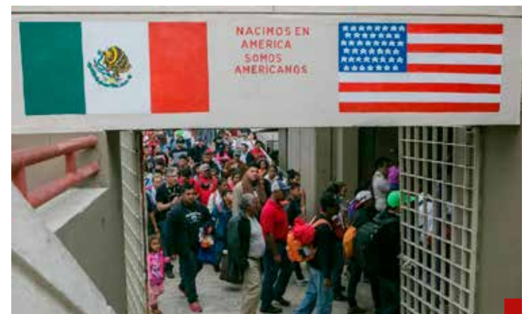
Los inmigrantes mexicanos no son un problema menor.