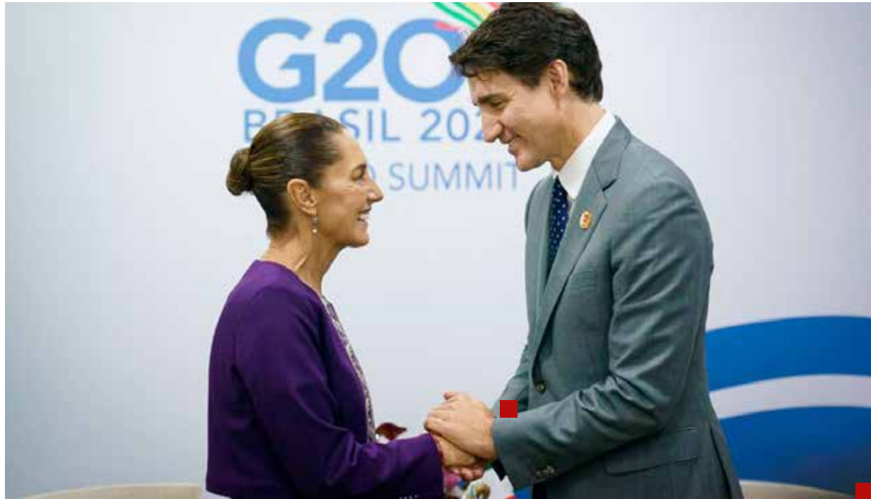
El primer ministro de Canadá recula y dice que están en tiempos electorales.