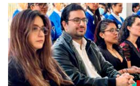
Refrenda su compromiso con quienes depositaron su confianza.

será que Morena no quede en una esperanza, sino que se haga realidad.