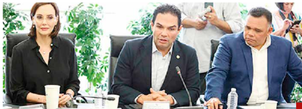
El gasto millonario para elecciones judiciales se debería redirigir a salud, educación y seguridad.

El senador insiste en que se realice un análisis profundo sobre las prioridades del gasto público, sugiriendo que, en lugar de destinar grandes cantidades de recursos a la organización de estas elecciones judiciales, se deberían redirigir esos fondos a áreas que benefician directamente a la población, como salud, educación y seguridad.