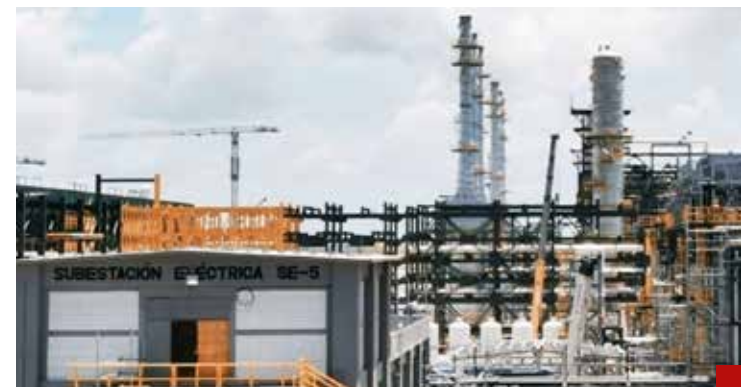
Dos Bocas, un "elefantito" que crece y no tiene para cuándo demostrar rentabilidad.