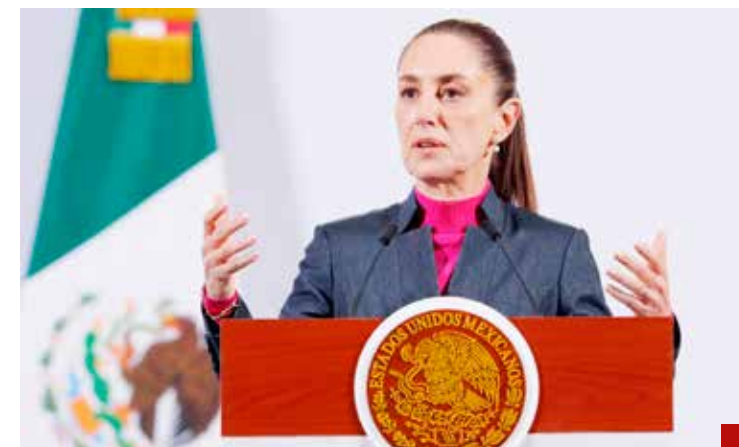
El tratado es muy bueno para los tres países, expresa la Presidenta.

La respuesta de la Presidenta Sheinbaum fue inmediata y oportuna para evitar dudas sobre el tratado "trilateral". La prioridad sigue siendo