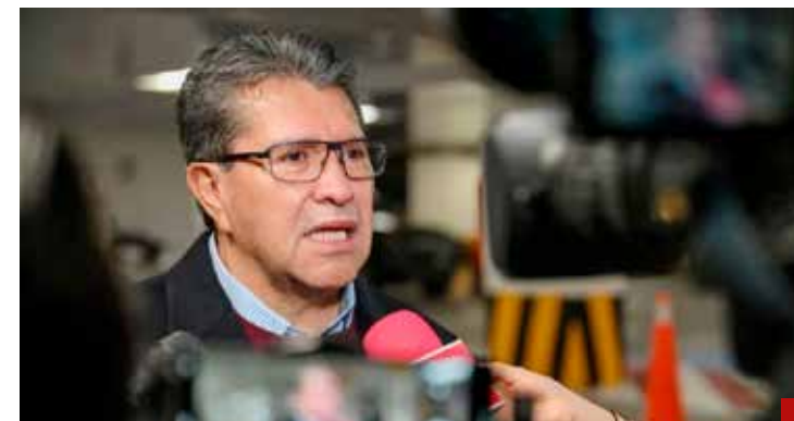
No soy hipócrita, enfatiza Ricardo Monreal Ávila.

Al interior de Morena no son bien vistos, hay desconfianza incluso de parte de la Presidenta Claudia Sheinbaum, y cómo no si Ricardo Monreal, en diversas ocasiones, se ha mostrado en des-