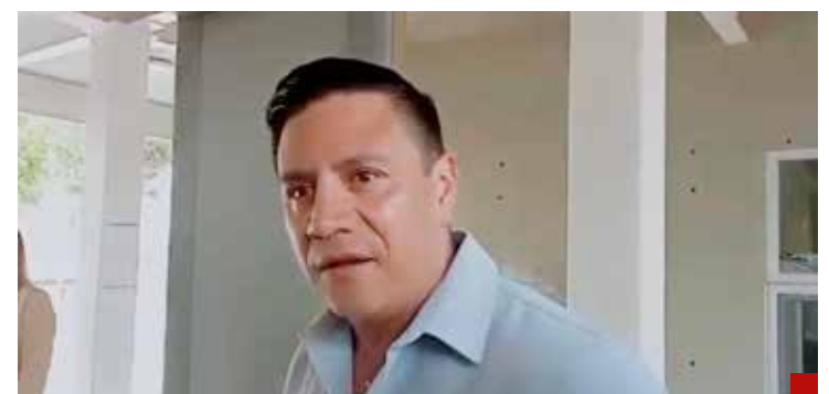
Autoridades judiciales de Morelos ya le pisan los talones a Ulises Bravo.