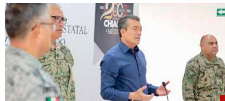
Para Rutilio Escandón no pasa nada en Chiapas.