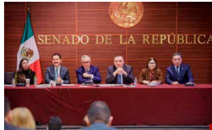
Rocha Moya rechaza renunciar al cargo.