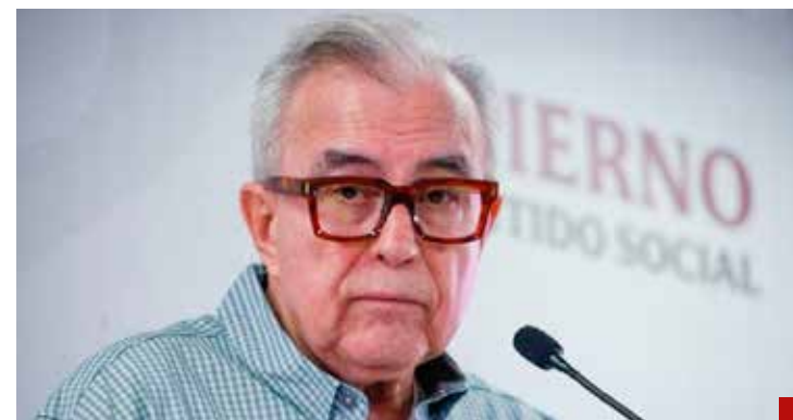
Una sarta de mentiras en la que el personaje principal es el gobernador Rubén Rocha Moya.