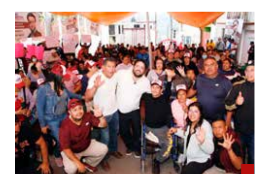
Se combatirá la inseguridad, un clamor ciudadano.

Todo eso se atenderá y finalmente se logrará tener los Tecallis, los cuales serán reconstruidos en el municipio, que han estado abandonados en las pasadas administraciones,