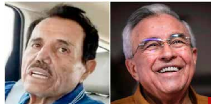
“El Mayo” Zambada puso al descubierto al gobernador Rocha Moya.

El gobernador de Sinaloa recordó que pidió al entonces presidente Andrés Manuel López Obrador y a la Presidenta Claudia Sheinbaum, que el caso lo atrajera la Fiscalía General de la República.