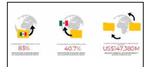
México muestra un superávit comercial.