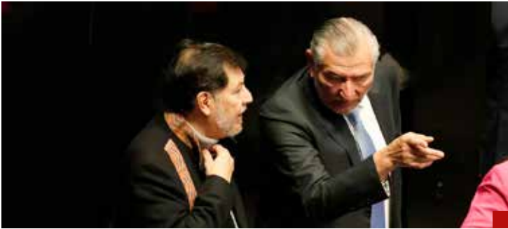
Adán Augusto López maneja a senadores morenistas.

La Constitución Política no será suprema por su carácter de norma fundante, sino que lo será en la medida que se sustente en elementos axiológicos que incidan en la vigencia y protección de los derechos huma-