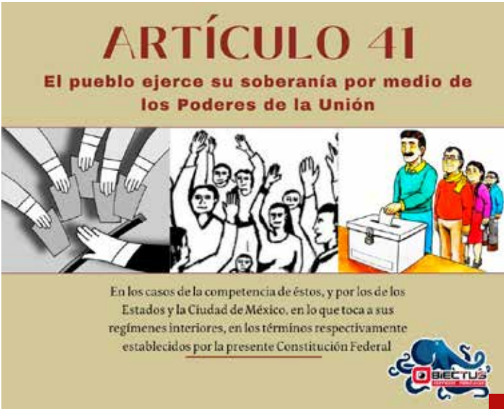
Está establecido que “el pueblo ejerce su soberanía por medio de los Poderes de la Unión”.

nos, armonizados con los criterios internacionales en dicha materia, al tiempo que no se trastoquen los principios fundamentales de la división y equilibrio de Poderes de una república federal, representativa y democrática, como lo establece nuestra Carta Magna en su artículo 40. La “República”