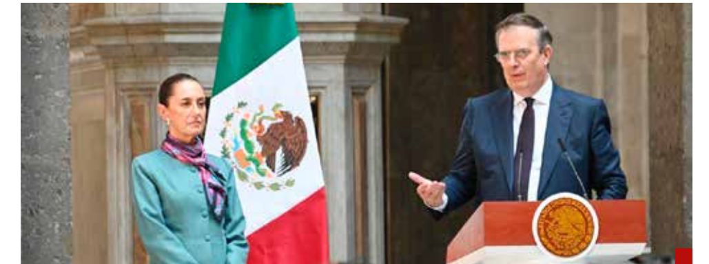
La Presidenta Sheinbaum y el secretario de Economía confirman que México es el lugar ideal para las inversiones.