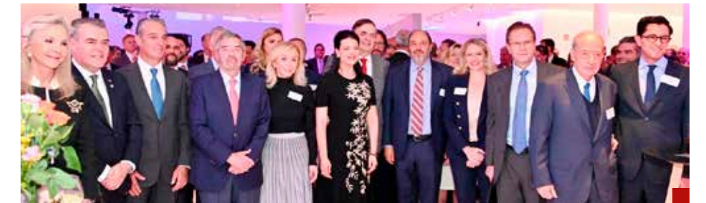
Se inicia el camino para una revisión exitosa del T-MEC.