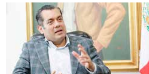
Condenan la actuación unilateral e ilegal del presidente de la Cámara de Diputados, Sergio Gutiérrez Luna.

La bancada naranja hace un llamado categórico para que se detenga este clima de hostigamiento y desprestigio en contra del Poder Judicial, y que no se use la representación plural del Congreso para validar estos ataques, enfatiza Ivonne Ortega Pacheco.