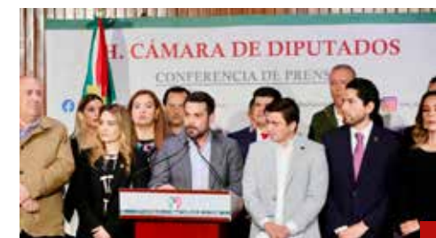
Presentarán un Presupuesto alterno.

En tanto, Rubén Moreira pidió a Morena y a sus aliados que en la discusión del Presupuesto de Egresos 2025 incluyan en el debate a la oposición para que conozcan sus propuestas, “pues queremos que se garanticen los recursos para carreteras, programas sociales, salud, educación y crecimiento económico”.