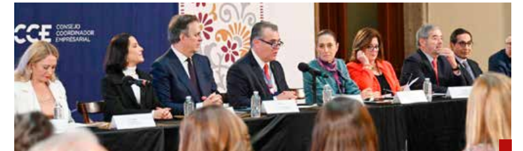
El CEO Dialogue reunió a hombres de negocios del Consejo Coordinador Empresarial y de la Cámara de Comercio de Estados Unidos.

Vale la pena destacar que, México se mantuvo como el principal proveedor de vehículos y autopartes, equipo mecánico, equipo médico; así como el segundo mayor proveedor de aparatos eléctricos, combustibles minerales y muebles.