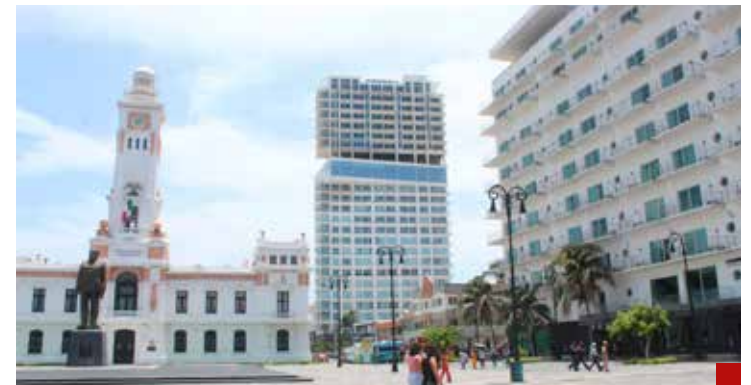
Adefesio, el calificativo para bautizar a la Torre Centro.