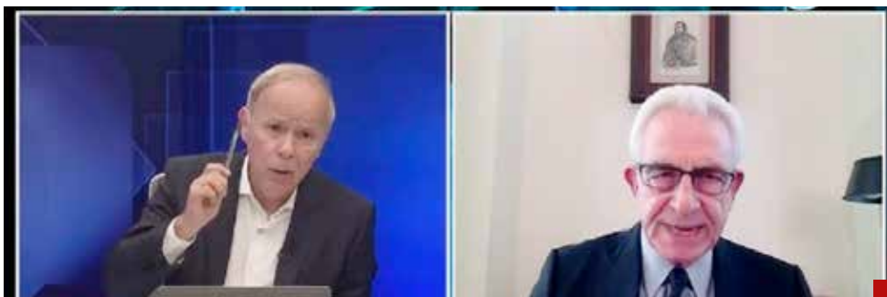
Advirtió Zedillo que los Poderes Ejecutivo y Legislativo controlarán la justicia en nuestro país.

El expresidente calificó la reforma judicial como una "felonía histórica" y a sus promotores de la 4T como "antipatrias".