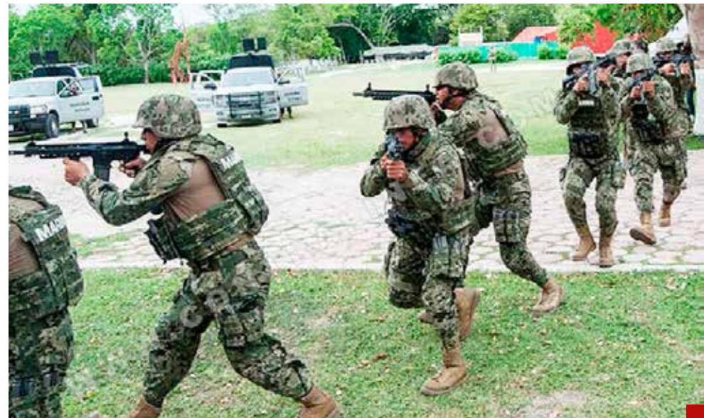
Preocupante la militarización del país.