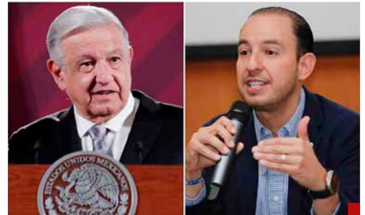
Marko Cortés se llenó la boca cuando afirmó que López Obrador incumplió sus promesas.