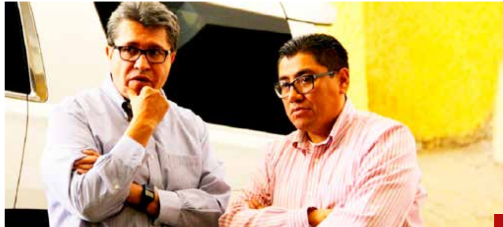
Una dupla fuerte en la Cámara Baja.