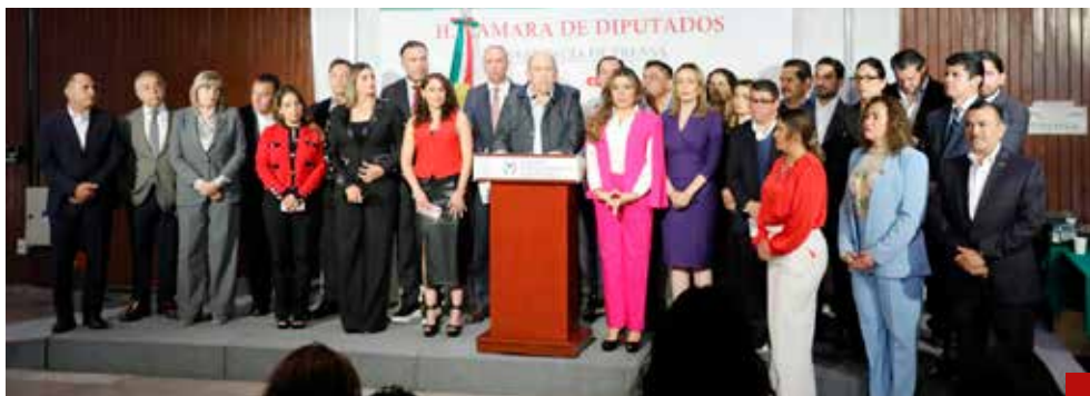
La reforma representa un retroceso, expresan los priistas.

“Esta reforma no solo contradice los acuerdos que alcanzamos en 2019 y 2022, sino que representa un retroceso. Los que están a favor de esto, tomarán otra mala decisión que desfigurará aún más el rostro de la seguridad en México por generaciones”, sentenció.