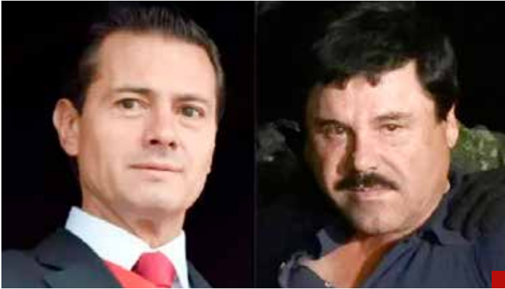
Enrique Peña Nieto detuvo al 'Chapo' Guzmán.