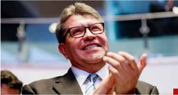
En 2021, Ricardo Monreal, líder del Senado, mostraba sensatez y espíritu de conciliación.