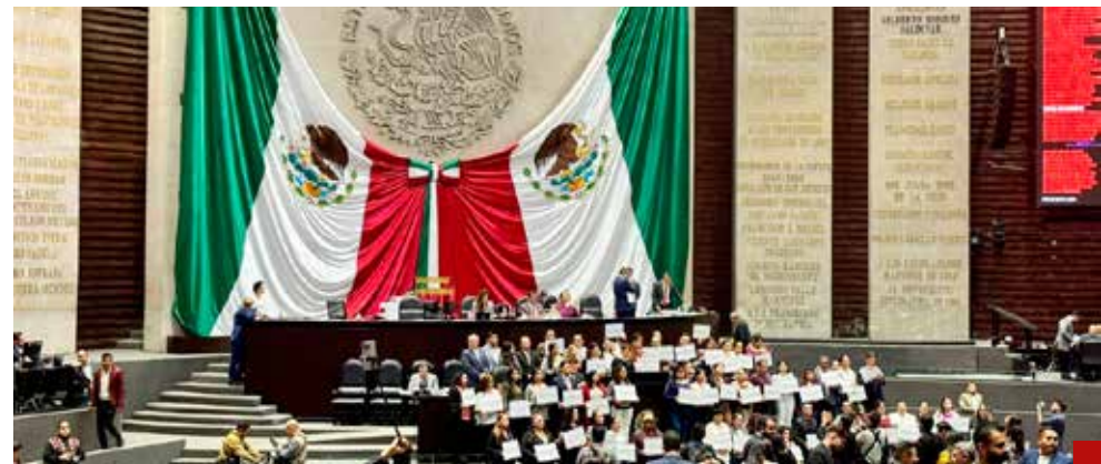
Las reformas constitucionales del Poder Judicial y de la Guardia Nacional atentan contra el régimen democrático.

Con excepción de la CDMX, en todo el país los resultados están a la vista. Cifras récord de casi 200 mil homicidios y de 60 mil desaparecidos; expansión de los grandes cárteles de la droga y pulverización de los grupos de la delincuencia organizada, con incrementos en delitos como el cobro de piso que afectan a la población de muchos sectores sociales y económicos. Además, un creciente número de levantamientos de jóvenes