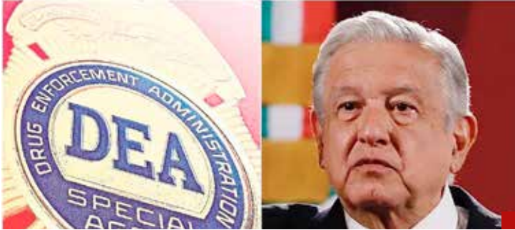
El Presidente expulsó a la DEA de México.