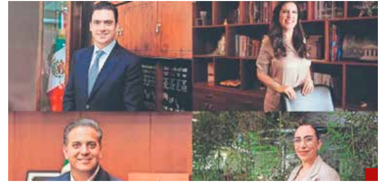
Damián Zepeda, Adriana Dávila y Kenia López Rabadán piden la renovación del partido.

Todo indica que Caty Monreal y sus promotores deberán esperar 3 años más para buscar colocarse en esa posición... Tras un larguísimo silencio, el expresidente Ernesto Zedillo Ponce de León abrió la boca y con sus declaraciones desató una tormenta. Parece haber olvidado que fue él quien validó el proceso para que Andrés Manuel López Obrador fuera jefe de Gobierno en la Ciudad de México, a pesar de que su credencial de elector lo daba como residente en el estado de Tabasco. Un arrepentimiento tardío.