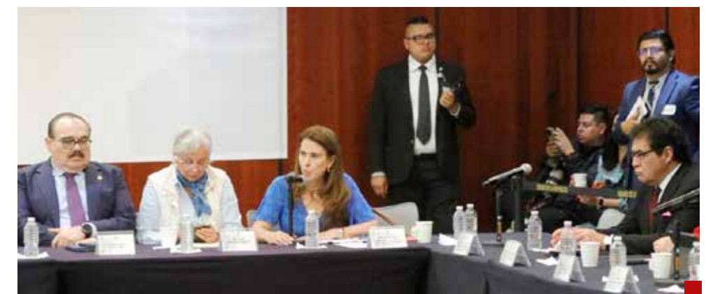
El sistema de justicia no es sólo el Poder Judicial, también es el ministerio público, los defensores públicos, las instituciones de reinserción social y más: Viggiano Austria.

SOMOS UNA EMPRESA 100% MEXICANA ENFOCADA AL RECICLAJE DE PET