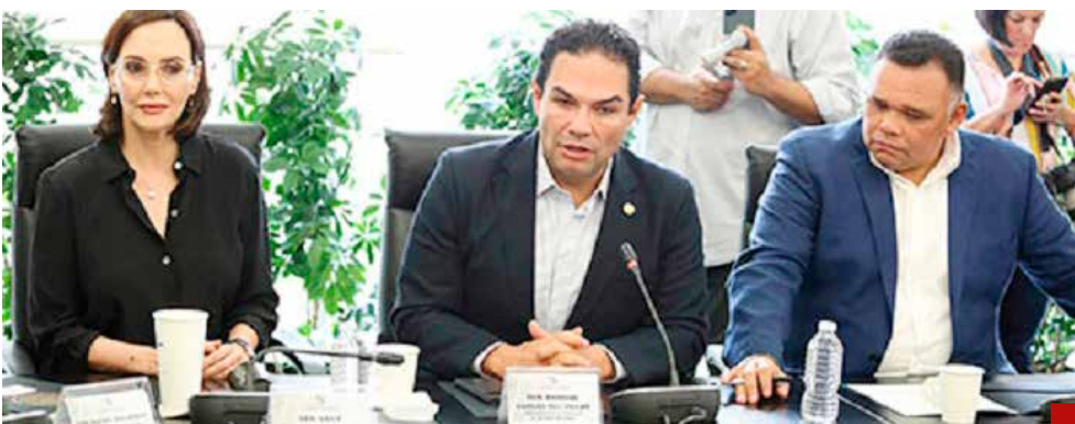
En defensa de mexiquenses y mexicanos.

ticipación en los debates legislativos y en la defensa de los intereses de los ciudadanos del Estado de México.