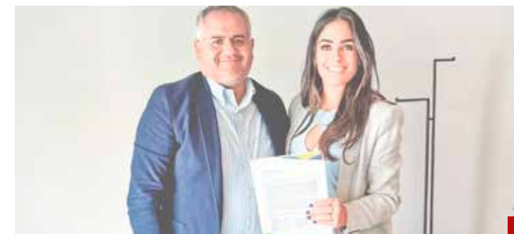
Se reinician los trabajos de transición.