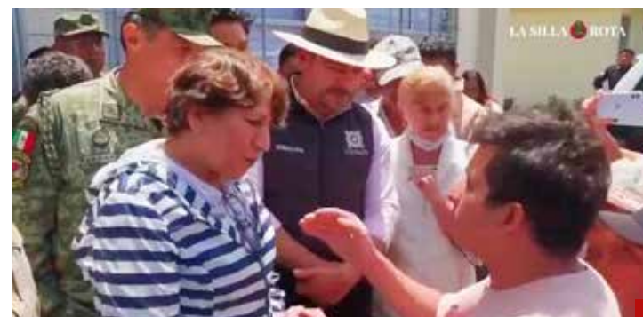
“El PRI, que es más rata que ustedes, nos daba solución”, expresan los afectados.