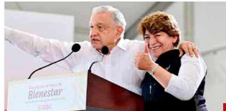
El Presidente y la gobernadora se lavan las manos.