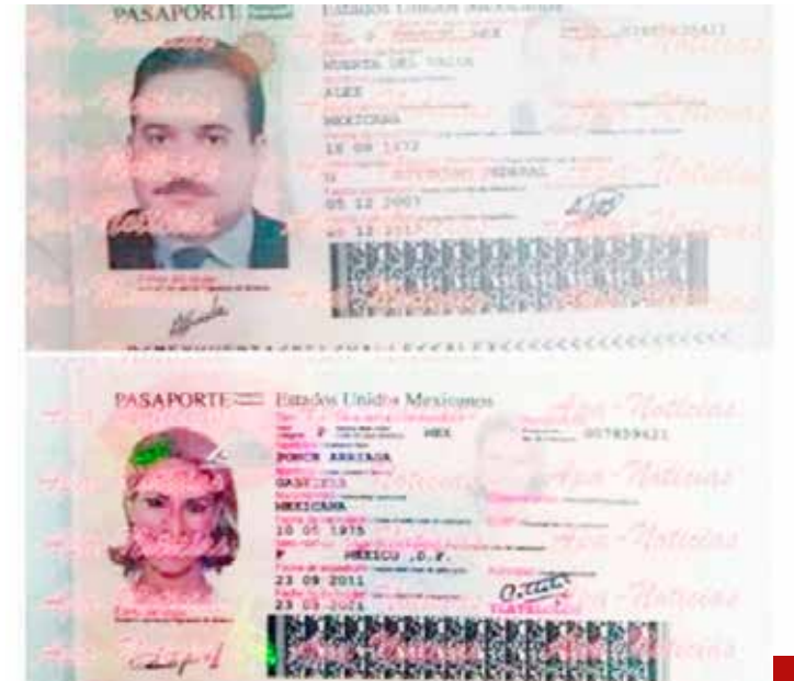
Escaparon del país con pasaporte falso.

El pretexto fue la Reforma Judicial de la que quién sabe qué tanto conozca y entienda el tamaulipeco dirigente del Ejército Zapatista de Liberación Nacional (EZLN) que estuvo oculto durante mucho tiempo y que ahora quiere volver a los contenidos periodísticos.