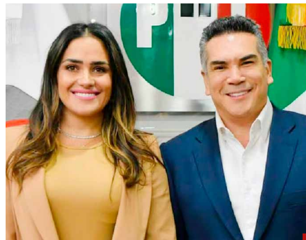
El PRI exige respeto a la decisión democrática en favor de Rojo de la Vega.