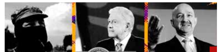
Subcomandante Marcos compara a AMLO con Carlos Salinas de Gortari.