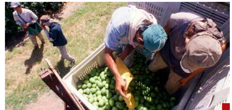
El crimen organizado aumentó el llamado “impuesto criminal” al kilo de limón.