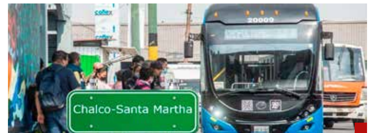
El Trolebús Chalco- Santa Martha ha provocado más hundimientos.