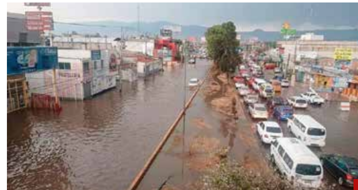
La pesadilla inició el 26 de julio pasado.

Pues bien, todo indica que las inundaciones de aguas negras, que antes no sucedía, obedecen no sólo a lo añejo del Colector Solidaridad, sino a los daños que han causado los trabajos del Trolebús, obra estratégica del Presidente Andrés Manuel López Obrador.