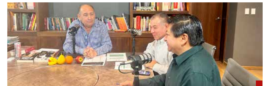
Señalan que la Guardia Nacional no puede con la problemática.