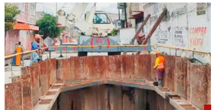
Ya es añejo el Colector Solidaridad.