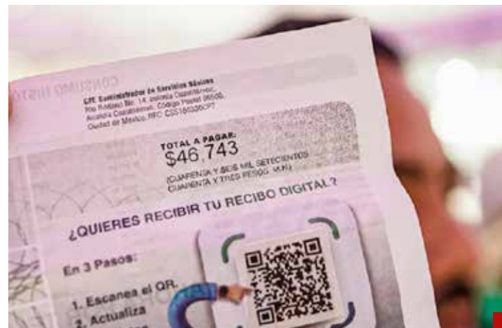
Los cobros inexistentes van desde los 5 mil hasta los 50 mil pesos.