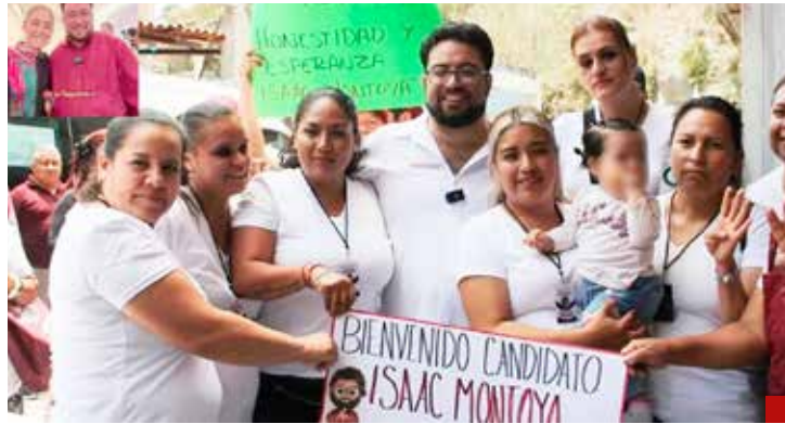
Mi gobierno llevará la esperanza a la realidad, afirma el alcalde electo de Naucalpan.

que va a tomar decisiones acertadas, es muy reflexiva, muy analítica y una mujer comprometida con lo mejor de nuestro pueblo. Nos da mucha tranquilidad que va a ser un ejemplo a nivel mundial, y sea quien sea que quede en Estados Unidos se las va a tener que ver con Claudia Sheinbaum”.