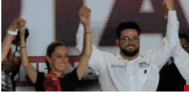
Claudia Sheinbaum, una presidenta que tomará decisiones acertadas.

“Es una mujer capaz, científica, preparada, sensible, de lucha social, digna, y que conoce el país también como el Presidente, que ha sido congruente y consecuente con la lucha social y política, siempre del lado del movimiento y va a garantizar un gobierno de indicadores, un gobierno que bajo una lógica científica habrá de darle este respaldo a la Cuarta Transformación y a Morena para que sigamos adelante en nuestros grandes proyectos, pero habrá que gobernar para todos los mexicanos sin distingo, clases medias, altas, bajas, todos van a estar incorporados en este gran proyecto. Repito, una doctora, una científica