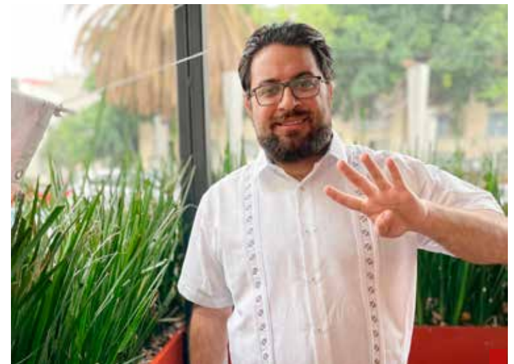
‘El pueblo mandató que se consolide el segundo piso de la Cuarta Transformación’