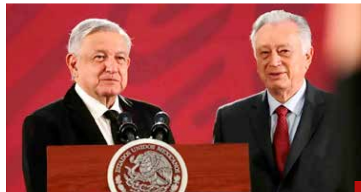
Manuel Bartlett Díaz, cobijado en las filas de Morena.