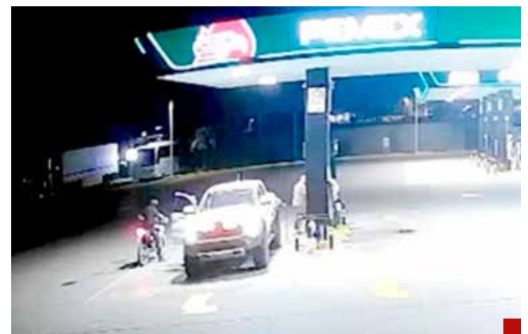
La carta desmiente la versión oficial.