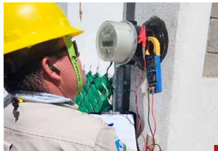
La meta: Recaudar millones de pesos a expensas de los usuarios.