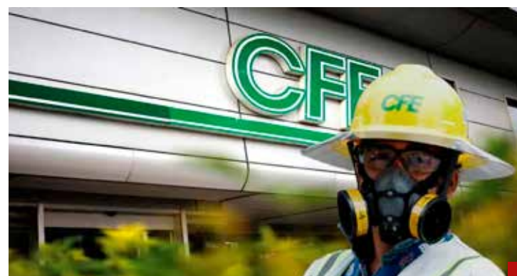
Los empleados no se mandan solos: Reciben órdenes de sus superiores.