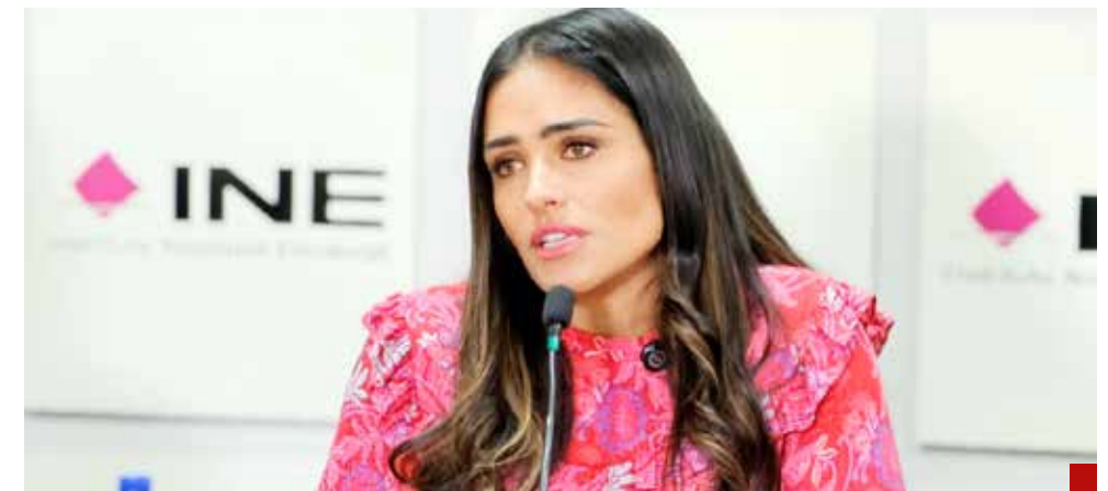
Bajo advertencia no hay engaño.