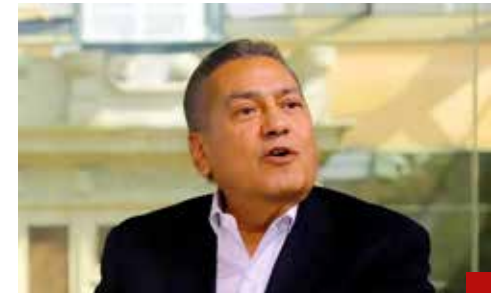
Fuera de la jugada priísta.

Urgen líderes jóvenes, nuevas caras, capaces y honorables, dispuestos a luchar por su país y por el futuro de las nuevas generaciones.