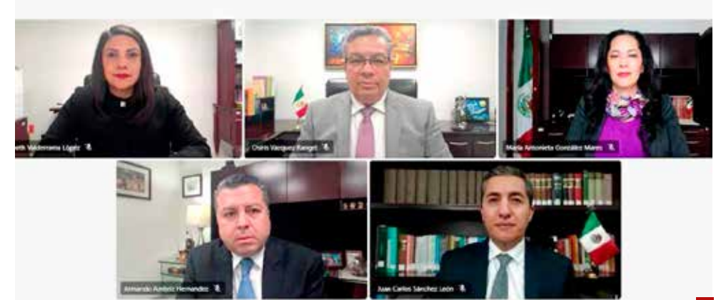
En sesión pública virtual, el pleno del TECDMX determinó que hubo violencia política de género.

Ese es otro motivo de la pugna, pues al salir el Monrealato de la Cuauhtémoc, también saldría el Chava Chava. ¿Así o más claro?