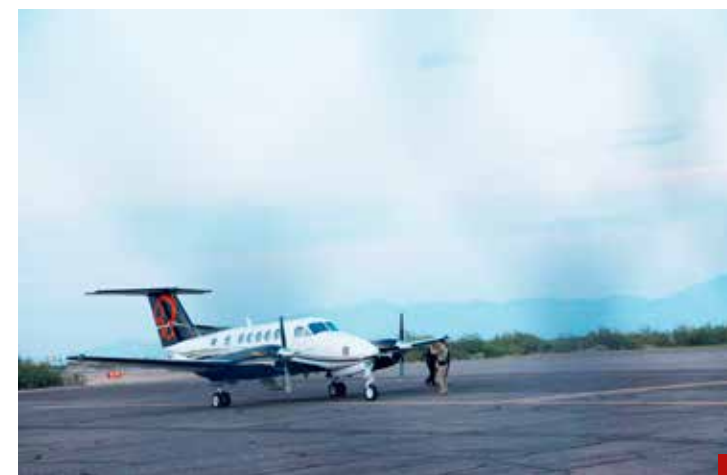
Impera la duda del vuelo, la aeronave, el piloto y los viajeros.