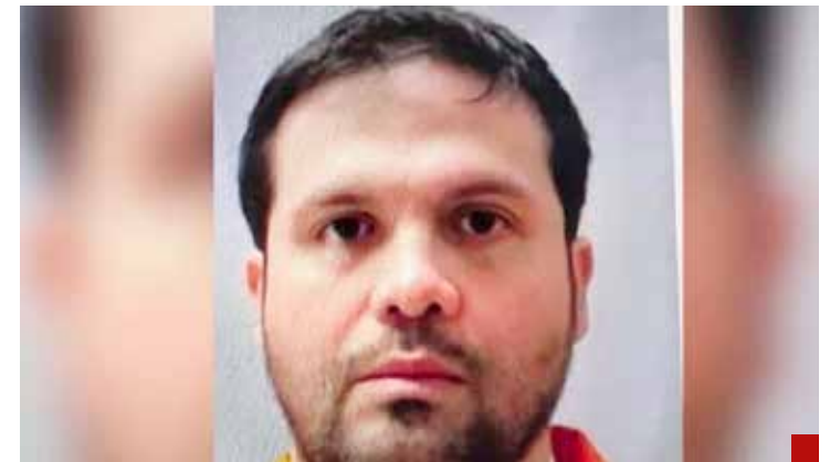
Joaquín Guzmán López pactó la entrega del Mayo.

Desde luego que el tema da para redactar muchas cuartillas, diversas historias, un sinnúmero de argumentos y manejar especulaciones, análisis o verdades que lastiman, pero es difícil que en vísperas de terminar el actual sexenio se quiera llegar a la verdad.