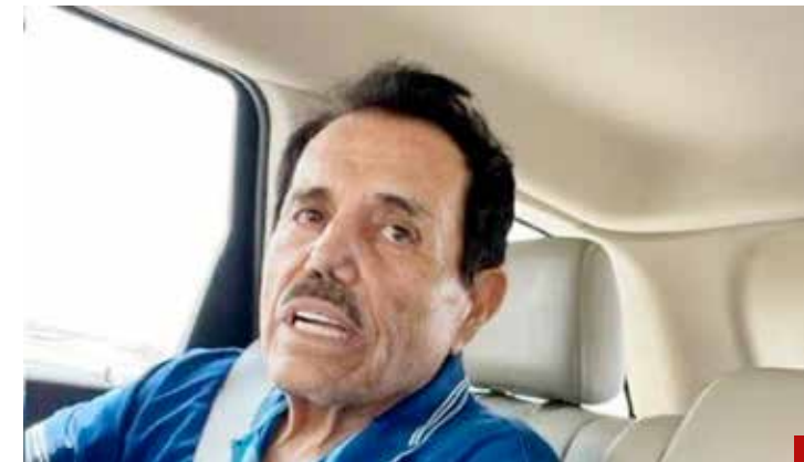
El hombre bala.

Según Ismael Zambada, la reunión fue pactada en el rancho Huertos del Pedregal, el jueves 25 de julio a las 11 de la mañana, pero él llegó más temprano.