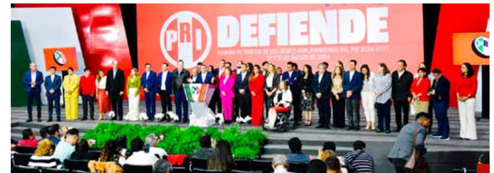
Presentan agendas legislativas conjuntas y robustas.

El líder congresista adelantó que también presentarán un presupuesto alterno, con el que la gente se sienta representada y sobre todo se respete el federalismo, porque hoy el gobierno de Morena trata de terminar con municipios y estados.