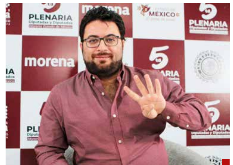
Morena, un partido de movimiento que sigue siendo la esperanza de México.