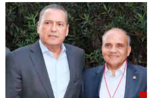
Dice que Beltrones sigue siendo su amigo.