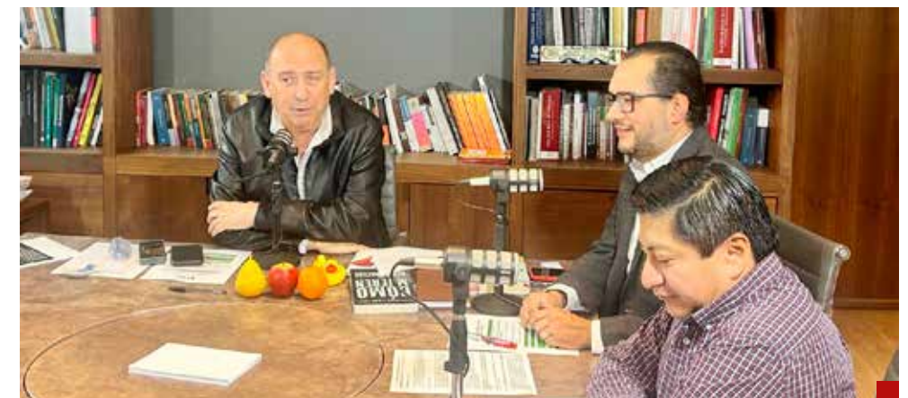
Señalan que se están viviendo ejecuciones tipo Colombia.