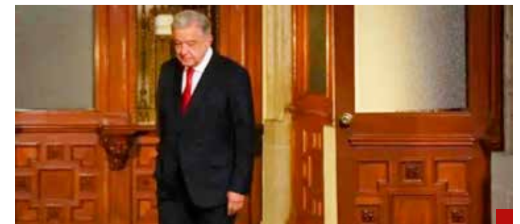
Ya comenzó la mudanza en Palacio Nacional.