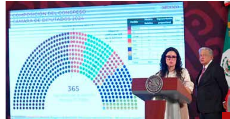
Con mayoría calificada, la 4T podrá cambiar la Constitución Política a su antojo.

Los principales comandantes de constituir