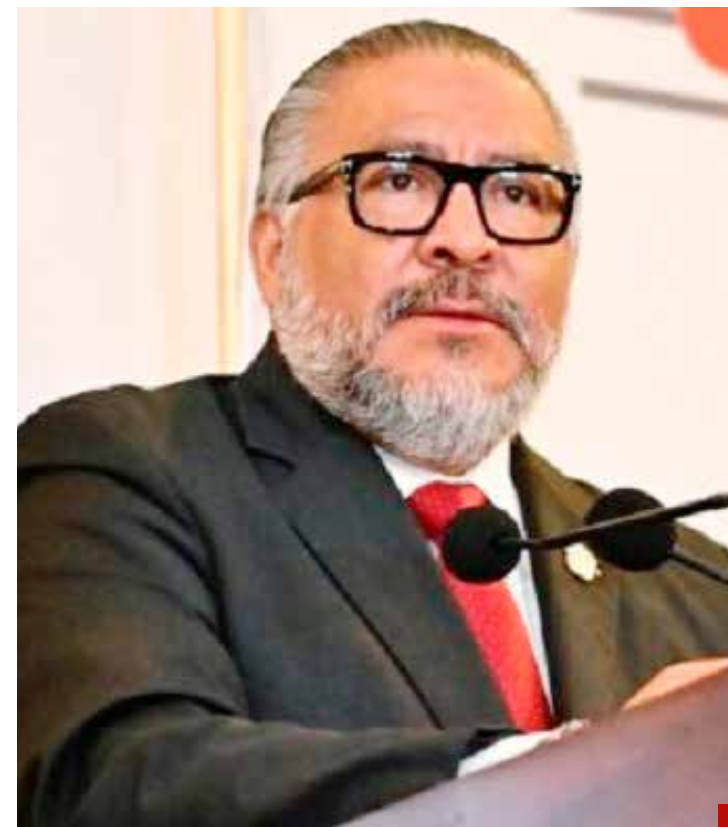
Horacio Duarte Olivares reafirma el compromiso del gobierno estatal de colaborar con el sector empresarial.