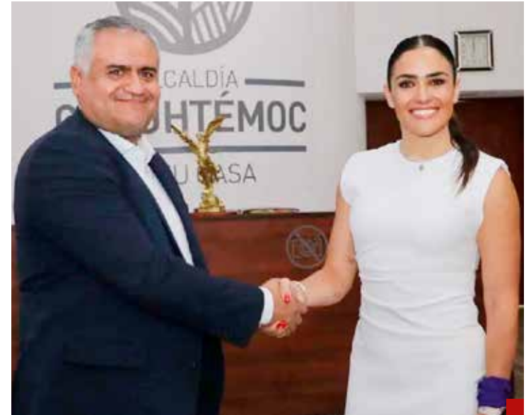
Inician los trabajos de transición.