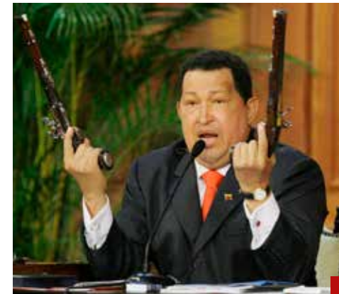
Hugo Chávez diseñó el "Manual para convertir un país en narcoestado".

Esa misma situación la puede vivir México si el INE pasa a depender de la Secretaría de Gobernación (Segob) o si se le quita autonomía, pues el propio gobierno contaría los votos del pueblo, volviendo a los tiempos del PRI cuando la Segob