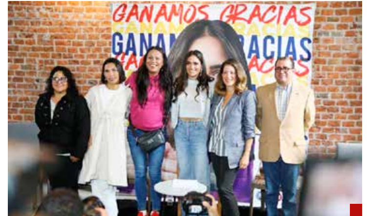
Colectivos feministas se suman a la defensa de la alcaldesa electa.