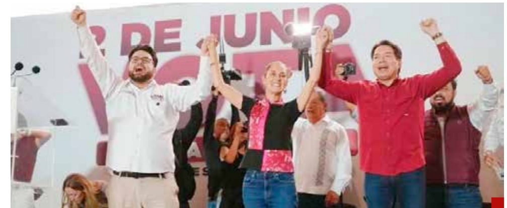
La Cuarta Transformación será una realidad en Naucalpan.