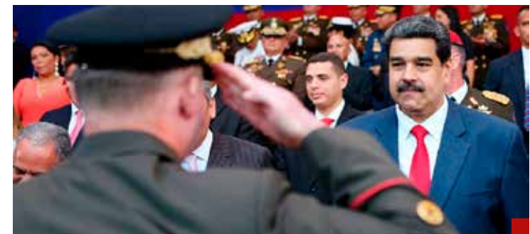
Las fuerzas armadas venezolanas están inmersas en un narco-régimen.