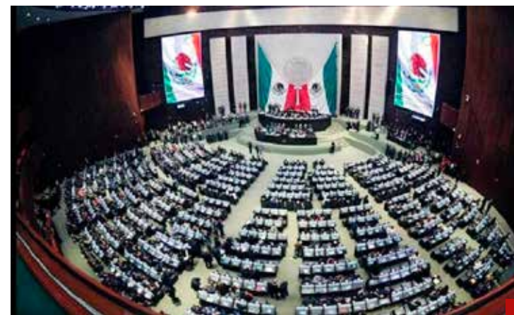
Un freno en seco a los políticos ambiciosos.