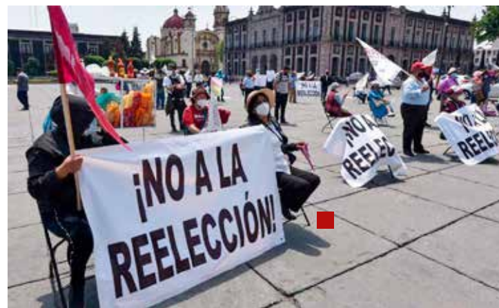
El pueblo de México no quiere la reelección.

La exigencia de los periodistas para que puedan ejercer con libertad y seguridad sus actividades está sobre la mesa, corresponde, entre otros, a la gobernadora Delfina Gómez dar respuesta positiva a ese justo reclamo.