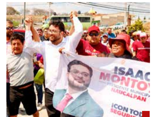
También se detendrá la deforestación en Naucalpan.

Naucalpan, no solamente en imagen urbana, sino en los problemas de agua, vialidad, y en todos los problemas que trae consigo un desarrollo urbano de irregular”.