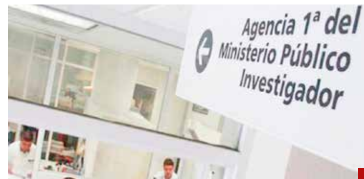
El MP tiene como función esclarecer los hechos.