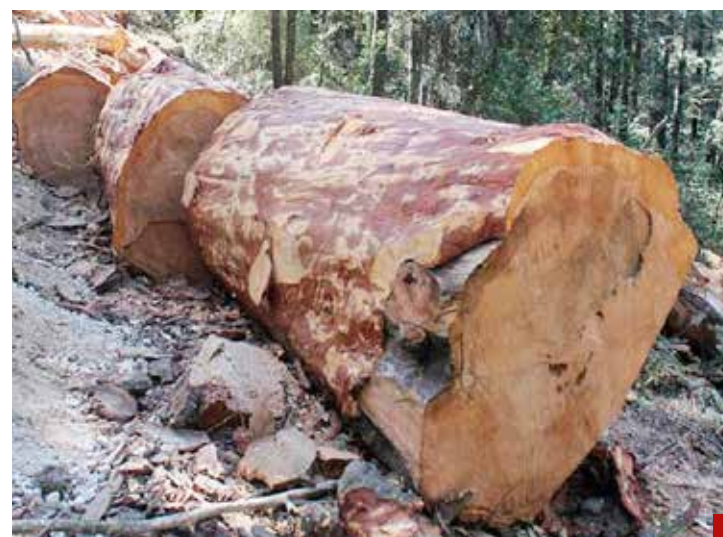
La práctica ilícita va en ascenso.

Hasta ahora no ha dado a conocer el padrón de los presuntos beneficiarios, hay poca transparencia. Todo indica que el gobierno del PRI quiere acogerse al año de hidalgo, que se caracteriza porque los políticos saquean las arcas públicas, se llevan los dineros del pueblo.