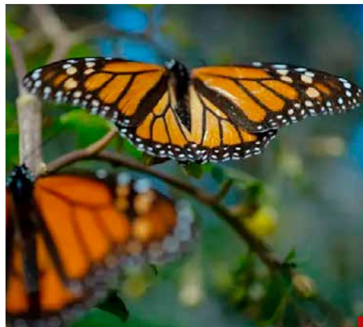
Amenazada la Mariposa Monarca.