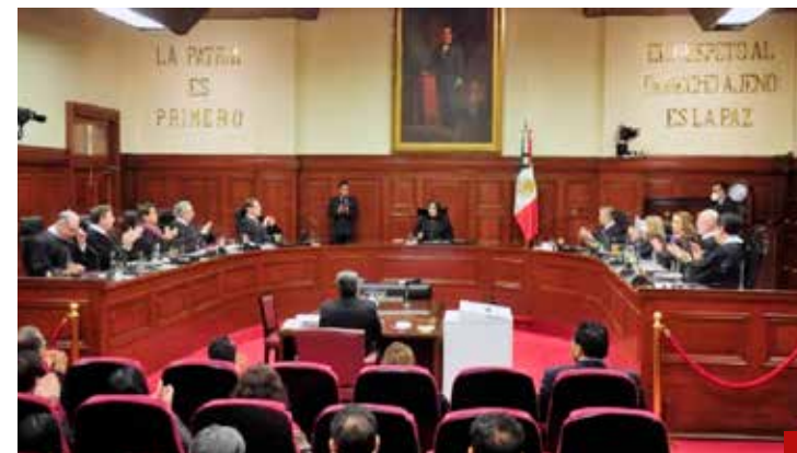
La elección de los ministros de la SCJN por el voto popular no es la solución.

Hagamos realidad la “autonomía” de la nueva FGR. Ahora en 2024, con el arribo de la primera presidenta de México, se debe cumplir con