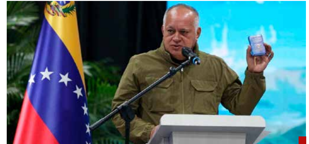
Diosdado Cabello Rondón, cercano a Nicolás Maduro, advirtió que los principales líderes opositores "se iban a joder".