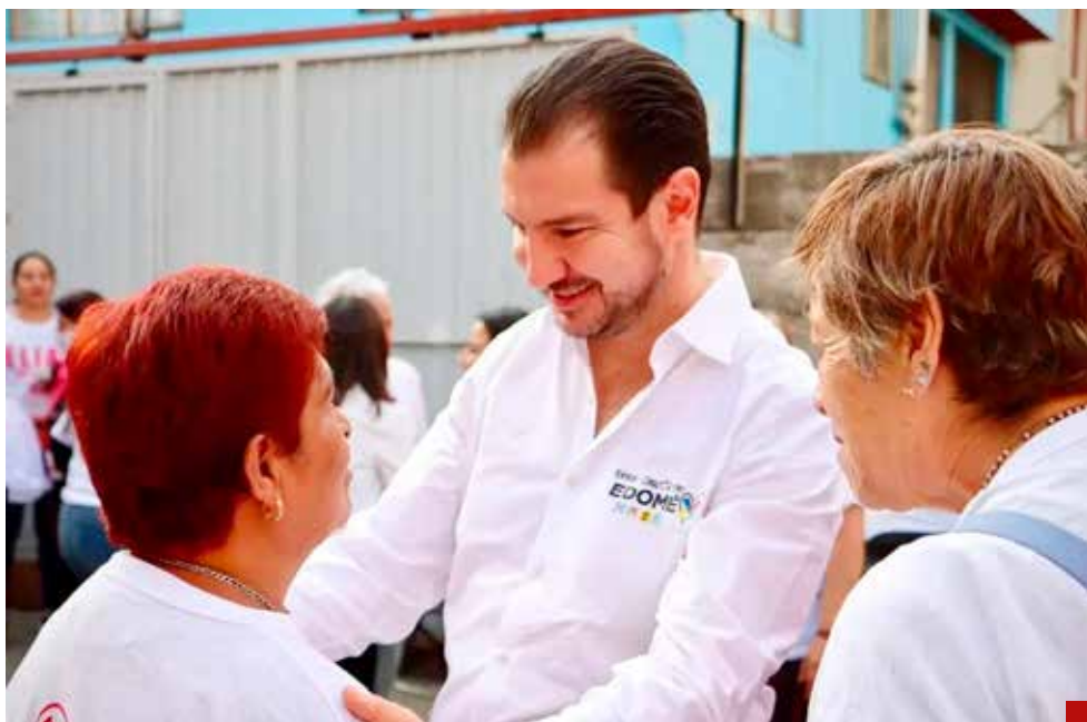
Comprometido con las familias naucalpenses.

> Se cumplirá la ley en materia de desarrollo urbano