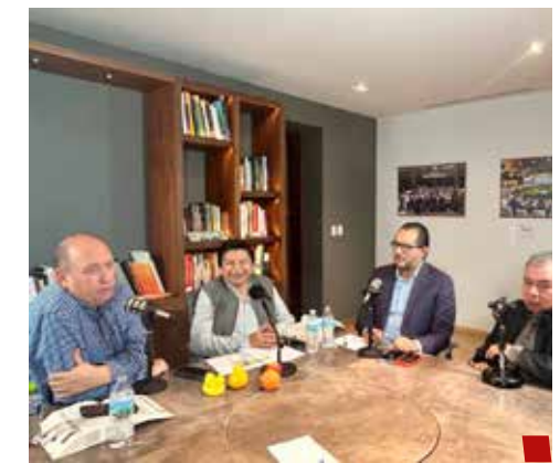
Señalan que ya no habrá justicia.

importante considerar el impacto que tendrá la sobrerrepresentación en la operación interna de la Cámara para definir la Junta de Coordinación Política, la Mesa Directiva y la distribución de las comisiones, aunque resaltó, realmente la principal afectación es que la ciudadanía no va a ser valorada en su debida proporción.