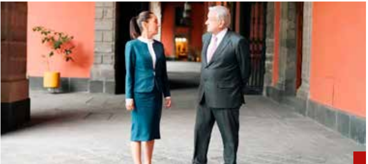
Debe hacer a un lado las venganzas políticas y caprichos de su jefe y mentor.