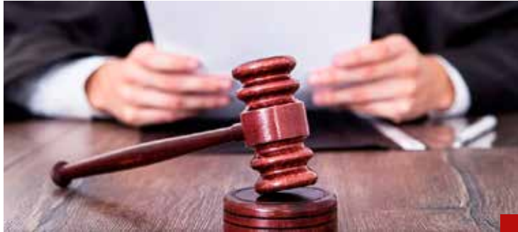
Nadie está en contra de sancionar y castigar a los jueces corruptos o ineptos.