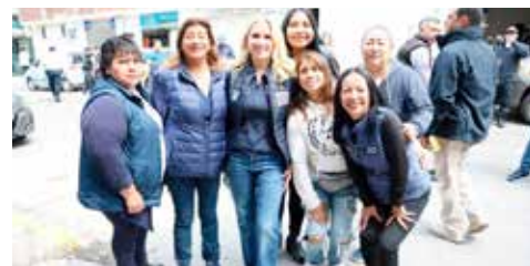
Ya son 31 meses siendo la mejor alcaldesa del Edomex.

“Éste es el resultado de un trabajo 24/7, en donde los servidores públicos de Huixquilucan realizan su labor de manera eficiente en beneficio de todos los habitantes”, expresa la presidenta municipal.