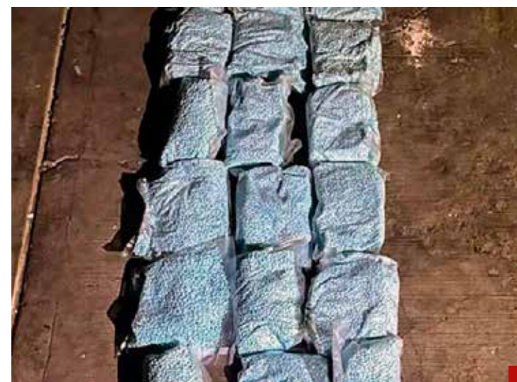
No todo es el tráfico de drogas.