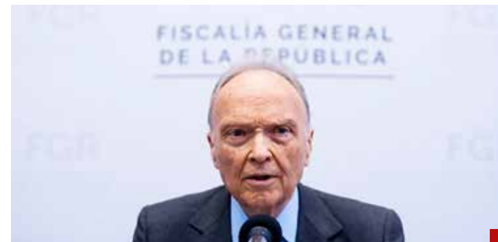
Se debe hacer realidad la “autonomía” de la FGR.