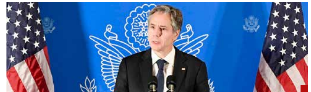
Ningún país expresa que Maduro ha recibido la mayoría de votos, advierte el secretario de Estado de EU.