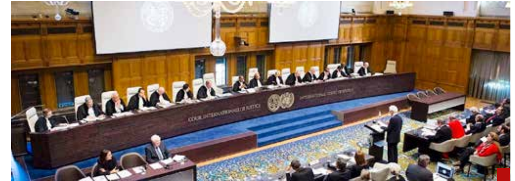
Piden a la Corte Penal Internacional que ordene el arresto del presidente venezolano.

Ante los acontecimientos que vive Venezuela, el futuro no es muy halagador para Nicolás Maduro, quien está en una encrucijada porque ya se le olvidó que "el pueblo manda".