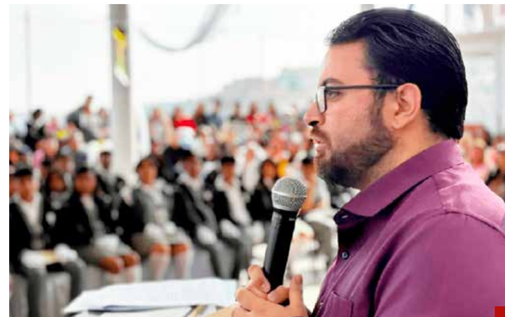
Bajo advertencia de Montoya no hay engaño.