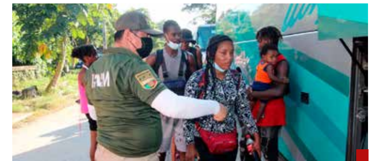
Autoridades del INM violentan el derecho de asistencia y protección consular.