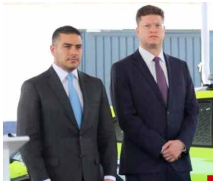
Juntos son dinamita policial.