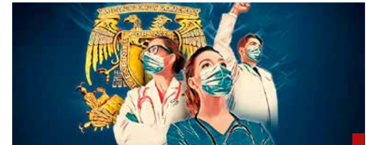
La alerta que la UNAM lanza por el repunte de la pandemia de Covid no es para menospreciarse.