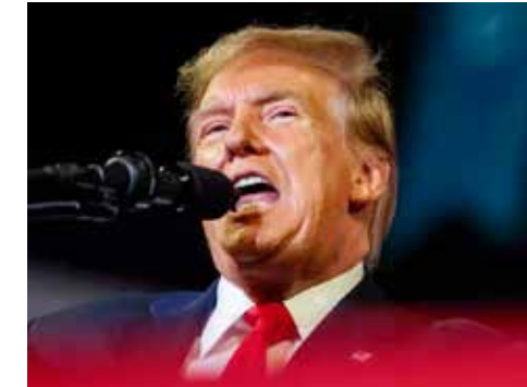
Colérico, pero no fuera de la realidad.