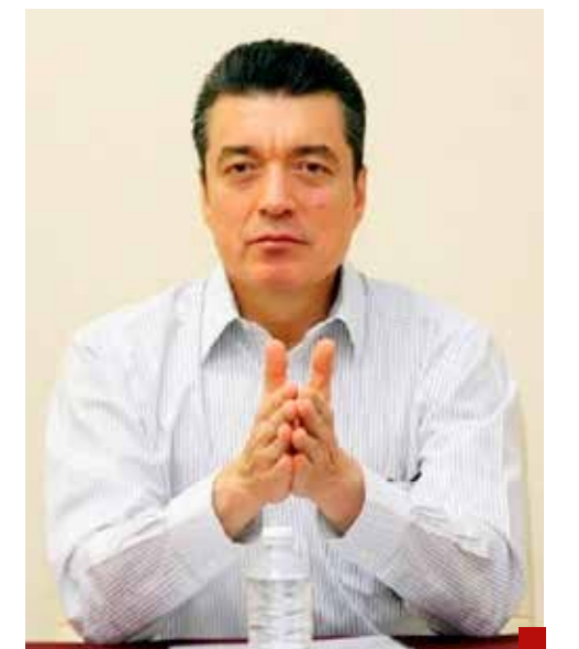
Rutilio Escandón Cadenas despierta mal y de malas a diario con las nuevas noticias de masacres.