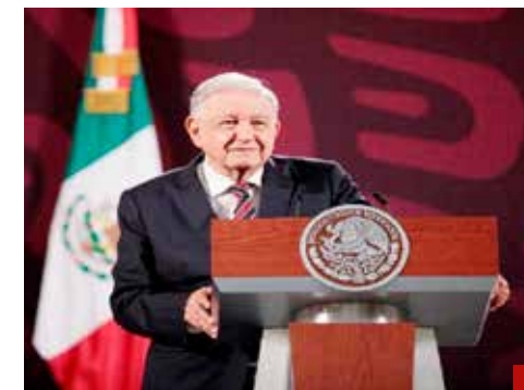
Cuando se reparte mal el botín, hay motín: AMLO.