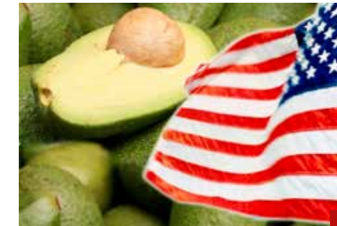
El consumo de aguacate en Estados Unidos se ha triplicado en las últimas dos décadas.

Además, todo hace suponer que el futbolista permanecerá como entrenador del tricolor del balompié mexicano, mientras que Moreno (¿sólo de apellido?) lucha por reelegirse y quedarse en el tricolor que antes era invencible. Cosas de la vida y de las similitudes.