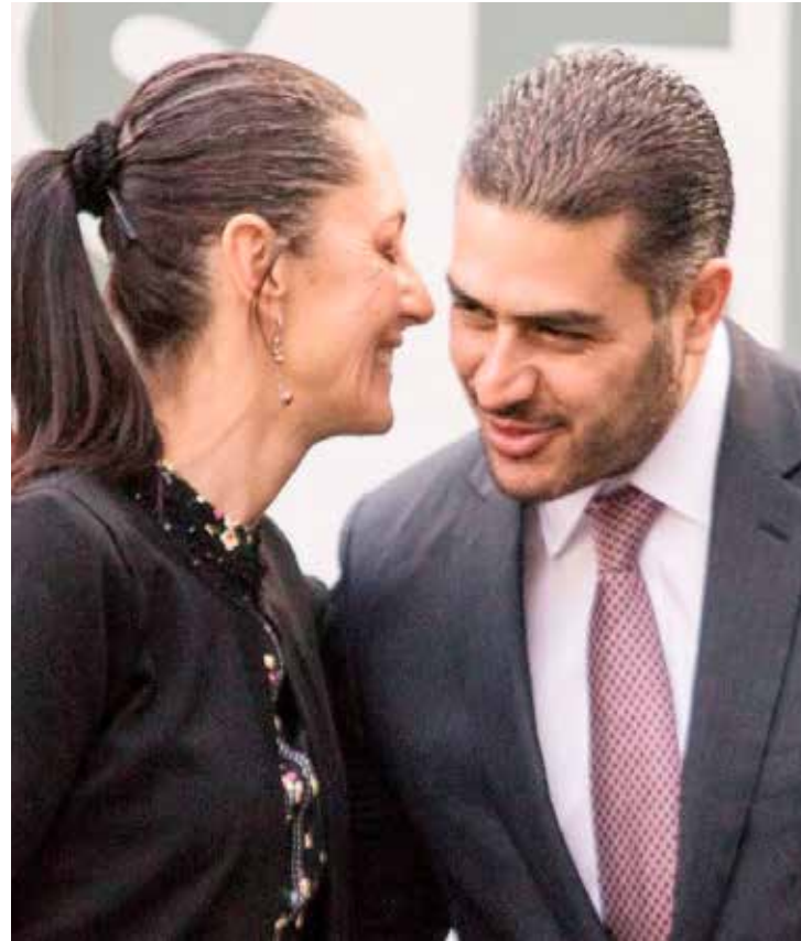
A fortalecer la Guardia Nacional, la primera instrucción de Claudia.

cargo que logró en los pasados comicios del 2 de junio de 2024 y hoy en día es senador electo por la Ciudad de México.