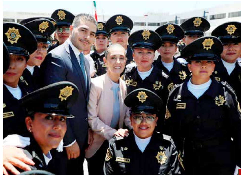
A sentar los cimientos de una política nacional que devuelva la paz y la seguridad a 130 millones de mexicanos.

Luego se convirtió en candidato a senador,