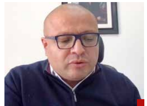
Que favoreció a Latinus con más de mil millones de pesos.