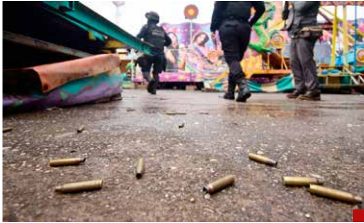
Hay una cifra récord de casi 200 mil homicidios.