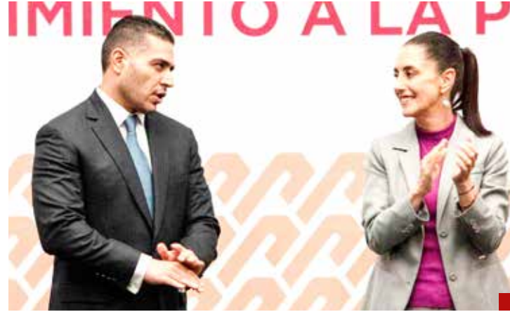
García Harfuch, uno de los activos más valiosos con que contará Sheinbaum Pardo.

Con franqueza y honestidad, propias de su personalidad, García Harfuch reconoció que existen células del narcotráfico en la Ciudad de México, situación que sus predecesores habían negado.