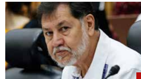
Regresó por puro oportunismo: Gerardo Fernández Noroña.

No cabe duda que al estilo Infierno, Sergio Mayer pone 'caliente' a Morena, el partido del Presidente López Obrador.