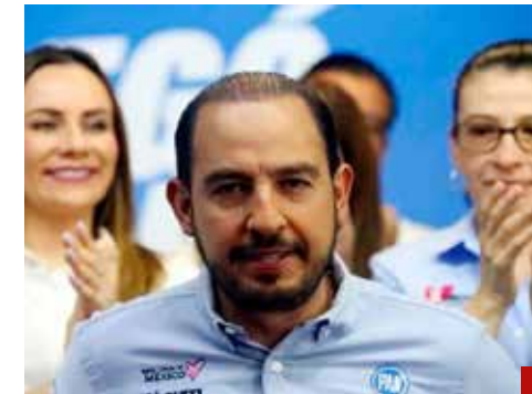
Mil pretextos para no reconocer su derrota.