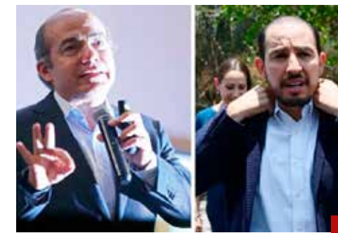
Felipe Calderón se lanzó a la yugular de Cortés.