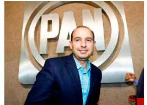
Hace más daño estando al frente del PAN.