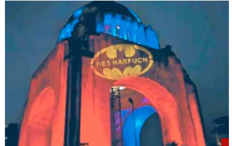
Batman, al rescate de “Nación Gótica”.

Un ejemplo de su eficiente capacidad de investigación y captura de delincuentes fue el atentado contra la vida del prestigiado periodista Ciro Gómez Leyva, ocurrido en diciem-