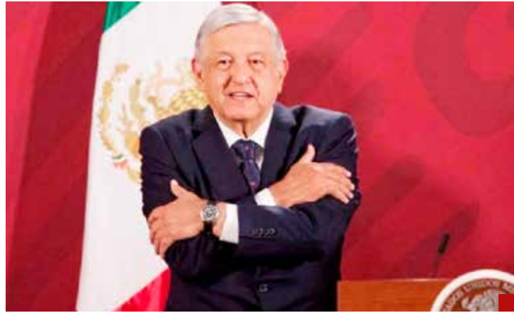
Abrazos y no balazos, un rotundo fracaso.

Todo esto en medio de un creciente número de desapariciones, levantamientos de jóvenes y niños para alistarlos como sicarios, extorsiones, secuestros, cobros de piso y asaltos a transportes de mercancías.