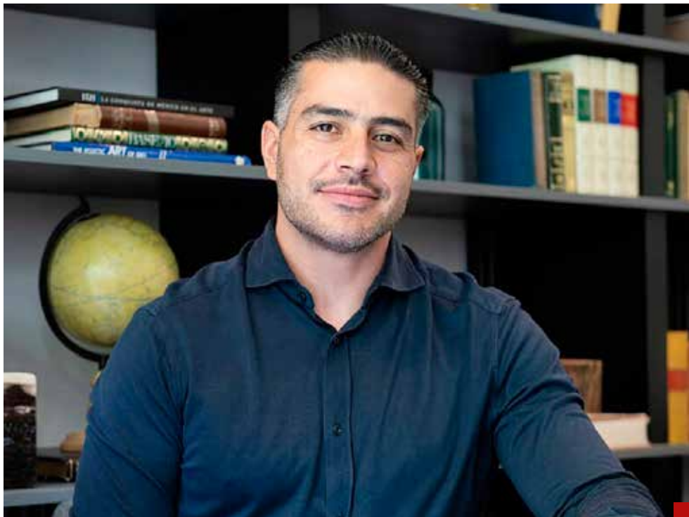
Trae en la sangre la convicción de servicio.

Sus logros en la materia no son fantasiosos ni milagros, son producto de un minucioso trabajo profesional. Algunas acciones que tomó en la CDMX ya las ha explicado: “Cambiamos la forma de operar de la policía, ya que siempre había sido preventiva y solo era posible capturar delincuentes en ‘flagrancia’. Lo que se hizo fue enviar una iniciativa al Congreso para que la SSC tuviera la facultad de investigar, con ello se logró dar seguimiento, desde que ocurre el delito, hasta la detención”.