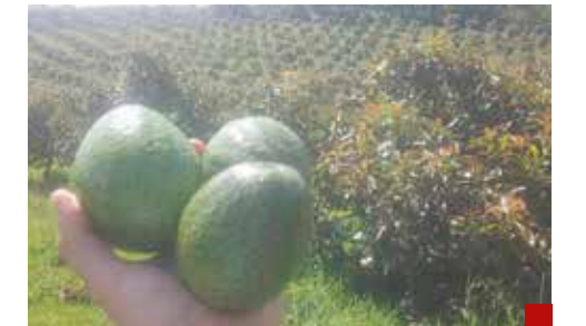
La superficie legalmente sembrada de aguacate en Michoacán fluctúa entre 158 mil 804 y 167 mil 745 hectáreas.

En verdad que la ingratitud no tiene límites para reconocer talentos. Bueno, hasta en las filas de Morena ha causado irritación y enojo.