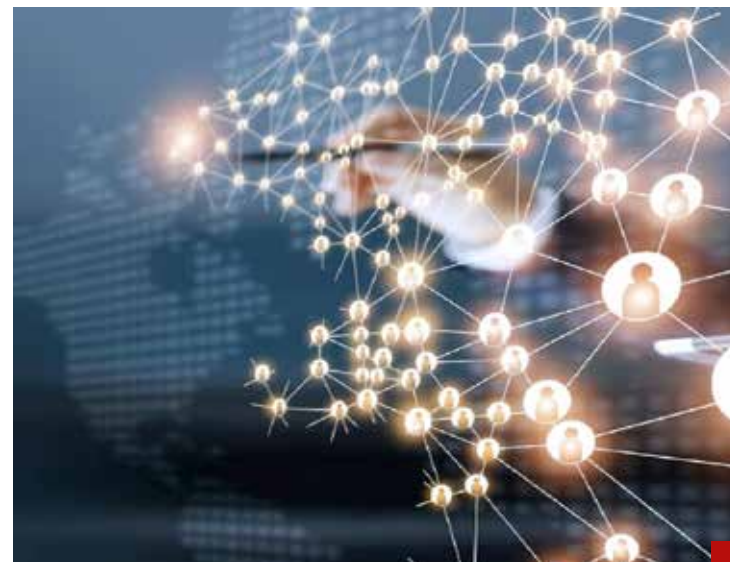
La clave del crecimiento económico está en el progreso tecnológico.

Ese decálogo señala diez factores o condiciones para lograr la "Supercarretera del crecimiento económico", atendiendo a la experiencia del crecimiento de los "tigres asiáticos": China, Singapur, Hong Kong, que lograron tasas de crecimiento extraordinarias en la década de los 90s.