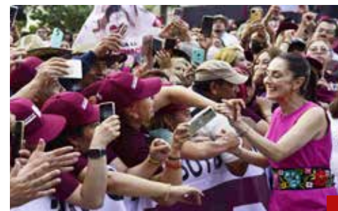
La próxima presidenta de México tiene la oportunidad de otorgar a México y a sus 130 millones de habitantes la posibilidad de un futuro promisorio de prosperidad.

La próxima presidenta en la historia de México