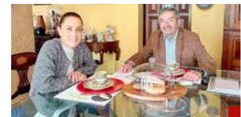
Juan Ramón de la Fuente, en Relaciones Exteriores.