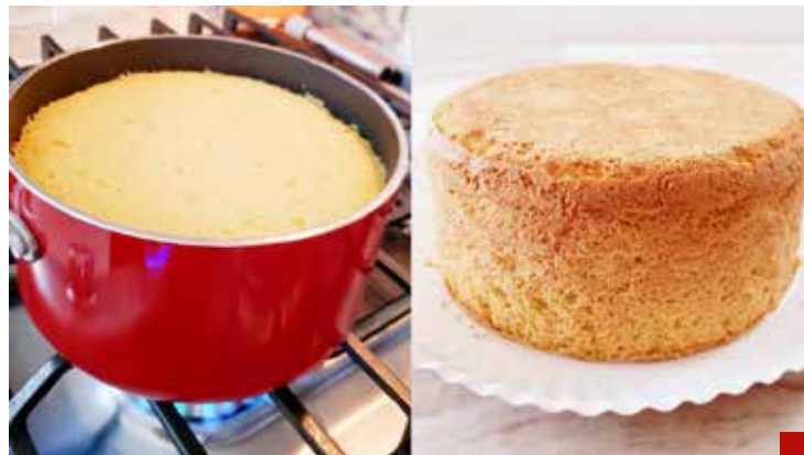
Para repartir el pastel primero hay que cocinarlo.