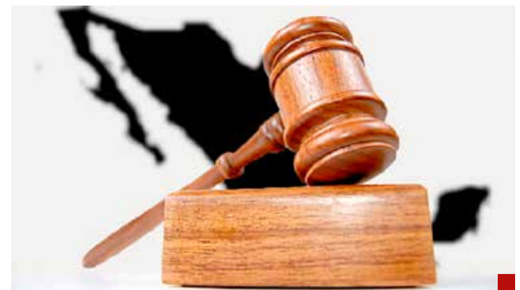
A consolidar el anhelado Estado de Derecho con seguridad jurídica y mejor impartición de justicia.