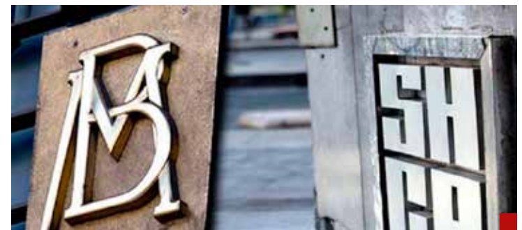
La estabilidad macroeconómica sería responsabilidad de la SHCP y del Banco de México.