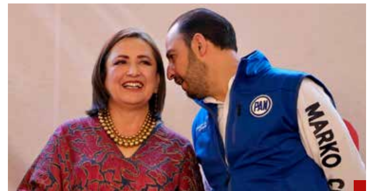
Marko Cortés le reclamó de manera airada a Xóchitl por haber reconocido el triunfo de Sheinbaum sin haberlo consultado.