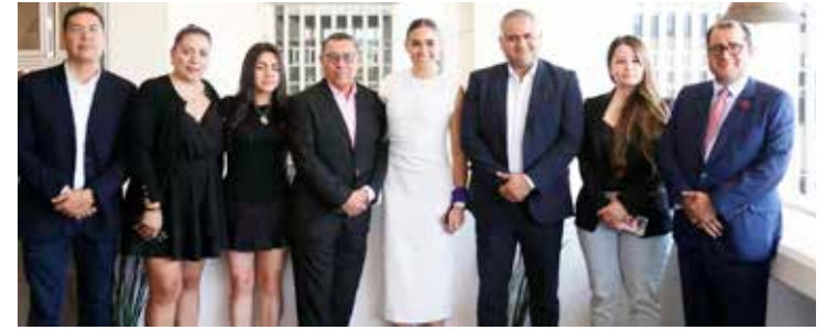
Una transición ordenada en el marco de la legalidad.

De esta forma se respiran nuevos aires en la alcaldía Cuauhtémoc.