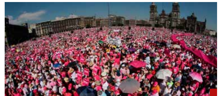
La Marea Rosa fue una manifestación de rechazo al régimen obradorista y a Morena.