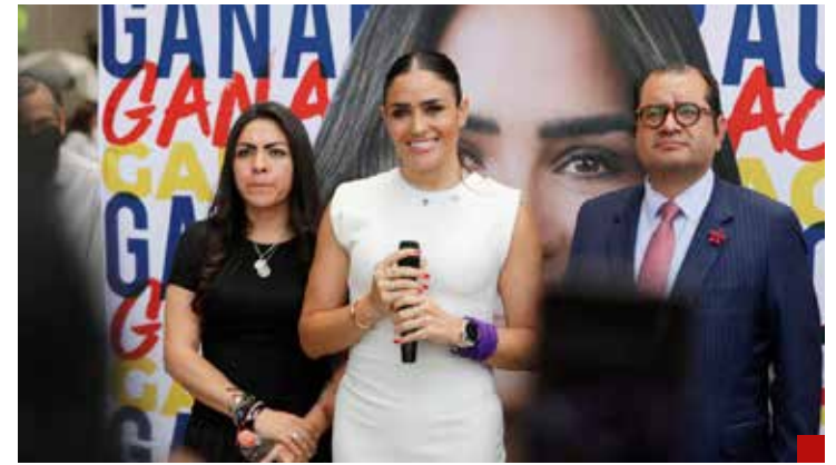
Hará un recorrido por las colonias de la demarcación.