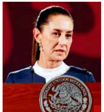
Ya hay gabinete, falta su difusión.