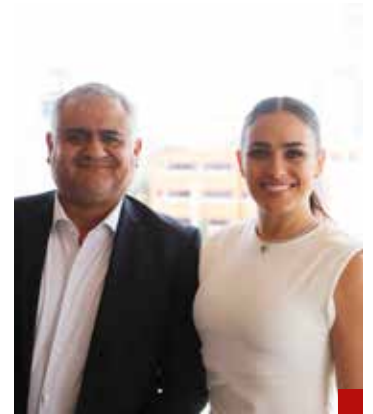
Se respiran nuevos aires en la Cuauhtémoc.