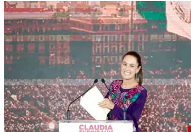
Sheinbaum Pardo puede poner a México en la plataforma del despegue definitivo.