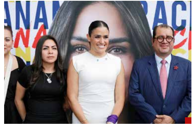
Ale Rojo afirma que realizará un buen gobierno.