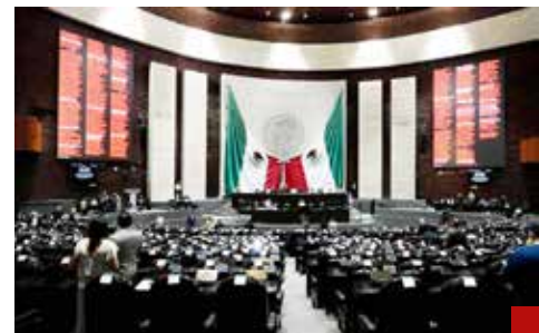
La eventual mayoría calificada en el Congreso de la Unión le da la posibilidad a la 4T de realizar una necesaria reforma al Poder Judicial.

Debe consistir en un esquema bien definido y viable para su implementación en el corto y mediano plazo. Medible para su seguimiento y evaluación puntual. Se trata de establecer un detallado "plan", retomando un "decálogo" que desde hace 3 décadas fue probado en países que lograron vertiginosos crecimientos económicos.