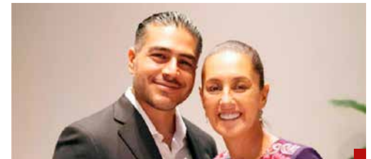
Omar García Harfuch en la SSPC, una designación que no le caería bien a AMLO.