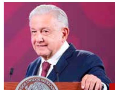
Andrés Manuel López Obrador también influyó con sus más de 2 mil conferencias matutinas.

> Sheinbaum debe aprovechar su gran capital político para convocar a un acuerdo nacional para el crecimiento económico