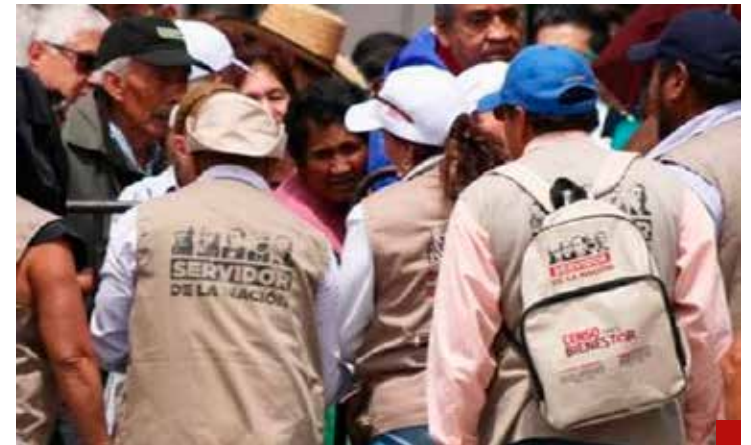
Un ejército paralelo a Morena se dedicó a difundir la imagen del Primer Mandatario, así como a solicitar el voto para Claudia Sheinbaum Pardo.

Se hará acompañar del influyente y experimentado Manlio Fabio Beltrones, quien con seguridad le dará realce a la Cámara de Senadores, donde jugó un papel de primer orden de 2006 a 2012. Moreno será