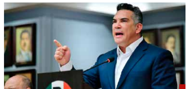
Alito será senador al estar primero en la lista.