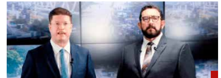
Le dan mucha importancia al caso Ale Rojo, por lo que hay un fuerte olor a operación política.

Esto es una probadita a lo que se anunciará la próxima semana y, seguramente, otros nombres irán surgiendo, algunas sorpresas incluidas, para el gabinete de la próxima Presidenta.