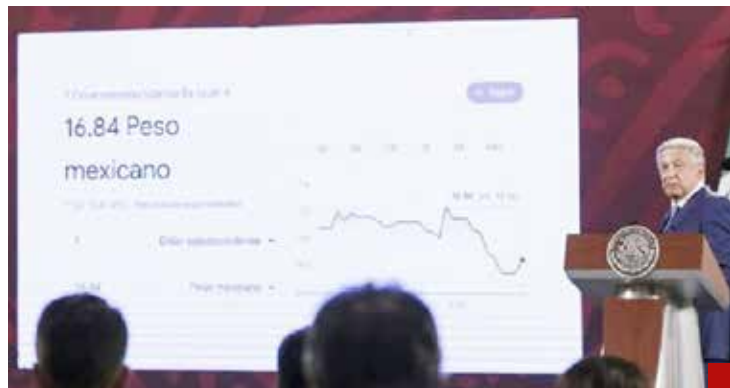
Este sexenio tendrá el promedio anual de crecimiento económico más bajo de los últimos 40 años.