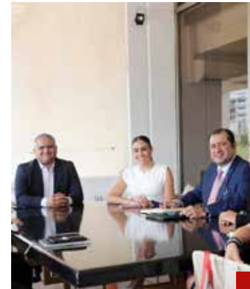
Por encima de todo los intereses de los ciudadanos.