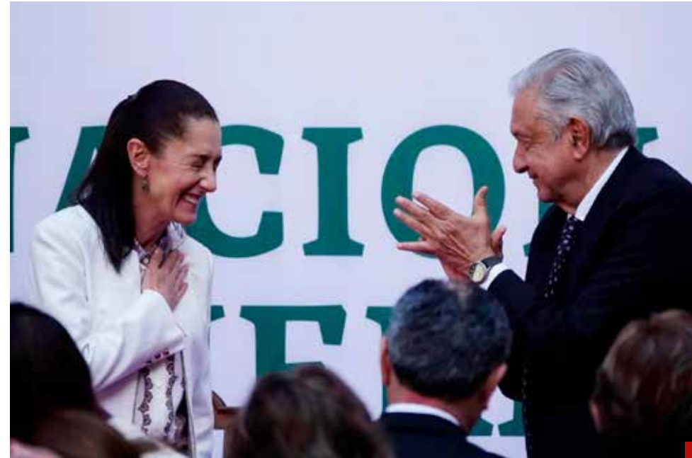
Claudia deberá "independizarse" y gobernar con su propio sello.

Después de la elección presidencial del 2 de junio, en la que aventajó a Xóchitl Gálvez 2 a 1, Sheinbaum Pardo cuenta con un enorme capital y poder político. Sin embargo, son millones de mexicanos los que se preguntan si Claudia Sheinbaum podrá deslindarse de Andrés Manuel López Obrador más pronto que tarde.