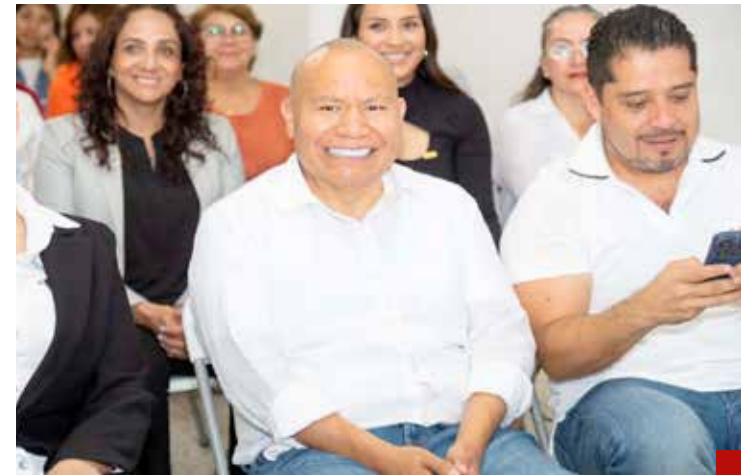
Ya es presidente municipal electo de Tlalnepantla.

Consejero nacional y estatal, congresista nacional en el Movimiento Regeneración Nacional -Morena- en el periodo 2022-2025.