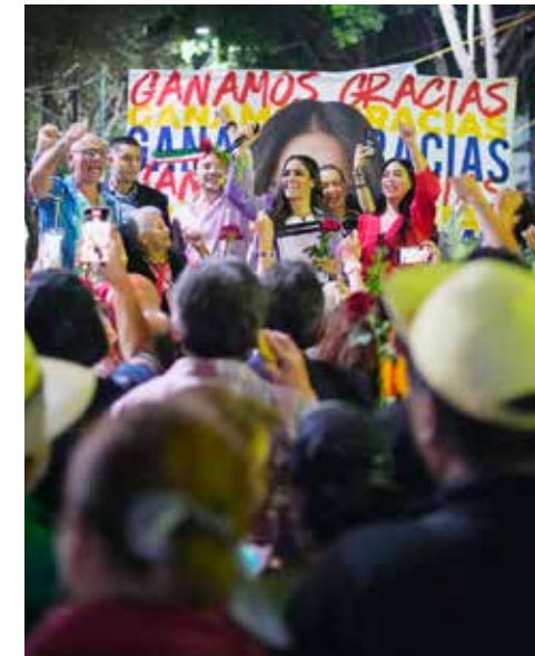
Agradeció al IECM “por cumplir y hacer cumplir la ley”.

Bien dice un refrán “lo que no mata, te fortalece”, y Ale, por mostrar empatía y solidaridad en una marcha de mujeres violentadas y haber abrazado a varias féminas vestidas de negro, fue perse-