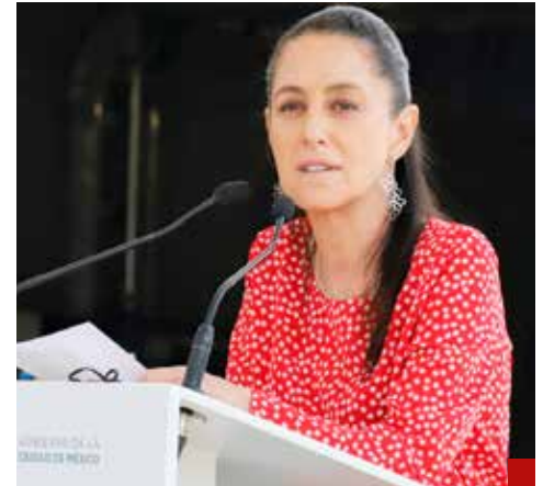
Sheinbaum deberá ponerle fin a la incertidumbre.

Echeverría Álvarez con Díaz Ordaz, pues en plena campaña en la Universidad Nicolaita de Morelia Luis culpó abiertamente a su antecesor de los hechos del 2 de octubre de 1968, al pedir "un minuto de silencio"; José López Portillo hizo lo propio desde la campaña y ya no vio ni le dirigió la palabra a su "hermano" Luis, sino hasta el fin de su sexenio; Miguel de la Madrid pintó su raya de JLP y lo primero que hizo fue revertir la nacionalización de la banca; Carlos Salinas de Gortari, a pesar de ser el autor intelectual de la política económica de De la Madrid, nunca lo volvió a mencionar ni a invitar a algún evento; en el caso de Luis Donaldo Colosio Murrieta, todos recuerdan el deslinde radical que hizo de Salinas de Gortari con el célebre discurso del 6 de marzo de