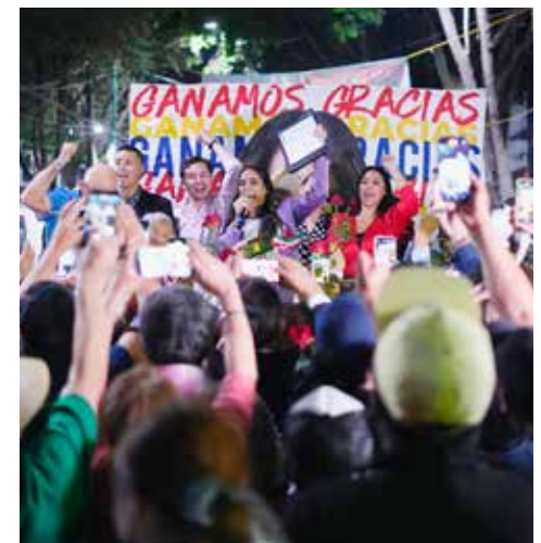
Recibe la constancia de mayoría que la acredita como la ganadora de la elección por la alcaldía Cuauhtémoc.

defiende y persigue causas. Sulema de malandros se escribe con M de Monreal, con la cual prometió acabar con la corrupción y el derecho de piso y la extorsión. Ni duda cabe que para tener la boca grande hay que tener la cola corta.