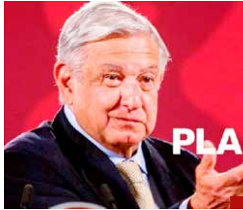
El Presidente lanza abierto desafío al poder económico.

como legisladores del PT, se mostraron muy envalentonados y anunciaron que el Plan C ya estaba listo en la agenda legislativa de la nueva Legislatura que iniciará el 1 de septiembre de 2024.