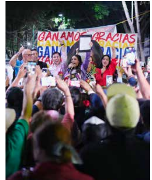
Fue un triunfo épico rayando en lo heroico.

La lección que Ale dio en esta contienda fue muy simple: nunca subestimen a una mujer que