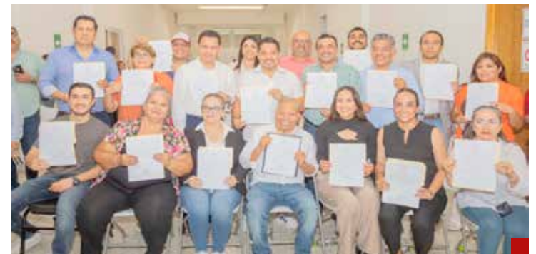
Empezará a trabajar con recorridos por todo el municipio.