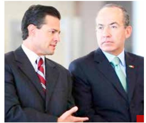
Enrique Peña Nieto no se metió con su antecesor.

1994; Ernesto Zedillo Ponce de León se fue al extremo al encarcelar a Raúl Salinas, hermano de su antecesor, acusado de ser asesino y pasar un sexenio publicitando las corruptelas de Carlos Salinas.