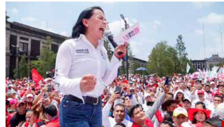
Hace un año criticaba con todo a Morena.