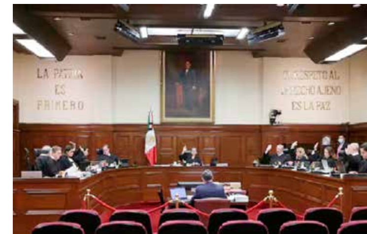
Norma Piña tendrá que responder ante la justicia.