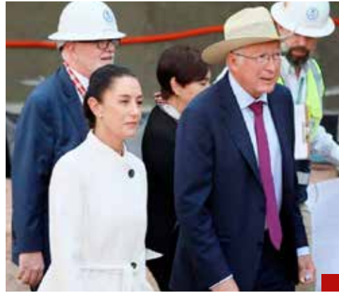
El embajador Ken Salazar confía en la presidenta electa.