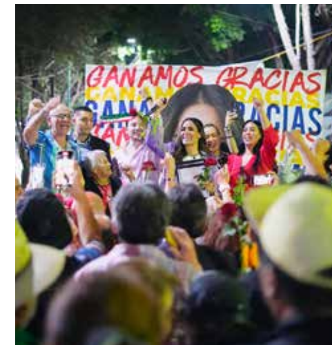
La amazona que será gobernante nunca bajó la guardia.

guida por Ernestina Godoy y Claudia Sheinbaum, y hasta espiada, como lo demostró la investigación publicada en el New York Times.