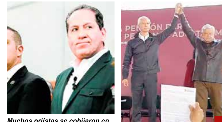
Muchos priistas se cobijaron en Morena para estar blindados.