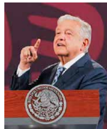
El Poder Judicial está "tomado, secuestrado y al servicio de una minoría, de los de arriba": AMLO.