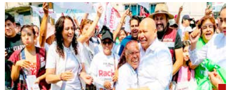
Tiene preparación y capacidad profesional para llevar a buen puerto Tlalnepantla en pro de sus habitantes.