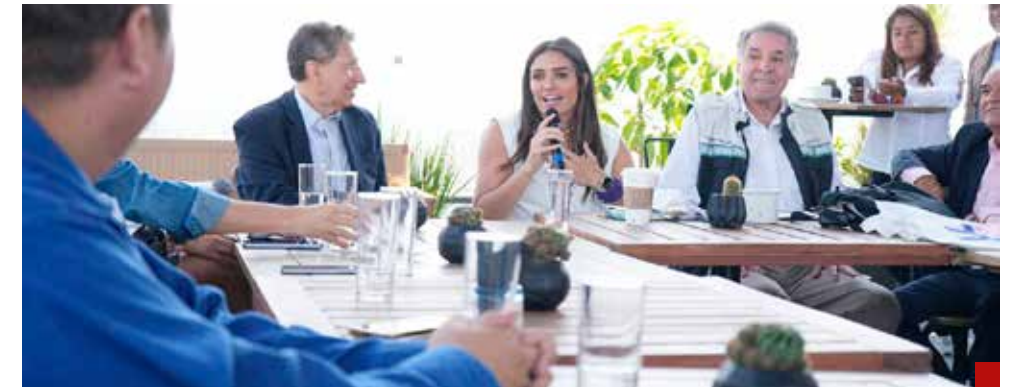
“Le dijimos basta a los malos gobiernos”.

Ale ha sido claro ejemplo de la misoginia, discriminación y violencia política de género