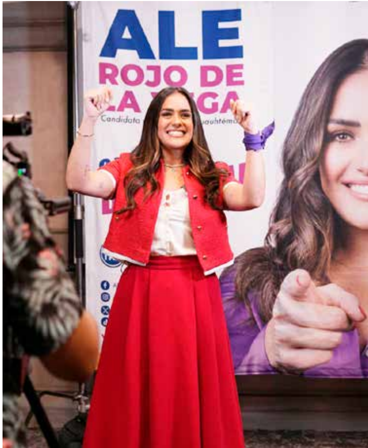
Gobernará la alcaldía más importante de la capital del país.

Su designación fue anunciada por Alejandro Moreno Cárdenas y Jesús Zambrano, líderes nacionales del PRI y del PRD, respectivamente, al ser presentada como la candidata por una de las alcaldías más importantes de la Ciudad de México.