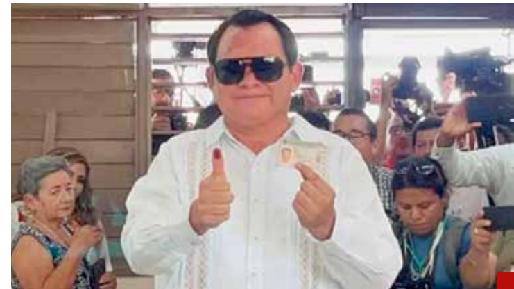
He vivido toda mi vida en clase media y nunca me voy a cambiar de aquí por ser gobernador, expresa Díaz Mena.

“La gente vio a la doctora Claudia Sheinbaum comprometida como