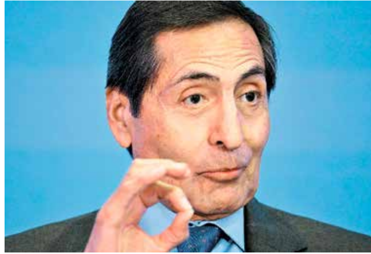
Con Rogelio Ramírez de la O habrá continuidad en la disciplina financiera.