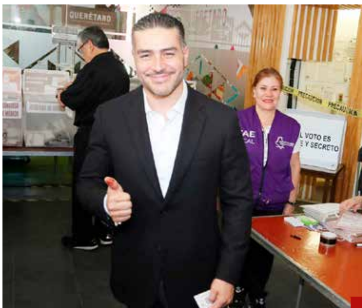
El Senado es mi meta, pero si me llama Sheinbaum será un honor servir: García Harfuch.

> Dará continuidad al trabajo realizado en favor de mexiquenses