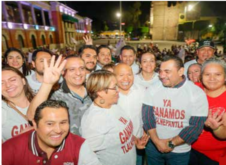
Fue contundente en despedir al PRI y al PAN del palacio municipal

desde temprana hora en la casilla número 4916, ubicada en la Escuela Básica Estatal “Profesor Ignacio Quiroz Gutiérrez” en la colonia La Romana.