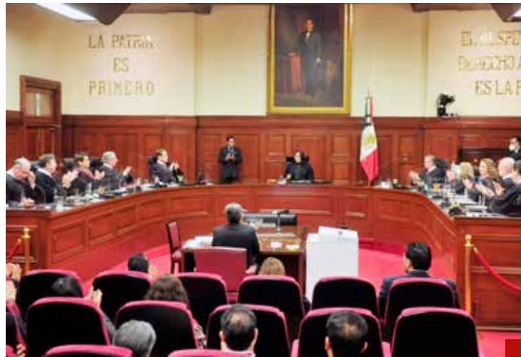
Poder Judicial, en la mira de AMLO y CSP.

Su gran amigo, leal y cercano colaborador, Omar García Harfuch, es garantía de resultados y mejoras en la materia de seguridad; en salud, el doctor Kersenovich, con gran experiencia y capacidad, puede dar el giro en la mejora del Sistema Nacional de Salud, y en educación, nadie mejor que el doctor Juan Ramón de la Fuente, quien puede emprender una verdadera revolución educativa para que el Estado Mexicano cuente con el capital humano preparado para insertarse en la productividad y el crecimiento económico que México requiere para su pleno desarrollo económico, bienestar y prosperidad.