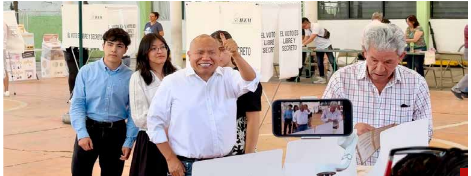
Emitió su voto en un ambiente de fiesta democrática.

“Confiamos mucho en la doctora Claudia, con quien seguramente llegaremos a estar en el top de las diez economías más poderosas del mundo, pero con una gran diferencia: que todas y todos vamos a estar incluidos. Prosperidad compartida. Y hoy, como nunca antes, ratificar nuestra lucha que tiene que ver con una frase que nos ha inspirado estos años: ‘Por el bien de todos, primero los pobres’”, afirmó.