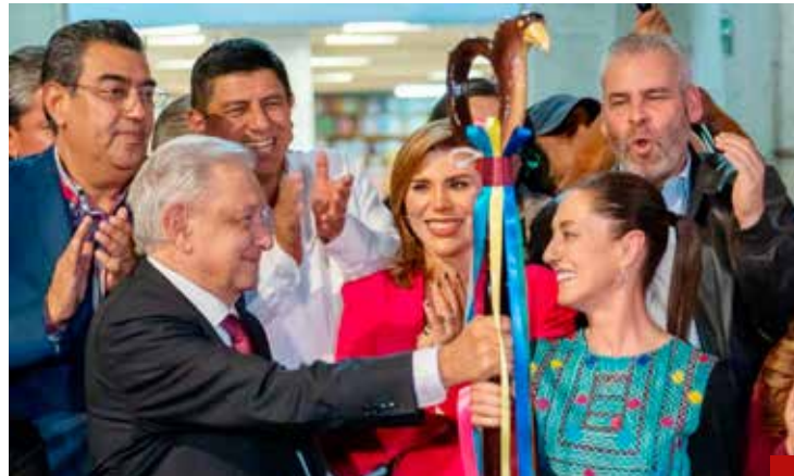
Primero bastón de mando, luego la banda presidencial.