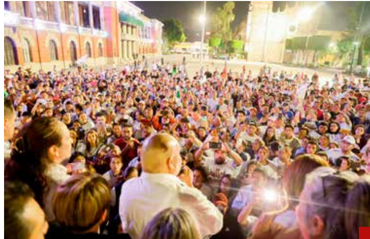
Ensalzó con orgullo una de las frases que más pronunció durante los 33 días de campaña, convencido siempre de que sería realidad el domingo 2 de junio: Tlalnepantla daría una lección de dignidad.

“Lo único que espero son votos y votos... y más votos”, expresó y así aconteció: con sus votos botó al PRIAN de palacio municipal de Tlalnepantla.