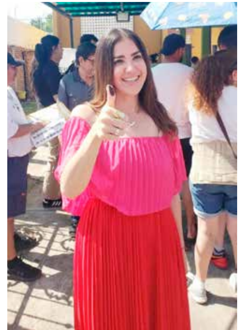
Lo más importante es Sinaloa y México, expresa Paloma.

“La verdad es que al final, te lo digo muy claro, por estado solamente hay tres senadores, somos los que tenemos que sumarnos por el bien del estado, por el bien de México”, agrega.