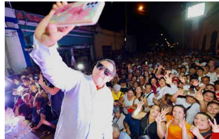
“Quiero que la gente vea una igualdad de oportunidades”.