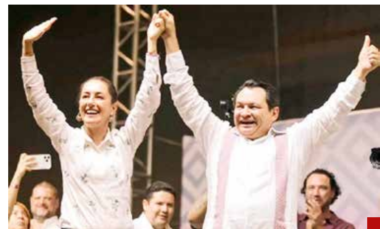
Destacó el apoyo de la virtual presidenta electa Claudia Sheinbaum Pardo.

el renacimiento maya, aprovechar a Yucatán para el nearshoring y todo eso lo vamos a lograr con ella”, agregó.