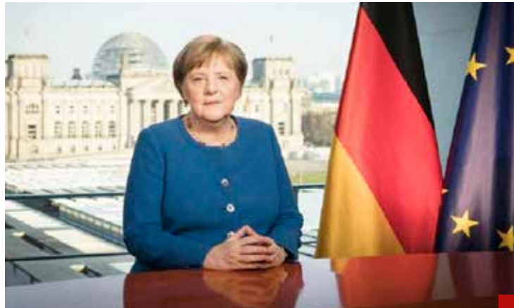
¿Tendremos una Angela Merkel mexicana?

Podría convocar Claudia Sheinbaum para su gabinete a los mejores, independientemente de su filiación partidista o ideológica.