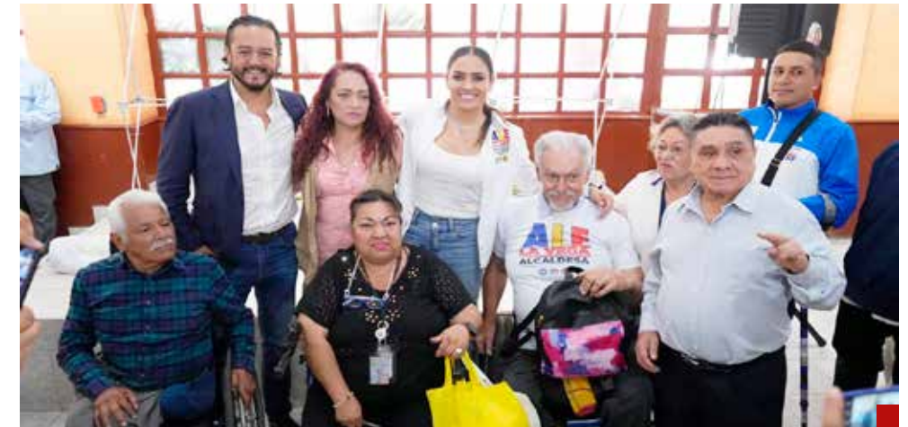
“No me dejen sola”, pide a vecinos.