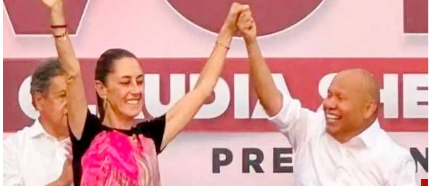
Se consolidó el segundo piso de la Cuarta Transformación en Tlalnepantla y en todo México.