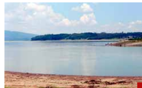
El 15%, nivel mínimo de operación.

A través del Sacmex, la Ciudad de México ha recibido 4 mil 820 litros por segundo, mientras que en el Estado de México, tanto en la Zona Metropolitana como en el Valle de Toluca, se han enviado 3 mil 90 litros.