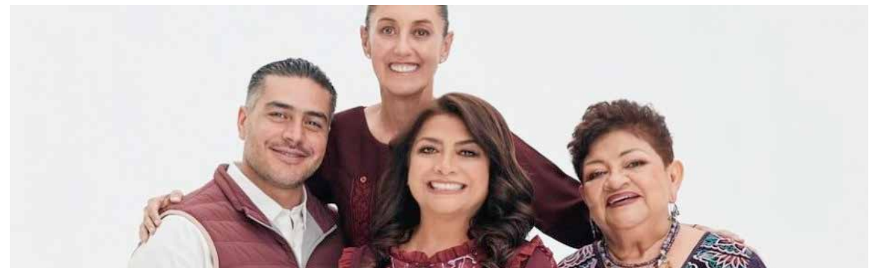
El equipazo de Claudia Sheinbaum Pardo.