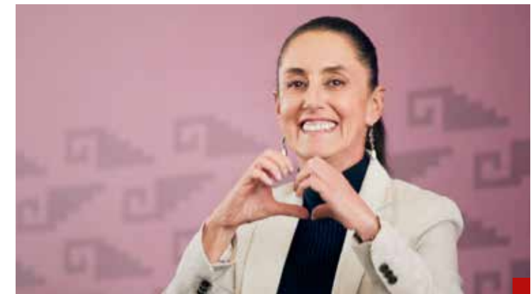
Bajita la mano, la oposición impulsa a Claudia Sheinbaum.