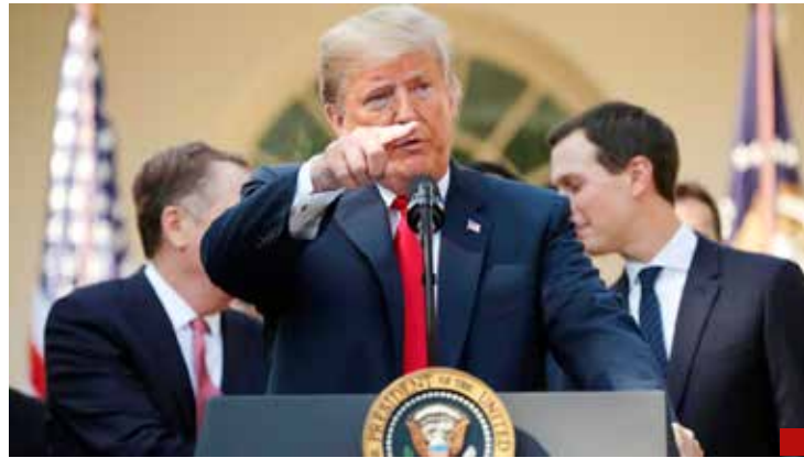
Donald Trump definió a los periodistas como “los seres humanos más deshonestos de la Tierra”.

judicial, su principal y eficaz defensa fue insistir que se trataba de un complot, que lo querían sacar de la contienda presidencial.