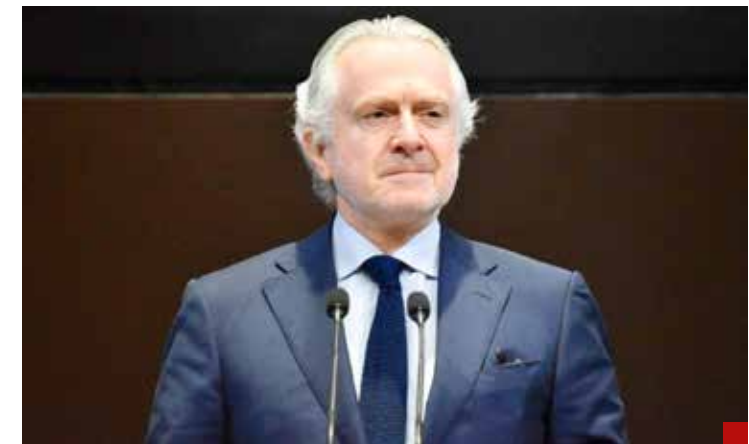
Santiago Creel, eterno perdedor.