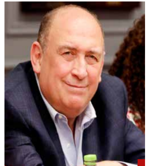
El gobierno federal desapareció 68 mil millones de pesos, afirma Moreira Valdez

“Con la decisión del gobierno de Morena se ven afectados municipios como Mazapil, Zacatecas; Nueva Rosita, Coahuila; Molango Hidalgo; Charcas, Cerro de San Pedro y Villa de La Paz, en San Luis Potosí; Sierra Juárez, Oaxaca; entre otros, que en esta Administración no han visto beneficios de las aportaciones fiscales que hacen las empresas mineras para mejorar las comunidades que se dedican a esta actividad”, concluyó.