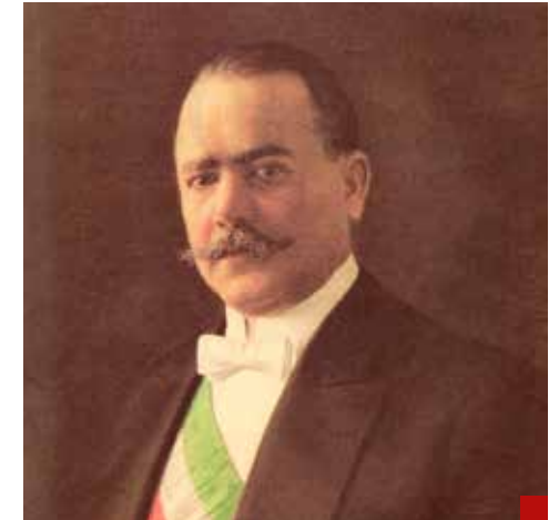
Álvaro Obregón, presidente de México entre 1920 y 1924, mató a todos sus opositores para poderse reelegir en 1928.