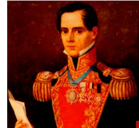
Antonio López de Santa Anna ocupó 11 veces la Presidencia de la República con la disposición de las instituciones para perpetuarse en el poder.

Estados Unidos también ya mandó sus propios mensajes. El Comando Norte dice que un tercio del territorio nacional está invadido por el narcotráfico con la complicidad de López Obrador. La DEA monitorea permanentemente las actividades de la delincuencia organizada y su relación con el gobierno federal. Y la oficina de inteligencia investiga también las actividades de