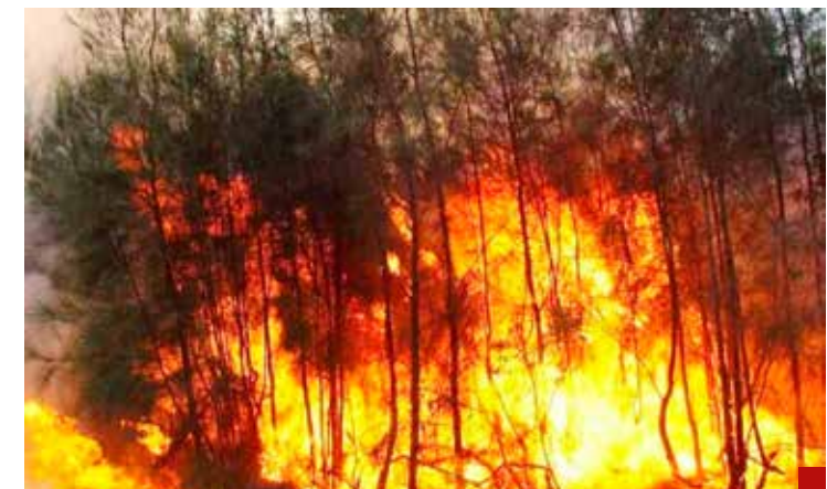
Los incendios es el pan de cada día en el Edomex.