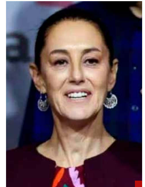
La denuncia de un fraude electoral por parte de la oposición es porque no se tiene la certeza del triunfo de la "corcholata".