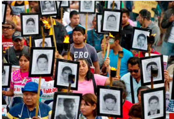
Se irán y Ayotzinapa sin justicia.

“Estoy viendo lo de las redes sociales, todos nuestros adversarios, y la mayoría de los medios de información, están en contra de nosotros”, dijo AMLO.