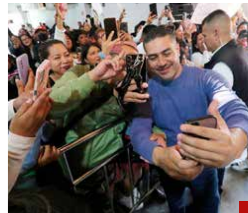
El arrastre popular de García Harfuch crece día tras día.

A este encuentro asistieron mil 500 vecinas y vecinos de Tláhuac, quienes realizaron expresiones de cariño y apoyo a los candidatos.