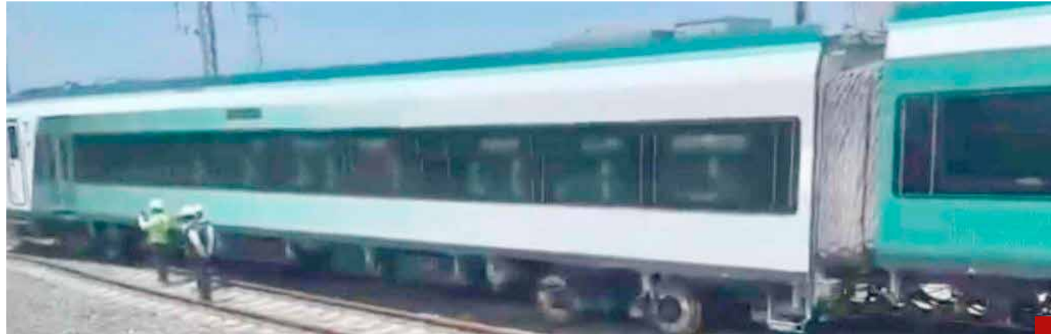
Al Tren Maya ya le dicen el Tren “Falla”.

Este caso ha llamado mucho la atención de los críticos del gobierno de la 4T, en virtud de que -apenas hace algunas semanas- Latinus publicó que existían pruebas y grabaciones que indicaban que al mejor amigo de Andrés, hijo del Presidente, se le habrían otorgado los contratos del balastro que se utilizó para la construcción de las vías del tren y que podrían no haber cumplido con los requerimientos de calidad. Ha despertado “sospechosismo” que con apenas 100 días de operación el Tren Maya -uno de los proyectos de infraestructura emblemáticos de la actual administración- se salió de las vías al llegar a la estación de Tixkokob, en Yucatán, cuando se dirigía hacia la estación Cancún-Aeropuerto, en Quintana Roo, dentro del Tramo 4 del megaproyecto, cuya construcción aún no concluye.