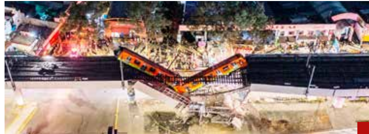
La tragedia de la Línea 12 del Metro no se olvida.

En su momento el Presidente acusó a sus adversarios de intentar desprestigiar a su administración.