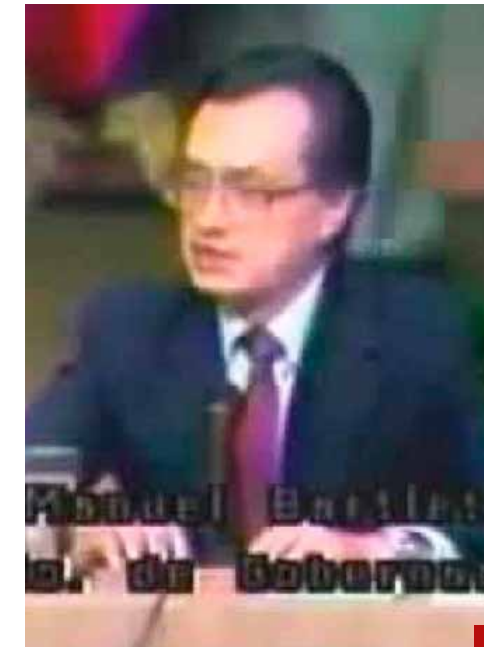
En los años recientes está presente la famosa "caída del sistema" con Manuel Bartlett, en ese entonces secretario de Gobernación.