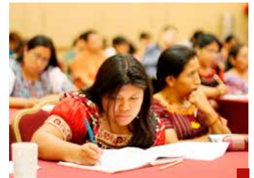
El PRI busca favorecer su desarrollo pleno.

La propuesta del Grupo Parlamentario del Partido Revolucionario Institucional (GPPRI) fue turnada a las Comisiones Legislativas de Educación, Cultura, Ciencia y Tecnología, y de Asuntos Indígenas, para su análisis y dictaminación.