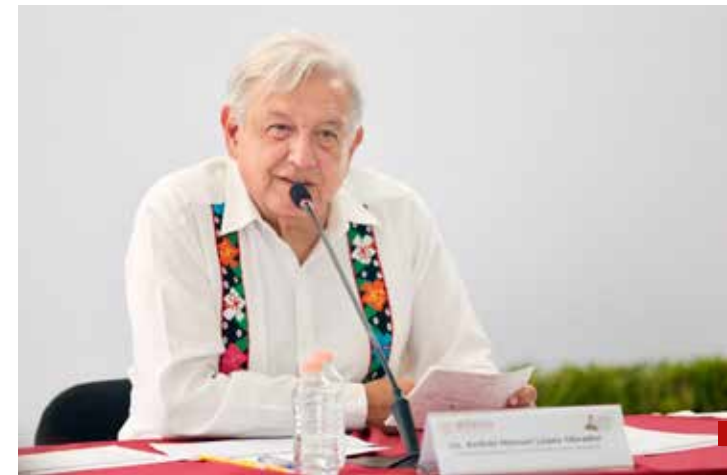
AMLO anuncia apoyo económico a venezolanos deportados.

"No militarizar la frontera, no poner alambradas, no estar pensando en los muros, mucho menos, esto de a ver: 'les vamos a invadir'", agregó.