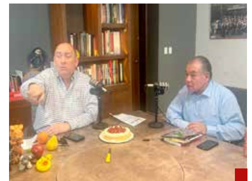
Consideran que fue una mala inversión comprar las plantas eléctricas de Iberdrola.

Además, alertó que las cifras no son alentadoras y conforme a datos oficiales en 2023, la pérdida neta de Pemex Refinación fue de 74 mil millones de pesos, y en lo que respecta a la operación tuvo un quebranto de 183 mil millones de pesos.