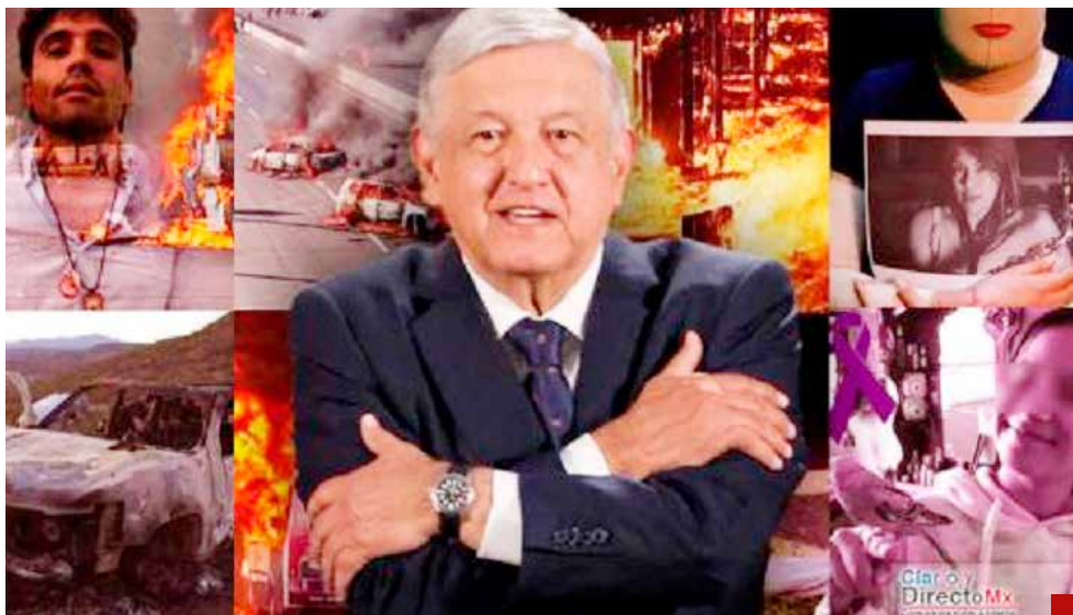
Defiende su frase “Abrazos no balazos”.

En 2022, en un momento en que el presidente explicó por qué había ordenado al ejército no atacar a presuntos miembros de un cartel, López Obrador dijo que también cuidan la vida de ellos, porque “son seres humanos”.