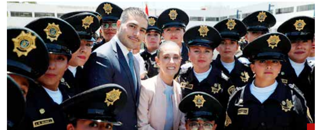
Esta historia se verá a nivel nacional.