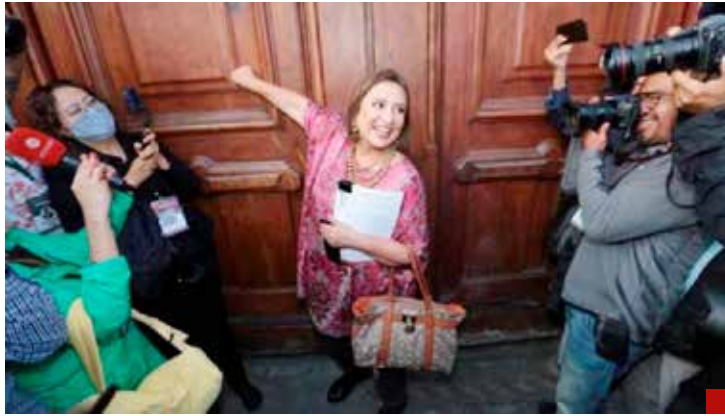
Llamó cobarde al Presidente.

Las masacres, desapariciones, levantones y secuestros son notas cotidianas. El crimen organizado está creciendo y penetrando en varias actividades y en todo el país.