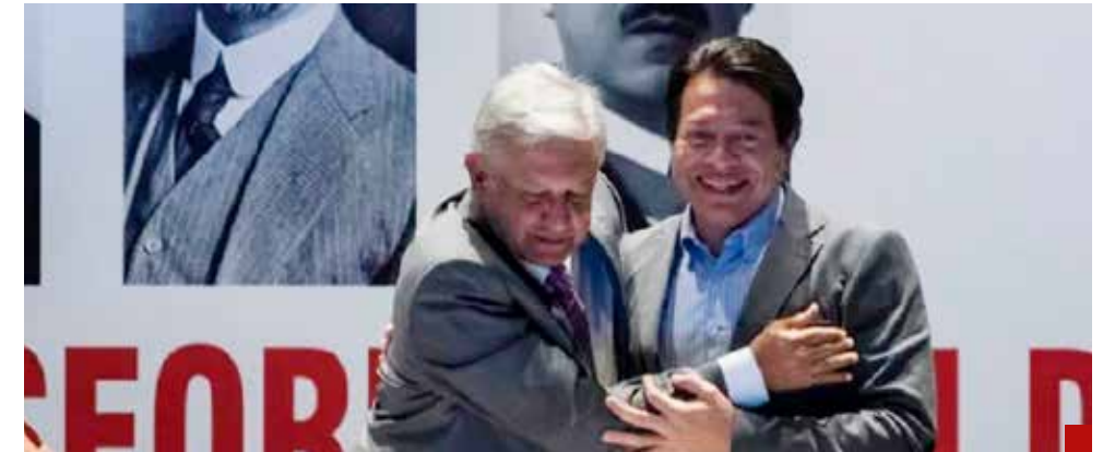
No aprendieron la lección del 2021.