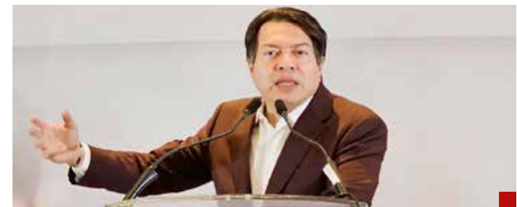
Le piden que saque las manos del proceso interno del Edomex.