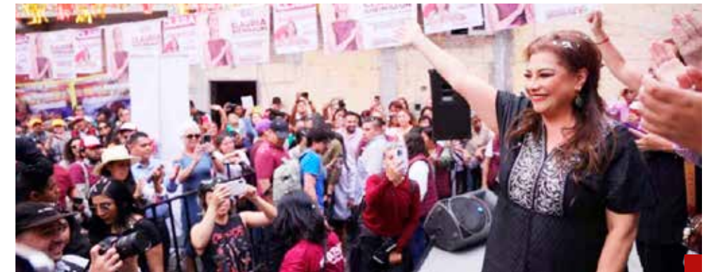
Abucheada la Brugada.