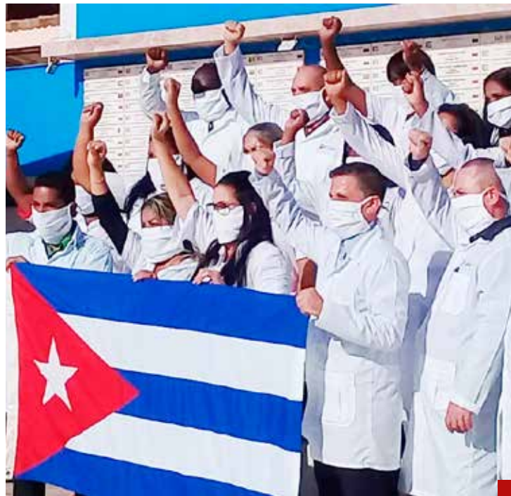
La contratación de supuestos médicos, una forma encubierta de apoyar a la dictadura cubana.

Si lo dudaba, ahí están las protestas de esta semana por los constantes cortes de energía eléctrica y la permanente escasez de alimentos. Ni cómo negarlos.