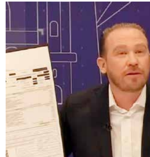
Hasta el momento Taboada la lleva ganada.

Ahí están las señales... lo del Senado es solo mero trámite y el ganón será Chíguil, quien es senador suplente de García Harfuch.