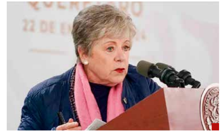
El convenio 'Vuelta a la patria' garantiza el recurso financiero.