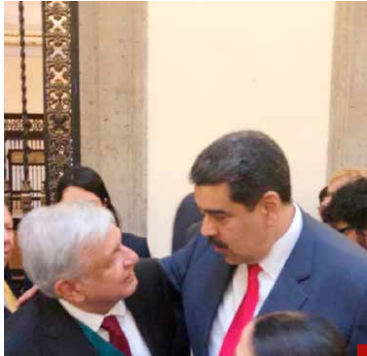
El Presidente apoya a un régimen dictatorial que tiene a su pueblo sojuzgado y sin las más mínimas garantías individuales.

SOMOS UNA EMPRESA 100% MEXICANA ENFOCADA AL RECICLAJE DE PET