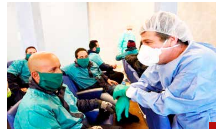
En la pandemia se trajeron 500 médicos cubanos porque en nuestro país hay déficit de galenos.