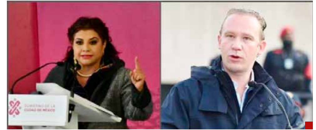
Verdad o mentira, pero los 339 pesos fue un golpe demoledor.