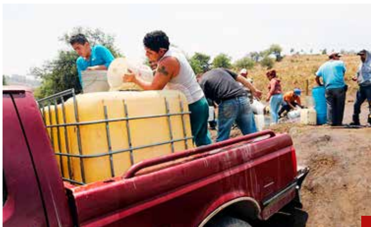
“Huachicol”, actividad lucrativa del crimen organizado.