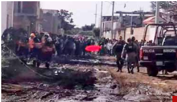
Las masacres han sido una constante.