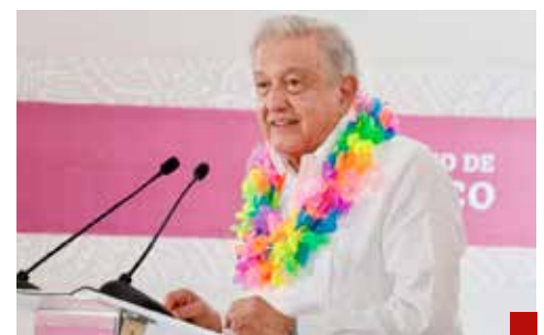
Lo que estimo más importante es la honestidad, asegura el Presidente.

Tras preguntar por qué no se debate sobre la seguridad, el legislador aseveró que en el PRI no permitirán la destrucción de la democracia, que es el momento que la clase política y el Estado mexicano reconozcan que el mayor enemigo de ésta y de este país es el crimen organizado, por lo que pidió que se tome una decisión para enfrentarlo, “porque es el gran elefante que anda en el Pleno, en la Sala, en todos los recintos y todos nos hacemos para un lado, hay que enfrentarlo, porque si no, un día vamos a terminar de ayudantes de ellos”.