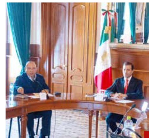
Juan Maccise asumió la responsabilidad de ser alcalde de Toluca con el propósito de dejar mejor a la ciudad y trascender.

Asimismo, se turnaron asuntos a las Comisiones Edilicias de Patrimonio Municipal y Planeación para el Desarrollo.