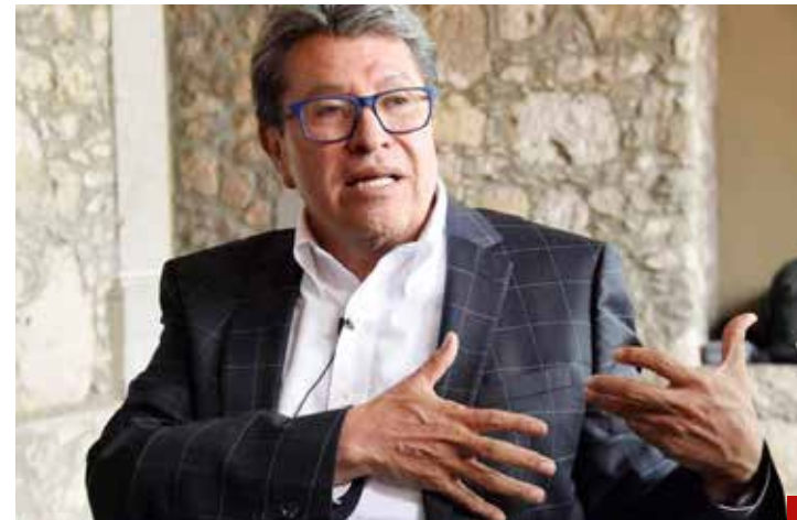
Controla la alcaldía Cuauhtémoc.