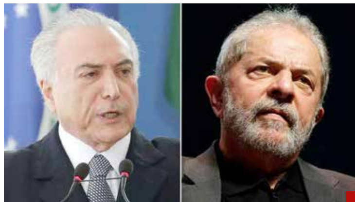
Lula y Temer, los casos más visibles de una operación que ha provocado la caída de ministros.