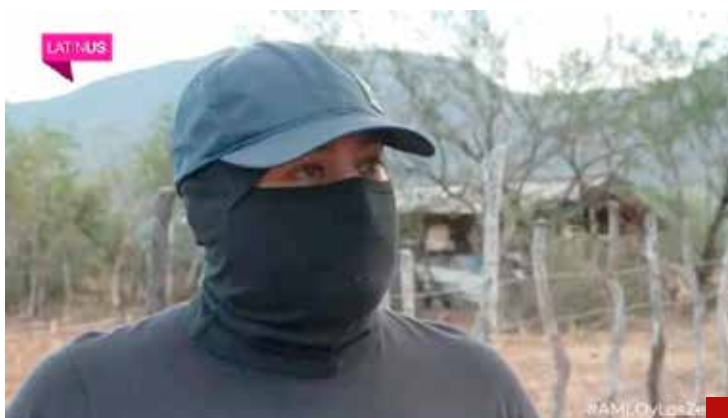
Carlos Loret de Mola remata el escándalo al entrevistar al narcotraficante Celso Ortega.