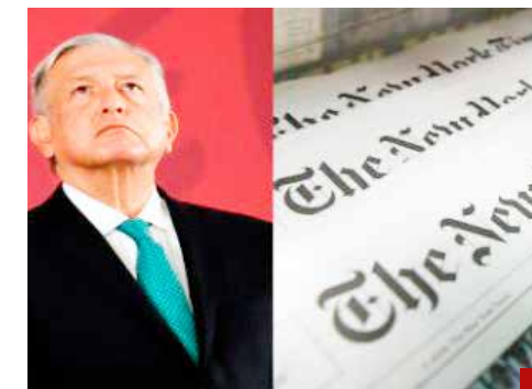
Acusan de pasquín inmundo al New York Times.