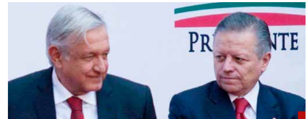
Nosotros respetuosamente interveníamos "cuando Arturo Zaldívar era presidente de la Corte": AMLO.