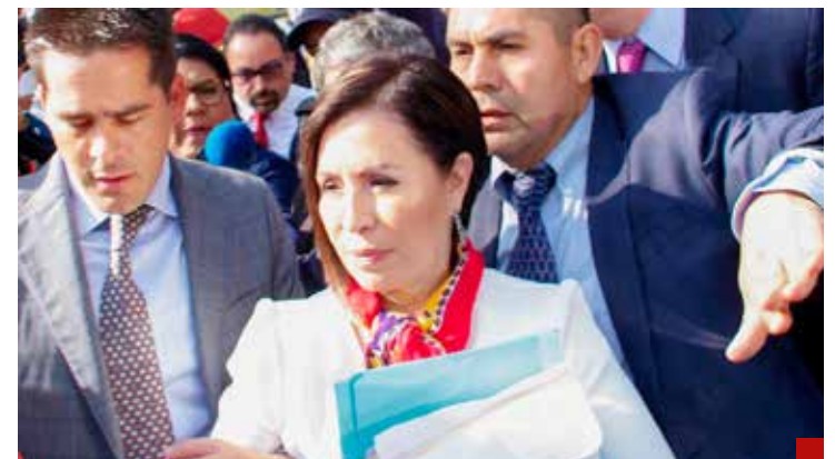
Rosario Robles sufrió venganza política.