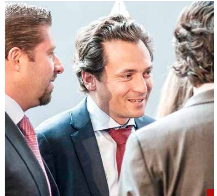
Emilio Lozoya, el juicio más emblemático de la 4T.

En diciembre de ese año, el Primer Tribunal Colegiado del Decimonoeno de Circuito rechazó el recurso de revisión que interpuso la