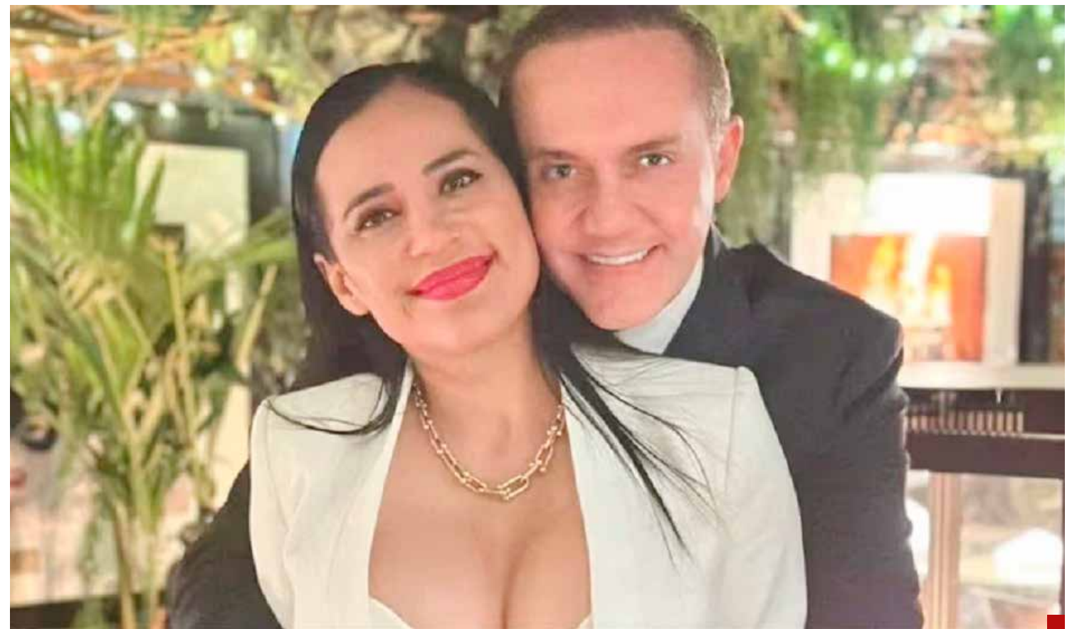
Traicionera, traicionada y chapulina.

nada bien. No olvidar que presuntamente tuvo una relación con Adrián Rubalcava, quien al no ser candidato por la alianza para la CDMX optó por sumarse a la campaña presidencial de Sheinbaum Pardo, la enemiga número uno de Sandra.