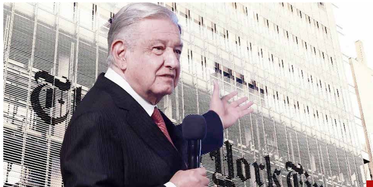
La tercera denuncia en menos de un mes se dio en el periódico norteamericano “The New York Times”.

“Si ustedes calumnian, aquí hay réplica, con todo, sea quien sea”, advirtió.