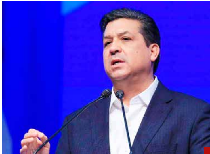
García Cabeza de Vaca, absuelto por el Poder Judicial.