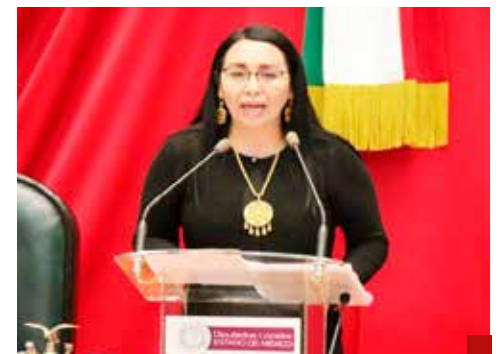
Sólo busca el poder por el poder.