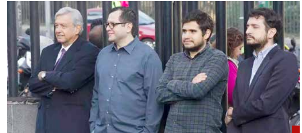
Ahora surgen señalamientos, indagatorias periodísticas de su posible vínculo y de sus hijos con el narcotráfico.

Su obsesión por la alcaldía hace ver que sólo busca el poder por el poder.