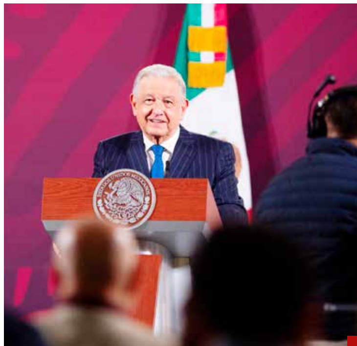
Aplicar la justicia a “peces gordos”, una promesa incumplida de AMLO.

> El Presidente responde ante reportajes de supuestos vínculos con el narco