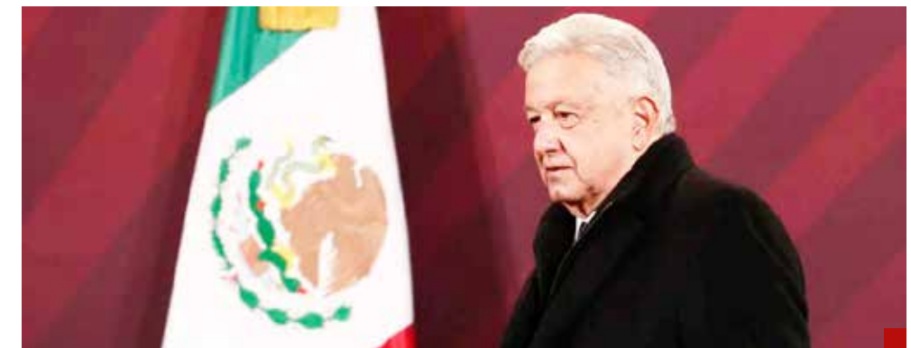
Se siente intocable o raya en el cinismo.