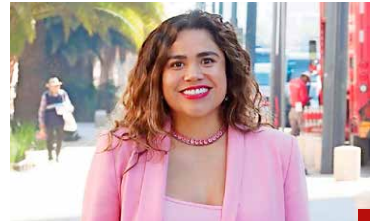
No quieren que con Caty en la Cuauhtémoc suceda lo que pasa en Zacatecas.