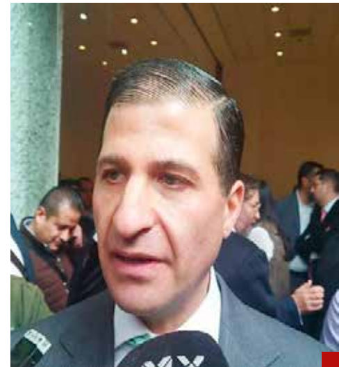
Maccise señala que tiene un compromiso con la construcción de un municipio más inclusivo y solidario.