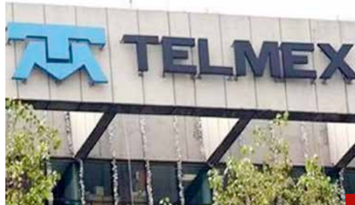
Telmex ya no es negocio, pero no se vende.

Al ser testigo del ejercicio democrático y normativo de rendir