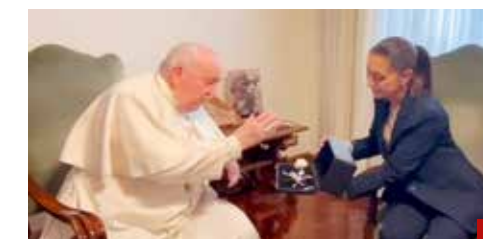
No es católica ni religiosa, pero se reunió con el Papa.