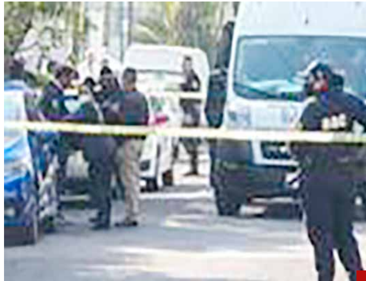
La inseguridad, una tarea pendiente.

que no considera el derrumbe un defecto de construcción porque, adujo, operó sin fallas más de doce años. Fue por falta de mantenimiento, y no por defectos en la construcción original, reiteró.