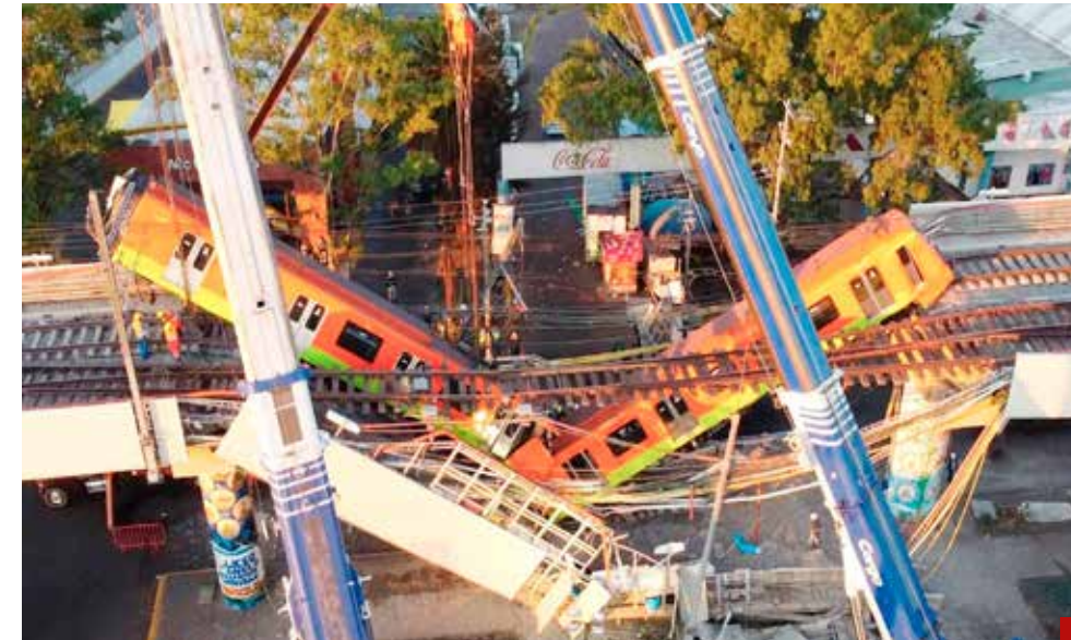
No hay una persona detenida ni imputada.