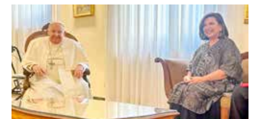
Xóchitl Gálvez reafirmó su fe hacia Dios.