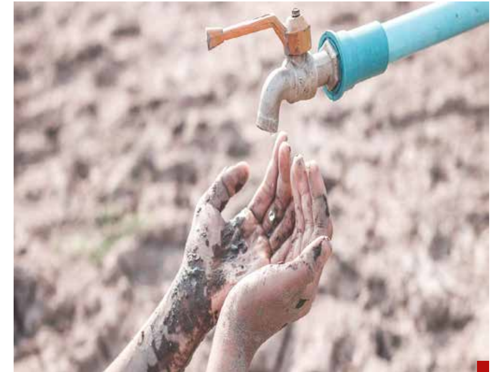
El ‘Día Cero’ se espera sea en junio.

Sostuvimos, dijo, un diálogo cordial e intercambiamos puntos de vista sobre la cultura del descarte, que consiste en la marginación a todo aquello que no produce, así como sobre diversas crisis que enfrenta la humanidad.