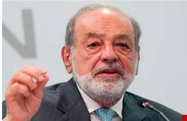
Explica que no ha recibido varios contratos del actual gobierno.

Sobre el colapso de un tramo de la Línea 12 del Metro, obra que se realizó durante el gobierno de Marcelo Ebrard, Slim resaltó