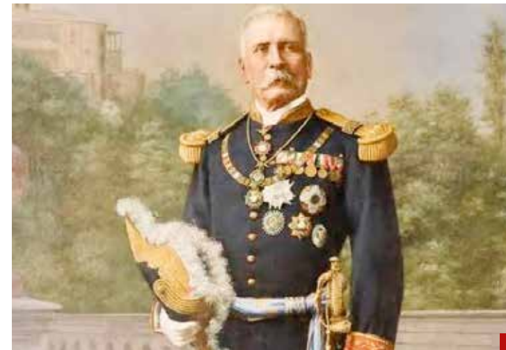
Para Slim, Porfirio Díaz fue un gran presidente.

Al termino del Informe, se llevó a cabo la Cuadragésima Cuarta Sesión Ordinaria de Cabildo, donde aprobaron la exención del