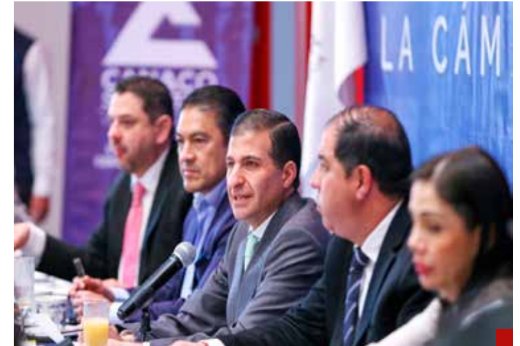
Juan Maccise, alcalde de Toluca, va por una Toluca sólida, equitativa y unida.

Al respecto, el presidente municipal de Toluca, Juan Maccise, señaló que las decisiones tomadas en el pleno del Cabildo muestran su compromiso con la construcción de un municipio más inclusivo y solidario, donde se generan soluciones concretas para mejorar la calidad de vida de la ciudadanía, especialmente de aquellos que se encuentran en condiciones de vulnerabilidad económica.