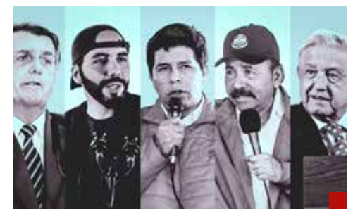
El populismo termina en crisis profundas, afirma.

“El populismo termina en estas cosas: en crisis profundas y esto es responsabilidad de Claudia Sheinbaum, la científica”, afirma de manera categórica.