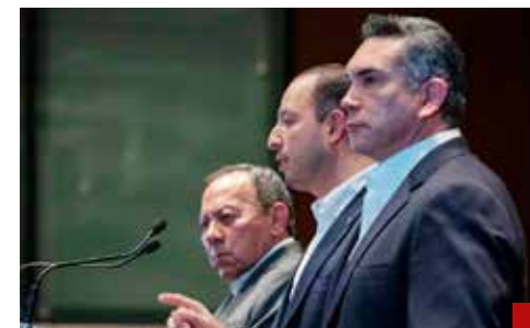
La oposición tendrá que buscar nuevos temas para evidenciar al gobierno federal.