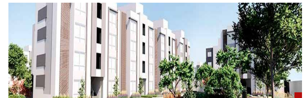
Muchos desconocen el reglamento interior del condominio.

Al compartir su propuesta, que se analizará en la Comisión de Procuración y Administración de Justicia, la diputada destacó que se busca crear conciencia condominal y promover con las y los propietarios o poseedores la importancia de conocer el reglamento interior del condominio para promover una sana convivencia en el inmueble.