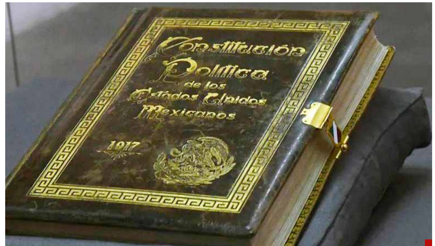
Ningún Poder puede estar por encima de la Constitución Política.

Hubo un verdadero homenaje jurídico, sin lugar a dudas, ante los asistentes con la presencia de servidores públicos de todo el país. En síntesis, después de la bella pieza del orden jurídico de la Nación, sentencio: “Ningún Poder puede estar por encima de la Constitución. Revisaremos las (contra) reformas del Presidente López Obrador. No habrá debilitamientos. Tan tan.