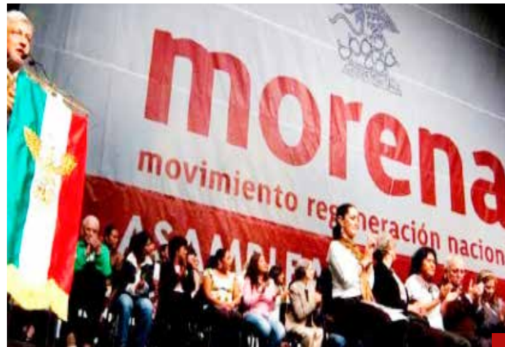
Se deben corregir las omisiones y errores cometidos en este gobierno.