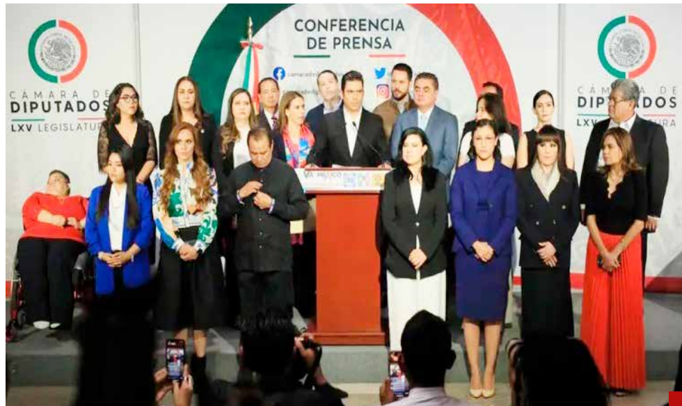
La oposición señala que aprobaría las que resultaran benéficas para el pueblo, pero rechazaría las inviables.

López Obrador debe estar consciente de que sus propuestas no pasarán, salvo las que cuenten con el apoyo de la oposición como la