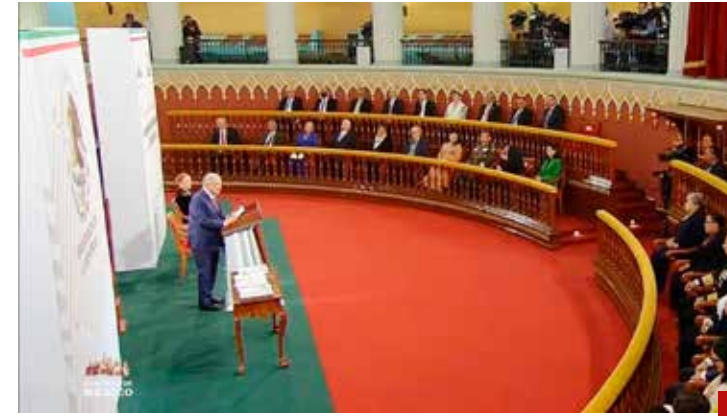
La primera de ellas, la disidente, se llevó a cabo en Palacio Nacional.

Esta tradicional ceremonia única pasa a la historia por no haber asistido el Presidente López Obrador, ni hacer acto de presencia tampoco la ministra presidenta de la SCJN, Norma Lucia Piña; en su lugar acudió el ministro de la SCJN Alberto Pérez Dayan, quien, al hacer uso de la palabra, hizo gala de una retórica certera de la tarea legal de la Suprema Corte de Justicia de la Nación.