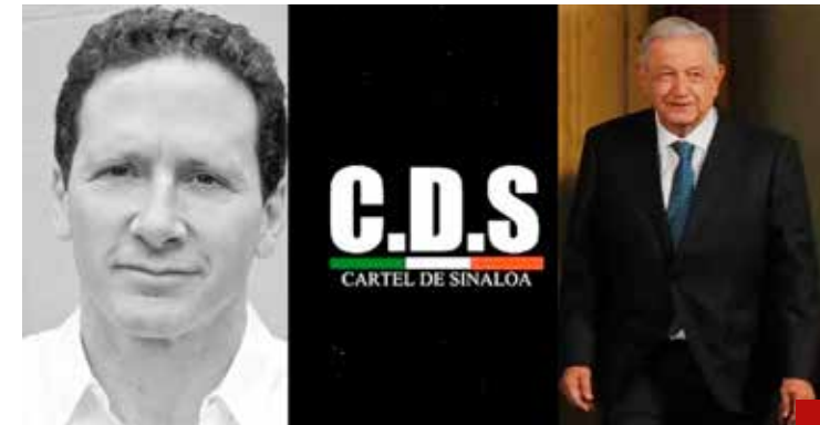
Batazo de hit contra el Presidente.

Con casi 9 años en el poder, el PAN tiene el control de los votantes, la contienda por la alcaldía será difícil pero no imposible.