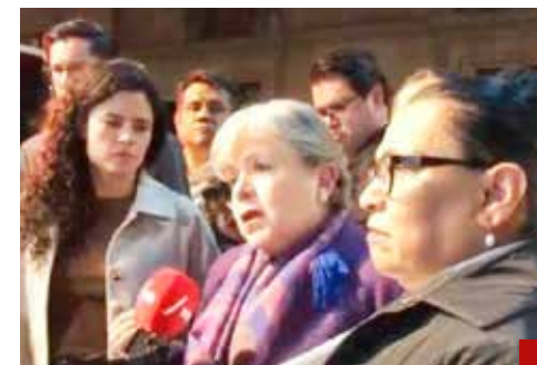
Ya es un caso cerrado.