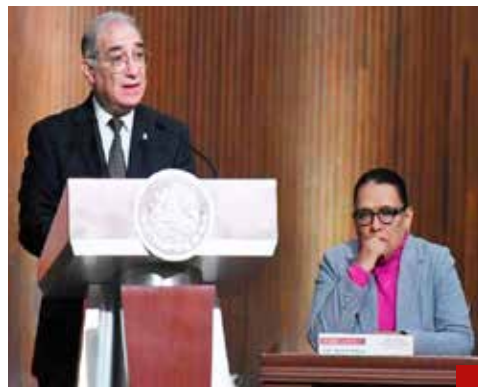
No hay nadie por encima de la Constitución Política: Alberto Pérez Dayán.