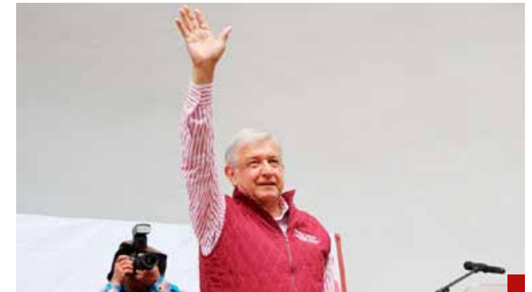
El retiro forzoso de AMLO en la Presidencia de la República.