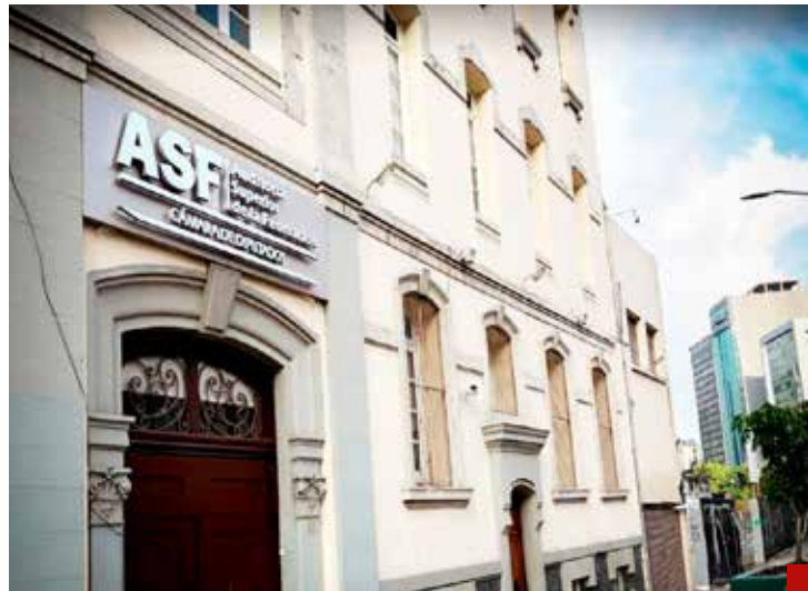
Darle autonomía a la Auditoría Superior de la Federación.