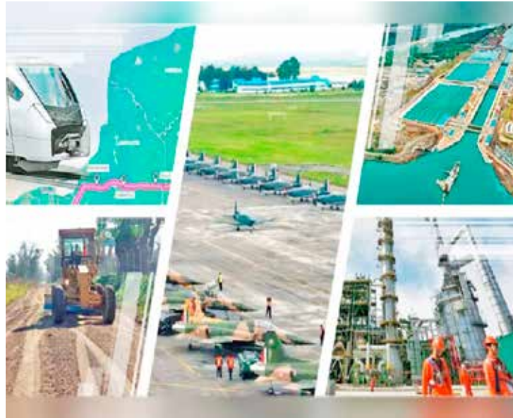
Refinería Dos Bocas, Tren Maya, AIFA y la recién abierta Megafarmacia “elefantes blancos” de la 4T.