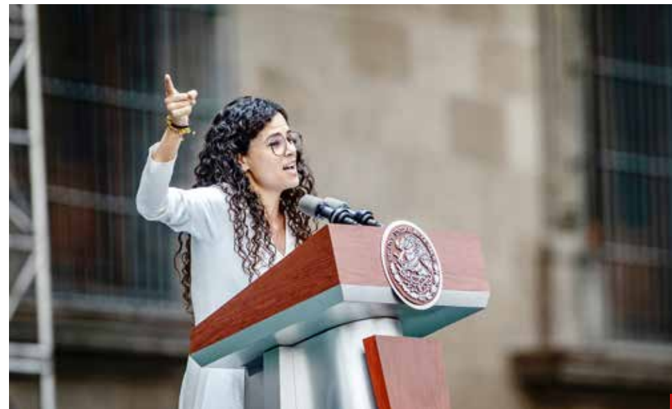
El presidencialismo en su máxima expresión en voz de una funcionaria.