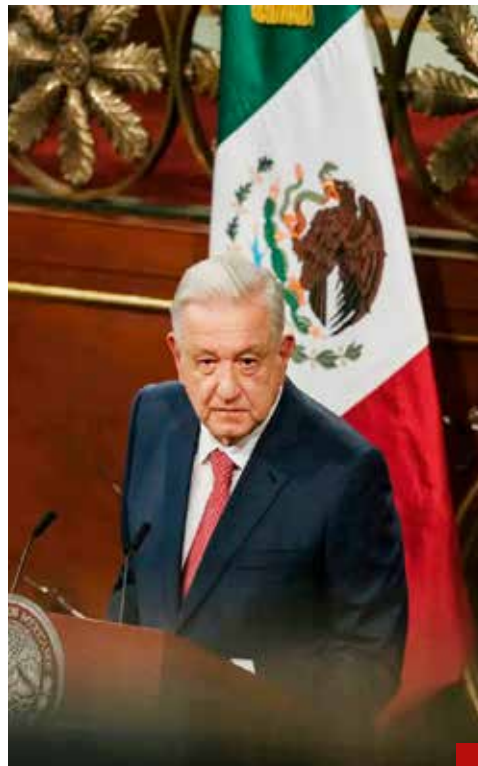
Una elección es también para definir un proyecto de nación: AMLO

que haría en el caso de las pensiones, pero el objetivo es dar material a los candidatos de Morena para acusar, como es su costumbre falsamente, a los partidos de la oposición de estar contra los beneficios populares.