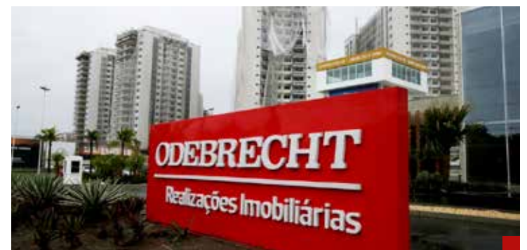
No han llevado a los responsables a juicio de los casos Odebrecht, Estafa Maestra o Agronitrogenados en Pemex.