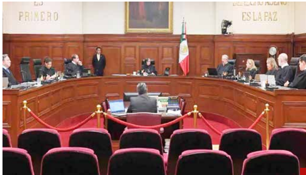
La SCJN tiene las facultades suficientes para invalidar cualquier acto que no respete a la Constitución.