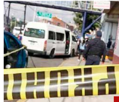
La inseguridad afecta a los empresarios restauranteros.

Al respecto, Vargas se comprometió a estar cerca de los empresarios mexiquenses para dar impulso a sus peticiones.