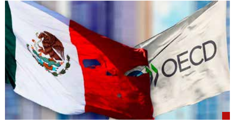
Entre los 38 países que integran la OCDE, México ocupó la última posición.

Si la intención hubiera sido combatir la corrupción se debía haber fortalecido el SNA. En el Artículo 113 Constitucional se esta-