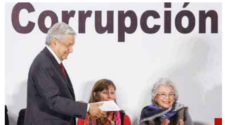
El Presidente Andrés Manuel López Obrador insiste en que “ya se acabó la corrupción”.