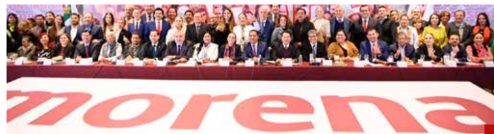
Inicia una nueva era en el Senado con Ricardo Monreal en el timón.

No cabe duda que Ricardo Monreal Ávila es un gran activo de Morena, un liderazgo de los que casi no hay y una gran capacidad de negociador con los demás partidos para sacar adelante las reformas de AMLO... una misión bastante titánica, pero Monreal no se amilana y le entra con todo a cualquier misión que le pongan.