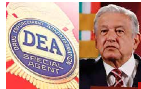
No hay pruebas ni investigación en curso en EU contra AMLO.

semejante imputación... desde Abelardo L. Rodríguez.