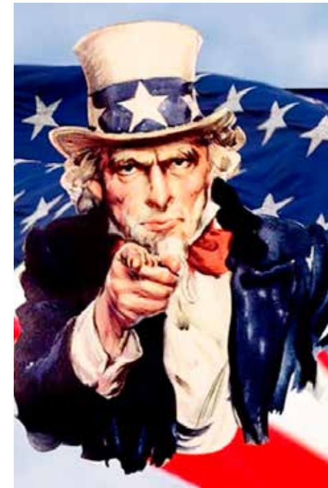
El Tío Sam seguirá siendo el Tío Sam después del 30 de septiembre.

Siendo todo esto una canallada y una falsedad, se queda uno pensando ¿y por qué?... ¿por qué eso?... Es gravísima tal acusación, así fuera solo chisme en prensa. De hecho es el primer Presidente de México bajo