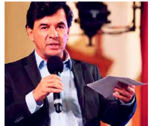
Lo que se sospechaba está confirmado: entrega moches a periodistas pro 4T.