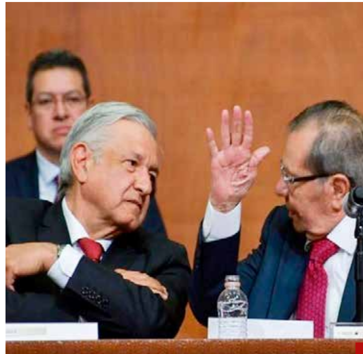
Porfirio Muñoz Ledo, unas semanas antes de morir, acusó a López Obrador de tener alianza con el narcotráfico.

Jones, quien tenía actividades económicas en Coahuila y en Acapulco, Guerrero, ciudad que estaba bajo el control de los Beltrán Leyva.