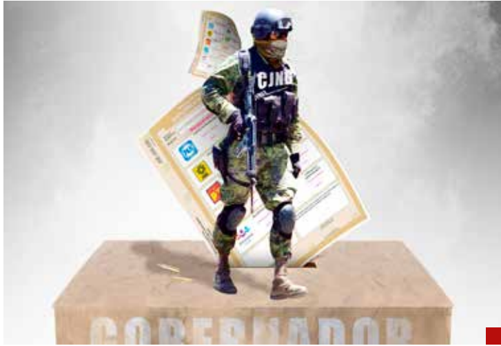
En las elecciones de 2021, México tuvo unas elecciones intervenidas, como nunca antes, por el crimen organizado.