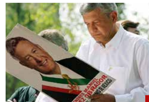
Que recibió dinero para su campaña de 2006.

Para el modito de nuestro Presidente, el modito del renegrido Tío Sam. Un último ejemplo de sus hazañas vindicativas: el expresidente hondureño Juan Orlando Hernández, extraditado a EU con cargos de sobornos de narcotraficantes para frau-