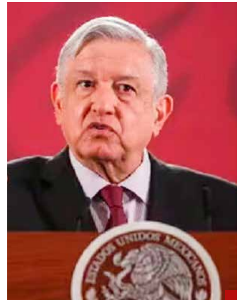
El Presidente 'de los otros datos' está teniendo un complicado cierre de gobierno

de López Obrador con el narcotráfico, y el otro es de la periodista e investigadora mexicana Anabel Hernández.