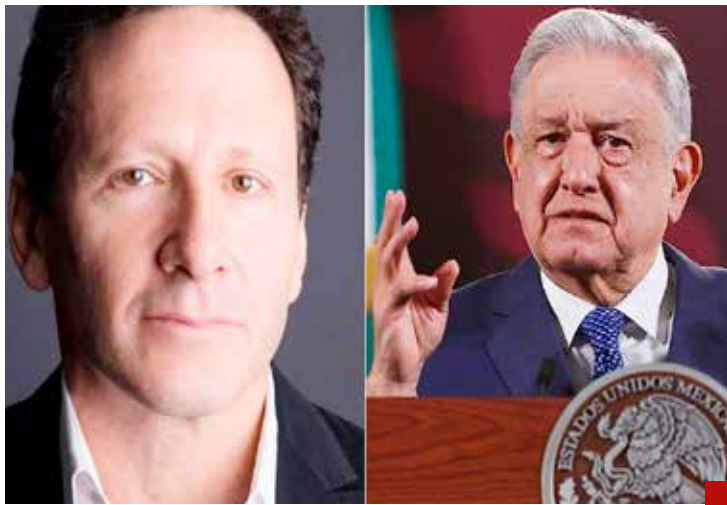
El Presidente López Obrador, en su Mañanera del jueves 1 de febrero, acusó a Tim Golden de ser un mercenario del periodismo.