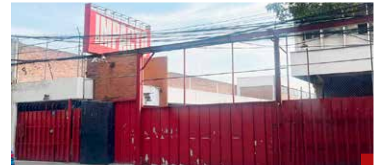
Se agradece la atención de las fiscales para esclarecer el asalto a esta Casa Editorial.