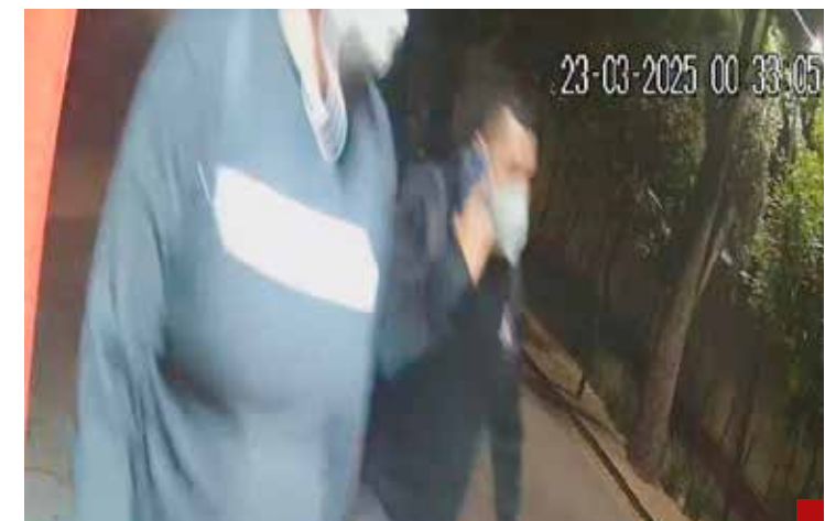
Continúan con las pesquisas para dar con los presuntos responsables.