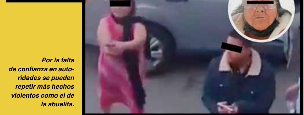
Por la falta de confianza en autoridades se pueden repetir más hechos violentos como el de la abuelita.

el municipio de Chalco, la cual fue hecha por la hija de doña Carlota 'N' el pasado 27 de marzo.