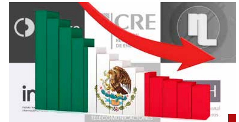
Estado Mexicano, juez y parte.

Como dijera el exitoso cantante Marco Antonio Solís, “¿a dónde iremos a parar?”. La respuesta la tiene el gobierno transformador encabezado por Sheinbaum, en quien millones de mexicanos todavía depositan su esperanza por un México mejor y un buen estado de bienestar. Que así sea.