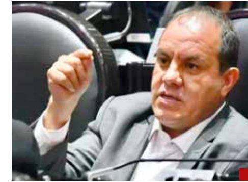
Cuauhtémoc se pondrá Blanco del susto cuando pierda el manto protector.

que sufra los efectos de un sordomudo... Una pequeña aclaración para los lectores de IMPACTO, este material es entregado los jueves por los tiempos de impresión. Así que si entre este