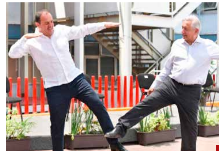
Una herencia de AMLO.