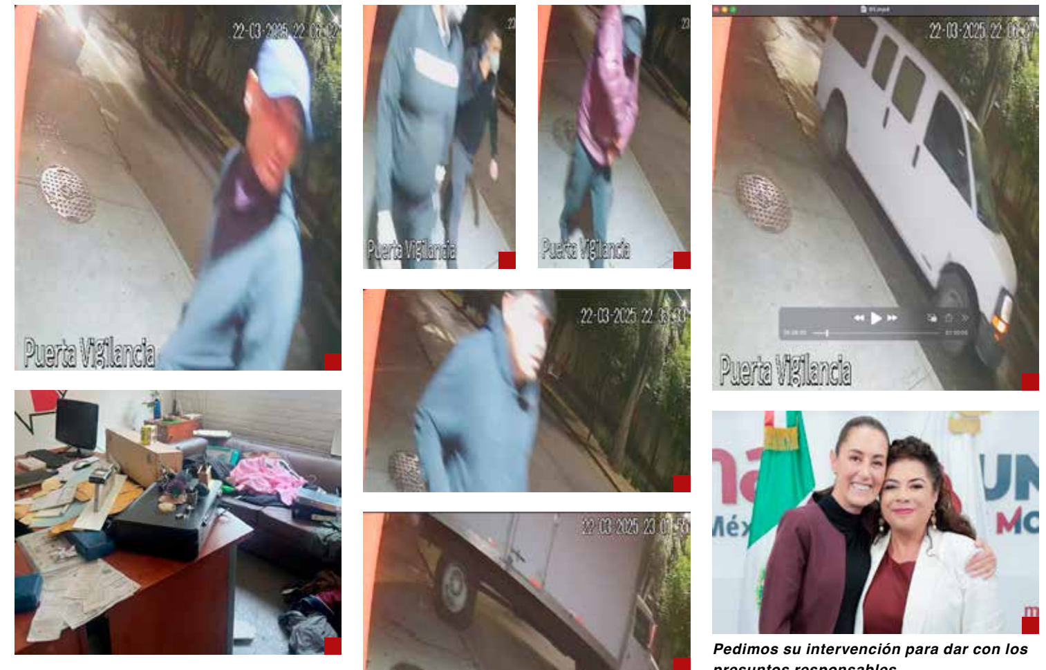
Pedimos su intervención para dar con los presuntos responsables.

Señora Presidenta, es público el compromiso de su gobierno con la libertad de expresión y por su convicción de llegar hasta el fondo del asunto para conocer la verdad, sabemos que este hecho no quedará impune. Que así sea.