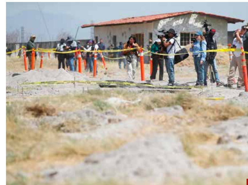
Asesinadas al menos 400 personas.

La crisis del agua es un problema al que debe encontrarle una pronta salida la gobernadora mexiquense Delfina Gómez. Que así sea por el bien de los millones de mexiquenses, pues como bien dice la Presidenta Sheinbaum, el agua es un derecho humano. Que sus palabras no queden en el tintero.