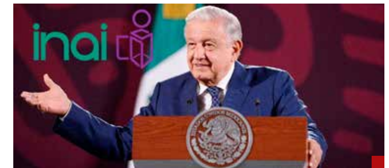
A AMLO le estorbaban en su afán controlador del poder.