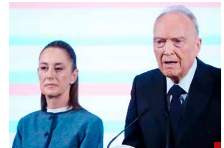
FGR tiene la instrucción presidencial de investigar a fondo.