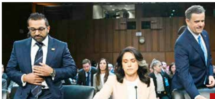
Se desvivieron en elogios hacia García Harfuch.

Ni hablar, al César lo del César y García Harfuch, el supersecretario de seguridad, se ganó el reconocimiento y los halagos de la CIA y FBI, por lo que los grandes resultados del "Batman mexicano" ya trasciende fronteras.