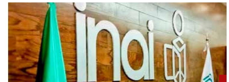
Bye al INAI.