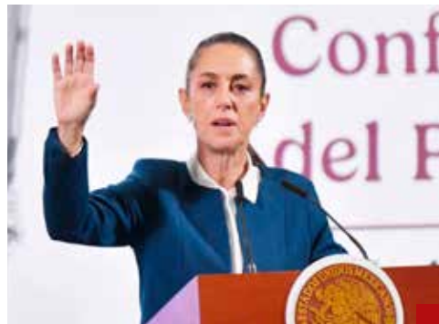
La Presidenta Sheinbaum Pardo ha sido categórica al señalar que el proceso debe conducirse con estricto apego a la legalidad.