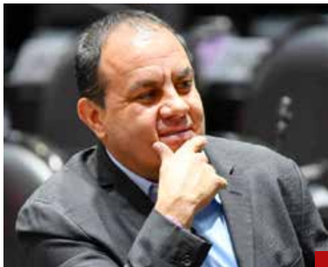
Cuauhtémoc Blanco une a las diputadas morenistas en su contra.