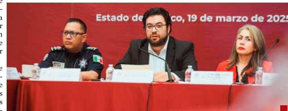
El alcalde de Naucalpan busca recuperar espacios libres para beneficio de la comunidad femenina.