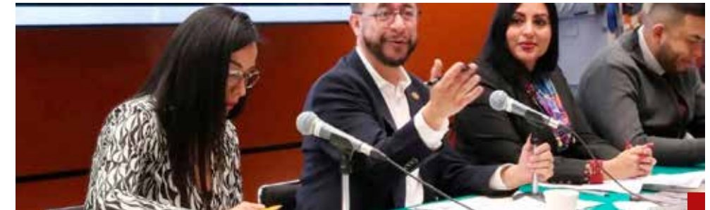
La Sección Instructora desechó la petición de desafuero.