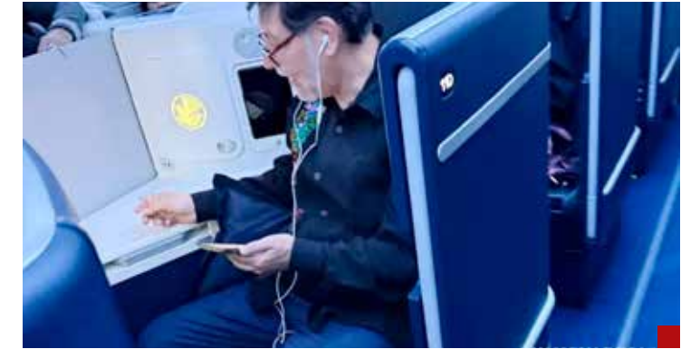
Protagonista de escenas condenables.

Porque en la catarata de acusaciones al gobierno estatal, hasta ahora no se involucra a corporaciones y dependencias del gobierno federal que también conocieron en su momento de ese escandaloso y reprochable hecho que invade las esferas internacionales. Armas de uso de las Fuerzas Armadas, el procesamiento y distribución de narcóticos, rebasan el ámbito local... Las marchas, plantones, suspensión de clases y plantones magisteriales volvieron a los