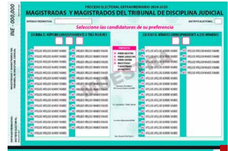
El gasto en la impresión de las boletas fue archimillonario.

tiempos de antes. Los maestros de Oaxaca integran uno de los más grandes contingentes.