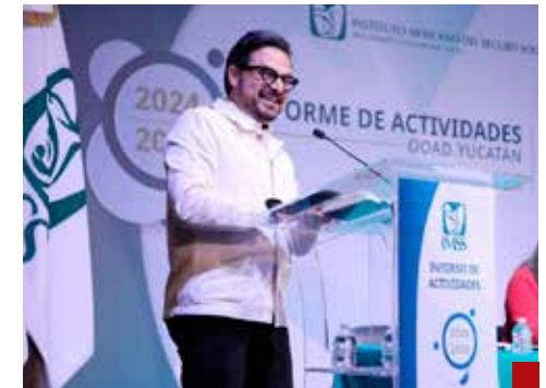
Hay director general del Seguro Social por un buen rato.