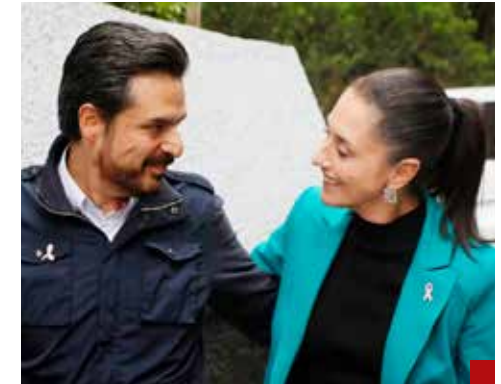
Unidos por la salud de millones de mexicanos.