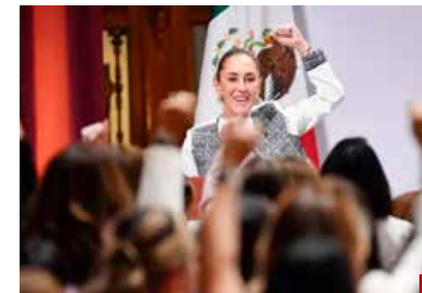
La Presidenta siempre ha salido en defensa de las mujeres.

La Secretaría de Seguridad estatal informó que la detención se logró luego de un operativo realizado en la comunidad de Tlecuilco, donde localizaron a los sospechosos en posesión de motocicletas, una camioneta y chalecos tácticos.