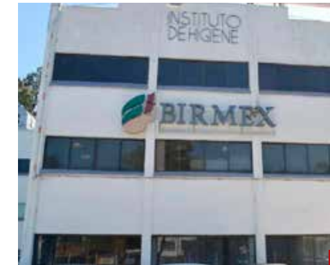
En Birmex sí se contemplan movimientos.