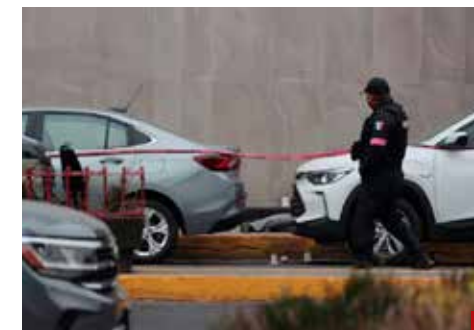
Dos funcionarios son asesinados frente al palacio municipal de Ocuilán, Edomex.