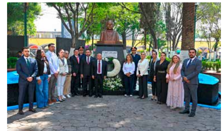
A preservar el legado y las enseñanzas del Benemérito de las Américas.

Integrantes del cuerpo edilicio montaron una guardia de honor y colocaron una ofrenda floral en el busto de Benito Juárez colocado en la explanada del palacio municipal para preservar el legado y enseñanzas del Benemérito de las Américas.