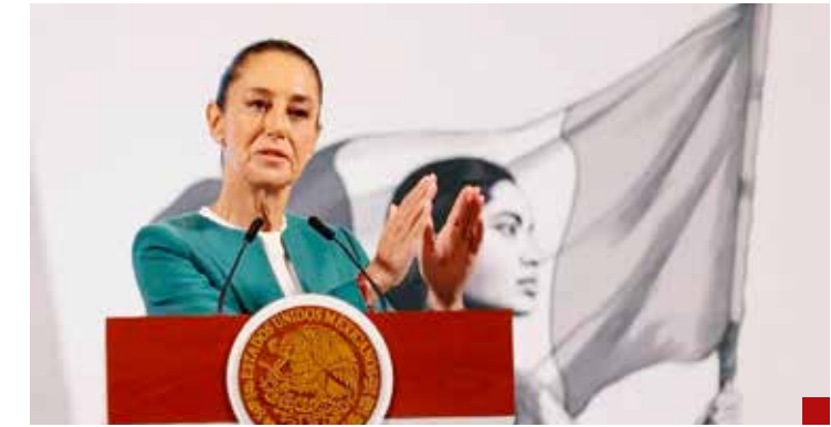
El compromiso presidencial lo deben entender sus subalternos.