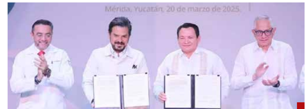
El director general del IMSS y el gobernador Díaz Mena firmaron el Convenio de Colaboración para el fortalecimiento del programa IMSS-Bienestar en la entidad.

principalmente con la próxima apertura del Hospital General de Zona (HGZ) de Ticul.