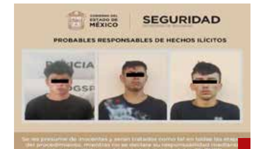
Detienen a cuatro, entre ellos un menor de edad, presuntamente los homicidas del crimen doble en Ocuilán.