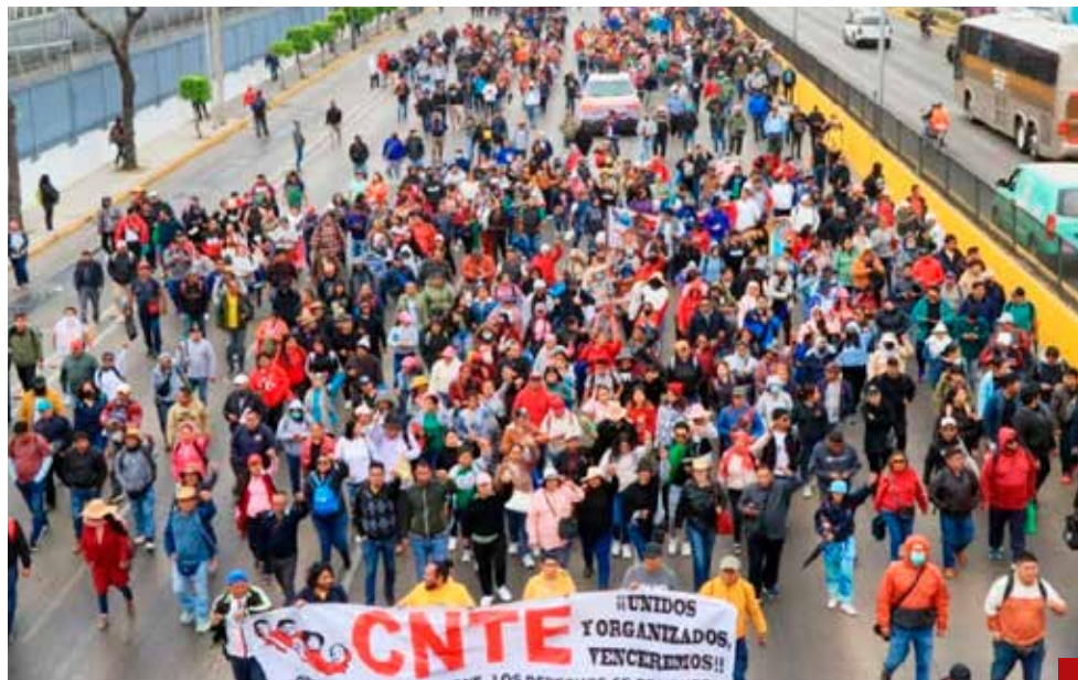
Se debe atender la demanda del magisterio sobre la Ley del ISSSTE.

Reafirma la importancia del magisterio en la construcción del país. "El futuro de México se forja en las aulas y sus forjadores merecen un retiro digno y respetado", puntualiza Toledo Zamora.