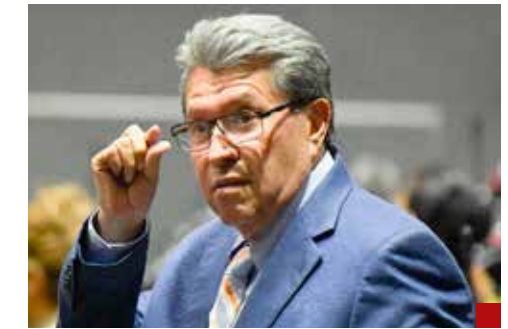
No seremos tapadera de nadie: Ricardo Monreal.