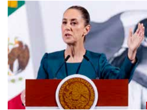
La Primera Mandataria respalda labor de Zoé Robledo.

Al rendir su informe de actividades, el representante del IMSS en Yucatán, Sansores Río, destacó la modernización de infraestructura hospitalaria, adquisición de equipamiento médico con inversiones históricas para brindar más y mejores servicios a las y los derechohabientes,