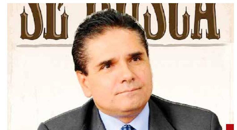
Silvano caerá de un momento a otro.