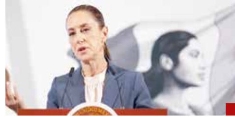
La Presidenta demanda no politizar el caso.