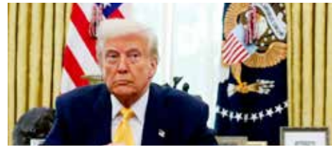
Donald Trump insiste en abatir a las organizaciones criminales que operan en suelo mexicano.