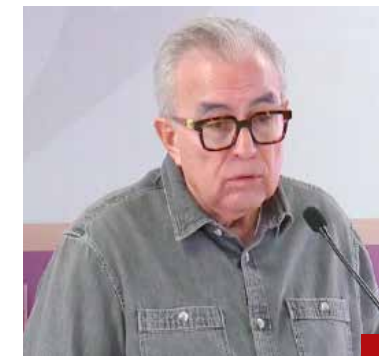
Ya Rubén Rocha Moya reconoce su incapacidad.