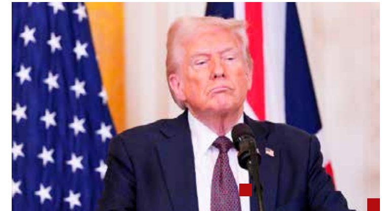
Donald Trump ordenó investigar a políticos mexicanos ligados al tráfico de drogas y migrantes.

Y es que el ex gobernador michoacano no puede vivir huyendo. Y la pregunta obligada: Cuándo irán tras de Ignacio Ovalle Fernández, protagonista del mayor robo del sexenio pasado al saquear Segalmex. O será que la justicia solamente es para los opositores. Tampoco sería bueno que mantuvieran en la impunidad a Cuauhtémoc Blanco Bravo. Aplíquense para no generar elucubraciones.