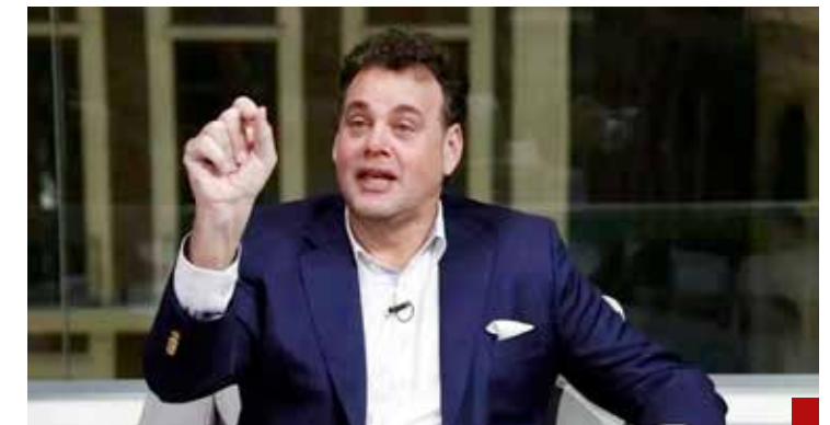
David Faitelson señala que es ‘atole con el dedo’ la iniciativa de Brugada.

al ser vivo, ya es un acto de violencia”, señaló el comentarista a través de X (antes Twitter).