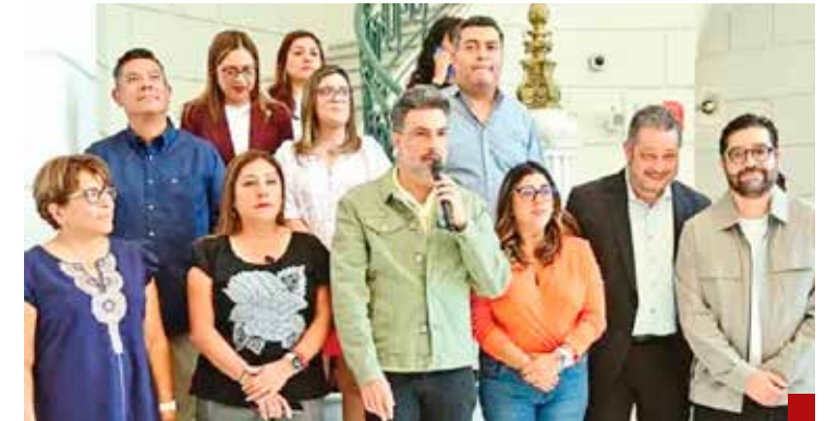
Comisiones del Congreso local ya le dio la primera estocada a la fiesta brava. El martes decide el pleno.

“Clara Brugada: yo voté por usted, pero está equivocada. No hay toros sin violencia. Los toros son una violencia. Martirizar al animal,