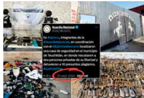
En septiembre de 2024, la Guardia Nacional realizó un cateo y no encontraron el centro de exterminio.