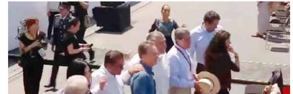
Andaban en la... distracción.

Claudia Sheinbaum manejó la situación entre risas considerándolo como un tema menor: "Estaban distraídos, es todo", añade.