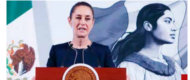
Se distrajeron, es todo, expresa la Primera Mandataria.