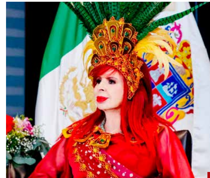
Causa pena ajena.