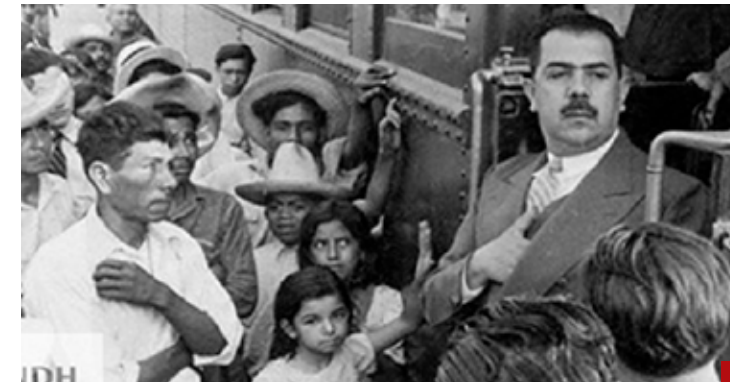
El corporativismo surgió con Lázaro Cárdenas.

Luego matizó su postura y, finalmente, terminó por recular y aceptar que no será el sucesor de su hija Evelyn como gobernador en el estado de Guerrero. Incoherencias y absurdos que son el soporte de las patrañas... Desfiguros y ridiculez son la fórmula que Layda Sansores aplica