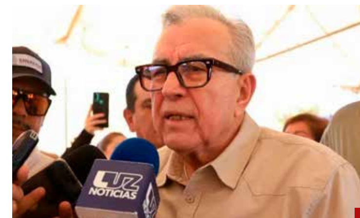
¿Entregarán también a Rubén Rocha Moya?