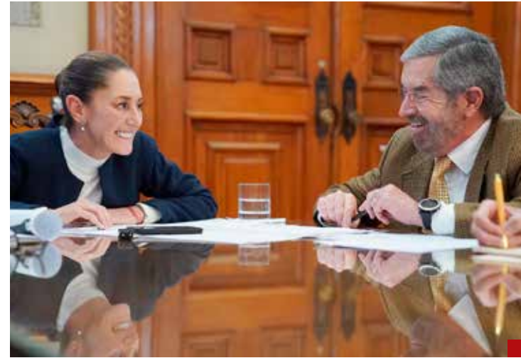
Con De la Fuente en la cancillería, la Presidenta tiene un problema menos.

El canciller De la Fuente ha mostrado que tiene la sensibilidad, capacidad y firmeza para llevar a buen puerto la relación diplomática más importante para asegurar la prosperidad y el futuro de México.