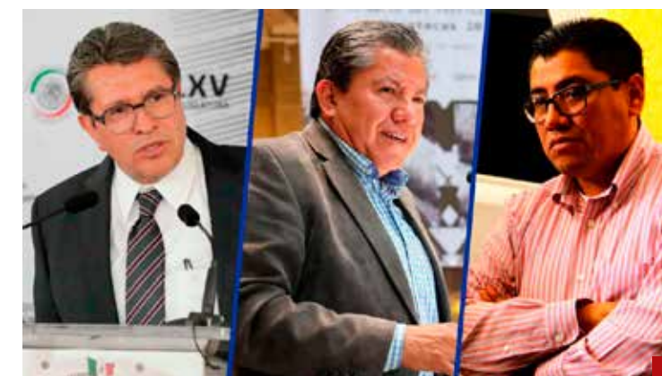
Se busca poner fin a los cacicazgos.