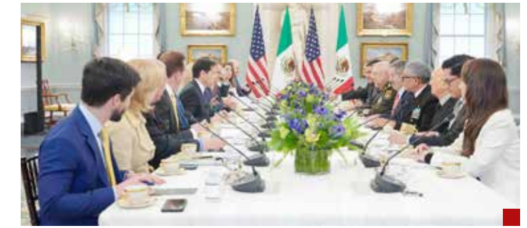
El diálogo fue fructífero y cordial.