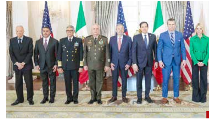
Una reunión binacional de alto nivel.

El secretario de Economía, Marcelo Ebrard Casaubón, ha expuesto los riesgos para la propia economía norteamericana de imponer los aranceles, lo que además sería violatorio del T-MEC y daría al traste con su continuidad.