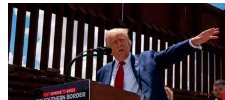
Trump muestra su inconformidad.

La reforma contra el nepotismo que promoviera la Presidenta Claudia Sheinbaum Pardo tiene confrontadas a las diversas corrientes de Morena, así como a sus aliados políticos, como es el caso del Partido