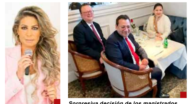
Sorpresiva decisión de los magistrados.