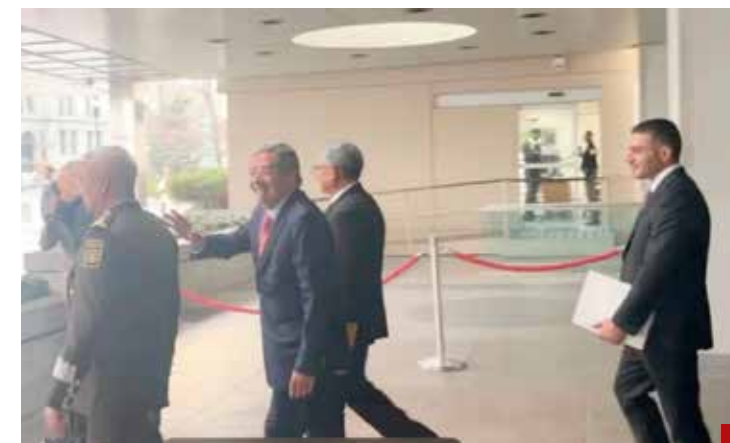
Salida triunfal del canciller tras la plática con Marco Rubio.