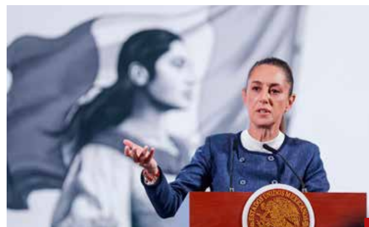
Aplazan su iniciativa contra el nepotismo.