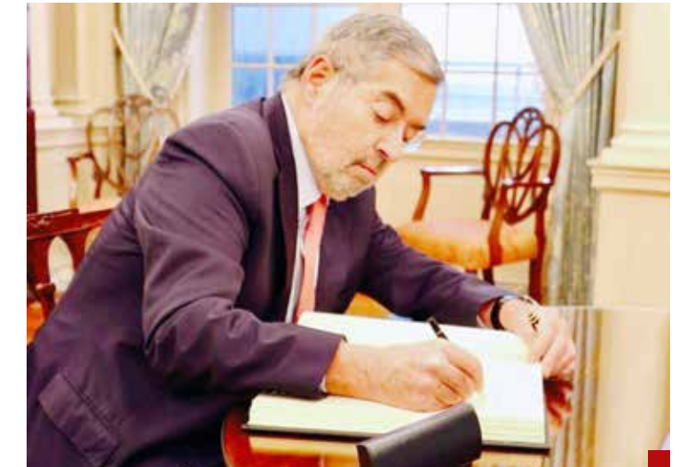
Logra acuerdos benéficos para México.