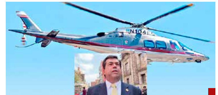
Traicionó a la Presidenta Sheinbaum.