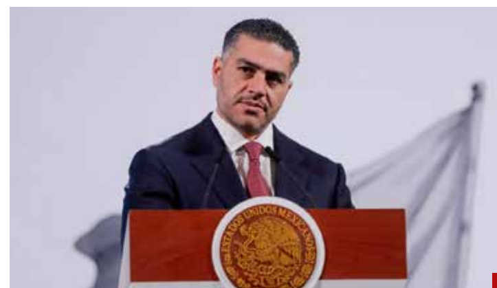
Está debilitada la estructura criminal de Los Chapitos: Omar García Harfuch.

Acción, señalaron, que se enmarca en las labores de coordinación, cooperación y reciprocidad bilateral, en el marco del respeto a la soberanía de ambas naciones.