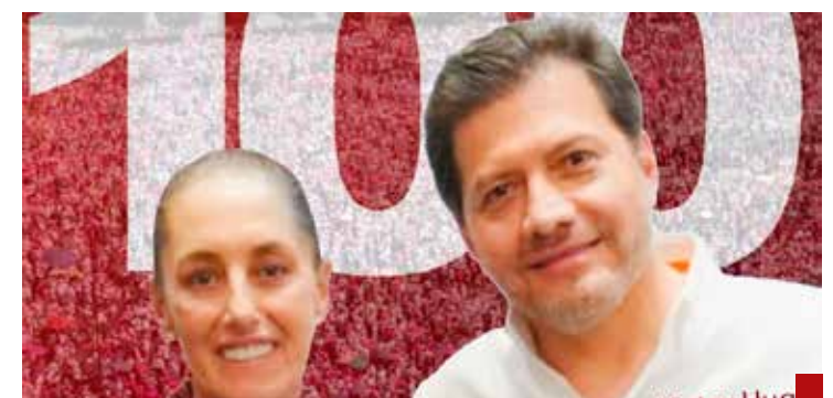
Una presidenta reconocida por el IECM.