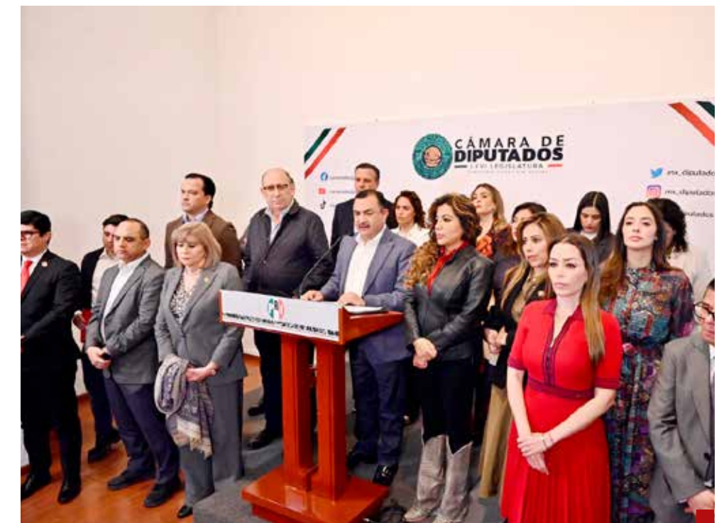
Señalan que es justo el reclamo de los maestros del país.