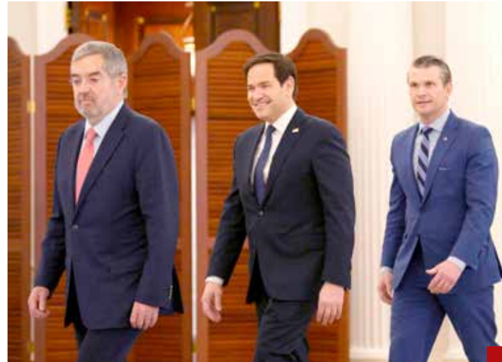
De la Fuente reiteró 'cooperación sí, subordinación no'.

Su tacto, sensatez y firmeza son características que llevarán a buen puerto la renovación del T-MEC. Además, contará con el apo-