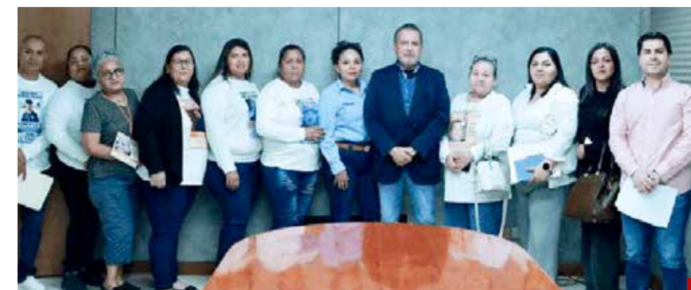
También se muestra solidario con los colectivos de búsqueda de Sonora.

liar oficial de búsqueda con garantía de seguridad social, seguro de invalidez y seguro de vida; así como el acompañamiento de seguridad policial en jornadas de búsqueda, en forma particular se destaca también la creación de un banco nacional de datos de ADN, que agilice la identificación humana, entre otras garantías.