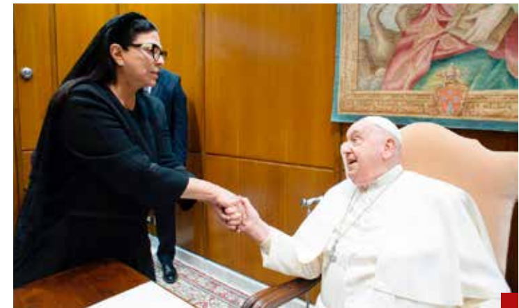
El encuentro se dio en la Santa Sede.