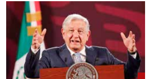
Reformar y "democratizar" el Poder Judicial, iniciativa de Andrés Manuel López Obrador.