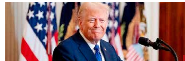
Para Donald Trump, las acciones que realiza México contra el narcotráfico son insuficientes.