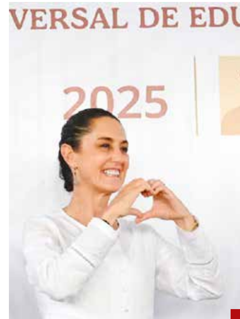
La Presidenta afirma de manera categórica que los mexicanos son responsables del 10% del PIB de Estados Unidos.

mil millones de dólares en remesas en 2024, lo que representa alrededor de 4 por ciento del PIB.