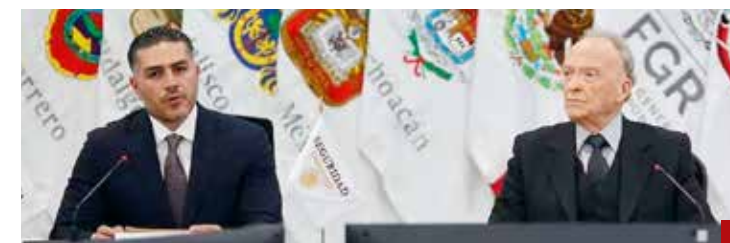
La coordinación ha dado resultados.

Todo un caso por resolver, en el que no se debe olvidar el castigo contra el personal de la Fiscalía, instancia que está en el ojo del huracán, pues es señalada de tener en sus filas a secuestradores y extorsionadores.