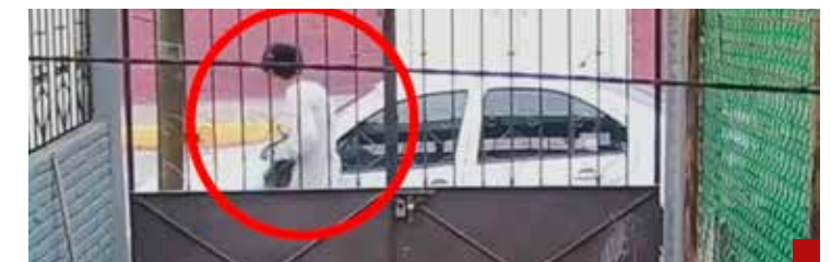
Coraje nacional por el caso bebé de Tultitlán.