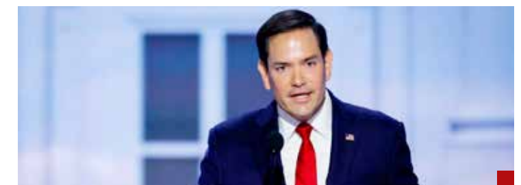
El objetivo central es desmantelar a los cárteles mexicanos: Marco Rubio.