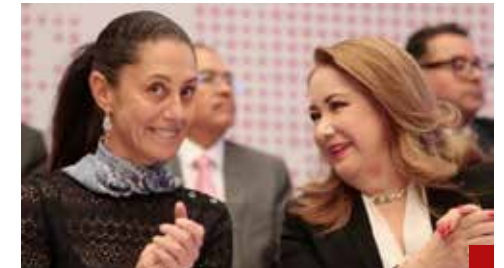
La Presidenta Sheinbaum y la ministra Yasmín Esquivel afirman que la elección judicial sigue en pie.

Pero pese a todo lo anterior, la elección está firme para realizarse el primer domingo de junio, como lo dijeron la Presidenta Claudia Sheinbaum Pardo y la ministra Yasmín Esquivel Mossa.