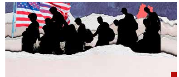
México, territorio de paso para el "sueño americano".