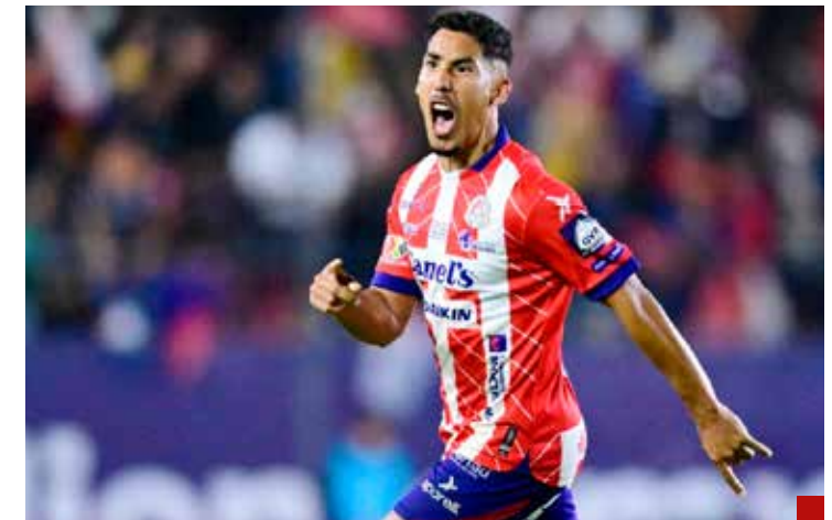
El futbol olvida los problemas de San Luis Potosí.