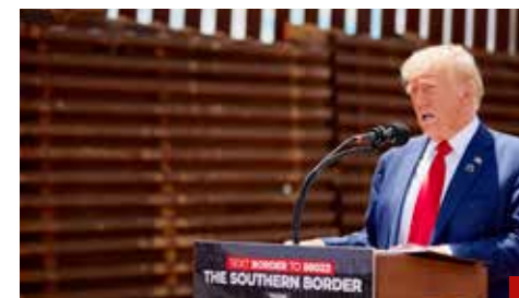
Deportaciones masivas, la amenaza de Trump.