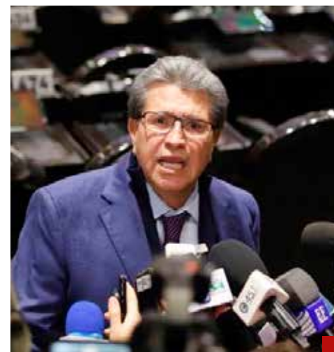
El objetivo es no fallarle al pueblo de México, expresa Ricardo Monreal.

Con estas medidas, Monreal busca responder a las demandas ciudadanas y fortalecer áreas estratégicas para el desarrollo del país, destacando que "no es fácil ajustar el presupuesto, pero el objetivo es no fallarle al pueblo de México".