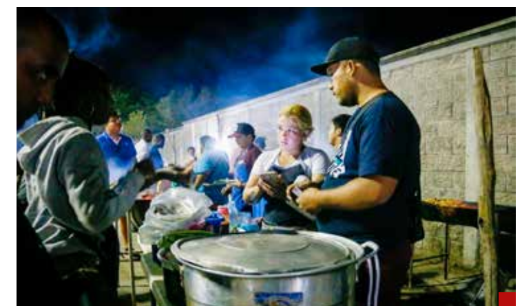
Ya es común verlos trabajar en México.