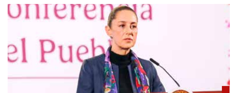
Estamos preparados para enfrentar la decisión de EU: Claudia Sheinbaum.