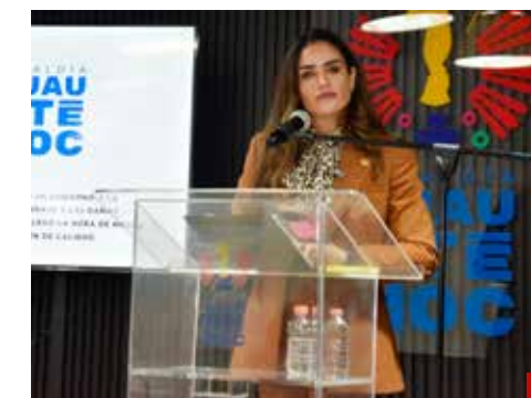
Piden trabajar con calma para hacer una revisión a profundidad.

En lo que se refiere a obras, entre 2021 y 2023, la alcaldía Cuauhtémoc adjudicó directamente 111 de 183 obras contratadas, el 60.65% del total, práctica que debería ser la excepción