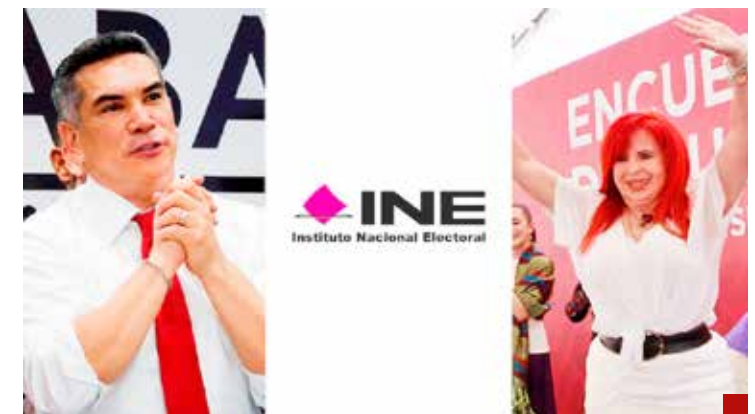
Alejandro Moreno, afectado por los audioescándalos.