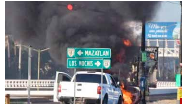
La violencia se incrementó con la llegada de diciembre.

Reconoce que las autoridades no pueden evitar en su totalidad la comisión de actos delictivos y hechos violentos, pero sí pueden trabajar en evitar la impunidad.