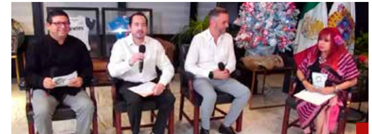
Presentado públicamente en el programa "Martes del Jaguar".

Los triunfos locales del equipo de esa entidad han servido para que los potosinos olviden por un momento la larga lista de problemas que los aquejan.