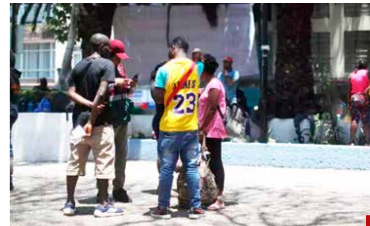
La Ciudad de México, un ejemplo claro del tráfico de personas.

El problema migratorio en el país es altamente complejo, los migrantes no sólo se enfrentan a diferente tipo de violencia, secuestros y extorsiones, ahora más que nunca están en el ojo de los grupos delictivos, en ocasiones interactúan de manera consensuada con los grupos criminales, en otras son secuestrados, obligados a trabajar para ellos en su carrera criminal.