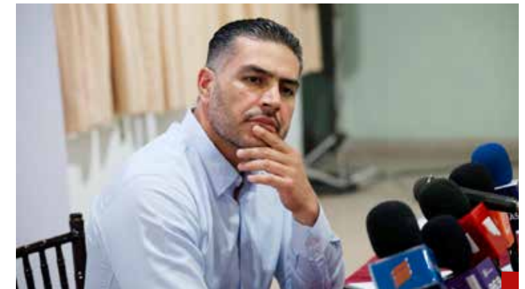
Ha habido operaciones todos los días: Omar García Harfuch.

El gobierno de Sheinbaum ha apostado por reforzar la presencia militar y policial, pero reconoce que los resultados no serán inmediatos.