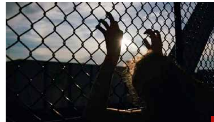
El tráfico de personas, un negocio altamente lucrativo.