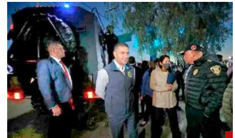
Llega a Sinaloa y surgen los decomisos.