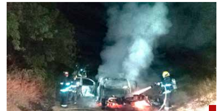
Polémica por las causas del incendio del vehículo.