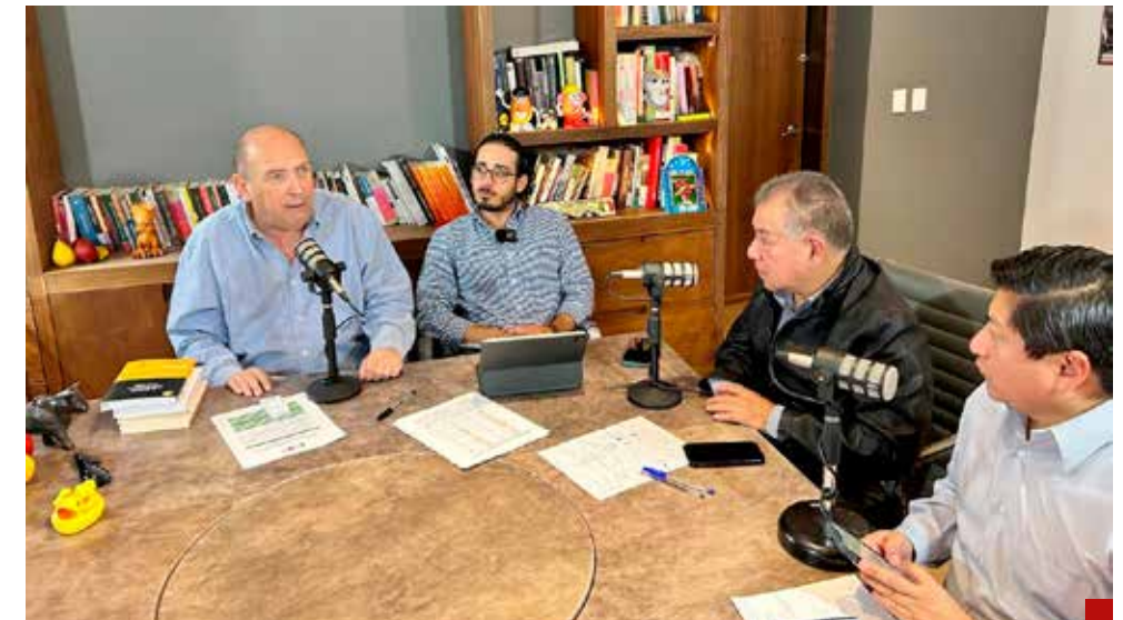
Insisten en la necesidad de crear una comisión especial para liquidar el Fobaproa.

de los ingresos de los bancos son por comisiones bancarias y detalló que a veces hasta por pagar un crédito de manera anticipada se cobran comisiones.