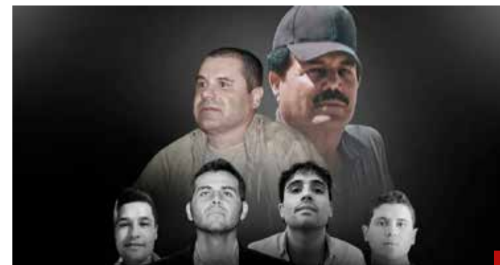
Había control de seguridad con el Mayo y los hijos del Chapo.

“Lo que tenemos que trabajar es prevenir que no sucedan estos eventos”, añade.