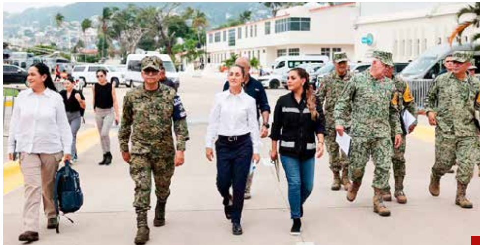
Inicia con el pie derecho su gestión como Presidenta.

Un detalle a resaltar de la Ejecutiva federal es que al término de sus Mañaneras tiene actividades, a diferencia de AMLO que en el transcurso del día no se sabía nada, salvo algún tuit o video que subía a sus redes.