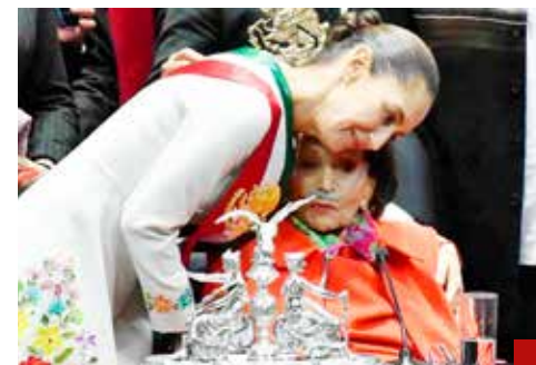
Entregó la banda presidencial a Claudia Sheinbaum Pardo.

> Sostiene encuentro el titular de la SSPC con el gobernador Rubén Rocha Moya para analizar la situación de seguridad en dicho estado