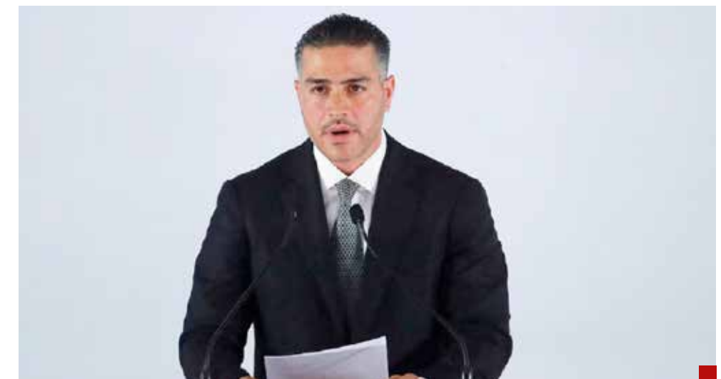
La seguridad es una responsabilidad compartida, reitera Omar García.

El reto es titánico, pero Omar García Harfuch tiene toda la capacidad y experiencia policial para lograr su cometido: Un México seguro.