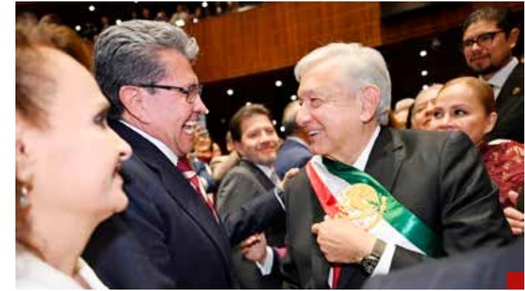
Pieza clave desde el Senado para el expresidente AMLO.

El doctor en derecho y exgobernador de Zacatecas ha sostenido, desde hace algunos años, que si se pretende una auténtica