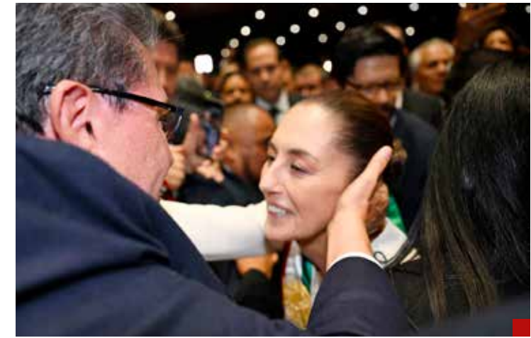
La Presidenta Sheinbaum está tranquila teniendo a Ricardo Monreal en la Cámara de Diputados.

y profunda transformación, se debe hacer "un análisis sustantivo y profundo del sistema de justicia como condición del Estado de Derecho", para lo cual será indispensable una renovación auténtica -aparte del Sistema de Justicia Penal- de la Fiscalía General de la República y del Poder Judicial de la Federación.