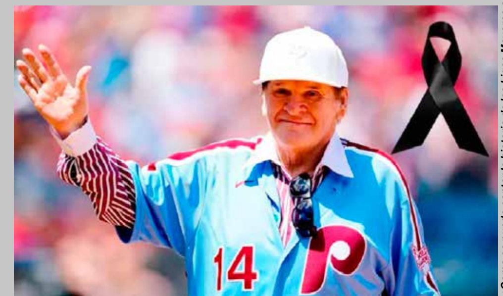
¿Como se puede contar la historia de las Ligas Mayores sin Pete Rose?

¿Como se puede contar la historia de las Ligas Mayores sin Pete Rose? Un jugador que más allá de todos sus logros en el diamante, cumplió el sueño de todo niño que quiere llegar a las mayores, jugar con el