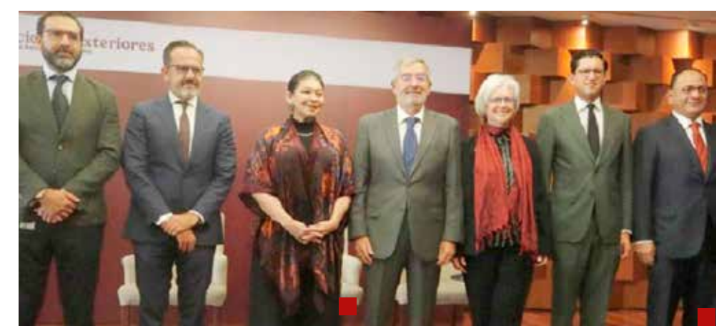
A enfrentar los retos de manera exitosa.

Su ratificación es lo menos que se merece, pues fue logrado gracias a su trabajo y desempeño durante la gestión de AMLO y estando como titular en la SRE Marcelo Ebrard Casaubón. Honor a quien honor merece.