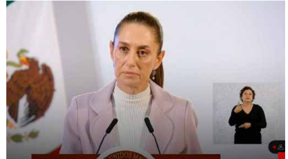
El megapoder legislativo pone en riesgo a Claudia Sheinbaum Pardo.

En tribuna Adán Augusto explicó que "las