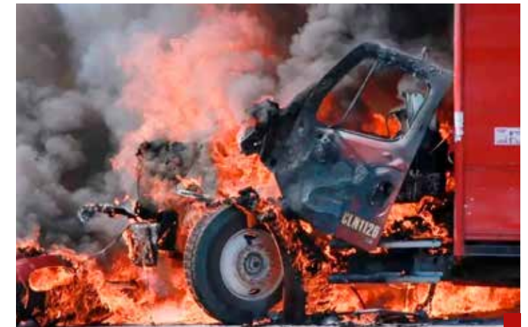
La ola de violencia sigue imparable en Sinaloa.