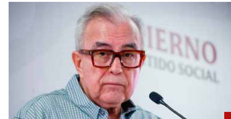
Una sarta de mentiras en la que el personaje principal es el gobernador Rubén Rocha Moya.