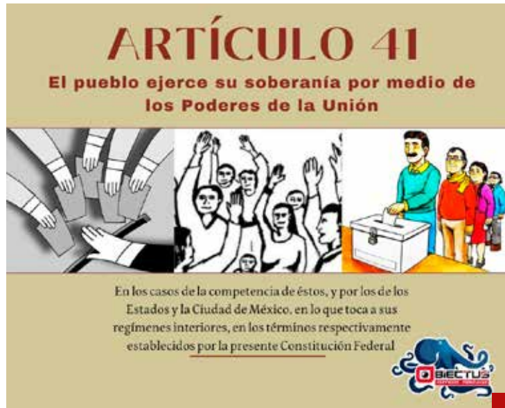
Está establecido que “el pueblo ejerce su soberanía por medio de los Poderes de la Unión”.

nos, armonizados con los criterios internacionales en dicha materia, al tiempo que no se trastoquen los principios fundamentales de la división y equilibrio de Poderes de una república federal, representativa y democrática, como lo establece nuestra Carta Magna en su artículo 40. La “República”