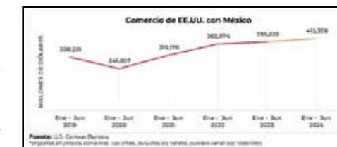
El valor del comercio total de bienes entre EU y México fue de 415 mil 378 millones de dólares.