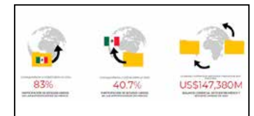
México muestra un superávit comercial.