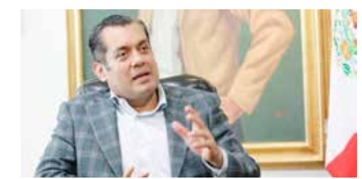
Condenan la actuación unilateral e ilegal del presidente de la Cámara de Diputados, Sergio Gutiérrez Luna.