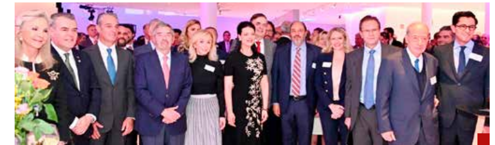
Se inicia el camino para una revisión exitosa del T-MEC.