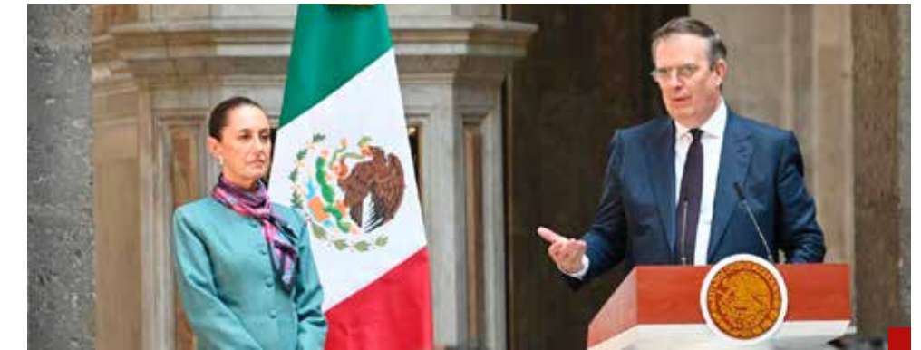
La Presidenta Sheinbaum y el secretario de Economía confirman que México es el lugar ideal para las inversiones.