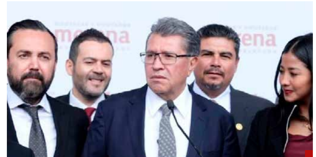
Ricardo Monreal controla la Cámara de Diputados

reformas a la Constitución son la expresión soberana más alta del pueblo de México" y agregó que las mismas son "una decisión política colectiva, revestida de una dignidad democrática especial".