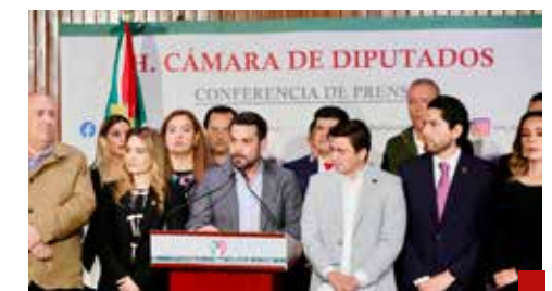
Presentarán un Presupuesto alterno.

En tanto, Rubén Moreira pidió a Morena y a sus aliados que en la discusión del Presupuesto de Egresos 2025 incluyan en el debate a la oposición para que conozcan sus propuestas, “pues queremos que se garanticen los recursos para carreteras, programas sociales, salud, educación y crecimiento económico”.