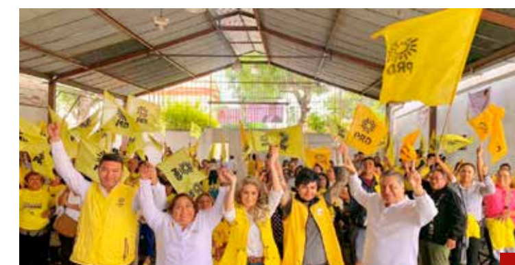
El PRD conserva su registro en la capital del país