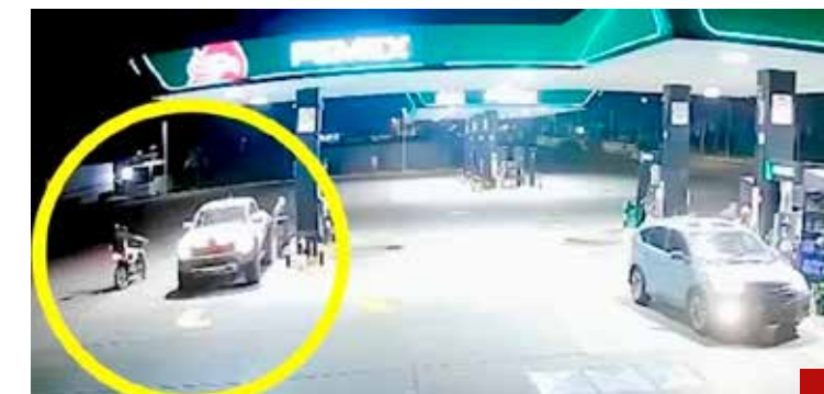
Falso el video de una gasolinera.