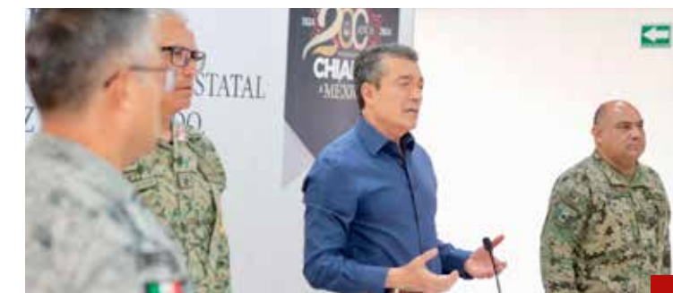
Para Rutilio Escandón no pasa nada en Chiapas.