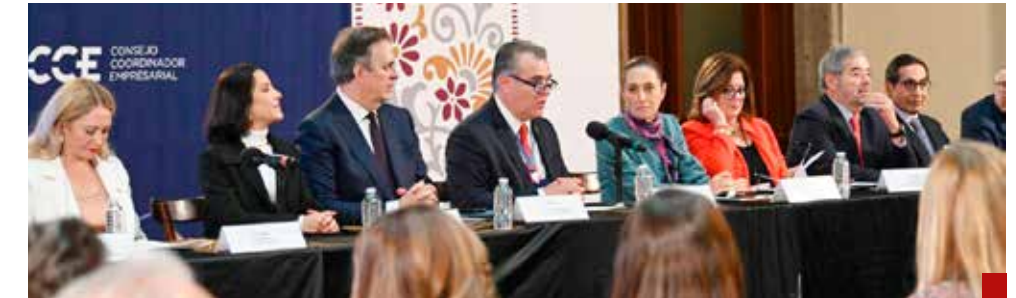
El CEO Dialogue reunió a hombres de negocios del Consejo Coordinador Empresarial y de la Cámara de Comercio de Estados Unidos.

Vale la pena destacar que, México se mantuvo como el principal proveedor de vehículos y autopartes, equipo mecánico, equipo médico; así como el segundo mayor proveedor de aparatos eléctricos, combustibles minerales y muebles.