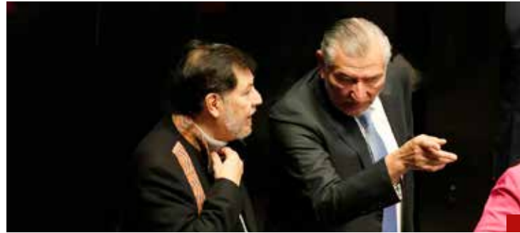
Adán Augusto López maneja a senadores morenistas.

La Constitución Política no será suprema por su carácter de norma fundante, sino que lo será en la medida que se sustente en elementos axiológicos que incidan en la vigencia y protección de los derechos huma-