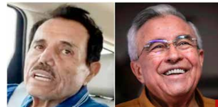
"El Mayo" Zambada puso al descubierto al gobernador Rocha Moya.

El gobernador de Sinaloa recordó que pidió al entonces presidente Andrés Manuel López Obrador y a la Presidenta Claudia Sheinbaum, que el caso lo atrajera la Fiscalía General de la República.