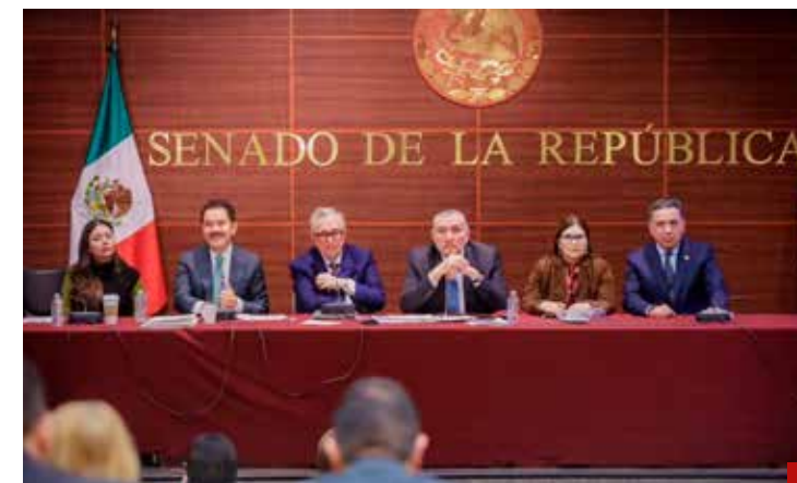
Rocha Moya rechaza renunciar al cargo.