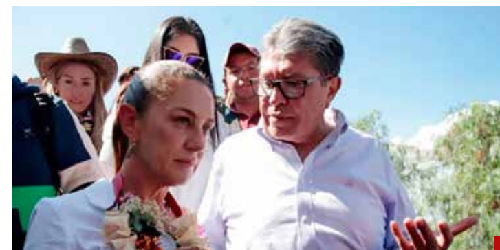
¿Permitirá la próxima presidenta que Monreal sea un riesgo para Morena?