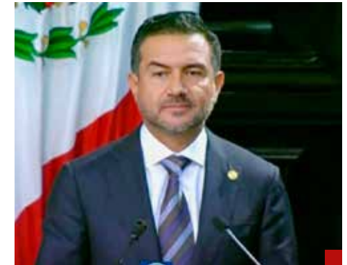
Se presentó el senador Miguel Ángel Yunes Márquez sin visos de estar enfermo.