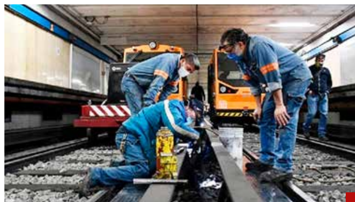
Trabajadores, un gran activo del Metro.