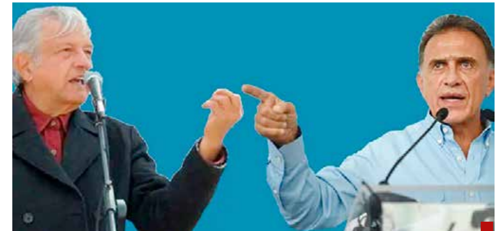
Y eso que era férreo enemigo del Presidente.