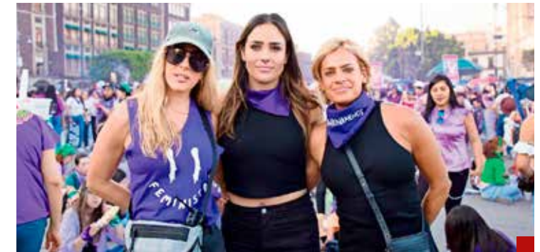
Se metieron con la mujer equivocada.