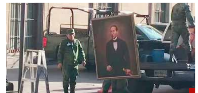
Casi terminada la mudanza hormiga en Palacio Nacional.