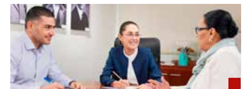
A revertir los malos resultados que deja el primer piso de la 4T.

El reto es titánico, pero Omar García Harfuch es un hombre de resultados y la lealtad es una de sus principales características: A México y a la próxima presidenta, Claudia Sheinbaum Pardo. Por algo goza del reconocimiento de propios y extraños, y seguramente el reto será otra misión cumplida en la trayectoria profesional del “Batman”. Al tiempo.