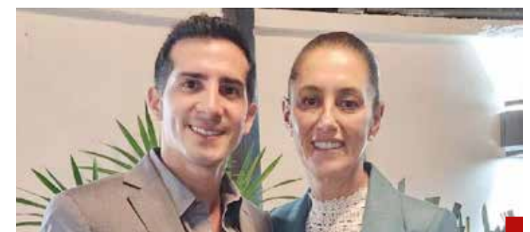
Claudia Sheinbaum reconoce a los deportistas acuáticos.