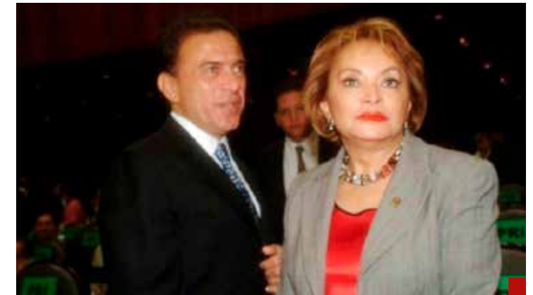
Elba Esther Gordillo, también traicionada por Miguel Yunes Linares.

Ya no son tantos los muebles y objetos que faltan por llevarse y puede usted estar seguro de que en la primera semana del mes de octubre el recinto servirá como morada de la primera mujer que fue elegida como Primera Mandataria... Quedan muy pocos espacios en el Gabinete Ampliado para quienes soñaban y se imaginaban que tendrían un lugar asegurado. Pero no es cuestión de plazas, sino del compromiso adquirido en su momento. Los oportunistas son los más decepcionados, aunque todavía tienen la esperanza de que los integrantes del gabinete los manden llamar. El desconsuelo y la frustración los domina, pero al final cada quien cosecha lo que siembra... Será el sereno, pero la violencia mantiene su permanencia en el estado de Sinaloa, La sociedad vive en la zozobra ante la indiferencia de las autoridades.