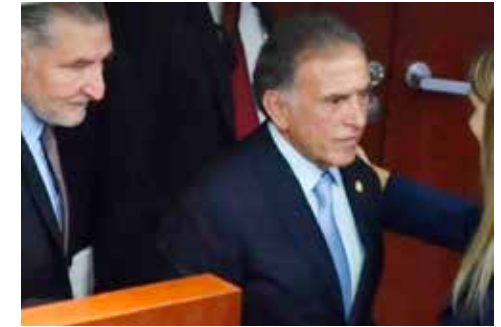
Morena tuvo grandes operadores políticos.