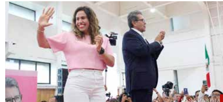
No quieren soltar "la joya de la corona" de la CDMX.

La pregunta que surge por las calles de la alcaldía Cuauhtémoc es: ¿Se respetará la voluntad popular o los vínculos de poder inclinarán la balanza? Falta poco para saberlo.