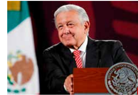
Se impuso el Presidente.

Queda demostrado que Marko Cortés, líder nacional del PAN, hace mucho daño a ese partido. A diferencia del PRI, donde los legisladores se mantuvieron firmes en su postura, donde no hubo traiciones, en Acción Nacional los fracasos van en aumento, es precisamente en ese instituto político, que se dice el más férreo enemigo del Presidente, donde se apoyó como nunca a Morena, a la 4T.