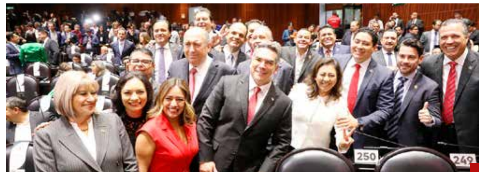
Acuerdan seguir dando la batalla por México.

Lo más importante, comentó, será no bajar los brazos y continuar dando la batalla por México.