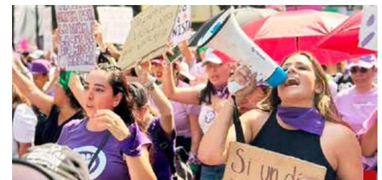
Feminista y activista, su sello personal.