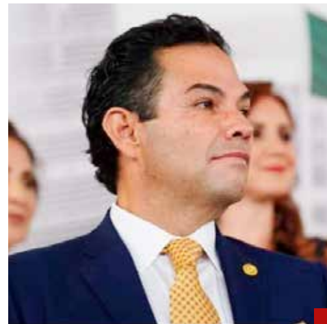
Vargas seguirá defendiendo el futuro de las próximas generaciones del país.

"Ya terminó su sexenio, que no perjudique más a México", advierte Vargas y refrenda su compromiso de continuar defendiendo el futuro de las próximas generaciones del país.