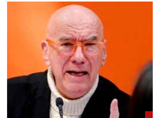
Nada se mueve sin la aprobación de Dante Delgado.