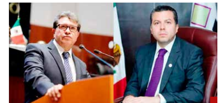
El compadre incómodo.