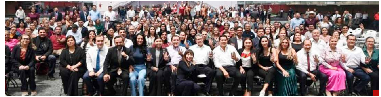
El primer paso ya está dado: Morena hace valer su mayoría y se aprobó en la Cámara de Diputados.