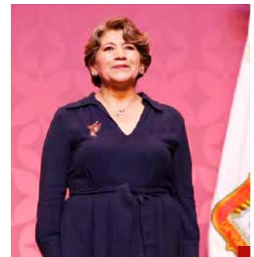
¿Qué presumirá Delfina Gómez en su primer informe de gobierno?