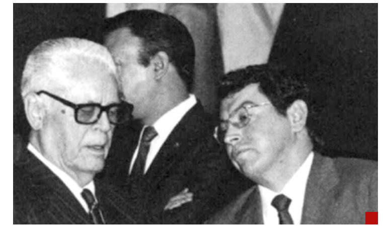
Fidel Velázquez Sánchez y Manuel Camacho Solís, grandes personajes del PRI.

En estos tiempos, como nunca, se ha recurrido a litigar en los juzgados algunos casos de elección popular. Con ese procedimiento solamente se deja en claro que la voluntad popular, sea del tinte político que sea, se menosprecia. En la ambición de ocupar cargos públicos, las decisiones de quienes acudieron a las urnas valen poco más que nada... En conflicto que escenifican los gobiernos de México y Estados Unidos (sumando a Canadá) hay lugar para preguntarse cuáles serán las repercusiones económicas y comerciales que se enfrenten más adelante. Porque no se trata sólo de una diferencia de opiniones de los embajadores, sino del posicionamiento gubernamental de las naciones. Son los dignatarios quienes designan o proponen a quienes asumen las funciones diplomáticas, no es por voluntad propia o por ocurrencia.