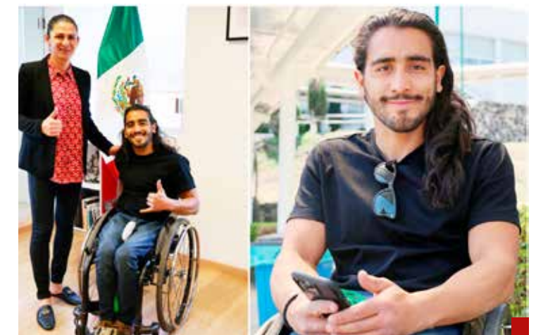
Nada descabellado que Ana Guevara se cuelgue las medallas de paraolímpicos.