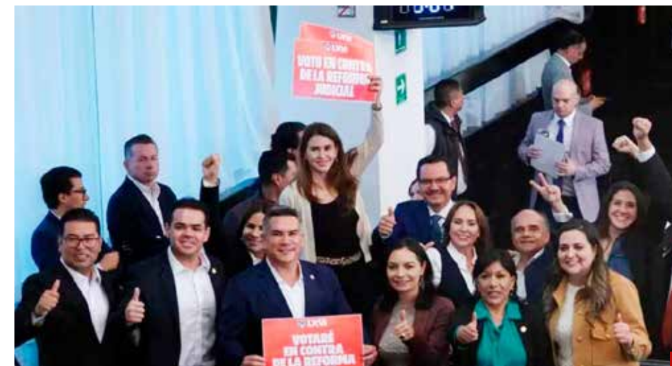
En la Cámara Alta los 43 resisten los cañonazos millonarios.