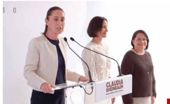
Claudia Sheinbaum enderezará el rumbo.