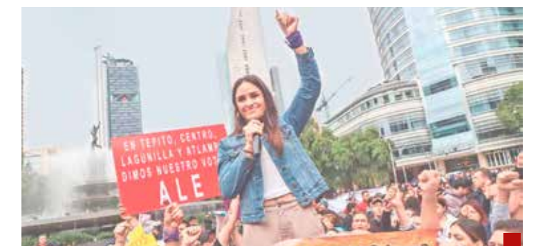
Todo indica que se revalidará el triunfo de Ale Rojo.