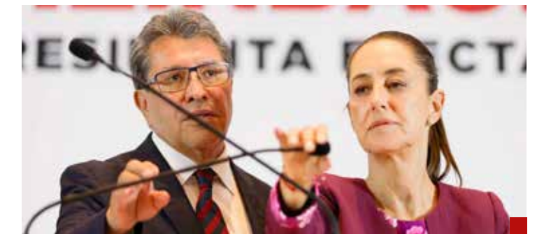
Una pugna añeja.

“Tenemos hasta el 30 de septiembre para seguirnos defendiendo legalmente porque el 1 de octubre vamos a estar tomando protesta. El tiempo es indefinido; puede respondernos en una semana, dos semanas o hasta tres semanas”, comentó al respecto.