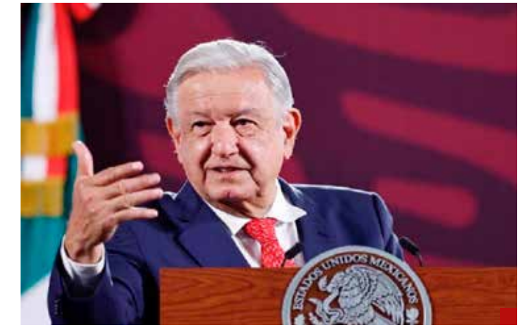
El Presidente pone freno a la tentación de gobiernos extranjeros de intervenir en la vida nacional.