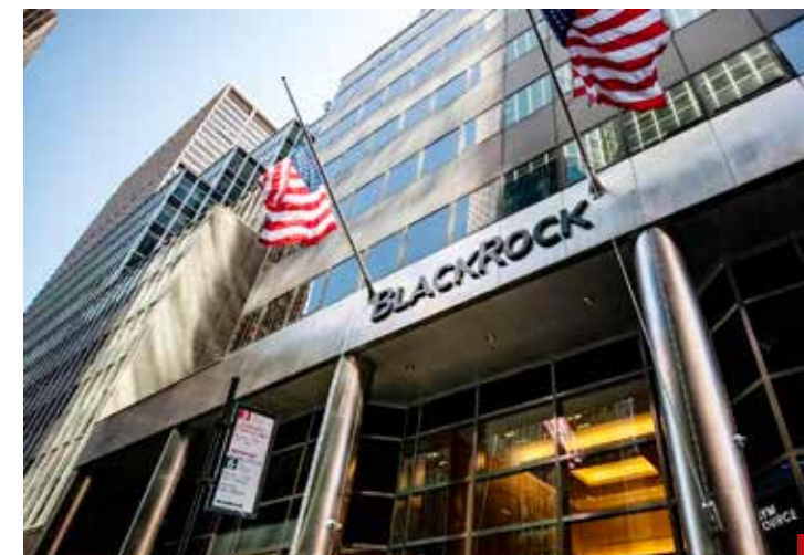
BlackRock no se anda con jueguitos.