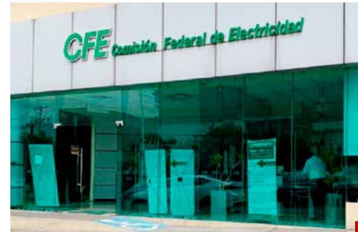
La demanda es millonaria, por casi 160 mdd.

El panel de árbitros que dictó un laudo el pasado 28 de mayo ya condenó a la CFE a pagar por los servicios recibidos entre 2019 y 2023 y a cumplir con el contrato hasta su finalización en 2033.