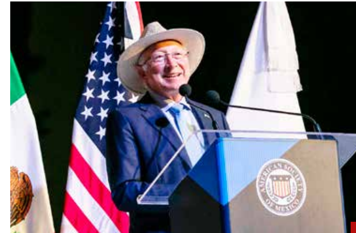
Ken Salazar advierte que elección popular de jueces es un riesgo para la democracia.

Otro rubro que merece especial atención es el nulo apoyo a las familias de los diversos municipios que han sufrido los estragos de las inundaciones. ¿Volverá a regañar a la población?, ¿la culpará de provocar las inundaciones, porque, según ella, tiran basura en la calle? Así es como se lava las manos.