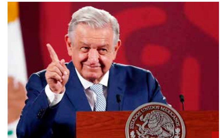
Ante los hechos, que quiere dejar incendiado el país.