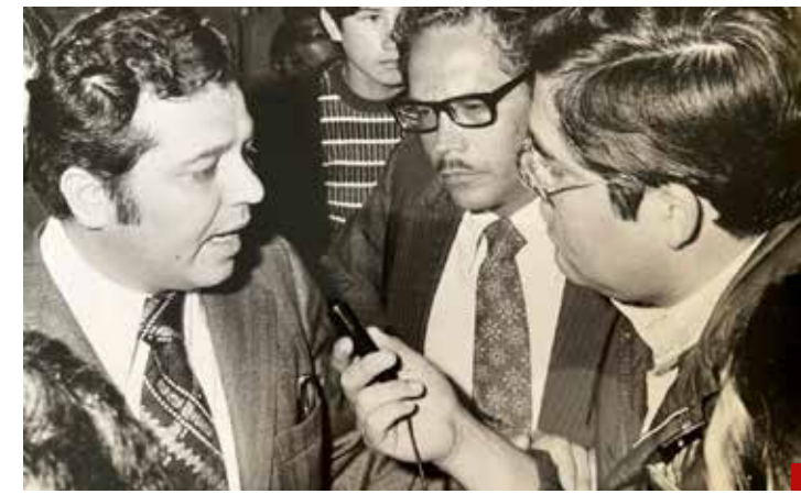
El partido tricolor tuvo ideólogos con estructura de estadistas como Lázaro Cárdenas del Río, Jesús Reyes Heróles o Porfirio Muñoz Ledo.

Que la Fiscalía General de Justicia del Estado de México haya ejercido acción