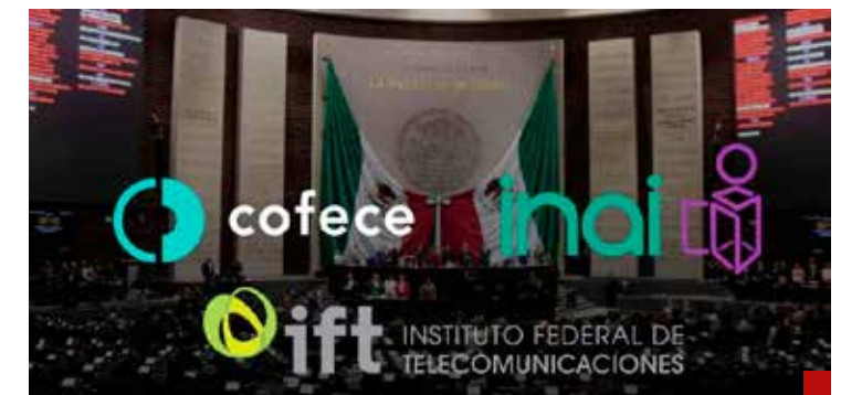
Desaparecerían el INAI, Cofece y el IFT.