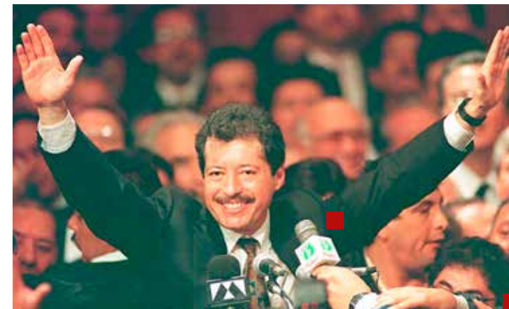
Que entre los críticos y adversarios de Alito hay personas involucradas o relacionadas con el asesinato de Luis Donald Colosio Murrieta.

legislador que tomará posesión en el próximo Congreso de la Unión... Sobran los que dicen que no hay cultura. Verá usted, lector. En días pasados volcó un camión, en el Arco Norte, lleno de aparatos eléctricos que fueron robados. Tiempo después, en otro sitio, se accidentó un camión de basura y nadie, pero nadie, participó en el saqueo. No es justo... Quedó descartado para convertirse en coordinador de los senadores de Morena, ya no es vocero de la doctora Sheinbaum, no será integrante del gabinete, pero Gerardo Fernández Noroña sigue en lo suyo: los escándalos. Sería imposible imaginarlo prudente. Total, lo de tirarse al piso para impedir el avance de vehículos de una comitiva presidencial es algo que ya nadie recuerda, ahora hay que esperar a ver qué protagoniza en la Cámara de Senadores, finalmente la estridencia es lo suyo... Al ser reformado el artículo segundo del decreto por el que se establece el calendario oficial de descansos obligatorios para los trabajadores, ahora será el día 1 de octubre cuando se realice la toma de posesión del nuevo Jefe(a) del Ejecutivo federal. El tradicional 1 de diciembre pasó a mejor vida. Y dejó de ser inhábil.