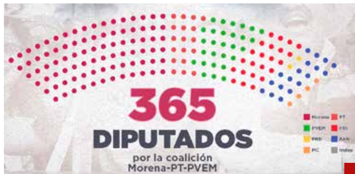
La trampa es el traslado que hace Morena de sus triunfos a sus aliados para así alcanzar la mayoría calificada artificial y ficticia.

mática, sino que va variando. (...) Lo que tienes que estar cuidando es que no exista esa sobrerrepresentación del 8%, pero habrá algún partido que tenga una sobrerrepresentación hasta del 8%, otros del 7, del 6, o de menos 1, menos 2, hasta menos 8, que es el rango que la Constitución permite”, añade.