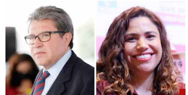
Quieren ganar en la mesa.