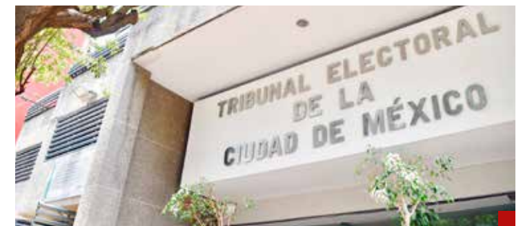
El TECDMX volvió a incurrir en la falta de fundamentación y motivación.

Sala Regional actúen de nueva cuenta apegados a la ley y exhiban a los magistrados del TECDMX, que de nueva cuenta su resolución carece de motivaciones y sustento.