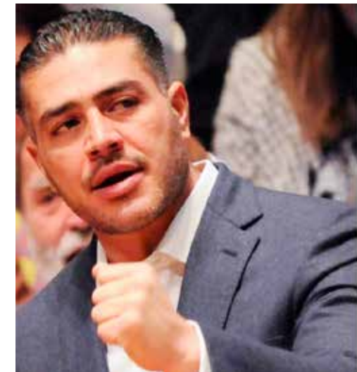
Omar García Harfuch recibe voto de confianza.

ta y no una pelea, siendo su gran activo el tener a su cargo el Centro Nacional de Inteligencia, el cual tiene el presupuesto más alto de América Latina.