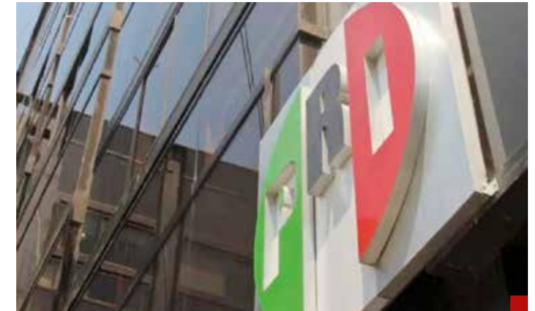
El partido tricolor vive conflictos, deserciones, renunciaciones, expulsiones y repulsiones.