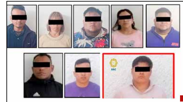
El Cártel de Tláhuac, debilitado.

de 'El Ojos', ocurrida el 18 de mayo de 2024.