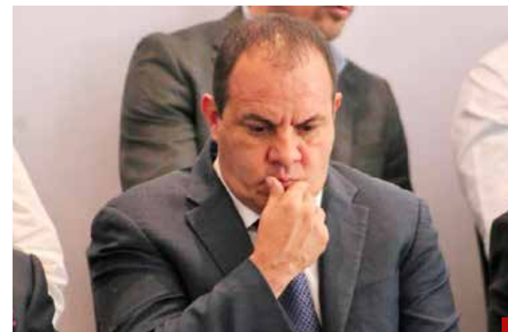
Sospechoso el silencio en que vive Cuauhtémoc Blanco.