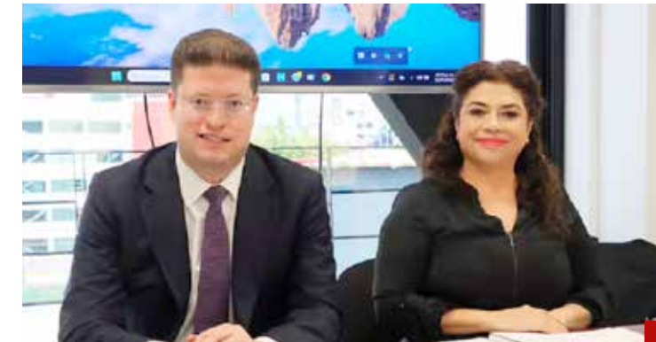
Seguirá en el cargo por los próximos 6 años.

Otra de las detenciones más relevantes en relación al Cártel de Tláhuac fue la Kevin 'N', hijo