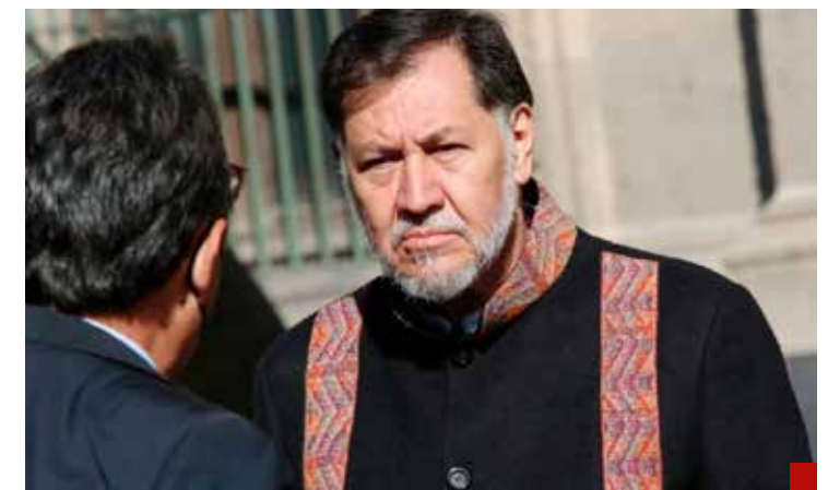
Hay que esperar a ver qué protagoniza Fernández Noroña en la Cámara de Senadores.