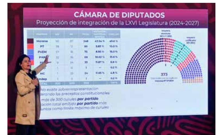
La Secretaría de Gobernación presiona al INE.