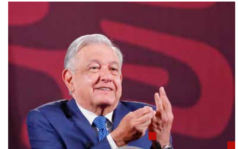
AMLO quiere hacer realidad sus reformas constitucionales propuestas desde febrero de 2024.

Desde 1996, la Constitución Política, en su Artículo 54, fracción V, establece: "En ningún caso un partido político podrá contar con un número de diputados por ambos principios que representen un porcentaje del total de la Cámara que exceda en ocho puntos a su porcentaje de votación nacional emitida".