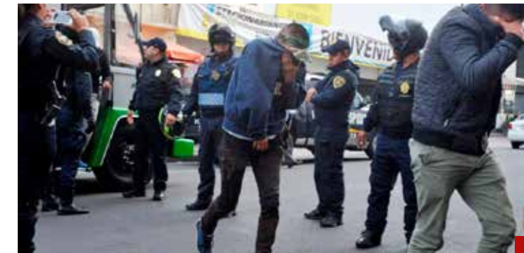
El fenómeno delictivo de la Ciudad de México está contenido.