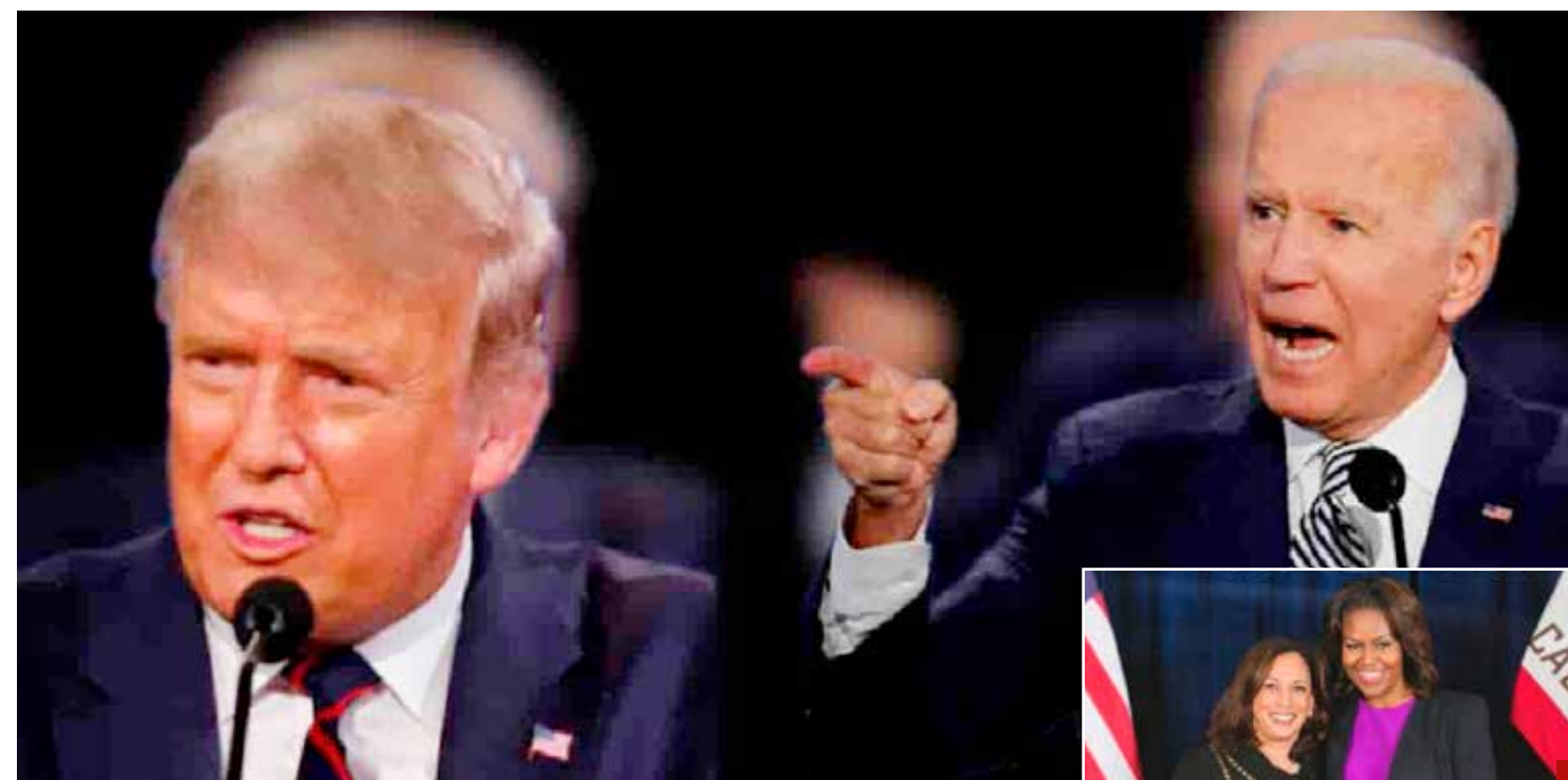
Michelle Obama y Kamala Harris, el plan B de los demócratas.

* Sobre ruedas los gobiernos azteca y estadounidense