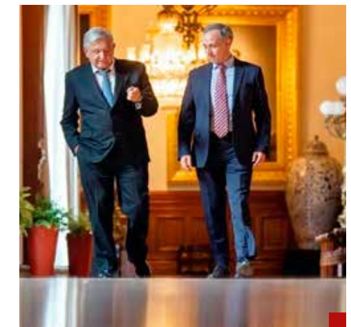
El Presidente lo hizo intocable.