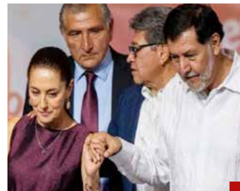
Le buscarán acomodo.

"Para ser más claro, siempre digo lo que pienso mi pecho no es bodega, el PT propuso a Noroña y el Verde a Velasco y el acuerdo original tenía que ver con los que participaban en el movimiento Morena para aclararlo bien", aseveró.