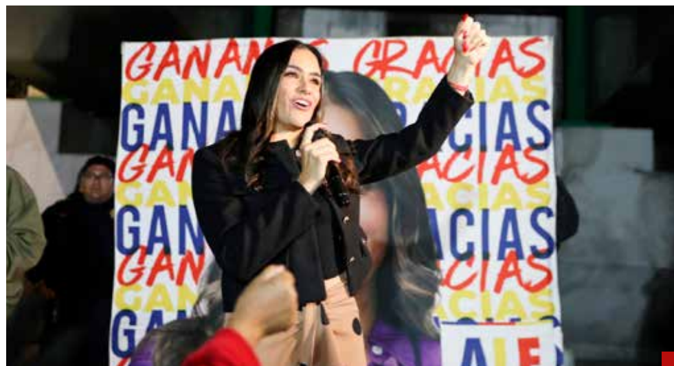
Reitera su compromiso: Combatir la corrupción y la extorsión.

> Declaración del presidente electo de Tlalnepantla, Estado de México