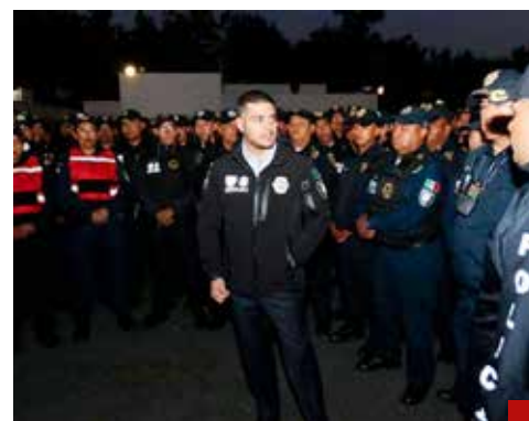
El candidato ideal para la SSPC.

Es licenciado en Derecho y Seguridad Pública por la Universidad Continental, y licenciado en