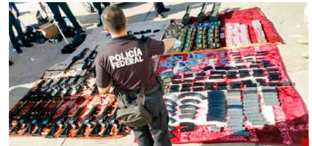
El contrabando es una actividad ilegal que impacta en la economía de manera letal.

Incomprensible el enredo jurídico que se ha tejido en el caso del colega Arturo Zárate Vite, a quien luego de ser exonerado se vuelve a torcer la ley para incriminarlo. Y como esas, hay muchas, Manlio Fabio Beltrones se perfila como coordinador de la bancada del PRI (Partido Revolucionario Institucional) en la Cámara de Senadores. Haber sido líder del Senado, de la Cámara de Diputados, gobernador del estado de Sonora y dirigente nacional priista, lo avalan.