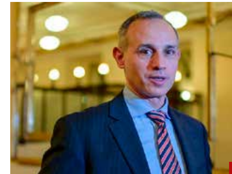
Políticamente está debilitado.

No obstante, la serie de pruebas de que el exsubsecretario de Salud tuvo un mal desempeño frente a la pandemia, ha sido protegido con el manto de la impunidad, no se ha tomado en cuenta el dolor de los miles de personas que perdieron a sus familiares, simplemente no hay empatía, se ha desestimado el caso y se ha privilegiado la impunidad.