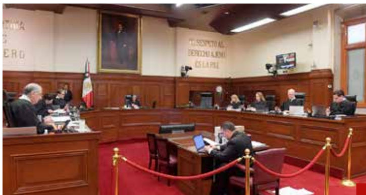
La SCJN enfrentó un proceso de impugnación.