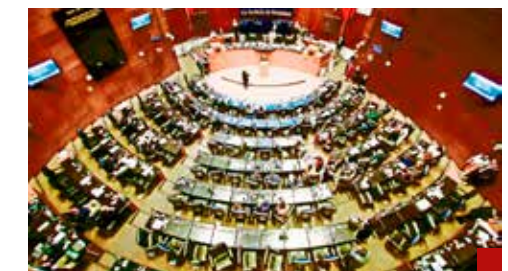
El partido oficialista trata de inflar su porcentaje.

“Magistradas y magistrados, consejeros del INE, es muy importante que asuman su responsabilidad y que pongan alto a este fraude a la ley”, insistió.