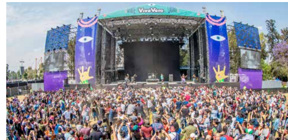
En plena pandemia se permitió realizar el Vive Latino.