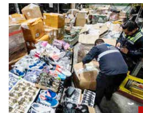
La piratería es otro cáncer que vulnera la economía nacional en diversas áreas.