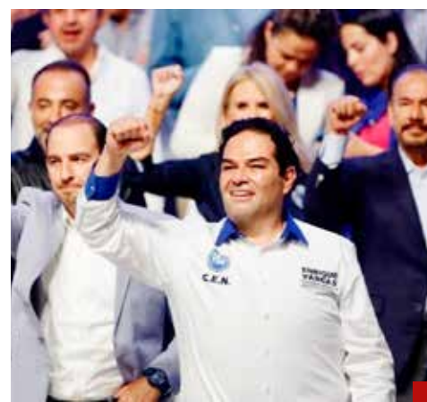
Somos la primera fuerza de oposición y lo haremos valer por México, expresa Enrique Vargas.

“Desde la oposición acompañaremos todo lo que sea positivo para el país”, reiteró, al dar a conocer que, desde la Cámara Alta, el PAN impulsará iniciativas en mate-