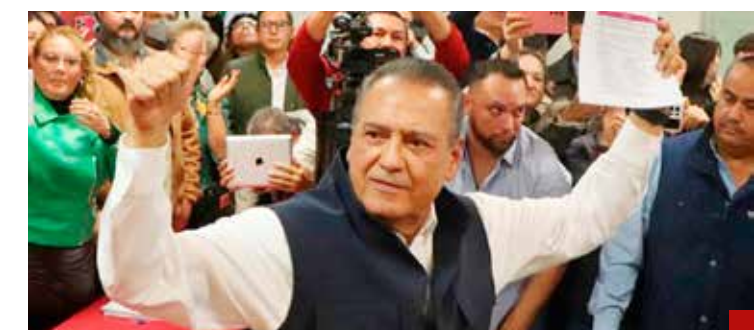
Manlio Fabio Beltrones, con toda la experiencia para encabezar a los senadores priistas.