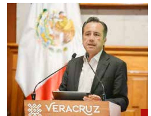
Cuitláhuac García Jiménez, bien tranquilito, ni sufre ni se acongoja.