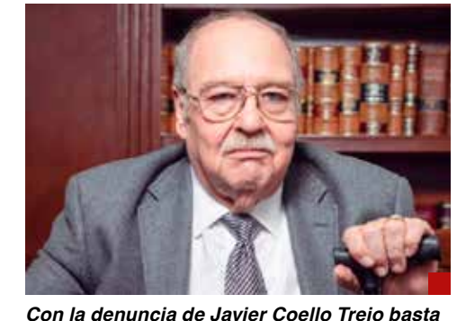
Con la denuncia de Javier Coello Trejo basta para llevar a López-Gatell a los tribunales.