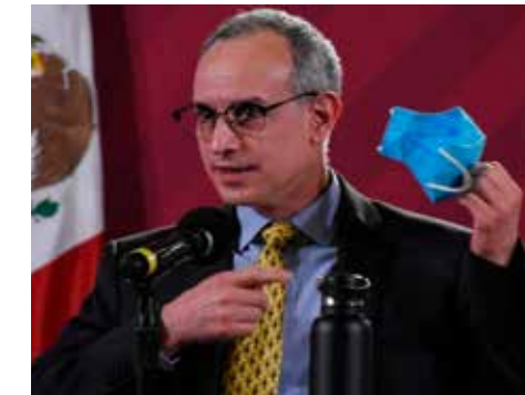
López-Gatell negó el uso de las mascarillas.