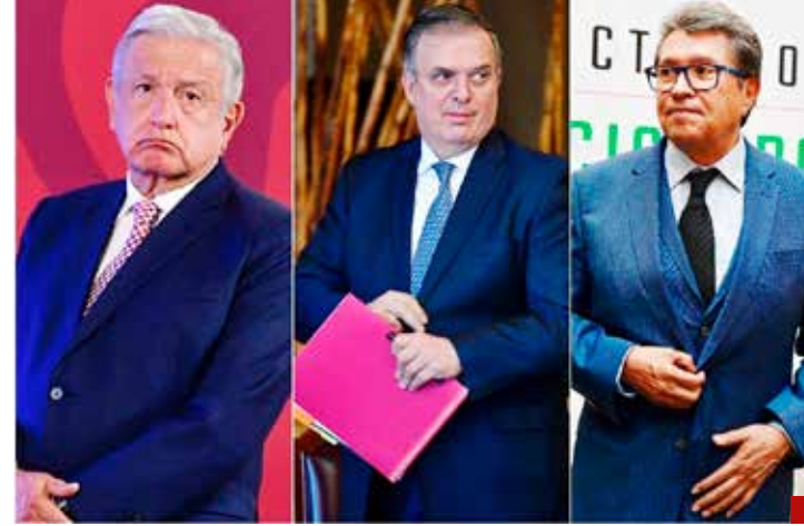
Morena es el viejo PRI... por eso quieren revivir los viejos tiempos del pasado.

Surge el "deja-Vu" de un nuevo "estilo personal de gobernar" del Presidente -en palabras de Cossío Villegas-. O podríamos estar frente a una "presidencia" hereditaria o la "dictadura perfecta", como la definió Vargas Llosa. Para algunos, razón de estabilidad política y de paz social. Para otros, motivo de preocupación.