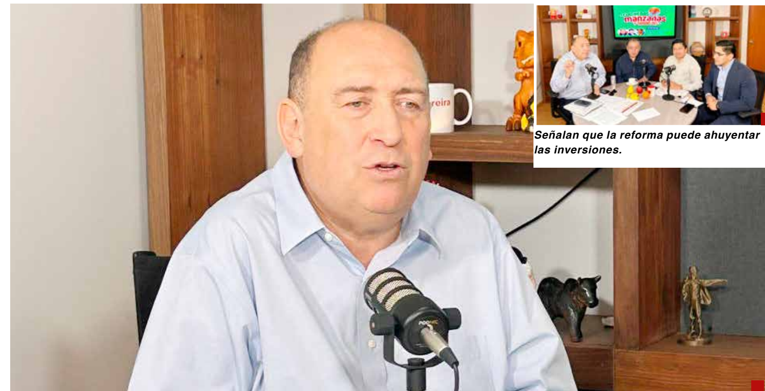
Señalan que la reforma puede ahuyentar las inversiones.

La iniciativa presidencial no nace para mejorar el sistema de justicia, expresa el diputado federal