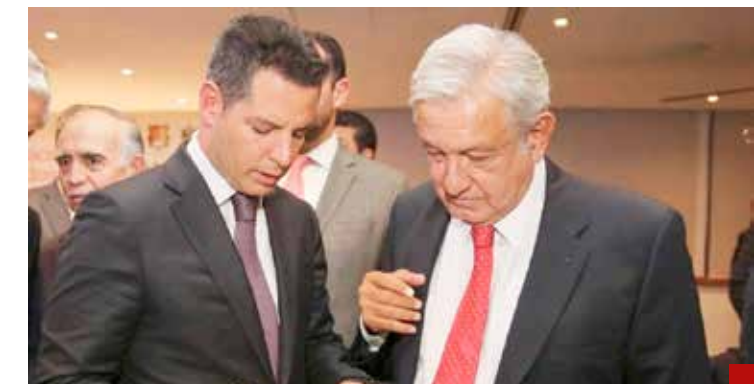
Alejandro Murat espera recompensa por sus favores ofrecidos.