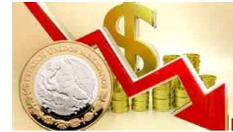
México está en la incertidumbre.

Pero eso no significa que estén dispuestos