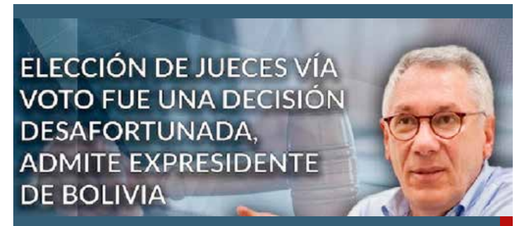
En Bolivia no hallan cómo anular la designación de jueces por votación popular.

Ellos queriendo salir y acá otros neceando en que nos va a salir bien, esperando contra toda esperanza.