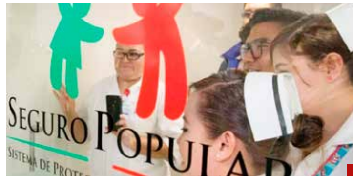
Destruyeron el Seguro Popular para sustituirlo por el inexistente y fracasado Insabi... ¿Desean lo mismo para el Poder Judicial?

Si se continúa con la "Transformación" con el sello obradorista, estaremos en la antesala del presidencialismo de los mejores años del PRI en los 70s y 80s, con los Poderes Legislativo y Judicial acotados a modo y a su "servicio", cuando no existían los organismos autónomos.