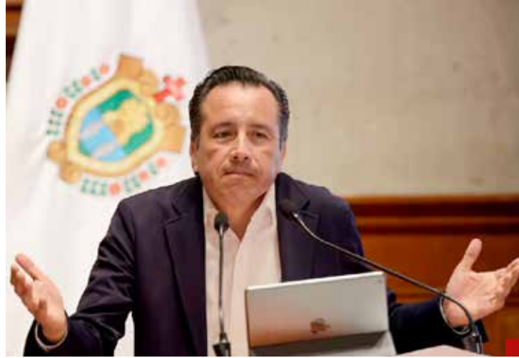
Cuitláhuac García en Veracruz, escándalo de corrupción.

Será que en el subconsciente nacional, expresado el pasado 2 de