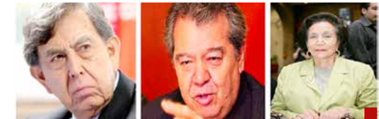
Grandes personajes en el PRD: Cuauhtémoc Cárdenas, Porfirio Muñoz Ledo e Ifigenia Martínez.