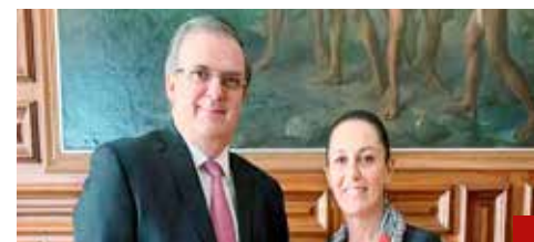
Ni bien toma posesión y ya tiene encomiendas Marcelo Ebrard.

Aseguró que es por esa razón que actualmente está en su equipo, y que si no hubiera habido un escrito no lo habría aceptado