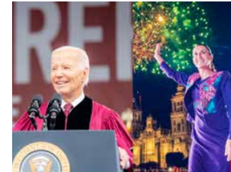
¿De veras doña Sheinbaum estará dispuesta a subirse al ring contra el Tío Sam?

a seguir otros seis años tolerando arranques de populismo tropical, de ninguna manera.