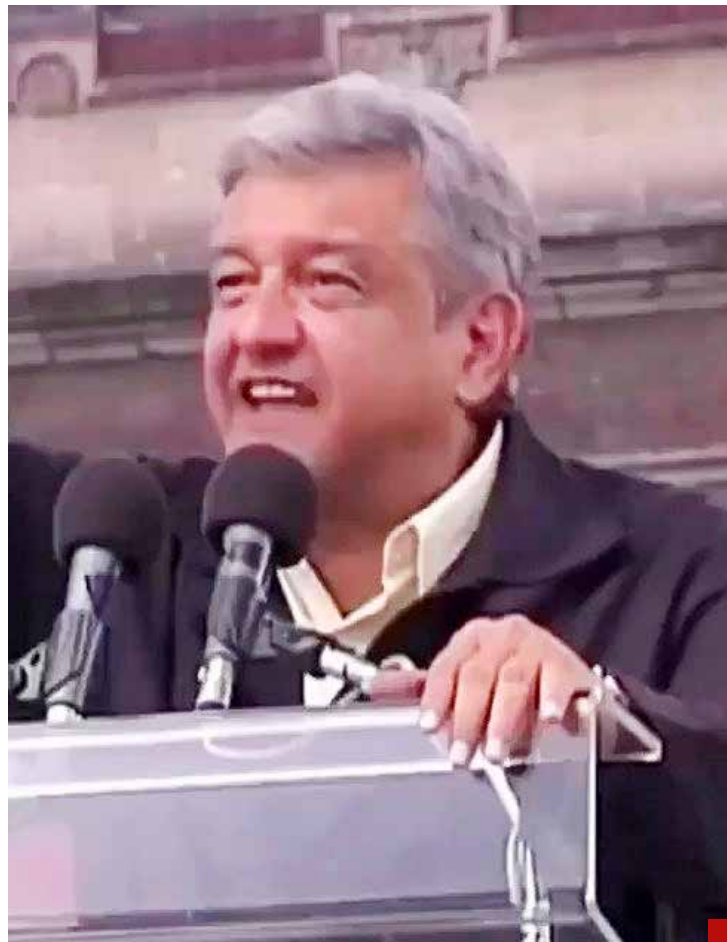
El Presidente lo vaticinó el 6 de septiembre de 2006: "¡Al diablo con sus instituciones!".

junio, subyace una especie de fijación por la adoración al Tlatoani de nuestras culturas prehispánicas... ¿Será que el colectivo nacional ya extraña al partidazo y sus poderosos presidentes (tlatonanis)?