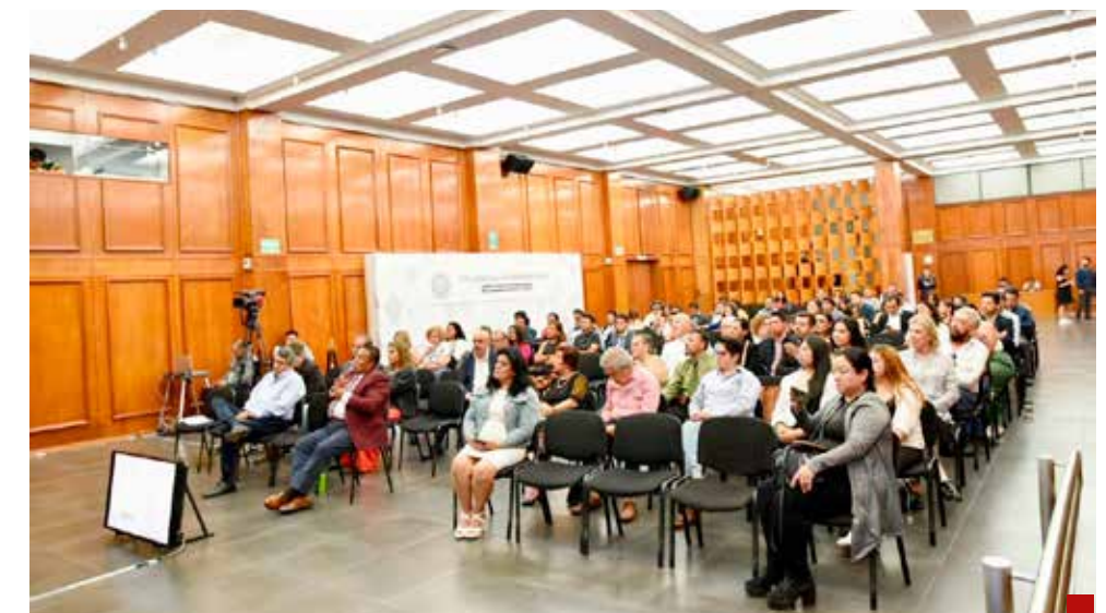
La normatividad contiene los derechos, obligaciones y registro de las OSC.