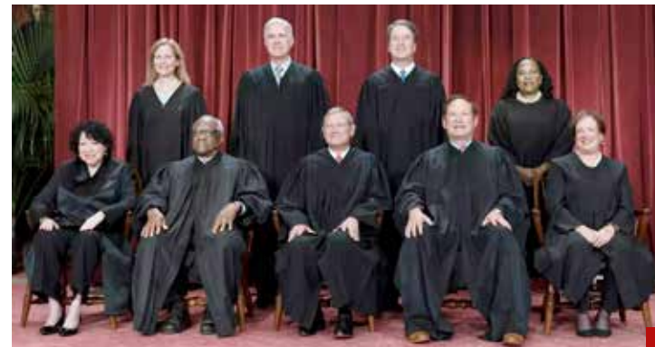
En EU los requisitos para ser candidatos a jueces son muy amplios y estrictos.