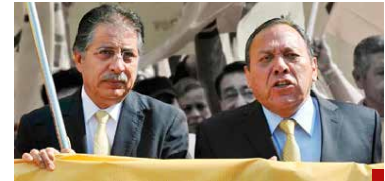
Al partido amarillo lo desdibujaron la ambición y la avaricia de dirigentes.

Luego de la gabinetitis que se apoderó del país, finalmente se acaban las especulaciones y habrá que ajustarse a la realidad.