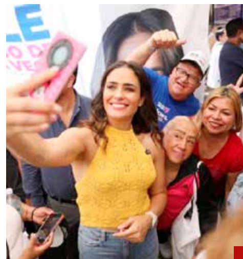
Con Ale Rojo llegó a la Cuauhtémoc un cambio de verdad.

todos los puntos de vista”, expresa la próxima alcaldesa de la Cuauhtémoc.