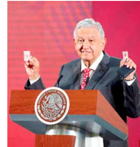
AMLO ha dado muestra de su gran irresponsabilidad.