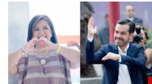
¿Alguien declinará por el mejor posicionado?