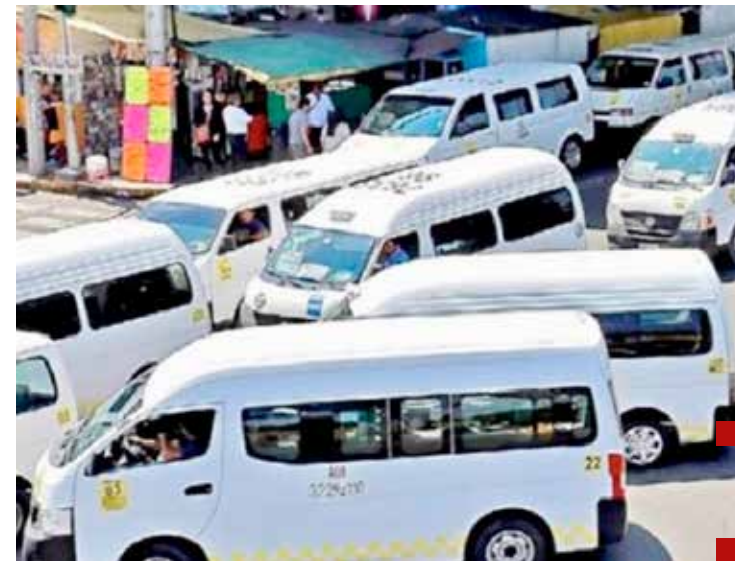
El servicio público no debe ser una fuente de corrupción y enriquecimiento.

su participación y clausura del foro temático "Reactivación Económica y Generación de Empleo".