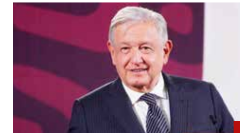
Nunca gobernó para todos.

Después de Toluca, la tercera etapa eliminatoria se celebrará en la Ciudad de México en el mes de julio, y la cuarta en septiembre en Pachuca, en esta última sede también se llevará a cabo el Repechaje y las finales del Torneo de los Campeones.