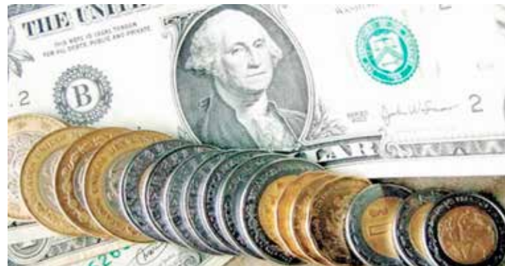
Se tiene un peso fortalecido ante el dólar estadounidense.