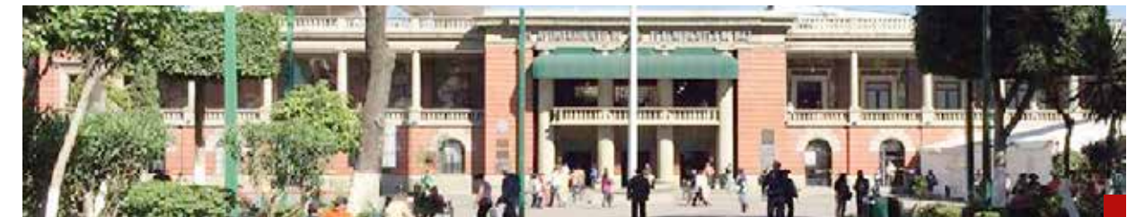
Tlalnepantla debe ser un lugar seguro, sustentable e incluyente.

Este flagelo, dijo, es un factor negativo que se opone a la inversión, porque mientras haya inseguridad no habrá certeza para la inversión. Por ende, debemos trabajar conjuntamente con los empresarios, la Guardia Nacional, la Policía Estatal y, por supuesto, con las fiscalías.