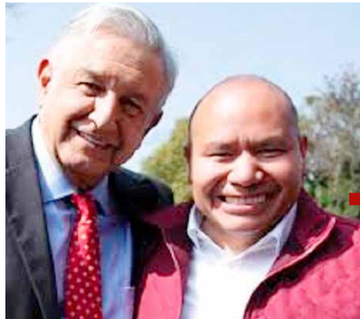
Estos seis años han sentado las bases para un país más equitativo, justo y próspero.

Apuntó que ve con preocupación un enorme retroceso, ya que Tlalnepantla ha perdido competitividad por culpa de la actual administración pública, cuando él, como alcalde en el periodo 2019-2021, hizo un gran esfuerzo para sentar las bases para colocar a Tlalnepantla en el lugar que debe estar desde hace mucho tiempo: un lugar seguro, sustentable e incluyente.