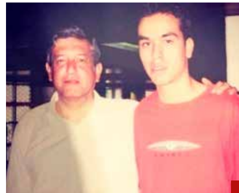
Al igual que el Presidente de la República, Álvarez Máynez también tiene su historia priista.