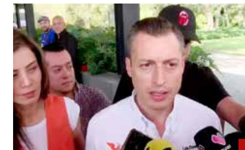
Tenemos un gobierno federal que se ha dedicado más a la venganza que a la justicia: Luis Donaldo Colosio Riojas.