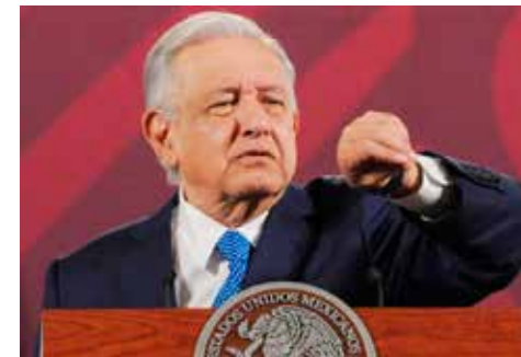
Concentrar el poder en una sola persona es riesgoso para la democracia del país.