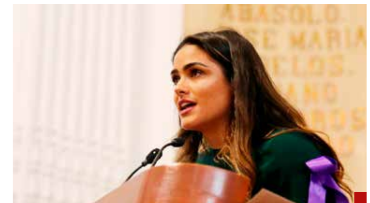
Impulsora de la “Ley Olimpia”.

7.- Impulsar un festival anual destacando el talento local, convirtiendo a la alcaldía en un escaparate vibrante de nuestra cultura y creatividad. -Destinar fondos mediante iniciativas sociales para impulsar y celebrar el talento local, fomentando el desarrollo artístico y cultural en la comunidad-.