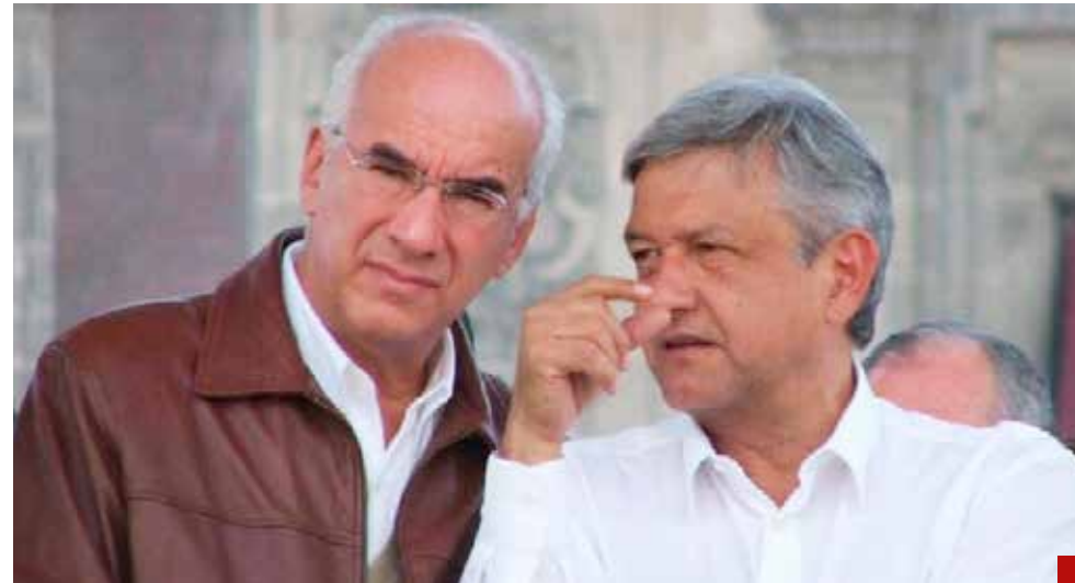
Dividir a la oposición, ¿una velada alianza con su viejo socio político?