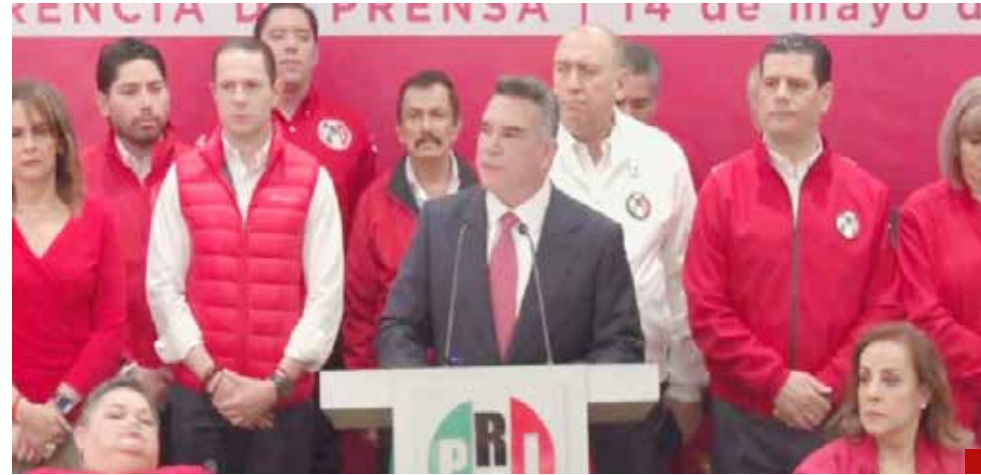
Alito renuncia a intereses personales y partidistas si declina Álvarez Máynez.

meza para convencer a los mexicanos de ser la mejor opción para encabezar los esfuerzos de 130 millones mexicanos que quieren ver un México próspero, justo, democrático, en el que se respete la libertad, la Constitución, la división de Poderes, el federalismo y los organismos autónomos constitucionales.