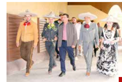
El alcalde de Toluca resaltó la importancia de la charrería en la identidad cultural y las tradiciones de los mexicanos.