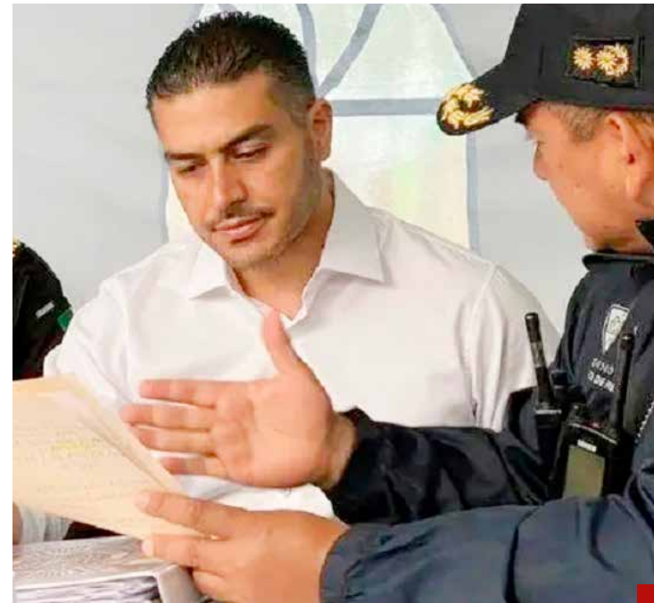
'Batman' revela sus planes de trabajo.

Las encuestas y la preferencia ciudadana indican que 'Batman' llegará a la Cámara Alta.