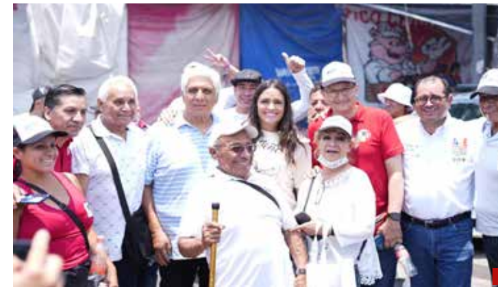
Mantiene cercanía con la ciudadanía.

6.- Otorgarle una vocación a las casas de cultura, buscando la profesionalización por zonas. Implementar un programa cultural enfocado en enriquecer y proteger a las primeras infancias y la tercera edad, asegurando que estas etapas de la vida reciban la atención y el cuidado prioritarios que merecen.