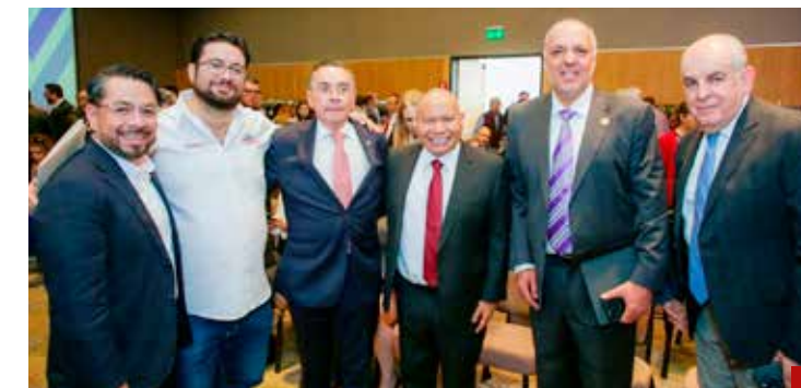
Tenemos que resolver dos urgentes problemas: Inseguridad y corrupción, advierte el abanderado de la coalición Sigamos Haciendo Historia por el Estado de México.