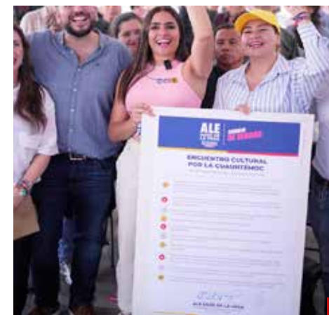
La cultura será una prioridad en su gestión.