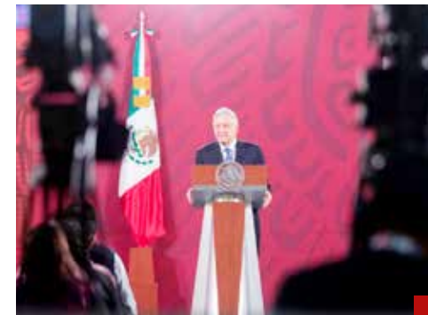
Hasta el 29 de mayo próximo habrá Mañanera, el último día que le permite por ley la veda electoral.