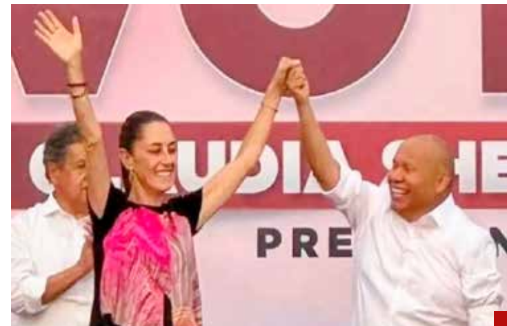
Con Sheinbaum están los anhelos y las esperanzas del pueblo mexicano.

Tenemos que ser aliados de las y los empresarios siempre; trabajar de la mano, justificó Raciél Pérez, porque Tlalnepantla es de los municipios con mucho futuro en este sector, sustentó en el marco de