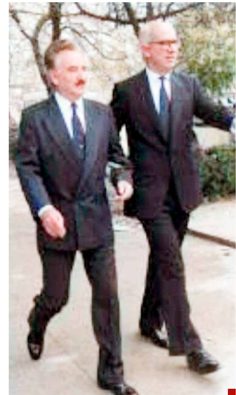
Dante Delgado, un viejo militante del PRI que fue subsecretario de Gobernación.

Cabe señalar que el método para elección de la candidata de "Fuerza y Corazón por México", Xóchitl Gálvez, quien logró un millón de firmas de ciudadanos y militantes